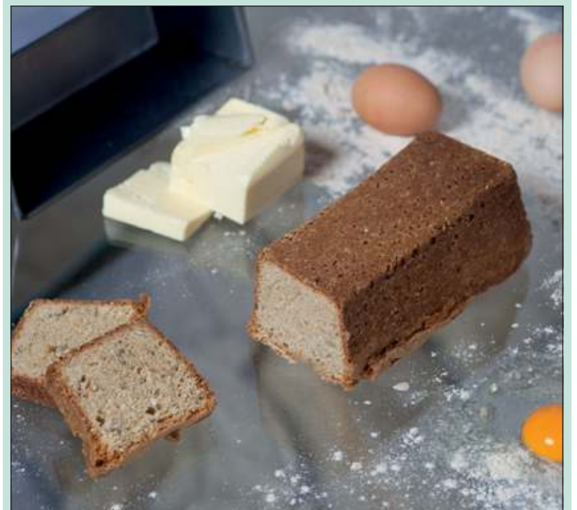
Speltcake oogt niet alleen fraai (op het snijvlak is duidelijk te zien dat het niet om een gewone cake gaat), maar smaakt ook nog eens bijzonder.