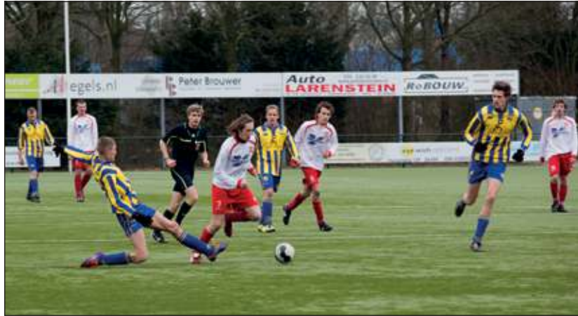
FC De Bilt op jacht.

Bunnik zette de ingezette zoektocht naar de gelijkmaker na rust niet door, terwijl De Bilt ook in de tweede helft