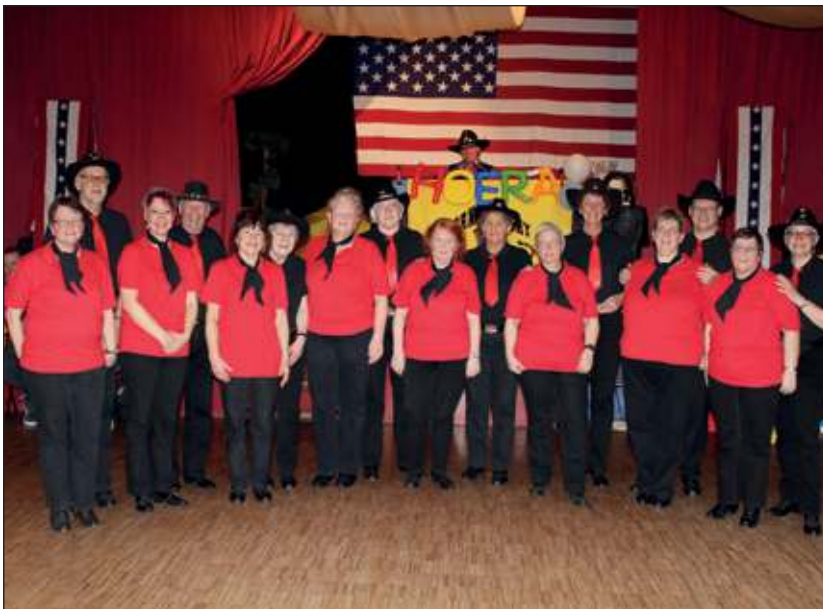
Het Born Country Couple Dance Formatie Team.

Voor lessen en/of info over de Line dancers van Born Country zie www.borncountry.eu of e-mail born.country@casema.nl . Zaterdag 23 maart is er de 10e 50+ Country Line Dance en Demonstratie Dag in De Vierstee van 10.00 tot 16.30 uur. Meer info via de mail.