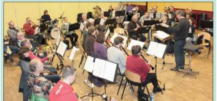
Vrijdag 22 februari jl. oefende de Harmonie Kunst & Genoegen weer met volle overtuiging

Als de raad het goed zal gaan vinden krijgt de gemeente straks zes koningslinden op een mooie plek met een fraai hek tot vreugde van Oranjegezinden