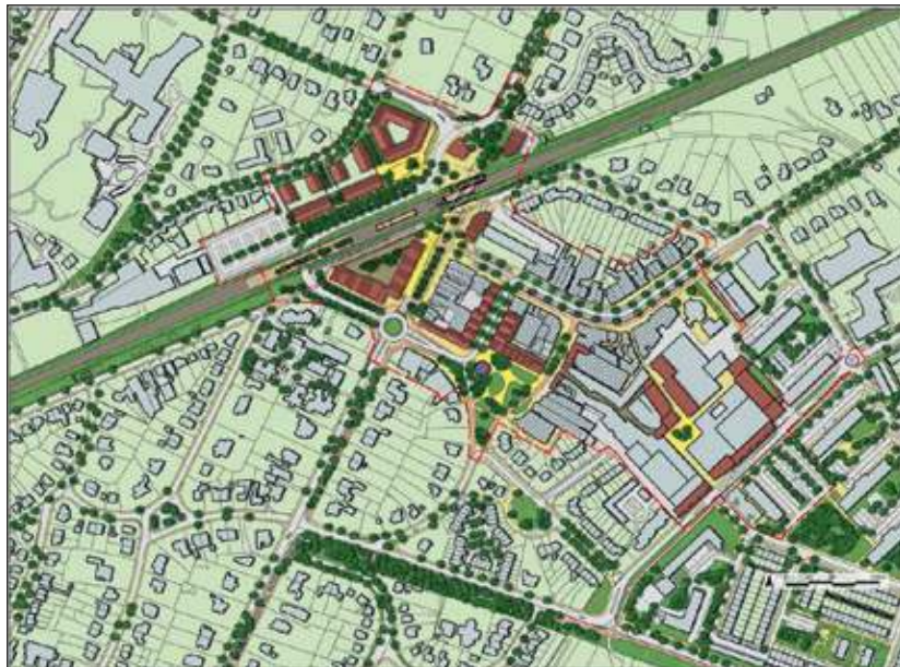
Kaart projectgebied Bilthoven centrum

Begin maart start Heijmans in opdracht van ProRail met de aanleg van een rotonde op de Soestdijkseweg ter hoogte van de Nachtegaallaan. Het werk wordt in twee fases uitgevoerd: eerst de westkant (Sporlaan) en daarna de oostkant (Nachtegaallaan). Van eind maart tot medio juni kan verkeer vanuit het noorden niet linksaf de Nachtegaallaan in richting centrum maar wordt omgeleid via de Boslaan / Koperwieklaan. Doorgaand verkeer vanuit het zuiden ondervindt geen hinder. Een aantal parkeerplaatsen op het Emmaplein en de Nachtegaallaan is tijdens de werkzaamheden niet beschikbaar. Ook voor het laden en lossen van winkels en horeca op het Emmaplein worden tijdelijke maatregelen voorbereid. Volgens planning is de rotonde en het gebied daaromheen op 11 juni klaar.