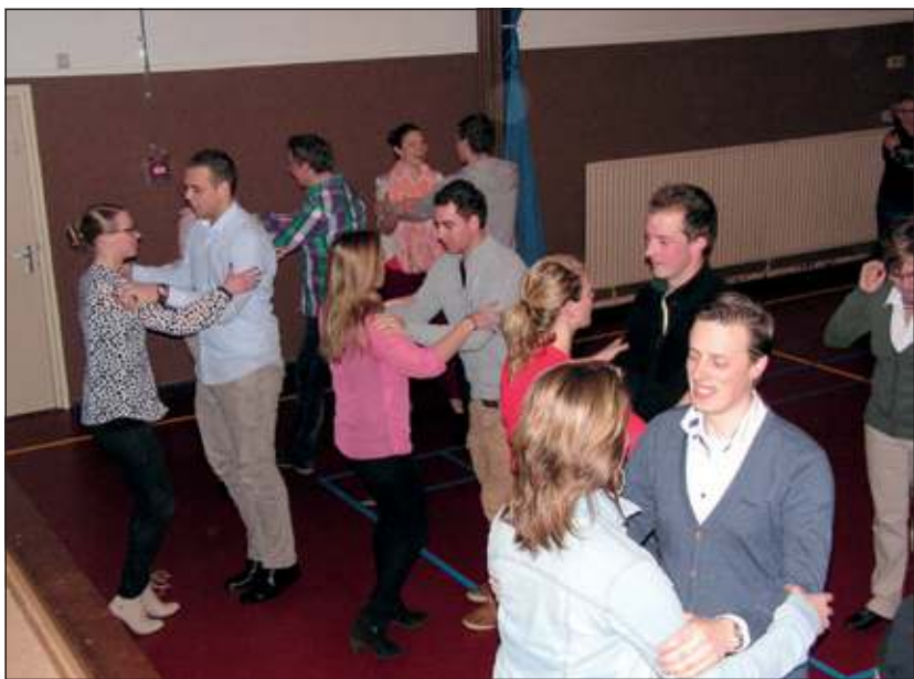
De eerste pasjes op de dansvloer.

En wie weet, zien we dan straks in de feesttent tijdens de Oranjefeesten eind april ook wel echt ballroomdansen. Op 1 juni is er in ieder geval een slotbal voor alle deelnemers.