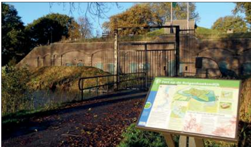
Staatsbosbeheer houdt een fotoworkshop op fort Ruigenhoek

Deze workshop heeft als doel om door middel van digitale fotografie op een andere manier naar de wereld om ons heen te kijken. De techniek is dus ondergeschikt. De workshop begint om 14.00 en duurt plm. tot 16.30 uur en het maximum aantal deelnemers is 20. De kosten zijn 10 euro voor deelnemers vanaf 12 jaar en 5 euro voor kinderen tot en met 12 jaar. Aanmelden is verplicht: www.groenehartcentrum.nl of 06 23774925 (tijdens kantooruren). Meer info: groenehartcentrum@staatsbosbeheer.nl