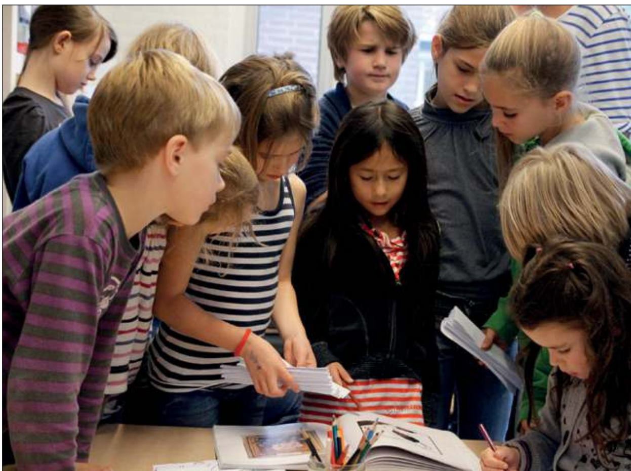
Woensdag 13 maart van half 9 tot half 1 geven de schooldirecteur, leidsters, maar ook kinderen aan belangstellenden een rondleiding en informatie over Montessori onderwijs en Montessori opvoeding.

doen mee. Ook is er in de aula de tentoonstelling te bewonderen van de musea met miniatuur kunstwerken die de kinderen hebben gemaakt. Meer info: 030 2280818.