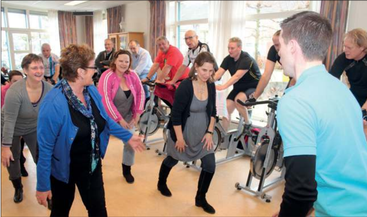
Fysio Fitness Visscher uit Groenekan verzorgde de apparatuur en cursussen bewegingstherapie.

Afgelopen zaterdag 2 maart trok De Open Dag ter gelegenheid van het vijftienjarig bestaan van en in Dijkstate Maartensdijk van 10.00 tot 14.00 uur veel bewoners en bezoekers want er was heel wat te beleven en te zien.