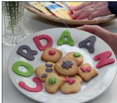
Door deelnemers van de Dagbesteding zelfgemaakte lekkernijen.

In twee aparte ruimten in het Wijk, Zorg en Dienstencentrum Dijkstate kunnen deze ouderen overdags terecht van maandag tot en met vrijdag.