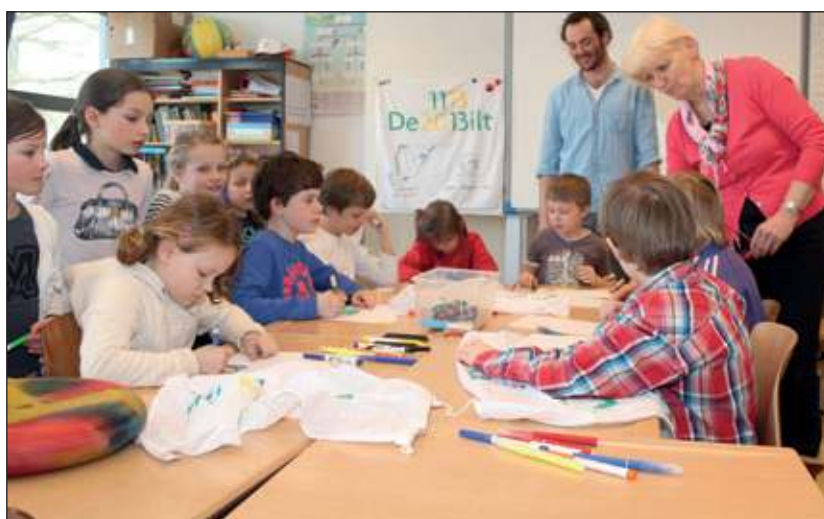
Meester en juf kijken belangstellend toe, wanneer onder schooltijd 'hun' kinderen 'hun' vlag versieren, zoals hier op de Bilthovense Julianaschool.

Dat De Bilt feest, heeft als reden dat het 900 jaar is geleden dat Mathilde hier was hef op haar dus het glas en toost op een roemrijk verleden