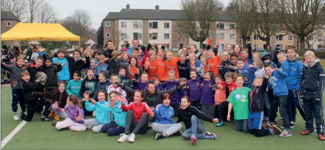
Alle deelnemers op het Cruyff Court veld aan de Buys Ballotweg in De Bilt.

Afgelopen woensdag 27 februari vond op het Cruyff Court veld aan de Buys Ballotweg in De Bilt de voorronde van Cruyff Courts Kampioenen plaats. De St. Theresiaschool werd winnaar bij het jongenstoernooi en de dames van de Julianaschool gingen er met de winst vandoor.