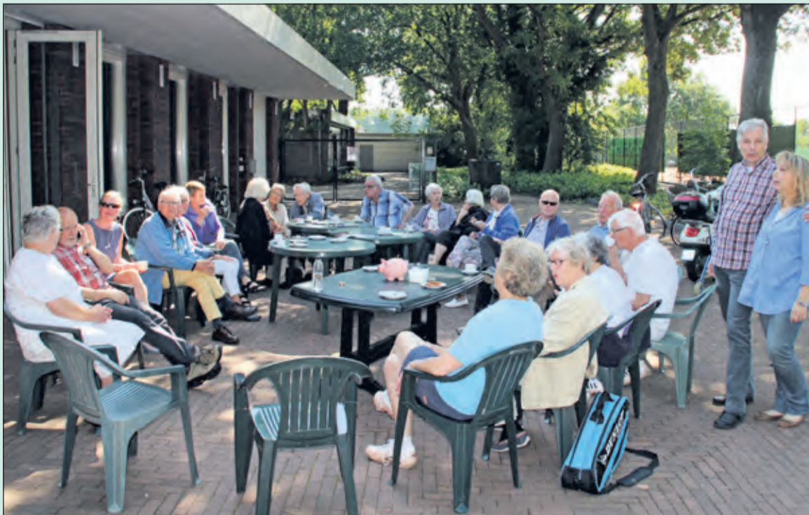
Zo'n 25 bewoners schoven aan bij de Leut in Hollandsche Rading.