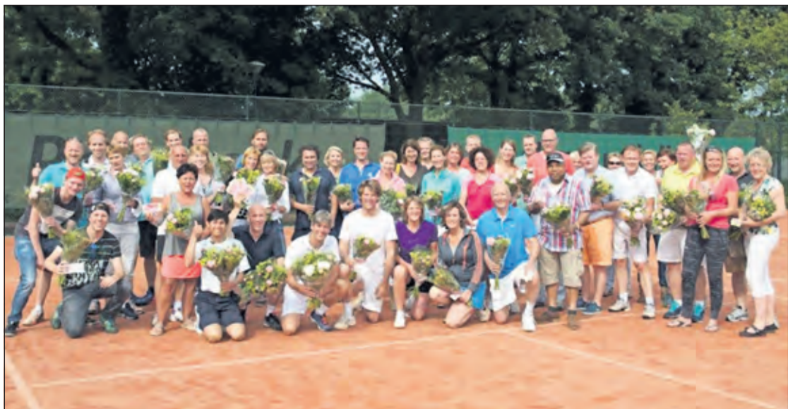
Met veel zon en ook wat korte stortbuien is afgelopen week het 28e Open Bosbergtoernooi gespeeld bij TV Hollandsche Rading. De finalisten werden zondag in de bloemen gezet.