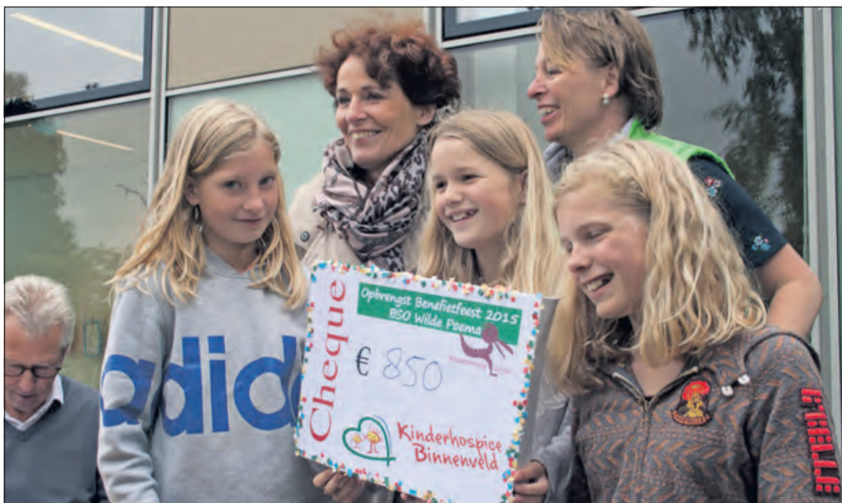
Uiteindelijk is er een mooi bedrag van zo'n 850 euro opgehaald.