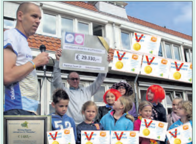
Landelijk werd er voor het Roparun Team 29.330 euro overgemaakt.