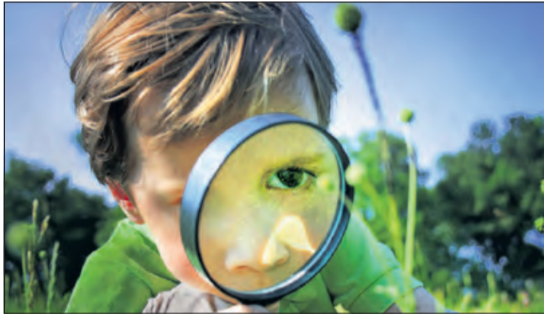
Ga op ontdekking bij Topkids.

Tijdens deze middag wordt er vast een tipje van de sluier opgelicht van alle activiteiten die de nieuwe Topkids Ontdekkings-BSO voor de kinderen in petto heeft. In samenwerking met verschillende (sport-)verenigingen in Maartensdijk worden er workshops aangeboden in onder andere tennis, judo, zingen en koken. Ook kunnen er echte wetenschappelijke proefjes worden gedaan en kan er