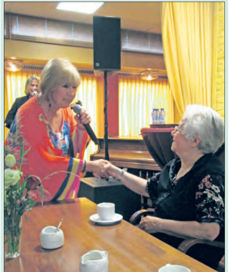
Willeke Alberti zingt ervoor dat de sfeer er goed inzit.