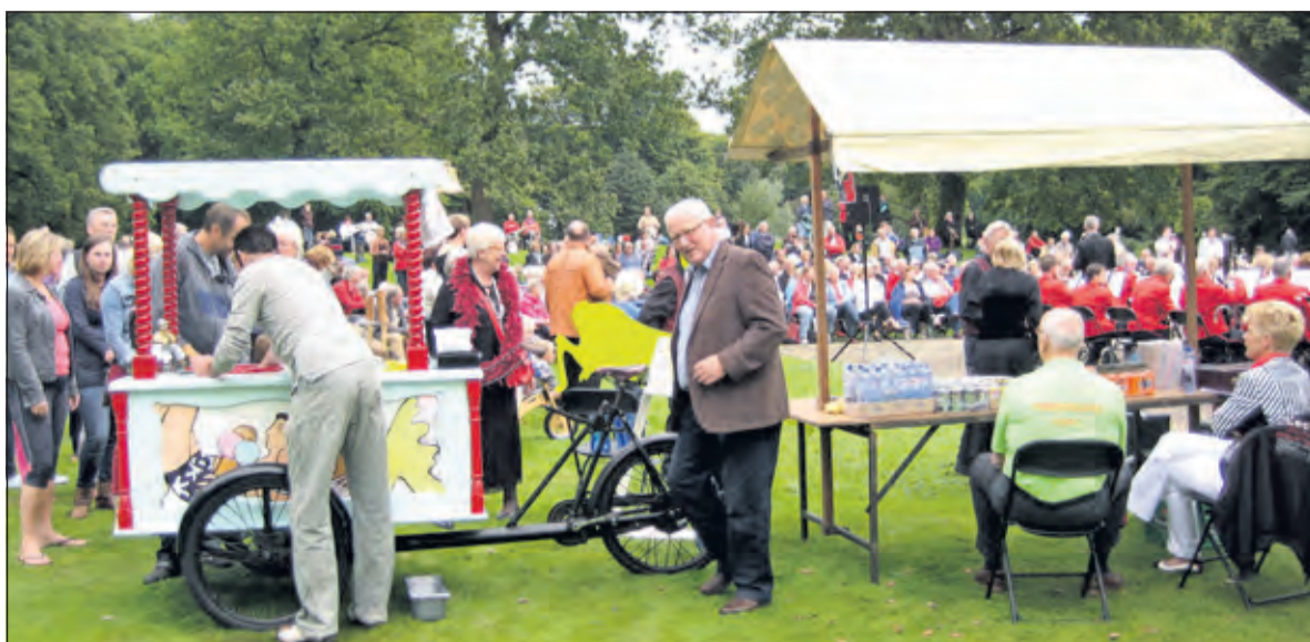
Met de voorspelde temperaturen doet de ijscoman ook dit jaar vast goede zaken.

door de Stichting Zomerconcerten De Bilt in samenwerking met Utrechts Landschap. Het concert vindt plaats achter het infocentrum Beerschoten, De Holle Bilt 6 in de Bilt. Het begint om 14.00 uur en duurt ca. 2 uur. Bij slechte weersomstandigheden vindt het concert plaats in de Immanuelkerk - Soestdijkseweg Zuid 49 in de Bilt. Medewerking wordt verleend door Smartlapenkoor Sterk Spul en de Melodie Percussiegroep van de Koninklijke Biltse Harmonie.