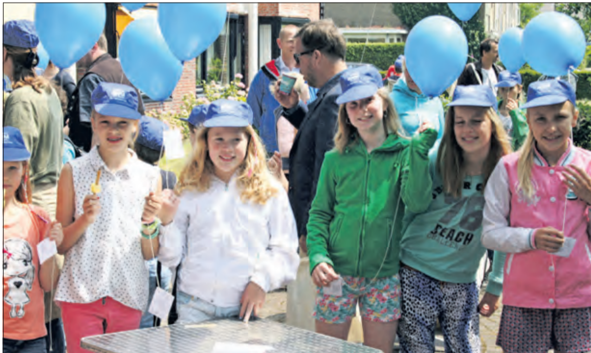
Bij het servicecentrum in De Bilt worden de kaartjes aan de ballonnen bevestigd en vervolgens opgelaten.