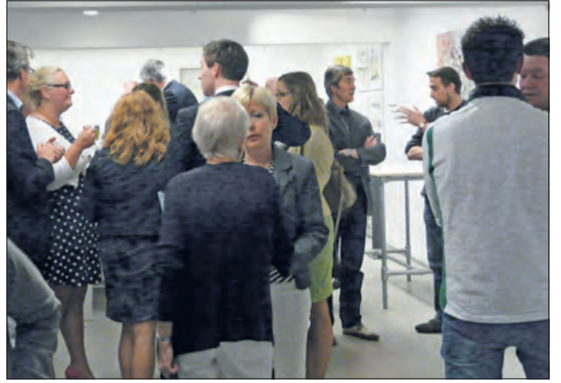
Een levendige discussie tussen winkeliers, sprekers van de avond en aanwezige raadsleden.

In Zeist hebben winkeliers samen afspraken gemaakt. Veel supermarkten zijn daar iedere zondag open en de meeste andere winkels één zondag in de maand van 12.00 tot 18.00 uur. Een aantal van de aanwezigen vestigde er aandacht op, dat De Bilt tussen de omliggende gemeenten de enige is waar mogelijkheden tot verruiming van de openingstijden voor winkels nog niet zijn genoemd. (Erik de Rie)