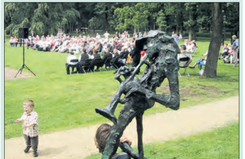
Goed weer heeft de voorkeur bij de Zomerconcerten.

Stoelen zijn aanwezig en de toegang is gratis (vrijwillige bijdrage). Bij slecht weer wordt het concert verplaatst naar de Immanuelkerk, Soestdijkseweg Zuid 49. Voor inlichtingen en informatie: 06-51229733 of via nl-nl.facebook.com/zomerconcertendebilt/