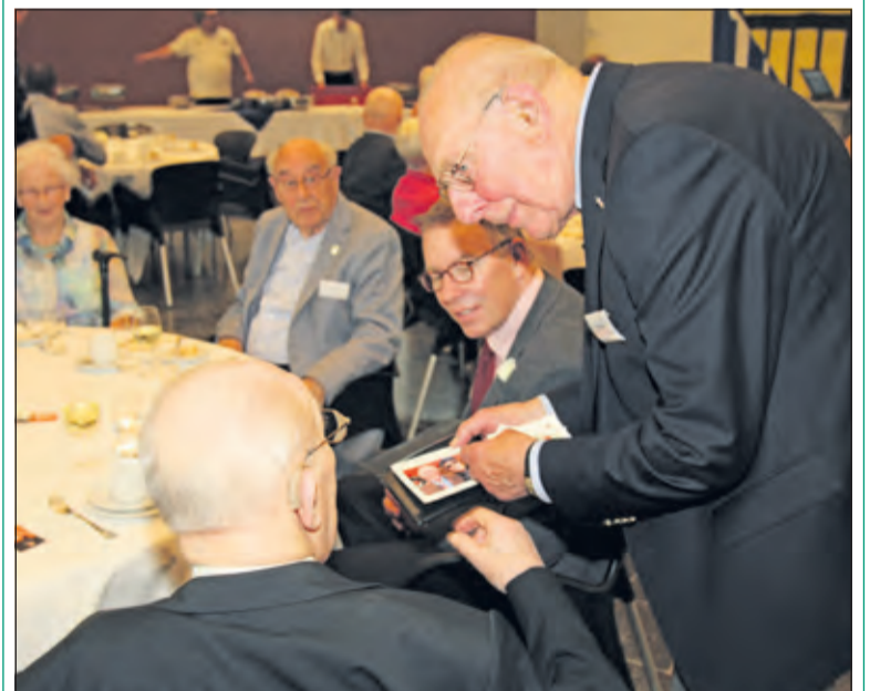
Moment van ontmoeting.

Vrijdag 26 juni vierde de gemeente De Bilt de Nederlandse Veteranendag. Alle dienende en oud dienende oorlogsveteranen uit de gemeente waren uitgenodigd om naar het gemeentehuis te komen. Na een welkomstwoord van de burgemeester volgde een gevarieerd programma. Later werd een gezamenlijke maaltijd genoten en rond 19.45 uur namen weer afscheid van elkaar.