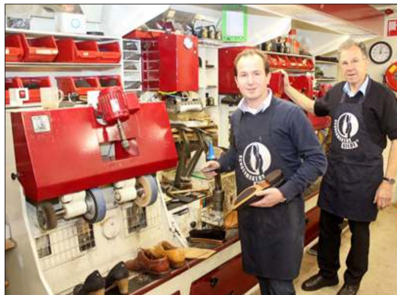
Vader staat volledig achter zijn zoon.