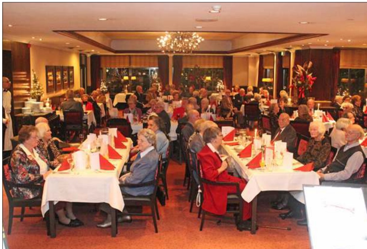
Ongeveer 120 ouderen uit alle kernen van de gemeente ontmoetten elkaar in De Biltse Hoek en genoten van een voortreffelijk diner.

fonds heeft een landelijke afspraak met de Lionsclub. Overal waar deze kerstdiners plaatsvinden zijn er Lions-clubleden die de mensen ophalen en weer thuis brengen. Een breed gedragen initiatief dus. Gasten krijgen drankjes aangeboden en een 3-gangen diner met koffie. De invulling wordt per locatie gekozen. Verder is er inmiddels bijna overal entertainment. Dit en vorig jaar was dat bij ons in De Biltse Hoek het