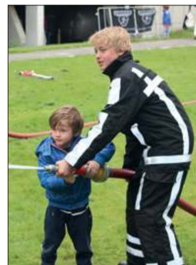
Juni; Ook de jeugdbrandweer was actief op de brandweerdag.

De brandweerdag met als motto In Vuur en Vlam voor Preventie trof