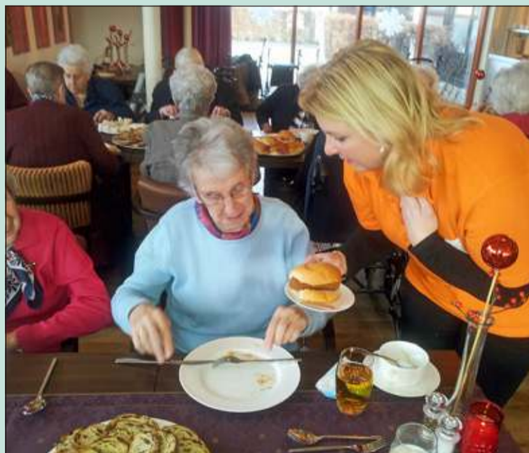
In het sfeervol aangeklede wijkrestaurant Bij de Tijd verzorgden 10 medewerkers van de Rabobank Utrechtse Heuvelrug op 16 december een onvergetelijke Kerstbrunch voor 60 bewoners van woon- zorgcentrum Weltevreden. (Astrid Kloosterziel)