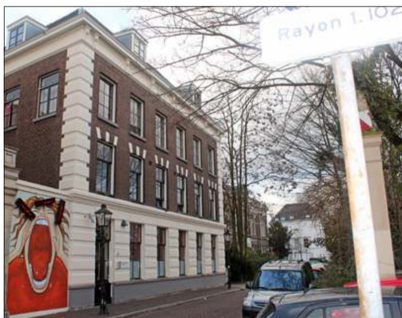
Het Belangrijke Bureau in de stad U. Hier niet ver vandaan. Het bureau verhuisde een paar keer in deze stad. Sinds 2008 is het helemaal verdwenen uit U. en moeten de bezoekers naar Amsterdam waar nog wel zo'n Belangrijk Bureau te vinden is.