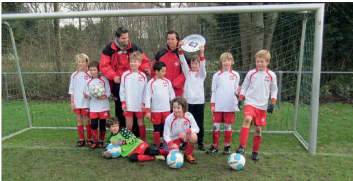
Januari; FC De Bilt E3 wordt ongeslagen kampioen van de derde klasse.

De Vierklank publiceerde ook in 2013 weer vele wetenswaardigheden uit de directe omgeving. De viering van De Bilt 900 jaar was natuurlijk een hoogtepunt en kwam uitgebreid in de kolommen van de krant. Maar er waren heel wat meer nieuwsfeiten waar mensen soms boos of verdrietig over waren, maar die andere keren weer vreugdevol stemden. Dit overzicht is een willekeurige greep uit al dat nieuws. Wat het weer betreft was het een uitzonderlijk jaar.