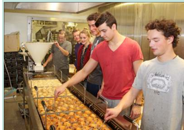
En natuurlijk bakte Bakker Bos ook weer alle oliebolletjes voor de oliebolletjesactie van korfbalvereniging Tweemaal Zes.

Alvorens de leden van de begeleidingsgroep te bedanken voor hun werk informeerde wethouder Arie-Jan Ditewig de belangstellenden over de stand van zaken.