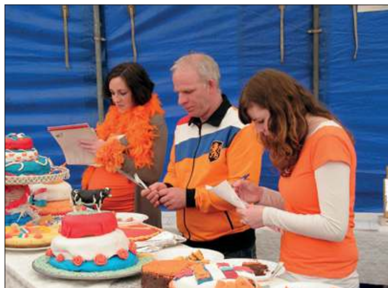
April; De jury keurt taarten bij een taartbakwedstrijd die op Koninginnedag in Westbroek werd gehouden.

Leerlingen van de Theresiaschool in Bilthoven en de School met de Bijbel uit Maartensdijk roefelen bij De Vierklank en Multi Pilot Simu-