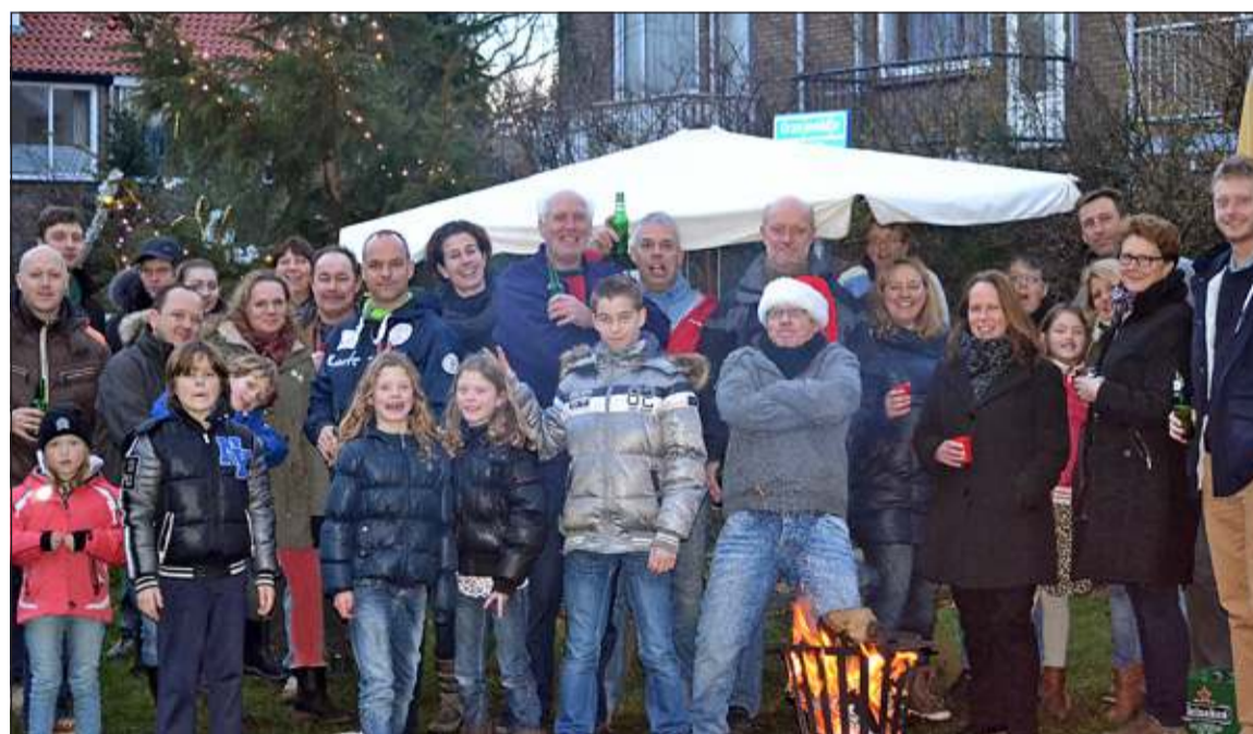
Al een aantal jaren tuigen bewoners rondom het grasveldje in de wijk Meyenhagen – Beatrixlaan (De Bilt) gezamenlijk de boom op onder genot van een hapje en een drankje. Ondanks dat het weer niet zo goed was waren er toch weer veel burens van de partij. (Peter Daniël)