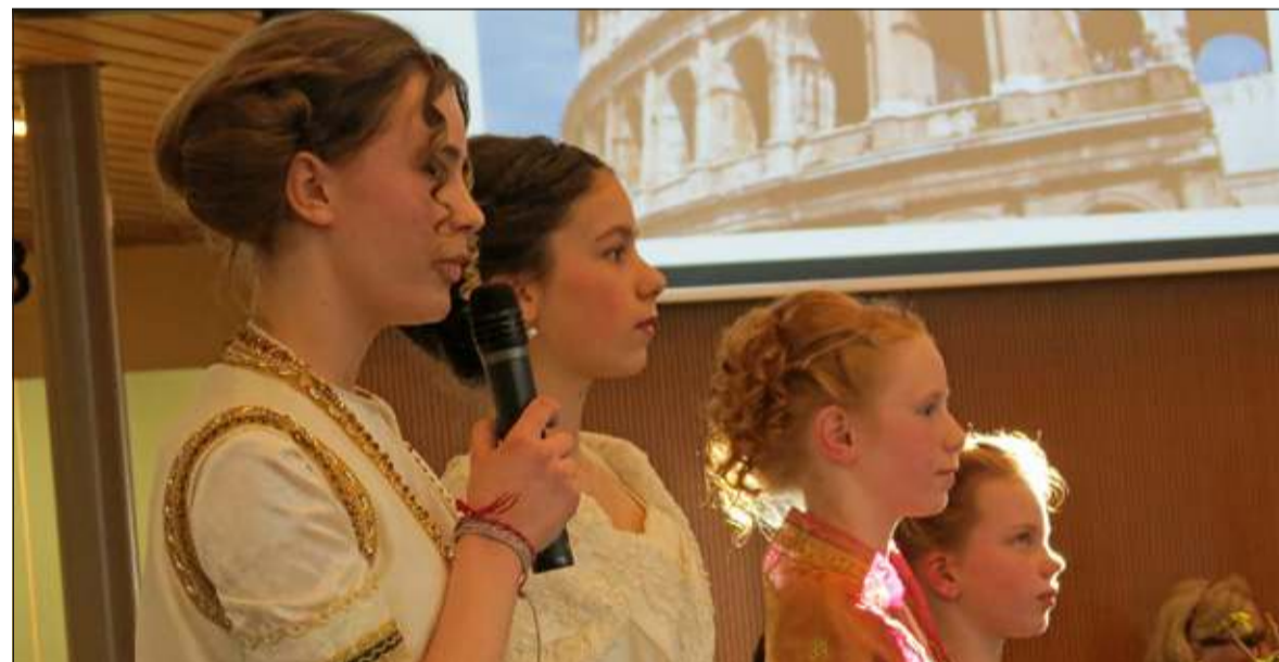
Maart; Mathildes beelden de verschillende periodes uit het leven van Keizerin Mathilde uit.