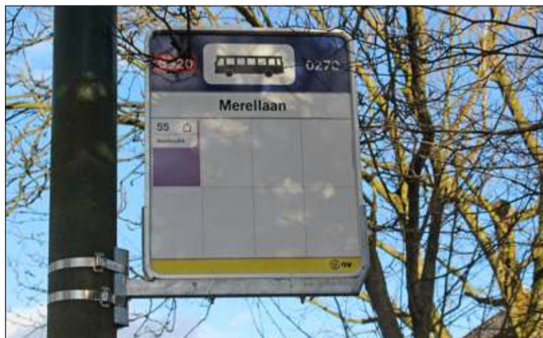
December; Een nieuwe bushalte aan de Merellaan in Maartensdijk.

Drie ondernemers krijgen de titel Ondernemer van het Jaar. Sinterklaas was weer in de gemeente en nam op stormachtige wijze afscheid. De Nieuwe Philharmonie houdt een bijzonder Kerstconcert in de OLV-kerk in Bilthoven. Lions Club Bilthoven 2000 organiseert een kerstbomenactie voor de Voedselbank. Amnesty International houdt een fakkelwake. Er rijden nieuwe bussen op nieuwe lijnen. Buurtboerderij De Schaapskooi houdt een Winterfair. FC De Bilt pakt de draad weer op. De Vierklank wenst de lezers een voorspoedig 2014 met heel mooi weer.