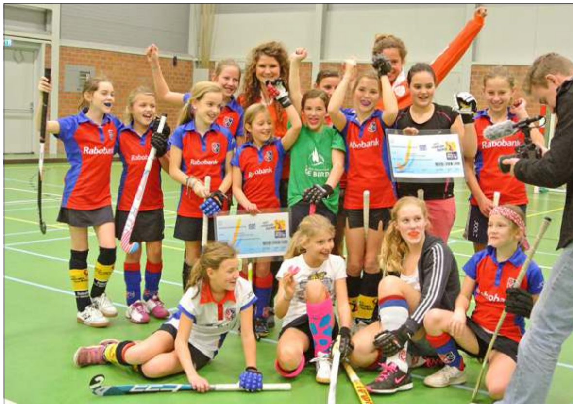
Grote blijdschap bij het meidenteam van SCHC.