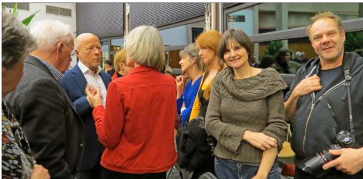
Veel bewoners van De Ridderhof waren bij de behandeling van het agendapunt aanwezig.

kijken of dit binnen het bestaande tennispark kan. Als dit niet mogelijk is dient aantasting van de nabijgelegen stuifwal te worden voorkomen.