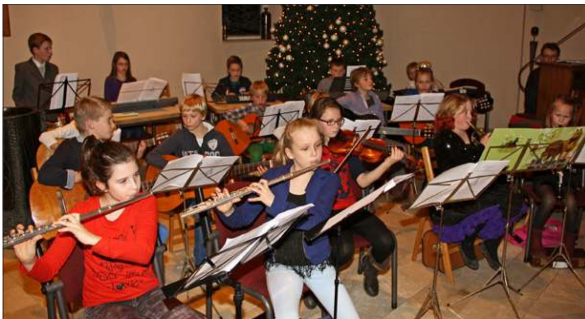
Het leerlingeorkest van de Groen van Prinstererschool zorgde voor de muzikale begeleiding.