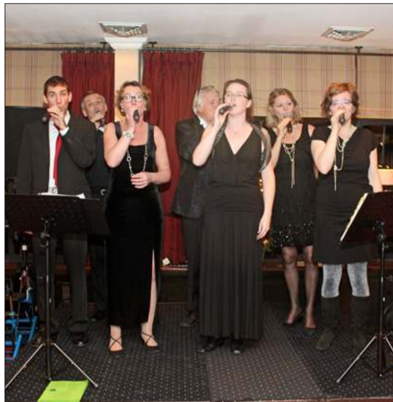
Rhythm & Juice is een 8-koppige vocal band, 4 mannen, 4 vrouwen en zingt pop, jazz, wereldmuziek, Nederlandstalig, eigenlijk alles wat ze mooi vinden.