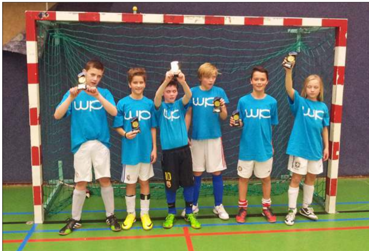
De zes winnende werkers van De Werkplaats.