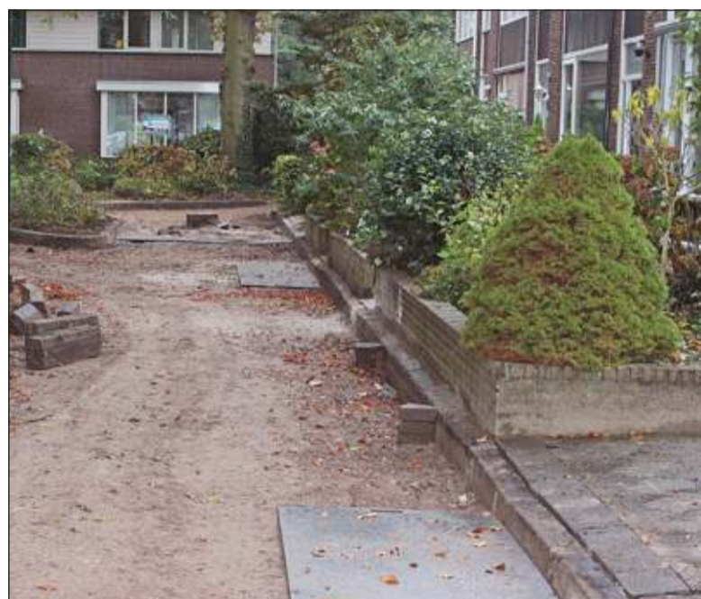
Briefschrijver: 'De bewoners moeten om hun huis uit te komen een afstap van ca. 30 cm maken en komen daarbij soms in de modder terecht'