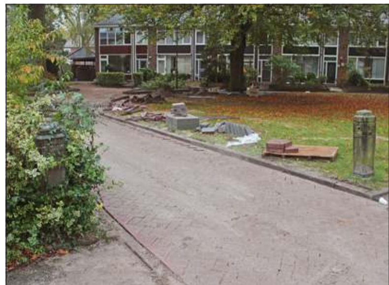
Van het huis is niets meer terug te vinden. Alleen twee hekpalen met de naam van het huis zijn nog bewaard gebleven.

zomer- en winterverblijf'. In 1861 verwisselt het alsnog van eigenaar. In 1879 vindt er opnieuw een openbare veiling plaats en de nieuwe eigenaren laten er wat aan verbouwen, maar uiteindelijk wordt het in 1901 afgebroken om plaats te maken voor een nieuw gebouw. Dit pand werd uiteindelijk in 1939 ook