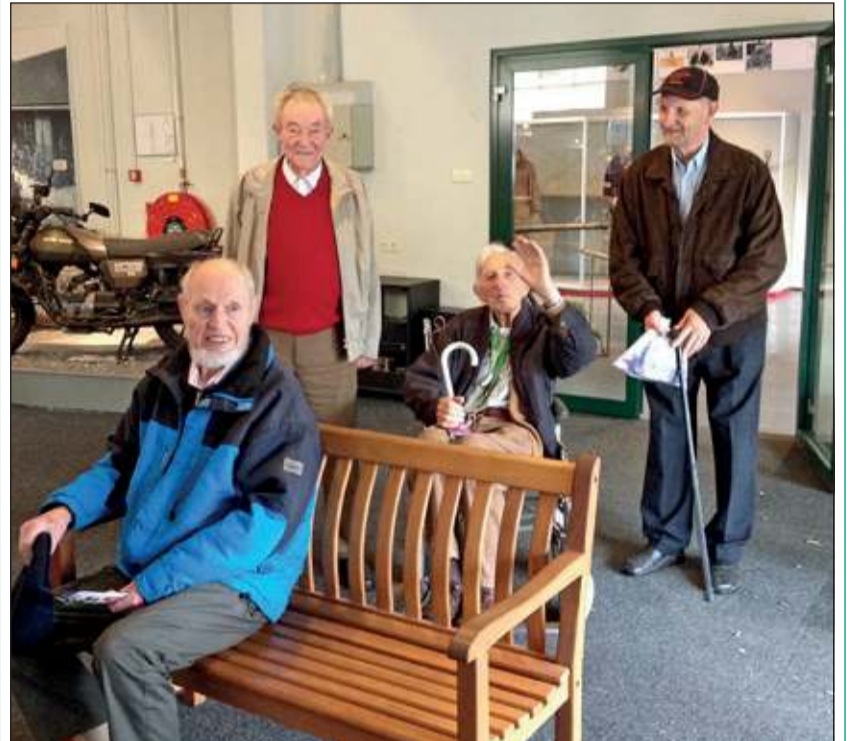
Heren van De Bremhorst op bezoek in het cavaleriemuseum.