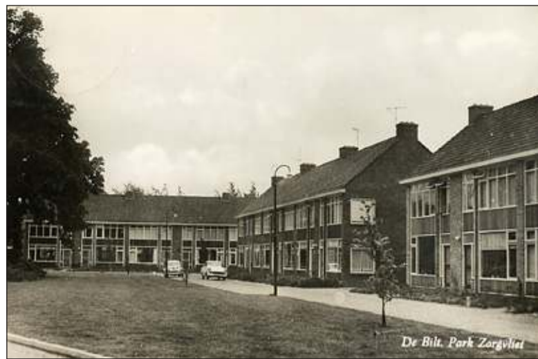
Park Zorgvliet. Foto uit 1959 uit de verzameling van Rienk Miedema.

Zorgvliet in De Bilt is vernoemd naar het Huis Zorgvliet, staande op het stuk grond, dat omsloten wordt door de Dorpsstraat, de Burgemeester de Withstraat en de Bilt-hovenseweg in De Bilt, ten westen van de NH Kerk. Het huis werd in 1843 gebouwd. Pogingen om zo'n 15 jaar later het huis weer te verkopen lukken niet, waardoor het huis omschreven wordt als 'het voor weinig jaren nieuw gebouwde kapitale heerenhuis, geschikt voor