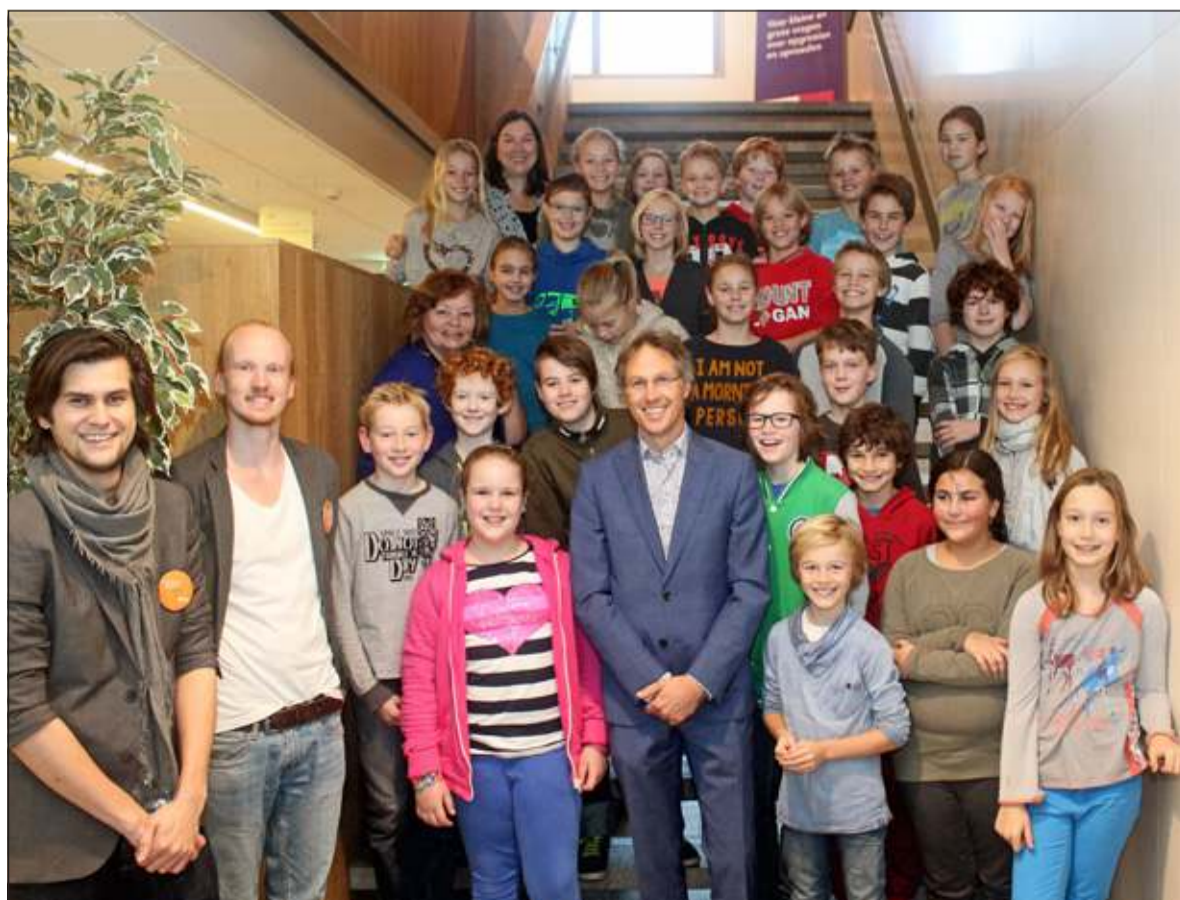
Leerlingen van Patioschool De kleine Prins maken in Het Lichtrum kennis met verschillende aspecten van het theater.

Het project 'Achter de schermen' maakt onderdeel uit van een programma, het zogenaamde Kunst- en Cultuurmenu, dat verzorgd wordt door Kunst Centraal. 16 van de in totaal 19 scholen in De Bilt nemen aan dit programma deel. Daardoor maken vele Biltse leerlingen jaarlijks minimaal een keer kennis met een professionele kunstenaar of gezelschap. Ook komen zij jaarlijks een keer in contact met een persoon of locatie uit hun lokale culturele omgeving.