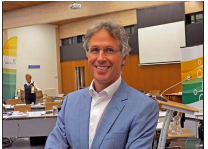
Wethouder van Financiën loodste zijn eerste begroting voortvarend door de raad.