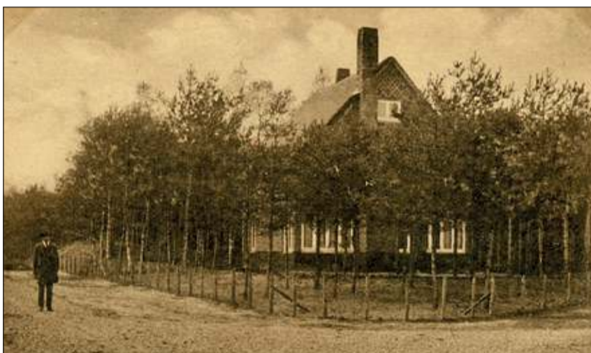
De Schorpioen is een van de vijf dierenriem woningen. (foto uit de collectie van Rienk Miedema).