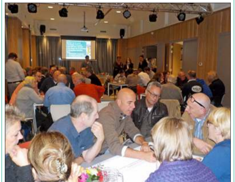
Inwoners van Hollandsche Rading worden betrokken bij het opstellen van een gebiedsplan.

Nadat er met elkaar gesproken was over verwachtingen in de samenwerking, was het aan de aanwezigen om aan te geven of zij de komende maanden in gezamenlijkheid aan een gebiedsplan willen werken. Vrijwel iedereen gaf aan zich in te willen zetten voor het opstellen van een gebiedsplan voor Hollandsche Rading. Samen met een aantal bewoners wordt een volgende bijeenkomst in deze kern voorbereid.