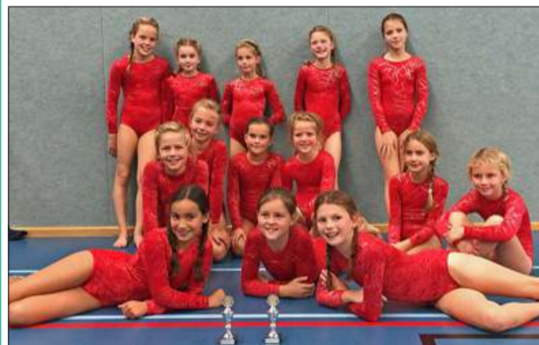
Topsprongen voor de meiden van SV Irene.

Zaterdag 1 november zijn de turnsters van SV Irene vol goede moed naar de Springwedstrijd van het Gewest Midden Nederland in Woerden afgereisd. De meiden hadden de laatste weken flink voor deze wedstrijd getraind en dat werd beloond. De jongste groep won op E niveau bij lange mat en mini-trampoline + kast de 1e prijs en de oudere groep deed het op D niveau ook goed: zij wonnen op de mini-trampoline de 1e prijs en bij lange mat en mini-trampoline + kast wonnen zij de 2e prijs. (Ria van Ingen)