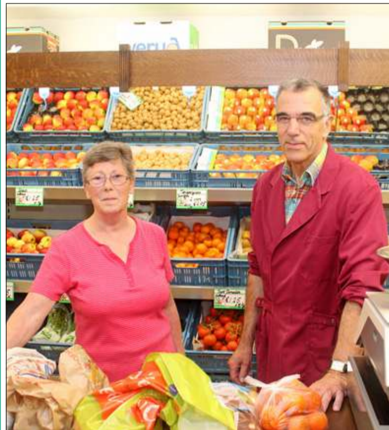
Zaterdag 20 september was de winkel voor het laatst open. Om 16.00 uur sloten de deuren definitief.