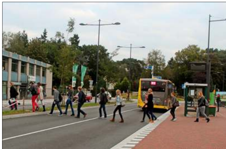
Treinreizigers verlaten het station steken achter bussen langs over.

GroenLinks zal in de komende gemeenteraad donderdag 25 september B&W verzoeken oplossingen aan te dragen en zal een aantal suggesties doen. Brommersma: 'Zo kan er direct tegenover de stations-uitgang een officiële oversteekplaats gemaakt worden, kan de stoep aan de overzijde wellicht verruimd worden, kan de gemeente aandringen op langere bussen en bijvoorbeeld een Qbus-assistent in de ochtendspits. 'Hopelijk komt er snel een oplossing, niemand zit op ongelukken te wachten'.