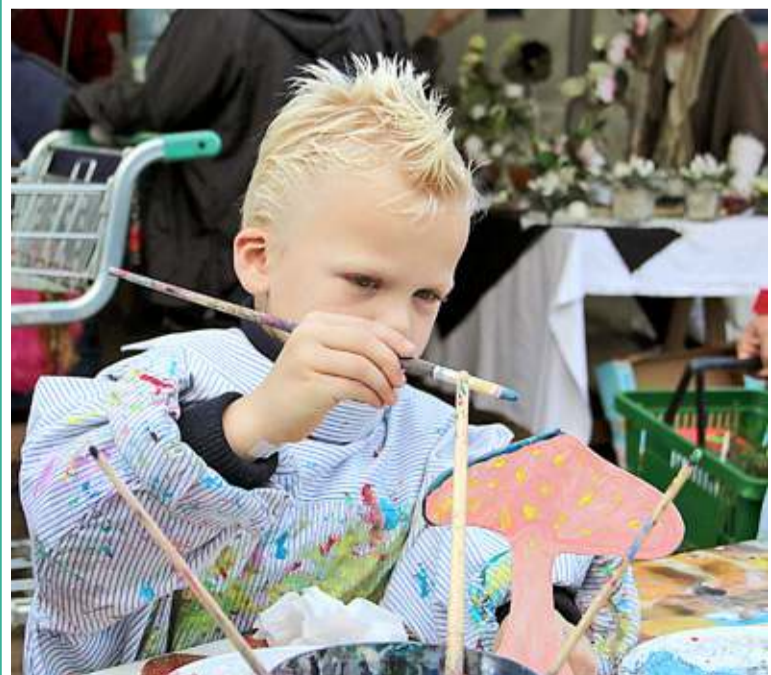
Opperste concentratie aan de knutseltafel.

Op zaterdag is het programma nog iets uitgebreider want dan kan een ieder gratis grond uit eigen tuin laten testen bij de specialisten van EcoStyle. Er zijn dan ook snoei- en behandeladviezen en voor de kinderen is tante Thea aanwezig. Het evenement is grotendeels overdekt, dus de weergoden kunnen geen roet in het eten gooien. 't Vaarderhoogt vindt u aan de Dorresteinweg 72b in Soest.