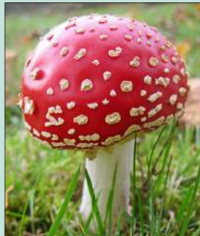
De vliegenzwam is gemakkelijk te herkennen.