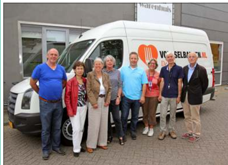
De bus is voorzien van koeling en voldoet aan de strenge normen die men hanteert van de 'koud-keten-eisen bij de Voedselbank.

De nieuwe bus kon mede bekostigd worden dankzij Emmaus De Bilt (18.000 euro) en Voedselbank Nederland (15.000 euro). Het resterende bedrag was voor rekening van Voedselbank De Bilt en kon via allerlei acties en inzamelingen op worden gebracht. De bus rijdt tot 30 september alleen op de vrijdag. Vanaf 1 oktober gaat men dagelijks rijden met deze bus. Voedselbank De Bilt is nog op zoek naar sponsors voor de bus, die met naamsvermelding op de bus het gebruik ervan kunnen verzekeren.