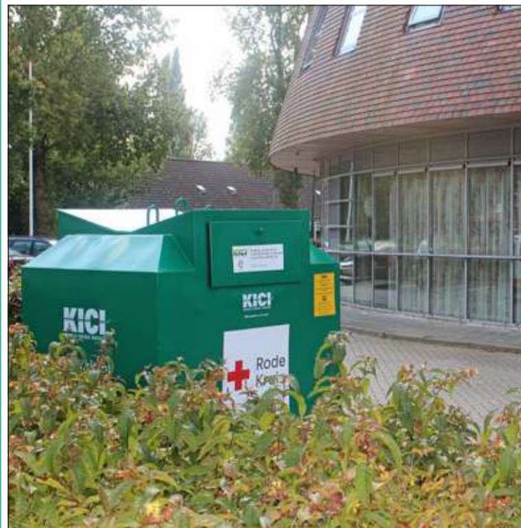
Alleen van deze bak op de St Laurensweg gaat de opbrengst naar de lokale afdeling De Bilt.

De afdeling De Bilt is aan deze inzameling begonnen omdat ze daarmee wil bijdragen aan het tegengaan van verspilling en het helpen recyclen van textiel. Maar ook omdat de netto opbrengst voor het werk van de afdeling is, zoals: sociale hulp voor mensen in isolement, Eerste Hulp, bijzondere zorgvakanties, jeugd Eerste Hulp, reanimatiecursussen. KICI houdt een deel van de opbrengst in voor de kosten van onderhoud en transport. In onze gemeente wordt er niets afgeroomd door de gemeente. Er staan verschillende van dergelijke bakken overal in onze gemeente. Alleen van de bak op de St Laurensweg gaat de opbrengst naar de lokale afdeling; de andere bakken zijn ter ondersteuning voor de landelijke activiteiten van het Rode Kruis, zoals noodhulp in oorlogsgebieden.