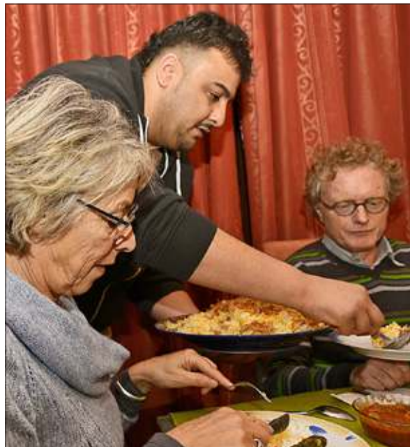
Schuifeens aan bij een culinair cultuuravontuur.