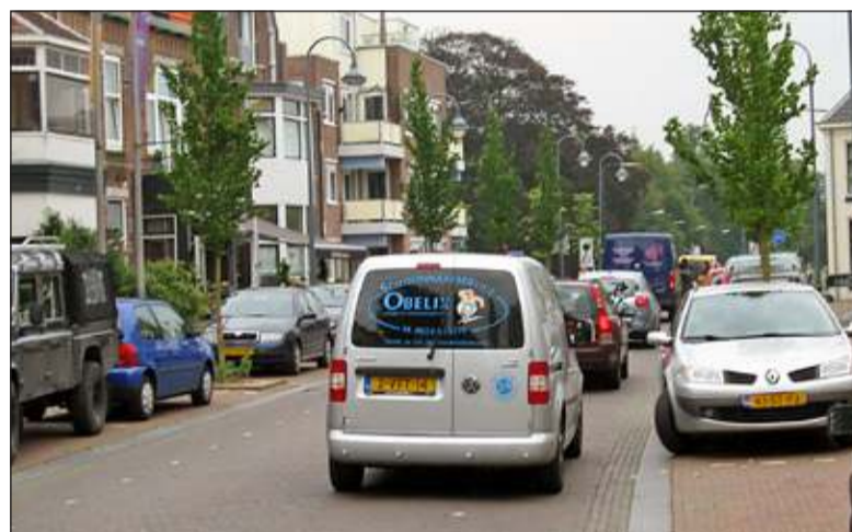
De Dorpsstraat is nog steeds niet auto-luw.

meentebestuur deze kans aan om een rustiger, schoner en veiliger 7% van de autokilometers en 2300 woonplek te geven. De Bilt is een autobewegingen per dag uit het dorp om in te wonen. Geen verkeersplein.