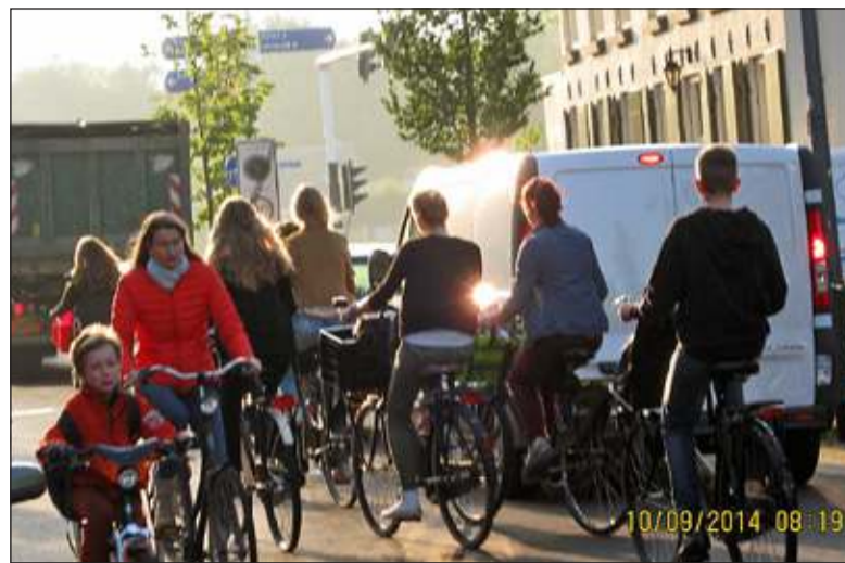
Fietsers worstelen zich door het verkeer. Het stukje fietspad naar de oversteek is zoals zo vaak rond deze tijd versperd.

Uiteraard is er weerstand tegen deze ingreep. Het vergt bestuurlijke moed. Maar hopelijk grijpt het ge-