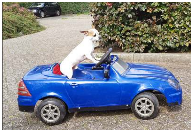
Deze auto werd gevonden bij het vuilnis op de Kometenlaan in De Bilt. Inmiddels heeft die een nieuwe bestemming gevonden bij een jongetje van 1,5 jaar. Maar deze hond vond hem ook even geweldig. (Karen Ree)