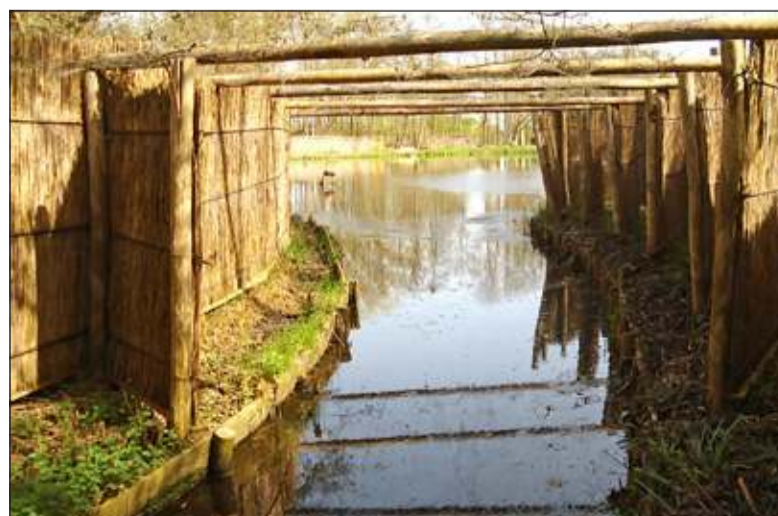
Op zaterdag 27 en zondag 28 september, 18, 19, 25 en 26 oktober zijn dit jaar nog rondleidingen in de eeuwenoude eendenkooi van Breukeleveen.

Laatste week: Aanschuiven € 10,00 www.naastdeburen.nl Groenekansweg 168, Groenekan