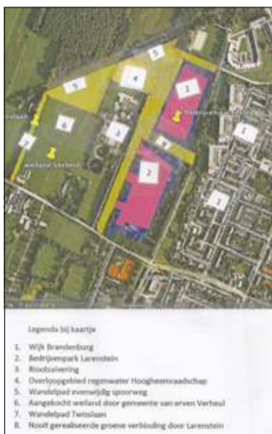
Een plan in kaart gebracht.

hoop ook op steun van Beter de Bilt, het CDA en ChristenUnie. De inwoners van Brandenburg verdienen het om natuur dicht bij hun huizen te hebben. Dit is goed voor de realisering van de ecologische hoofdstructuur, maar het is vooral goed voor onze geest. De mens is een sociaal wezen en het ontmoeten van anderen in de natuur is essentieel voor ons geestelijke en sociale welzijn'.