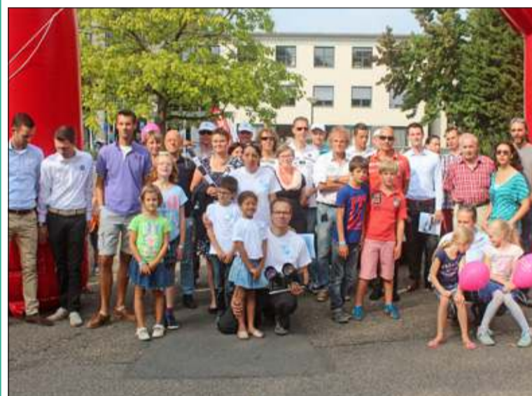
Deelnemers en belangstellenden van de Schone Lucht Rally voorafgaand aan de rit.

De Schone Lucht Rally is het grootste evenement voor elektrische en plug-in hybride auto's in Nederland en de landelijke Instapdag elektrisch rijden waarmee iedereen kennis kan maken met elektrisch rijden. Doel van deze evenementen is promotie van elektrisch vervoer en om traditionele autorijders kennis te laten maken met elektrisch rijden en hen te inspireren over te stappen. De rally omvatte 8 autoritten in diverse grote steden.