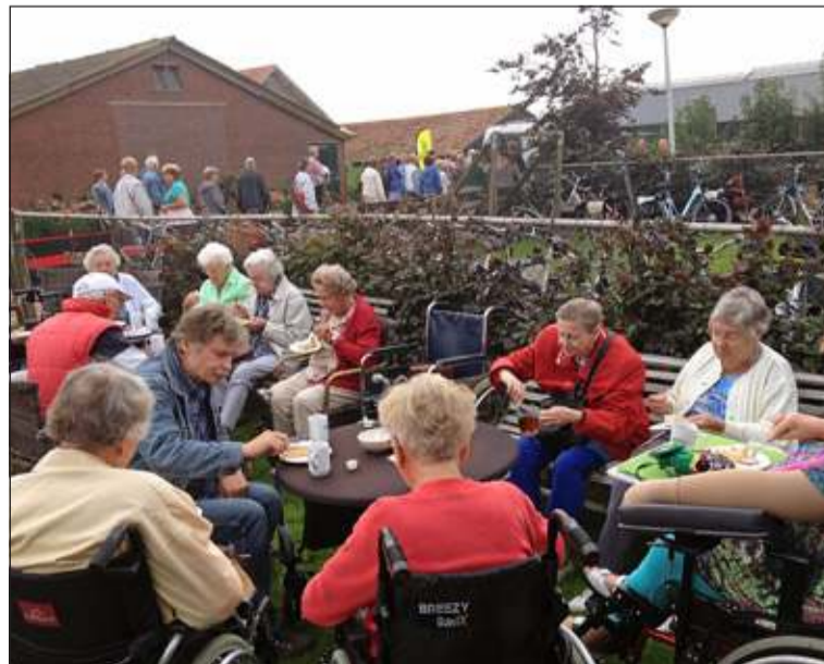
Het bleek er erg druk te zijn; iedereen kwam vroeg om zijn slag te slaan.

Er waren meer mensen op het idee gekomen naar dit festival te gaan. Het was zo druk dat niet alle verkoopwaren goed bekeken konden worden, maar de benodigde inkopen werden wel gescoord. Lekker koffie met gebak en een heerlijke lunch die bestond uit verse soep met een grote dikke boerenboterham maakte de dag compleet. Na de lunch werd er nog even een rondje door de kleine maar schattige landwinkel gelopen. (Berber Holwerda)