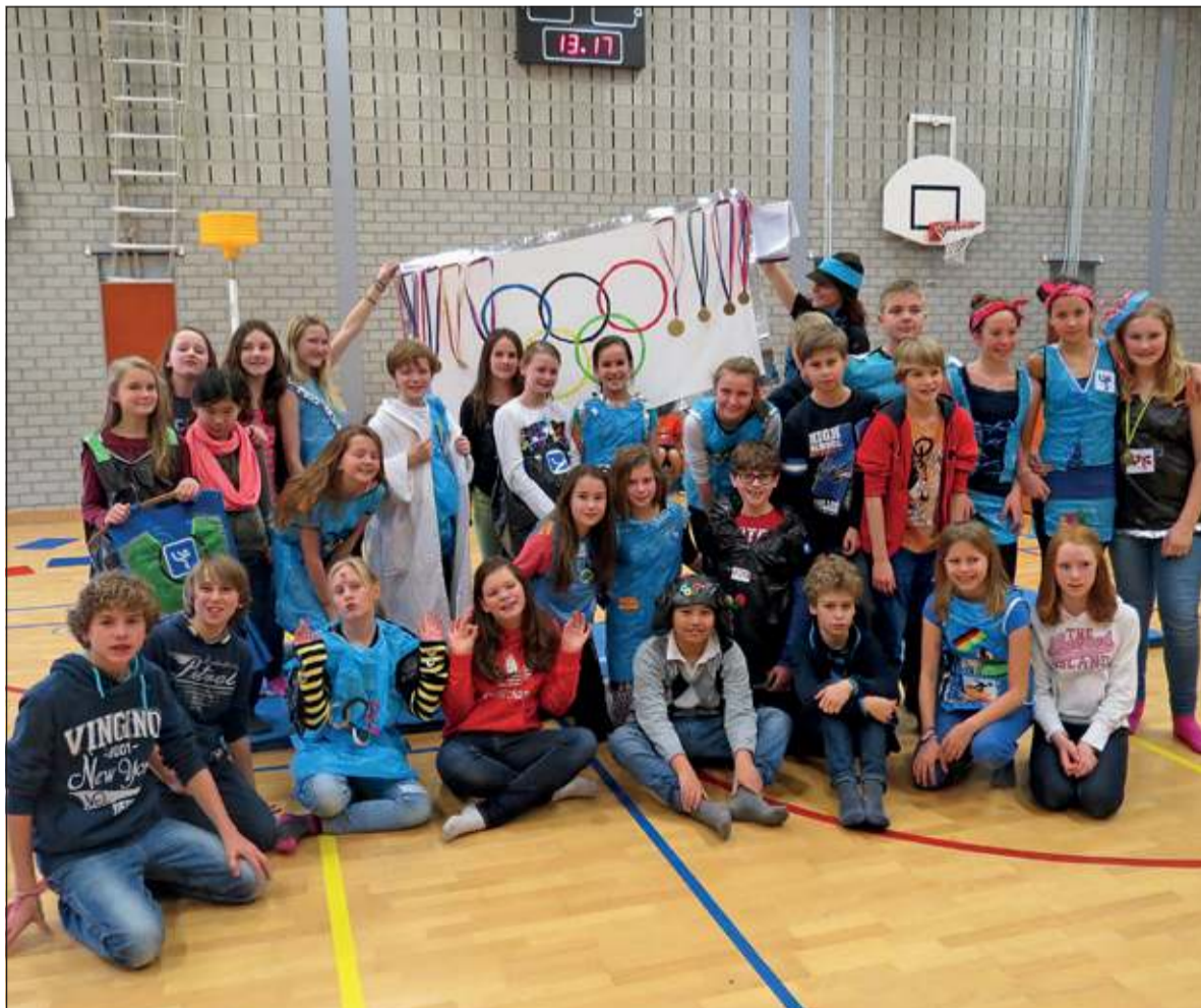
De mannequins en dressboys poseerden na afloop trots in hun creaties.

alles gebruiken. Met vuilniszakken werden de mooiste jurken en pakken gemaakt. Er waren hele originele ontwerpen bij', vertelt Augie die als ladspeaker de show begeleidde. Leerlingen die niet aan de show meededen droegen als toeschouwers net als bij de echte spelen heel veel oranje. [GG]