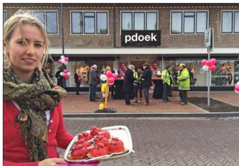
Viering heropening Nachtegaallaan met Valentijnsgebak van TOP's Edelgebak.

De vernieuwing van de Nachtegaallaan maakt deel uit van de totale vernieuwing van het centrum van Bilthoven. Onder de noemer Bilthoven Bouwt wordt onder meer gewerkt aan de herinrichting van de Julianalaan en de onderdoorgang van het spoor voor langzaam verkeer. Voor meer informatie, kijk op www.bilthovenbouwt.nl of bezoek het informatiecentrum aan de Julianalaan 1.