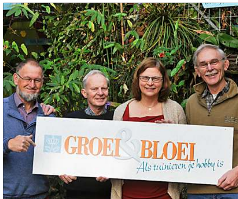
Groei en Bloei vond in de tropische kassen van de Botanische tuinen een prachtige locatie voor hun evenement.

Enkele experts uit de regio zullen voorlichting te geven over natuurvriendelijke tuinrichting. Verder