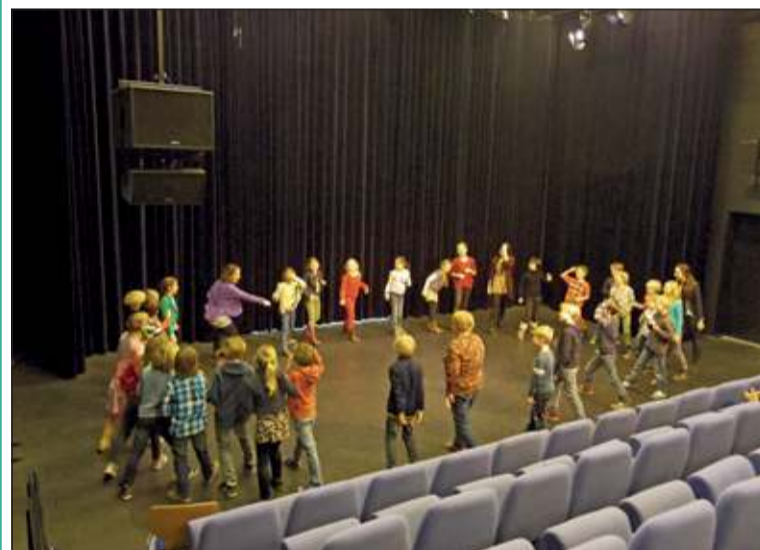
De komende maanden zijn er voor de groepen 3, 5, 7 en 8, van een groot deel van de basisscholen in de gemeente De Bilt, workshops zijn in de theaterzaal van het Lichtruim aan de Planetenbaan in Biltoven. Op de foto worden leerlingen van groep 5 (Julianaschool) voorbereid worden op een vertelvoorstelling. (Corinne Weeda)