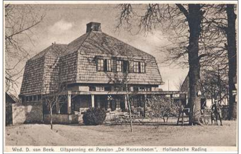
De Kersenboom uit 1918. (uit de verzameling van Rienk Miedema)

Alhoewel de bewoningsgeschiedenis van Hollandsche Rading eerst omstreeks 1900 aanvangt en de grens tussen de provincies Utrecht en Noord Holland vlak langs de noordzijde van de Vuurse Dreef loopt, is de voormalige Uitspanning en Pension 'De Kersenboom' aan de Utrechtscheweg 263 er vanaf het begin al (bij) geweest. De naam 'Uitspanning' doet denken aan han-