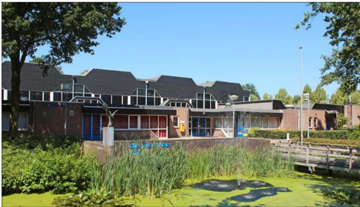
De Vierstee wordt gezien als het 'hart' van Maartensdijk.

Onder grote belangstelling werd in de vergadering van de Raadscommissie Burger en Bestuur jl. donderdag het voorstel van het Biltse College van B&W in te stemmen met een borgstelling tot een indicatief totaalbedrag van € 5.800.000 voor de ontwikkeling van een nieuwe multifunctionele accommodatie De Vierstee te Maartensdijk, besproken.