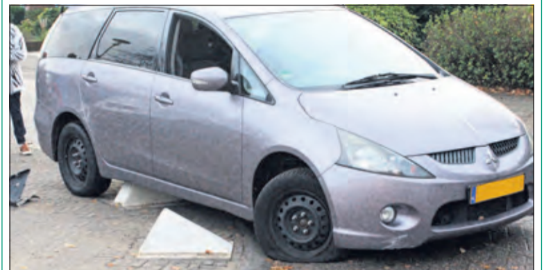
Zaterdagochtend half negen zat de eerste auto er al bovenop. [HvdB]

Vrijdag 13 november zijn er drie betonblokken geplaatst op de hoek van de Pr. Marijkelaan (t.o. nr. 55) en het Maartensplein in Maartensdijk. De witte blokken staan op het trottoir om te voorkomen dat auto's daar geparkeerd worden en daardoor zicht weg nemen op de bocht. Het was een wens van omwonenden, dat op die plek geen auto's meer geparkeerd konden worden. 'Om die blokken te raken, moet je dus eerst het trottoir op rijden ... En dat is dus om te beginnen niet de bedoeling', meldt een vertegenwoordiger van de gemeente. Volgens omstanders en aanwonenden zijn de blokken slecht zichtbaar wanneer je in een auto zit en kan je 'wachten op ongelukken'.