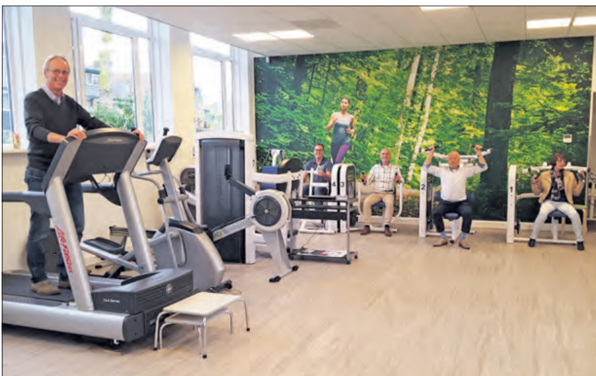
Het team brengt mensen graag weer in beweging.

Na meer dan 50 jaar Kerklaan is Fysiotherapie 'De Bilt' begin november verhuisd naar het Gezondheidscentrum De Bilt aan de Henrica van Erpweg 2b in De Bilt.