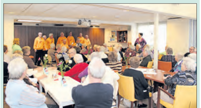
Het Rode Kruis verzorgde zaterdag 14 november, samen met Sterk Spul uit Maartensdijk, een gezellige middag voor haar gasten in Toutenburg in Maartensdijk. Na het optreden van het mannenkoor met prachtige smartlappen en levensliedjes werd er gezamenlijk gegeten.