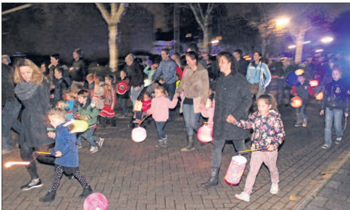
Vanaf de Ontmoetingskerk in optocht naar de Sint Maartenkerk aan de Nachtegaallaan.

Ook dit jaar organiseerde de Sint Maartenkerk in Maartensdijk weer de traditionele lampionnenoptocht door Maartensdijk. Op woensdag 11 november konden de kinderen verzamelen bij de Ontmoetingskerk aan de Julianalaan.