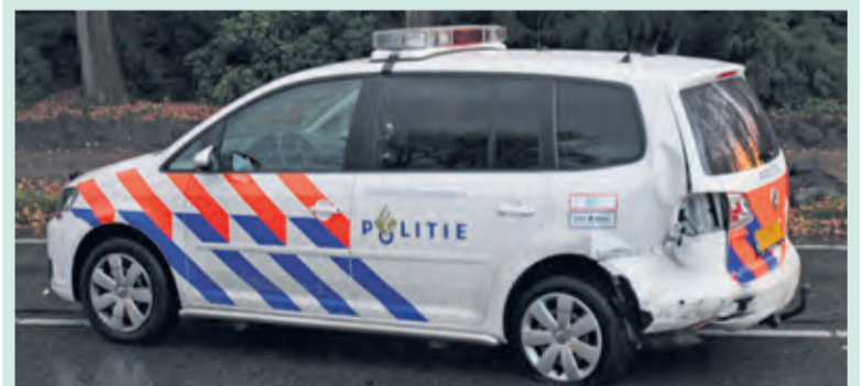
De beschadigde politieauto.