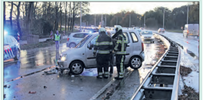
Auto die tegen de politie auto aan reed.