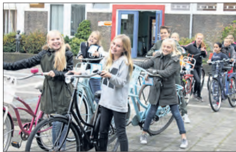
Met de bekende 'deze-fiets-is-oké-sticker' kan ieder veilig de winter in.

Een jaarlijks terugkerende activiteit in de herfst is de fietsenkeuring in samenwerking met Veilig Verkeer Nederland. In de wintermaanden is een goed werkende fiets extra belangrijk. Op woensdag 11 november werden de fietsen van de groepen 5 t/m 8 gekeurd door de keurmeesters van Bike Totaal Mastwijk en enkele hulpouders. Wat kleine gebreken werden ter plaatsen gerepareerd.