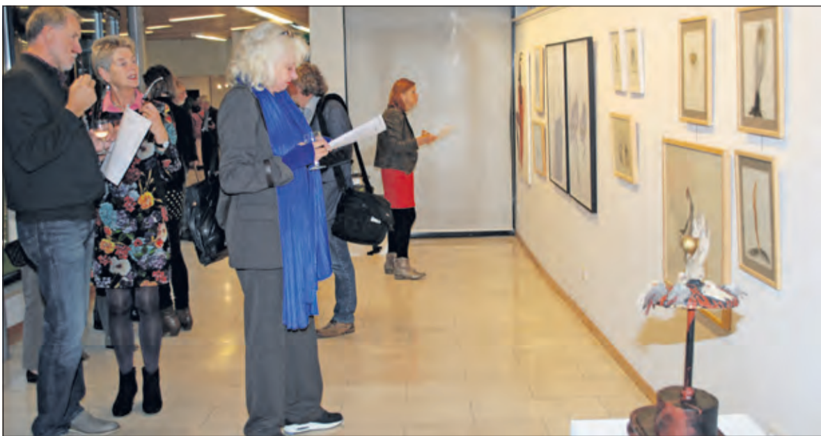
Al direct na de opening is er volop belangstelling voor de expositie.