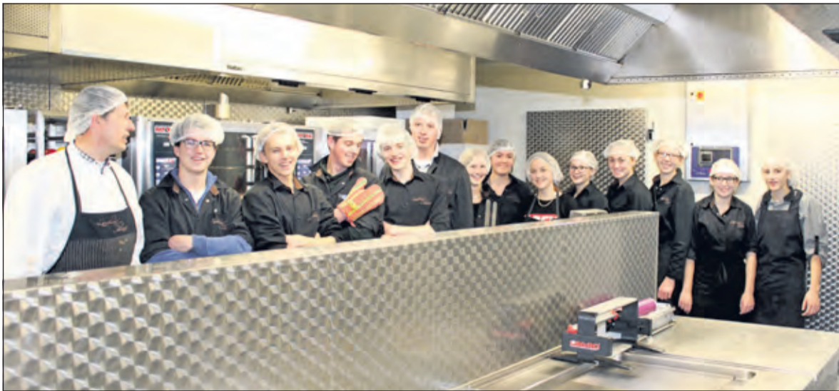
Aan het einde van iedere werkdag worden winkel en werkruimtes spik en span achter gelaten.

Eind oktober ontving Landwaart in Maartensdijk de fel begeerde en benodigde systeemcertificatie. Dat betekent dat het voedselveiligheidssysteem van het bedrijf is geëvalueerd en voldoet aan de daarvoor opgestelde landelijke eisen.