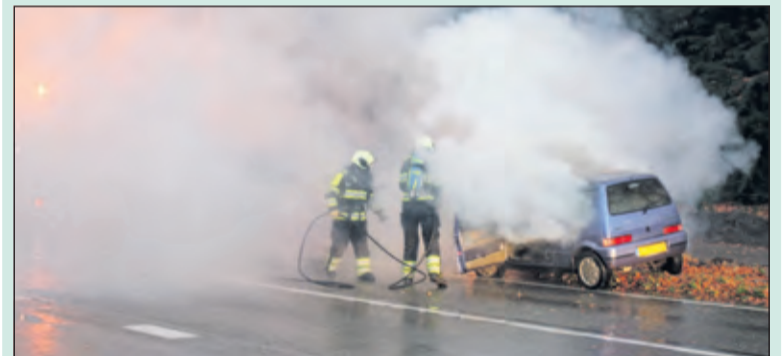
Auto wordt geblust door de brandweer van De Bilt.