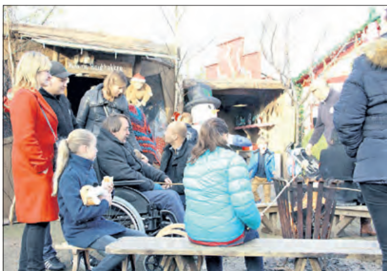
Winterevenement Warme Witte Winter Weken is een echt familiefeest.

Het dorp kent een heus Smulplein waar alle eethuisjes met bijbehorende zitjes gevestigd zijn. Genoeg te kiezen ook: oliebolletjes, poffertjes, warme worst, broodjes, lekkere hapjes, koffie, thee, limonade. Ook de befaamde eigen recept glühwein ontbreekt dit jaar niet. Wie uitgebreid wil eten kan terecht in de binnen-herberg De Kastelein. Op het Smulplein is tevens het muziekpodium, vanwaar op gezette tijden diverse artiesten, bands en koren voorstellingen verzorgen. Te beginnen met het openingsconcert van de Soester Knollen op zaterdag. Dan is het evenement een echt Hollands winterfeest dat 5 weken lang elke dag open is (ook de zondagen) en gaandeweg steeds meer een sfeervolle kerstbeleving wordt.