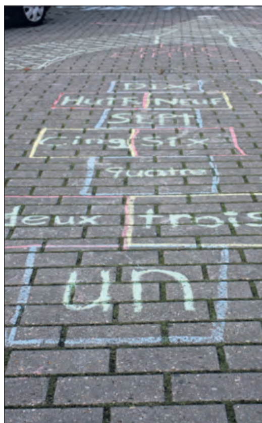
Hinkelen op z'n Frans: 'Un deux trois'.