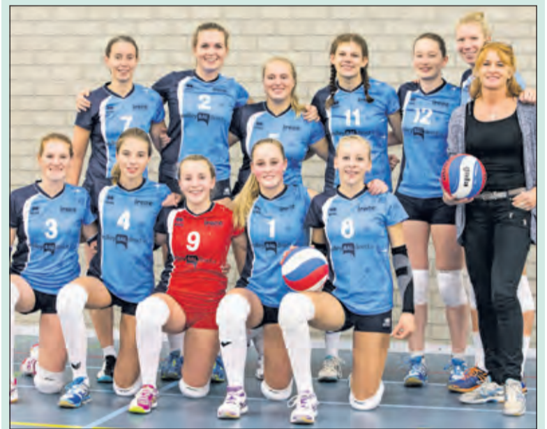
Het jonge Dames 1 team.

De eerste set is spannend tot 10-10, daarna is het aanvalsgeweld van Pleun Ypma en Esmee Priem te krachtig, waardoor Irene vrijwel iedere rally weet te winnen. Irene pakt de eerste set met 25-15. Ook set twee is Irene ongenaakbaar en zet de trend door: 25-16. De derde set breekt het gebrek aan ervaring het jonge team op, Irene laat de teugels wat vieren waardoor deze set onnodig verloren gaat met 24-26. In de vierde set zijn de Biltovense meiden weer helemaal bij de les. Met een aantal mooie aanvallen en een paar goede bloks wint Irene de vierde set met 25-21. Het publiek is enthousiast en vol lof over het spel van het jeugdige team. Irene handhaaft zich met deze overwinning in de top van de ranglijst. Volgende week spelen de Irene dames om 16.30 uur thuis in de Kees Boekehal tegen VV Haaglanden dames 2, de nummer 10 in de competitie. (Michel Everaert)