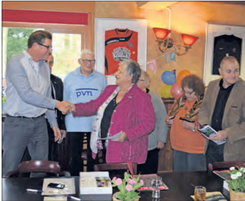
Sponsorovereenkomst bekrachtigd met een handdruk.

Als patiënten behoefte hebben om met lotgenoten in contact te komen, kunnen zij lid worden van de PVN. De vereniging geeft elke twee maanden een blad uit, waarin u van alles kunt lezen over psoriasis, er is gelegenheid tot lotgenotencontact en u kunt anderen ontmoeten op de Wereld Psoriasis Dag. Ook behartigt de vereniging uw belangen bij zorgverzekeraars. Meer weten, kijk op: www.psoriasisvereniging.nl