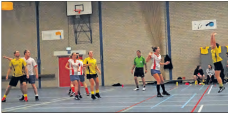
Nova bij Keizer Karel.

Al snel werd duidelijk dat Nova van plan was om de daad bij het woord te voegen. In rap tempo werd de