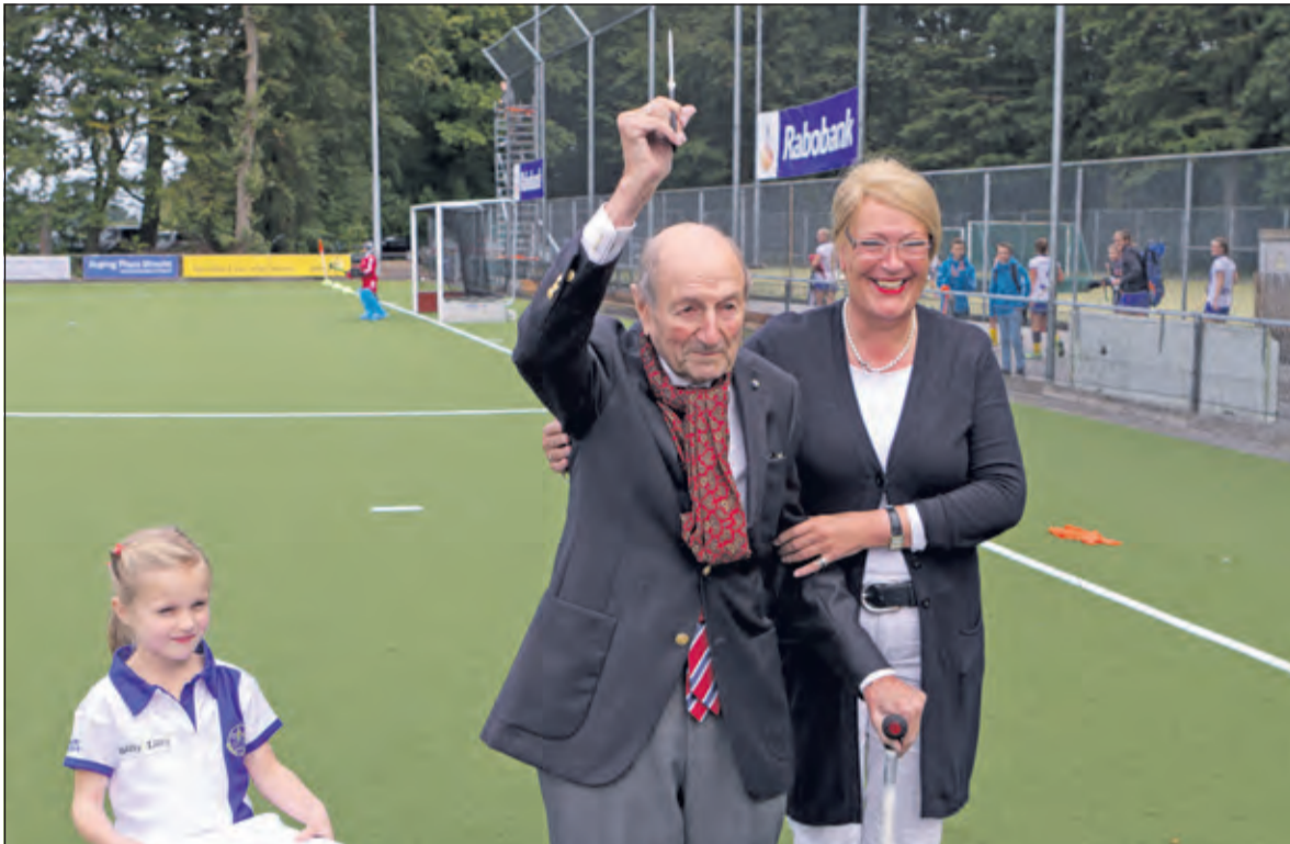
Zondag 20 september werd het eerste waterveld van Voordaan nog feestelijk in gebruik genomen.

Donderdag 5 november heeft de SP tijdens de behandeling van de begroting 2016 een lans gebroken voor gelijke behandeling van alle sportclubs. Het is de SP al langere tijd een doorn in het oog dat er een groot verschil zit tussen de behandeling van sommige gelijkwaardige sportclubs.