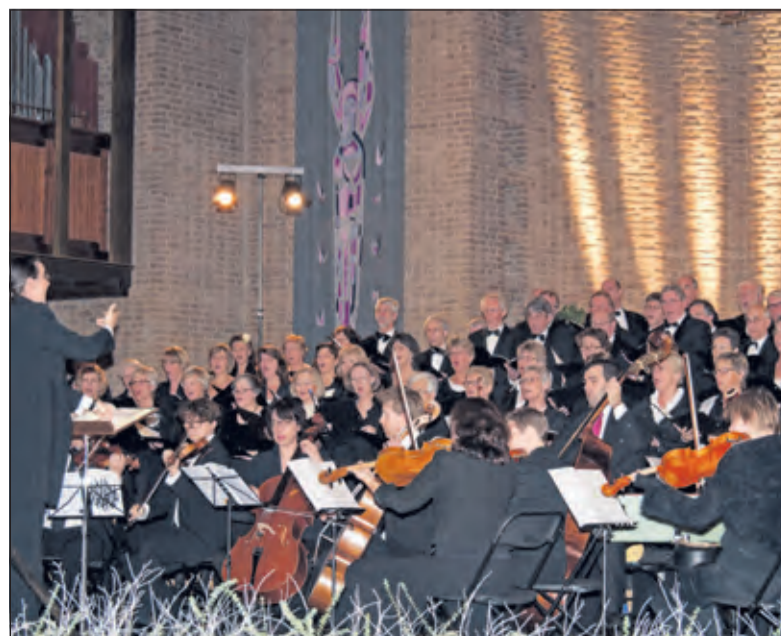
AZM pakt uit in april 2016.

te Maartensdijk. Info c.q. aanmelden: e-mail algemeenzangkoor-maartensdijk@gmail.com