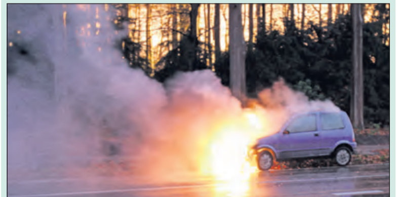
Auto in brand.

Een onoplettende automobilist reed daarna achterop de stilstaande politieauto, die geparkeerd stond met zwaailichten aan op de rechterrijstrook. De klap van de botsing was zo hard, dat de auto, die achterop de politieauto reed tegen de vangrails van de linkerrijstrook kwam. De bestuurder van de auto die tegen de politieauto reed kwam met de schrik vrij en liep geen letsels op. De Utrechtseweg was gedurende lange tijd richting Zeist afgesloten, waardoor een grote file ontstond. Het verkeer stond in file vanaf afslag uithof op de A28. [Reyn Schuurman]