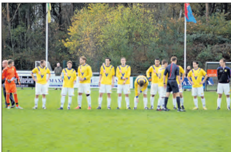
Spelers en arbiter begroeten elkaar.

SVM is - nu alle ploegen tienmaal aantraden - een goede middenmoter (15 pnt) en staat zeven punten