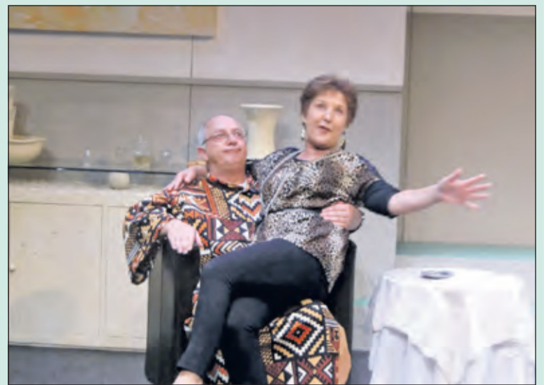
Op vrijdag 13 en zaterdag 14 november speelde Toneelvereniging Steeds Beter uit De Bilt in Het Lichtruim in Bilthoven een komedie van Carl Slotboom: 'Pension van lichte zeden'. Er was beide avonden sprake van een uitverkochte zaal en zowel het publiek als de uitvoerenden genoten.