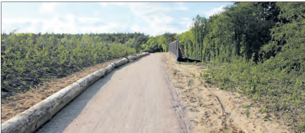
De nieuwe brug overspant de Utrechtseweg (N417) en heeft ook een fiets- en ruiterspad.