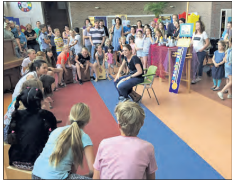
Als afsluitend onderdeel van de Kidsfair verzorgden leerlingen van groep 7 een djembé-sessie in de hal van de school.