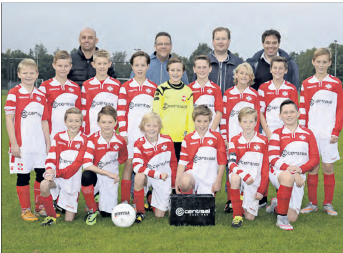
Uiteraard vieren de spelers en trainers / coaches na afloop een feestje.

Woensdag 11 mei werd FC De Bilt D3 kampioen door de wedstrijd tegen Kampong op overtuigende