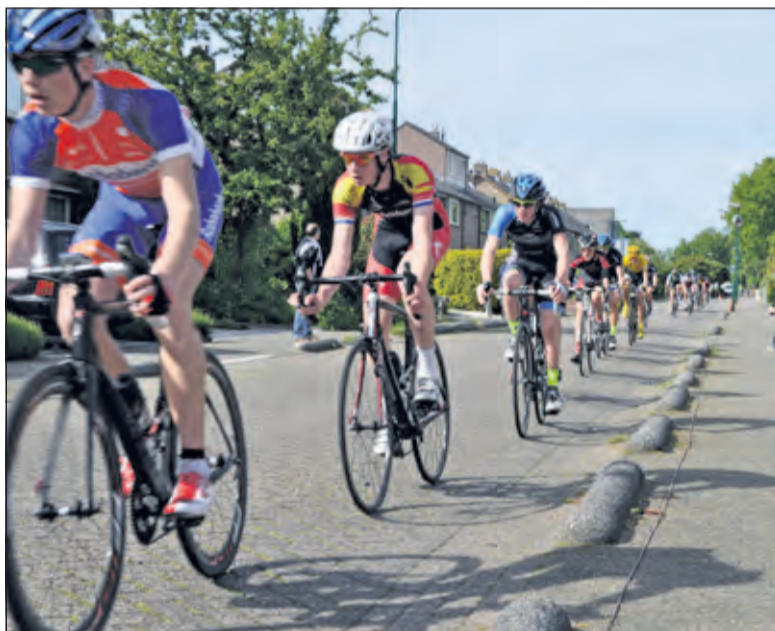
Komende zaterdag trekt weer een lang gerekt lint wielrenners door de straten van Maartensdijk tijdens de jaarlijkse wielerronde.