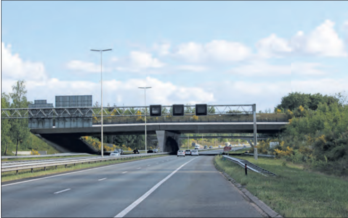
ProRail & Rijkswaterstaat legden het ecoduct over de A27 en de spoorweg Utrecht - Hilversum aan.