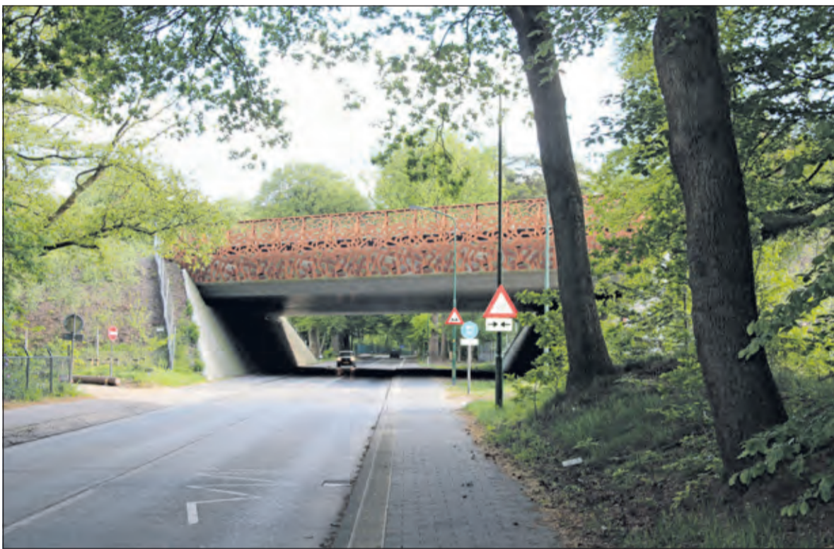
De natuurverbinding tussen het Gooi en de Utrechtse Heuvelrug is in maart 2016 afgerond. De nieuwe brug overspant de Utrechtseweg (N417) en heeft ook een fiets- en ruiterspad. Op 21 mei a.s. is de officiële opening van 11.00 tot 12.30u. van de ecoducten en toegankelijk voor publiek.

De informatieavond, die het Goois Natuurreservaat (GNR) in samenwerking met 'Samen voor Hollandsche Rading', dinsdag 10 mei in het Dorpshuis in Hollandsche Rading belegde, mocht zich verheugen op een ongekend grote belangstelling. Zo'n 200 inwoners waren naar het Dorpshuis gekomen. Er waren bij lange na geen stoelen genoeg. Zo'n 40 inwoners waren zelfs gedwongen de beraadslagingen buiten te volgen, dankzij een aldaar inderhaast geplaatste speaker.