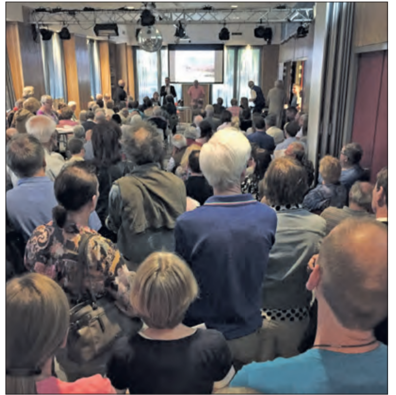
Een bomvol Dorpshuis in Hollandsche Rading.