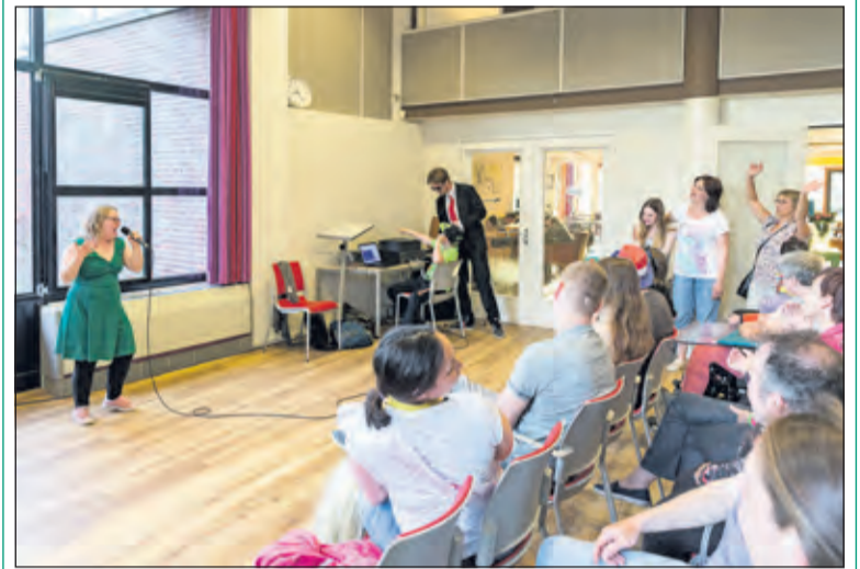
Enthousiasme in De Kroeg tijdens de playbackshow.

De volgende Kroeg, de avond van ontmoeten voor mensen met een verstandelijke beperking, is op vrijdag 3 juni aanstaande van 19.15 tot 21.15 uur. Er is dan live muziek, kijk ook eens op facebook De Kroeg De Bilt. [MD]