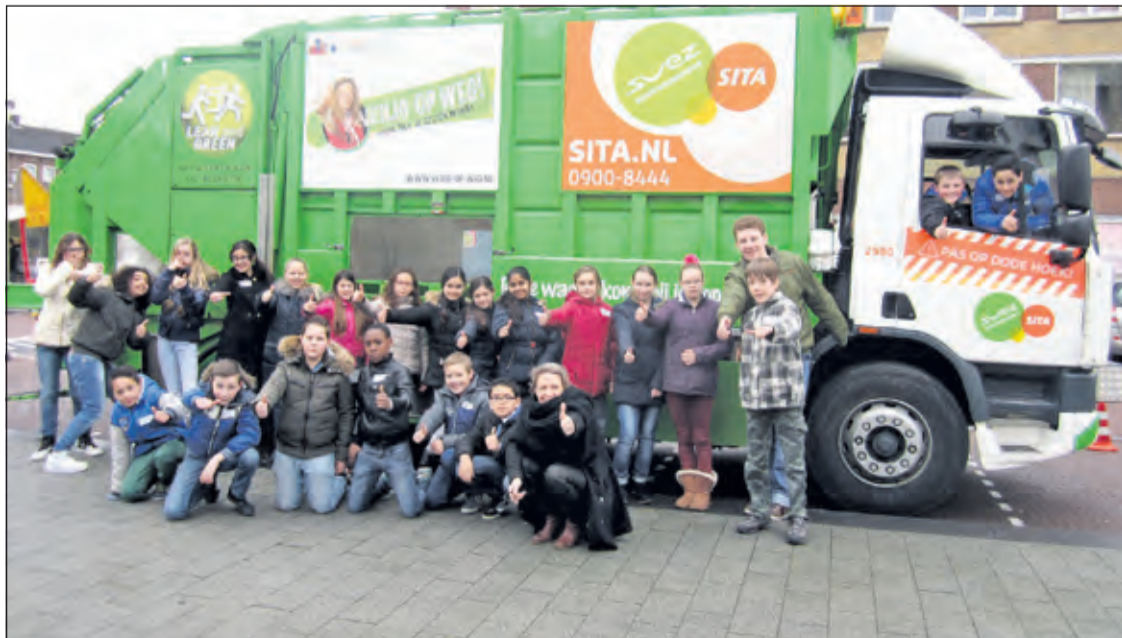
Groep 8b snapt nu dat je bepaalde posities rondom een vrachtauto beter kan vermijden.