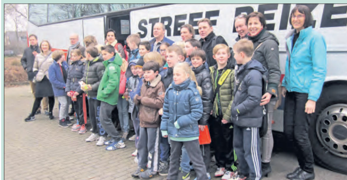
Met een touringcar vertrokken 40 tennissers van TV Tautenburg naar AHOY Rotterdam om een dagje te genieten van toptennis.