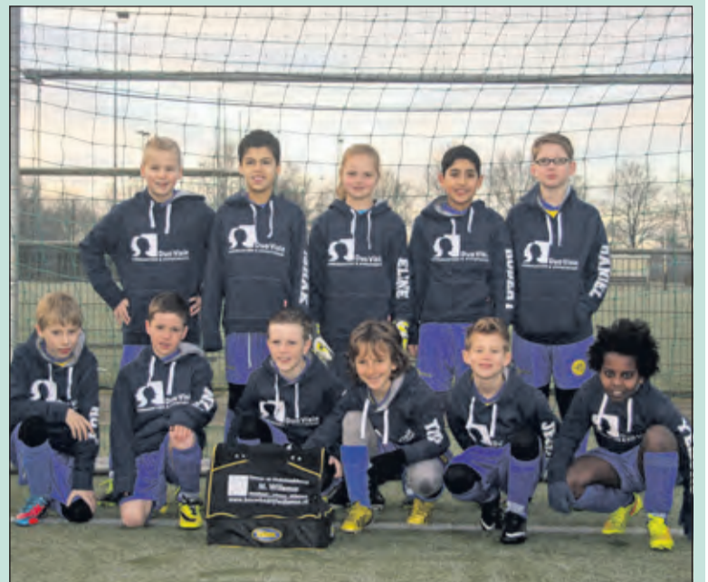
De spelers van de E3 wonnen de eerste wedstrijd in hun nieuwe outfit. Duo-Visie Assurantiën uit de Bilt en Bouwbedrijf Willemse uit Maartensdijk verrasten de jongens in prachtige truien met hun eigen naam erop en zorgden voor handige voetbaltassen.