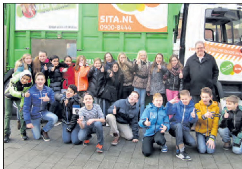
De kinderen van groep 8a weten het praktijkonderwijs wel te waarderen.