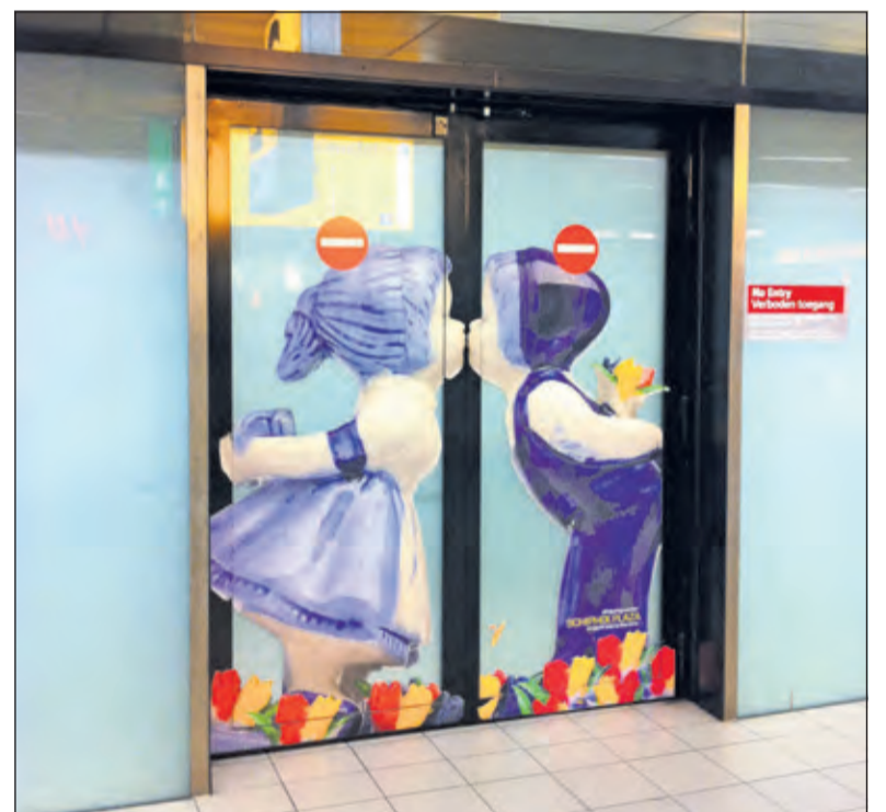
Deuren van Record kom je echt overal tegen.

Van de werknemers van Record wordt verwacht dat zij trots zijn op datgene wat zij doen. Er wordt dan ook ruim aandacht besteed aan de opleiding van, vooral ook, degenen die de werkzaamheden uitvoeren. Wijnstekers: 'Trots geeft je de kracht om iedere keer weer het maximale uit jezelf te halen. Hoe fijn is het niet om aan het einde van een project achterom te kijken