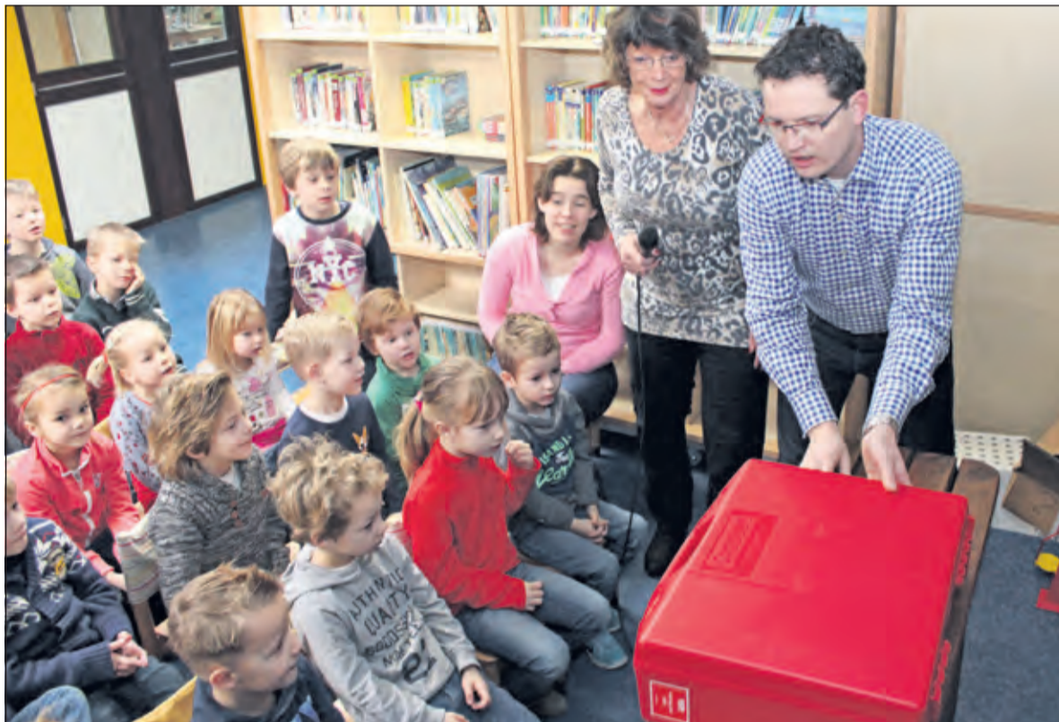
Eén koffer is geschikt voor 15 werkgroepen.