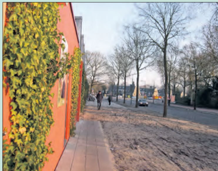
Langs de Leyenseweg en de Plus-supermarkt gaat het voetpad nu door het zand en bij slecht weer door de modder.