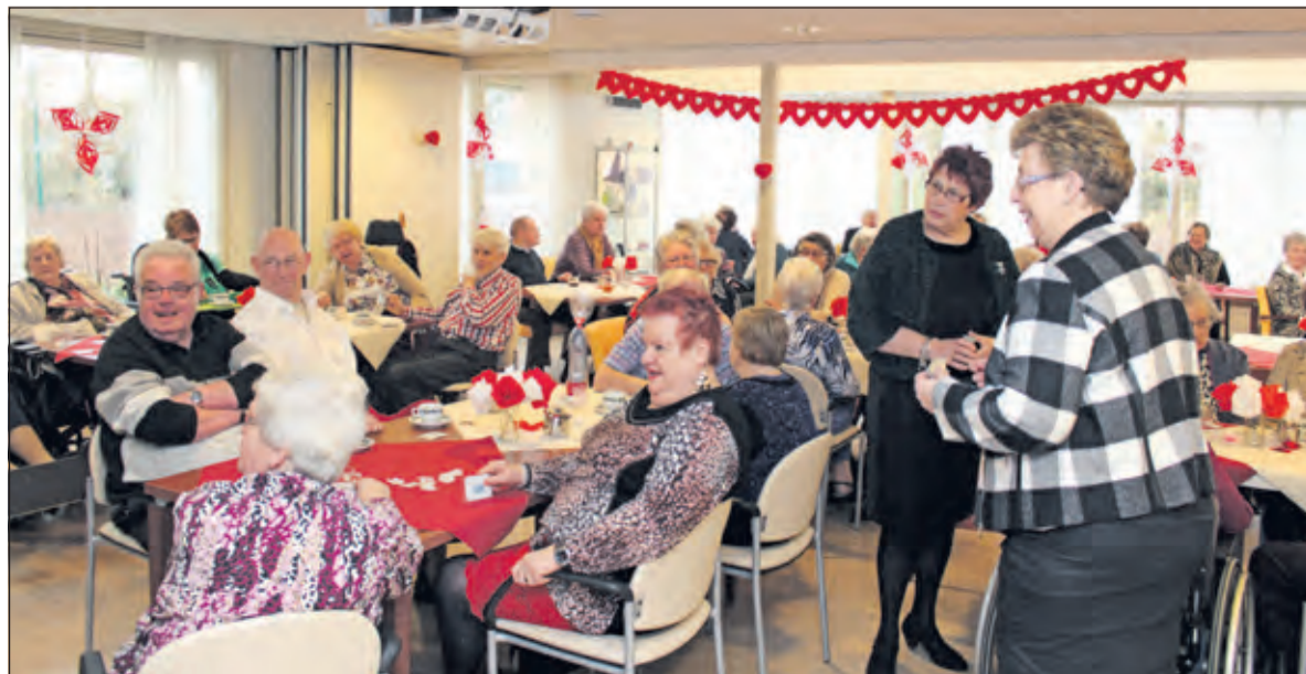
Vrolijke gezichten tekenden de door het rode Kruis georganiseerde middag.

Rode Kruis-bussen nodig om alle gasten te vervoeren. Na een aantal ronden Rad van Avontuur en een gezellige ontmoeting werd de middag afgesloten met een overheerlijk stamppottenbuffet. [HvdB]