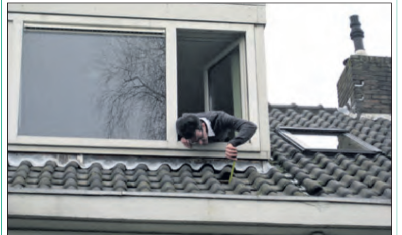
Geld verdienen door beter te isoleren.