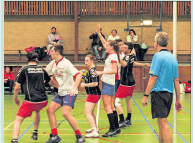
Een spelmoment uit de door Nova verloren thuiswedstrijd tegen Fortissimo.

Op 7 maart kan Nova in de herkansing. Dan dient er gewonnen te worden in de uitwedstrijd tegen Madjoe in Rijnsburg. De aanvang is 17.40 uur. [HvdB]