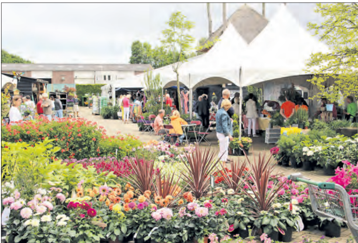
Met een aangename temperatuur en een zonnetje wordt het Hoogtzomer in Soest.

Er zijn op het terrein diverse plekken waar geproefd en gegeten kan worden en voor een uitgebreide hap is er De Kastelein, de binnen-herberg van 't Vaarderhoogt.