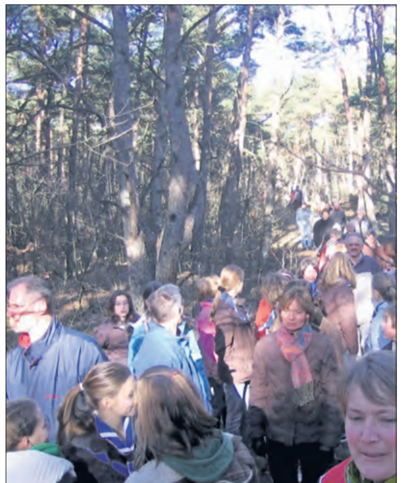
Demonstratieve wandeling in 2008 met zelfs sympathiserende deelnemers uit Amsterdam en Maastricht.

'Dat vastgoedhandelaren vele euro's verdienden door een dubieuze doorverkoop van een stuk van de Biltse Duinen aan particulieren, was iedere natuurliefhebber een doorn in het oog. Publiek gebruik van groen werd ingeruild voor het winstbejag van een enkeling'. Na een jarenlang gevecht is