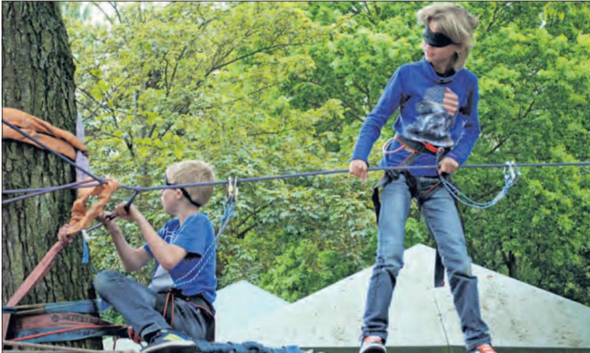
Samenwerking op hoog niveau bij bootcamp.

Verder was er een klimparcours, een bootcamp en een algemene sport- en spelclinic. Er stond ook een altijd aantrekkelijke stormbaan op het schoolplein en op het programma. Het feest startte aansluitend aan de uittijden van de basisscholen Kievit en Martin Luther King (Nicole Quadackers)