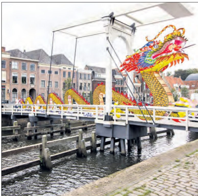
Eén van de geëxposeerde foto's.

Het thema verwarring is niet eenvoudig en laat zich van veel kanten benaderen, hoe dat gedaan is kunt U zien op de expositie. Meer foto's zijn te zien op de site van de club: www.fotoclubbilthoven.nl