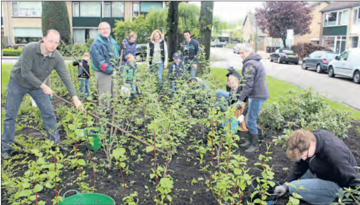
Bewoners aan het Willem Alexanderplantsoen in Maartensdijk onderhouden het voor hun woningen gelegen plantsoen.

Mensen die al dan niet samen met buurtgenoten een stukje groen willen adopteren, vinden alle informatie op de gemeentelijke website door 'groenadoptie' in te typen in het zoekvenster. Aanmelden kan ook door een Melding Openbare Ruimte te doen via de homepage van de gemeentelijke website debilt.nl. Een medewerker neemt daarna contact op om de wensen en mogelijkheden te bespreken. De afspraken worden schriftelijk vastgelegd.