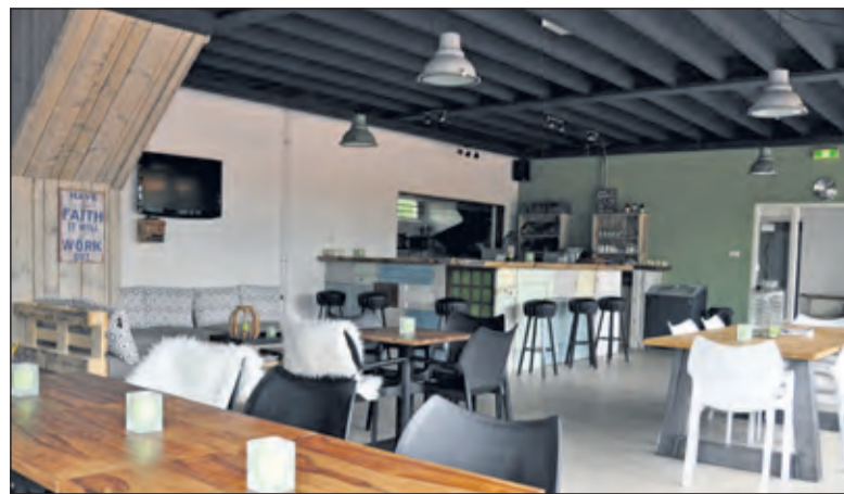
In de 'huiskamer' van de tennisvereniging is het inmiddels goed toeven.