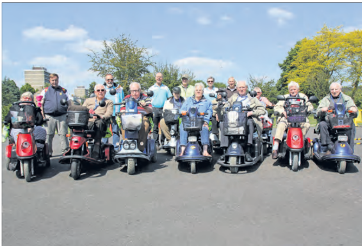
Deze deelnemers aan de scootmobielttraining kunnen veilig op pad.

Bij voldoende belangstelling vindt op woensdag 16 september weer een training plaats.