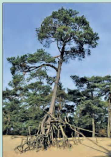
Flora en fauna in Het Panbos is de moeite waard om te bekijken. (foto Utrechts Landschap).

Op zondag 21 juni organiseert Utrechts Landschap een natuurwandeling over het natuurgebied 'Het Panbos'. De gids vertelt over de ontwikkelingen van de afgelopen jaren in dit natuurgebied. Aan de orde komen het realiseren van meer heidegebieden op de Utrechtse Heuvelrug en de invloed daarvan op de ontwikkeling van flora en fauna. De wandeling begint om 14.00 uur en duurt ongeveer anderhalf uur. Vooraf aanmelden is niet nodig. Deelname is gratis. Het startpunt van de wandeling is bij de parkeerplaats aan de Jozef Israëlslaan in Bosch en Duin.