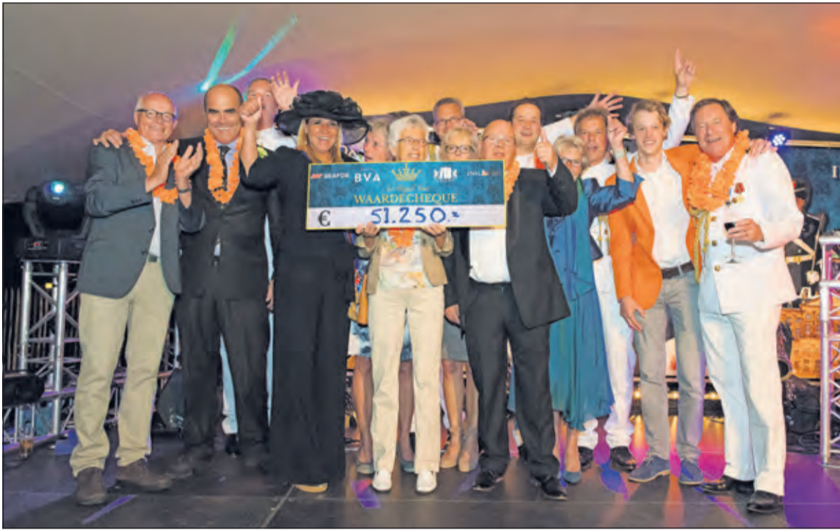
Overhandiging cheque, door 'Koningin Maxima', aan vertegenwoordigers van de vier Biltse organisaties, geflankeerd door de mannen van de Rotary.