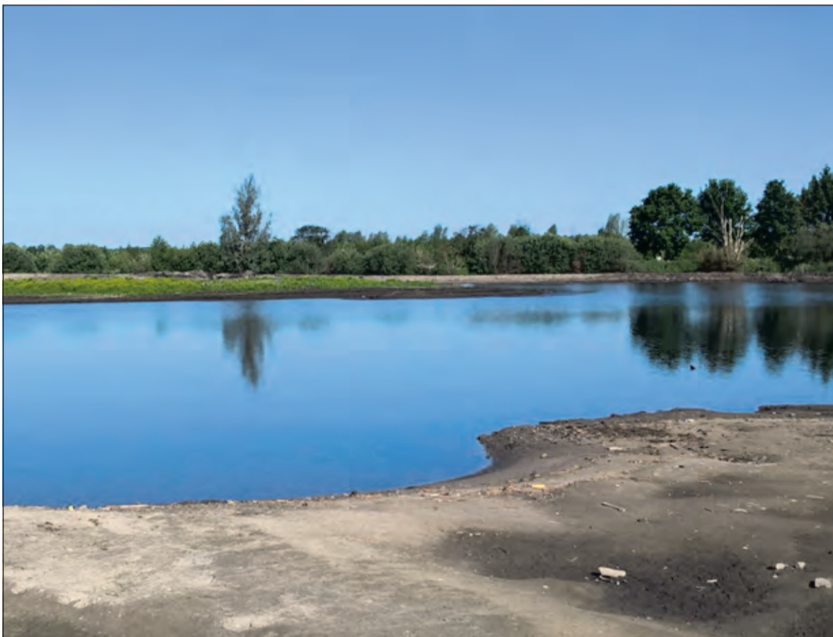
Het weer werkt goed mee om het compartiment droog te laten vallen.