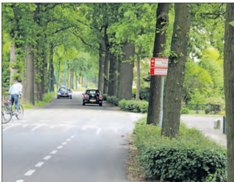
De fietsoversteek bij de Nachtegaallaan wordt aangepakt.