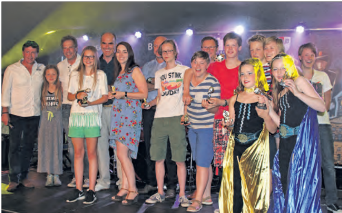
V.l.n.r. de jury, de eerste, tweede en derde prijzenwinnaars

Het Nieuwe Lyceum heeft de tweede versie van Bilthoven's Got Talent gewonnen met een indrukwekkende weergave van het liedje 'Impossible' van James Arthur. Ze werd op de piano begeleid door Maria de Bruin. De tweede prijs werd gewonnen door de band 'High Five', de schoolband van het USG, met een eigen geschre-