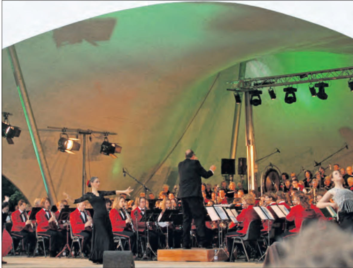
Aankomend weekend sluit het Groot Harmonieorkest het feest op bijzondere wijze af.

Om dit spectaculaire muziekweekend een week voorafgaand aan het evenement nog eens extra onder de aandacht te brengen, werden afgelopen zaterdag 13 juni diverse optredens verzorgd door leden van de Koninklijke Biltse Harmonie. Op verrassende wijze verschenen uit onverwachte hoeken binnen en buiten de gemeente De Bilt al musicerend diverse muzikanten. Het begon allemaal op de Julianalaan in