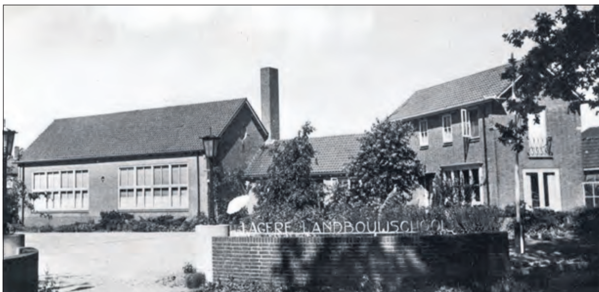
Cor begon als leraar op de Lagere Landbouwschool aan de Maartensdijkse Dorpsweg.

Sinds een aantal jaren woont Remke nu volledig rolstoel-gebonden in De Beukenhof in Loosdrecht. Maar Remke is niet zielig, wil niet zielig zijn maar verdient, meer dan veel anderen, een duw in de rug als een soort opkikker'. Het boekje is vanaf nu te koop bij Bruna in Loosdrecht en Primera in Maartensdijk.