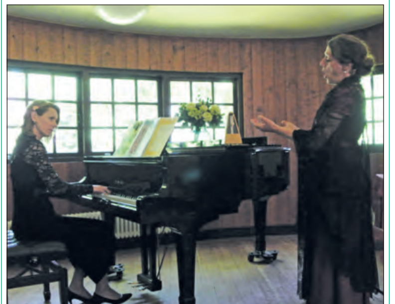
De beide dames namen het publiek mee in het turbulente leven van deze bijzondere componiste.