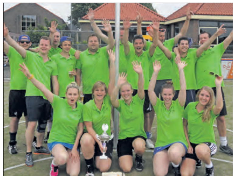
De spelers die deze dag met elkaar het team vormden (inclusief enkele enthousiaste spelers van Kikkertje 2).

De 30e editie van het Rabobank Stratenkorfbaltoernooi in Westbroek startte zaterdag 13 juni met wat druppels, maar al snel brak gedurende de dag het zonnetje door. In de finale stonden de wijk 't Opperend tegen een nieuwkomer Kikkertje 1. Na een spannende wedstrijd won het Kikkertje uiteindelijk met 2-1 en werd hierdoor winnaar van het toernooi.