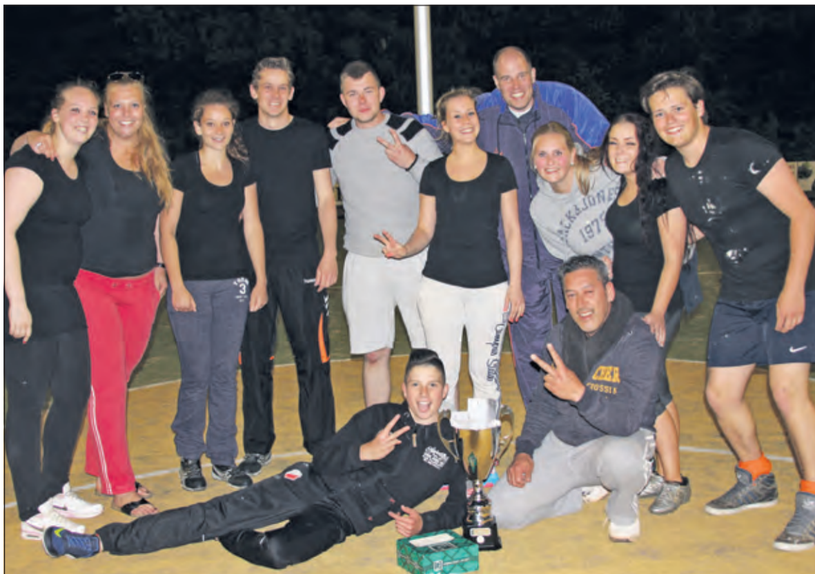
Het was Cafeteria Peet er alles aan gelegen om de cup met de grote oren nog een jaar op de toonbank te hebben prijken.

wachte winnaar de Master Beren: een groep studievrienden die al jaren meedoen en op dit toernooi hun enige korfbalervaringen opdoen. Voor alle deelnemende teams was er een heerlijke taart van Bakkerij Bos.