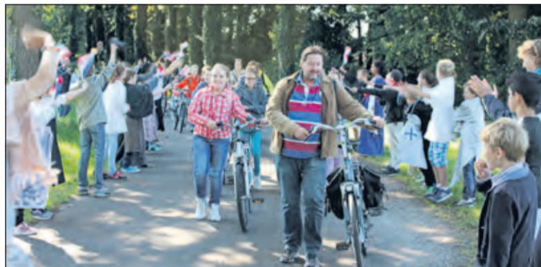
Leerlingen van de Julianaschool verwelkomen de leerlingen van de Patioschool op de tegenover Eyckenstein gelegen Oude Gezichtslaan.

strijkbouten van vroeger door een kachelletje warm gemaakt werden en dat de moderne variant met kooltjes werd gevuld. Daarna kwamen we de tuinmannen tegen en zijn we op de foto gezet. Na afloop kregen we wat limonade en een koekje. Het was interessant en leuk'.