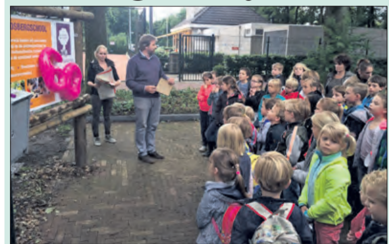
Wie op de fiets door het weiland tussen Maartensdijk en Hollandsche Rading rijdt, vindt -rustig gelegen aan de rand van de natuur - de Bosbergschool. De kleine dorpsschool bestaat dit schooljaar zestig jaar, reden voor diverse feestelijkheden de komende periode. Het startschot werd maandagmiddag gegeven met de onthulling van het nieuwe informatiebord. (Hilda Ritma)