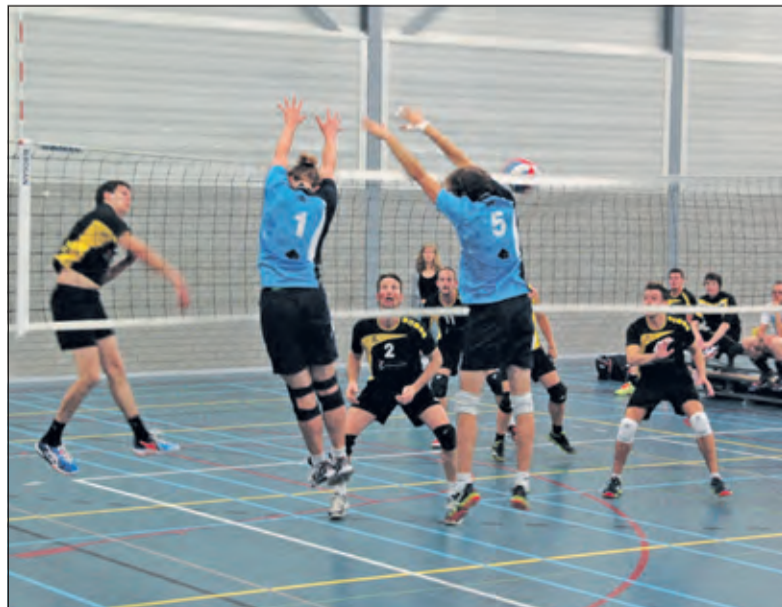
Heren 1 van Irene haalt alles uit de kast in de driekamp.

Zaterdag 19 september start de reguliere competitie van Irene volleybal met voor Heren 1 in de 2e divisie een uitwedstrijd in Rijswijk tegen Inter Rijswijk. (Erik Vos de Wael)