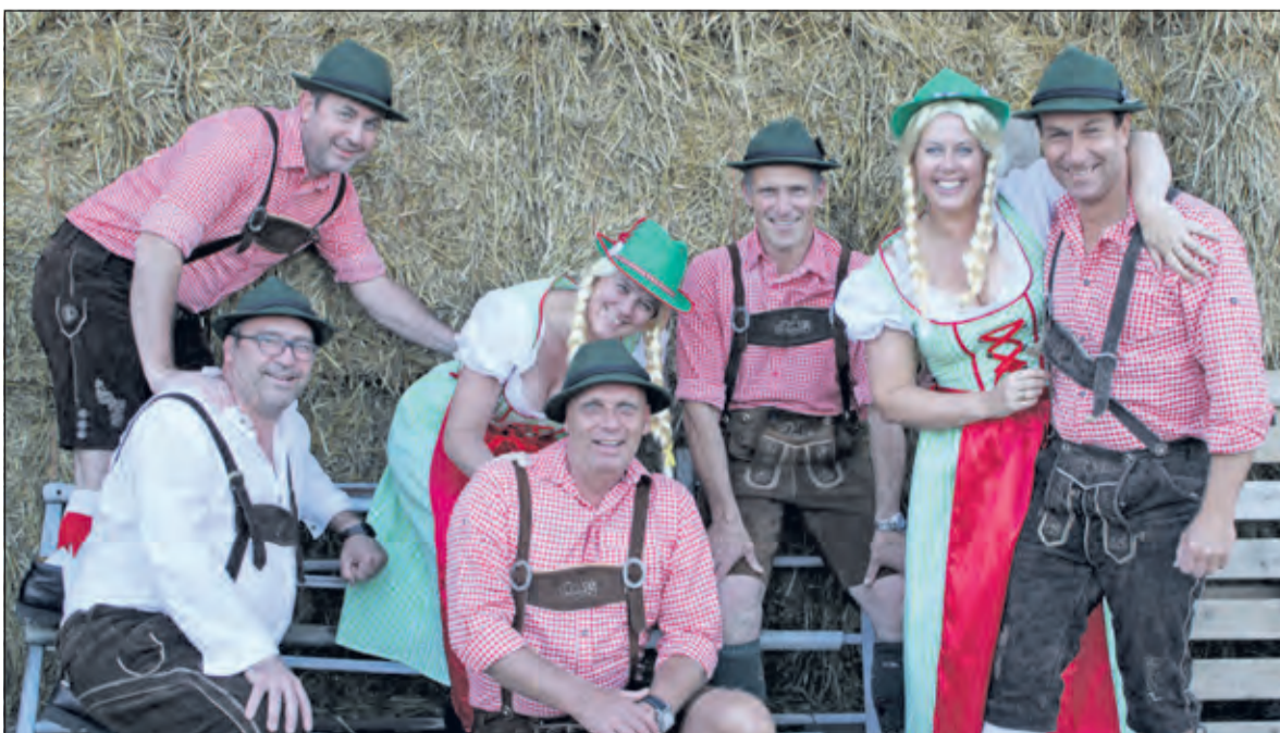
De Local Heroes zijn er klaar voor.

Wie er zelf ook bij wil zijn kan een e-mail sturen localheroesdebilt@gmail.com om kaarten te bestellen. Dat kan een tafel voor acht personen zijn maar individueel aanschuiven kan ook. Het arrangement bevat een halve kip en een gevulde Local Heroes bierpul (collectors item) en een hele avond passende entertainment.