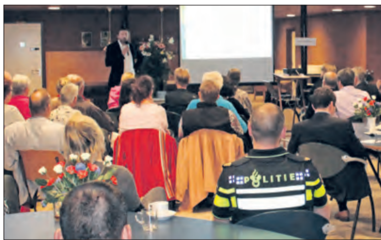
Omwonenden en andere belangstellenden stelden kritische vragen over de parkeerdruk.