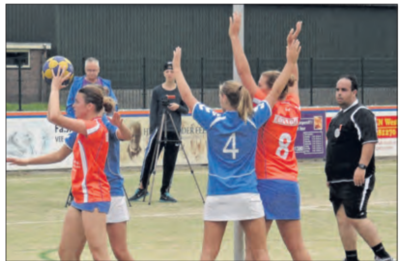
Dos laat zich niet van de wijs brengen.

DOS behoudt haar ongeslagen status en blijft medekoploper. Volgende week wacht een uitwedstrijd tegen het nog puntloze Duko in Duiven. Aanvang is om 15.30 uur. Ook DOS 2 blijft koploper dankzij een 13-4 overwinning op Nova.