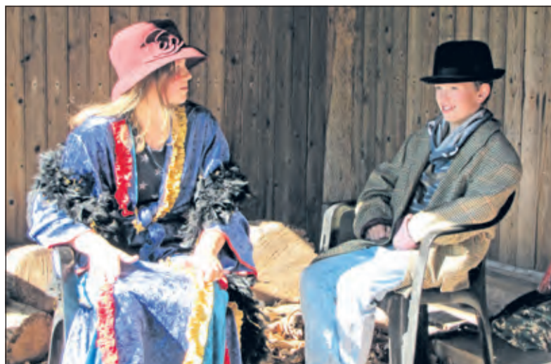
De Baron en Barones.