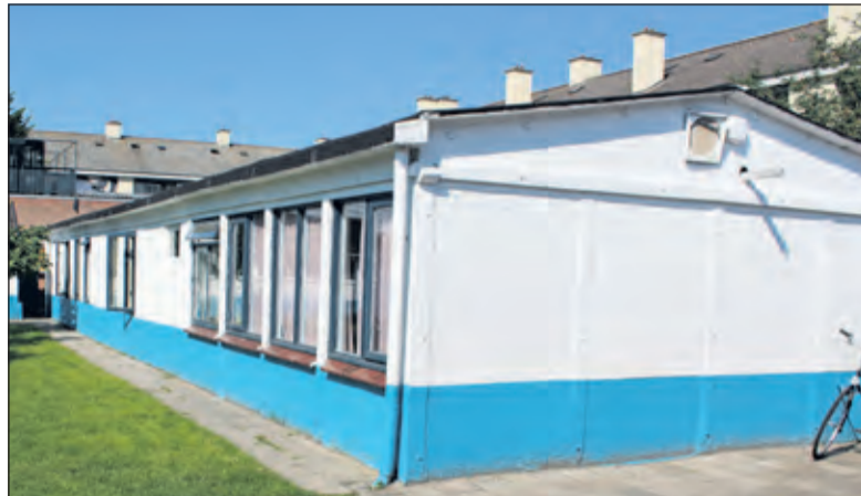
De oude ontmoetingsruimte aan de Biltse Troelstraweg.

Maikel Haman (stedenbouwkundige gemeente) behandelde de inpassing in de omgeving en vertelde over parkeer(on-)mogelijkheden en verdere voorzieningen. Middels een PowerPointpresentatie werd een indruk gegeven van het ontwerp, zowel van binnen als van buiten. Het centrum is te vergelijken met het bouwwerk in de gemeente Nieuwegein, maar dan zonder koepel. Het wordt een moderne moskee met een bescheiden minaret (13 meter hoog) en een roodachtige kleur, die past bij de gebouwen in de omgeving. Het gebouw is ruim twintig meter lang en ruim twintig meter breed. Het heeft een begane grond, een eerste en een tweede verdieping. El Hadoute: 'Overdag wordt de moskee niet druk bezocht. Het drukste moment zal op vrijdag tussen 12.00 en 15.00 uur'. De buurt denkt ook dat vooralsnog daar een probleem ligt, omdat vrijdags het er al druk is