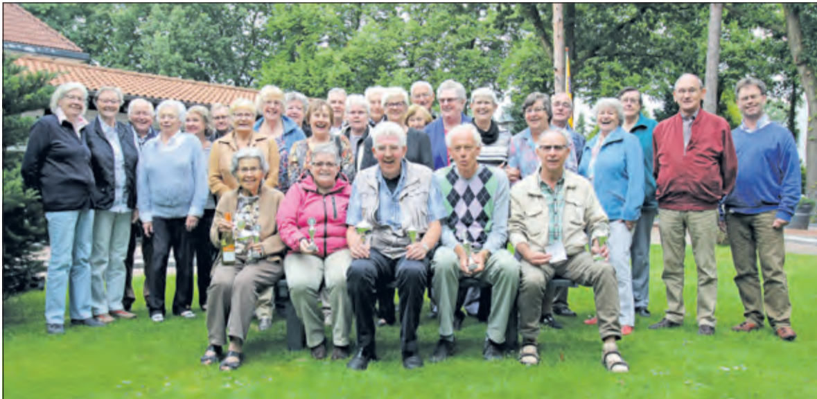
De enthousiasme deelnemers aan de 45ste editie van het Midgetgolftoernooi.

Dinsdag 8 september werd de 45e editie van het senioren midgetgolftoernooi op de banen van Midgetgolf Bilthoven gespeeld.