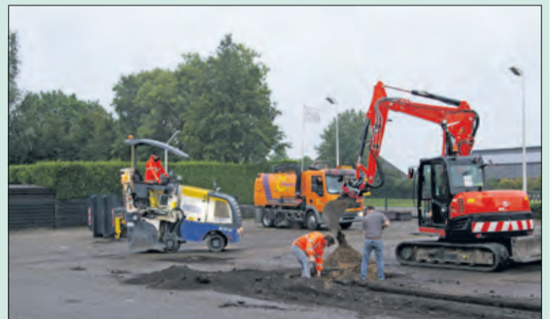
Veldhuizen Wagenbouw viert 26 september het 35-jarig bestaan met een open dag op de vestiging in Groenekan en Loosdrecht.