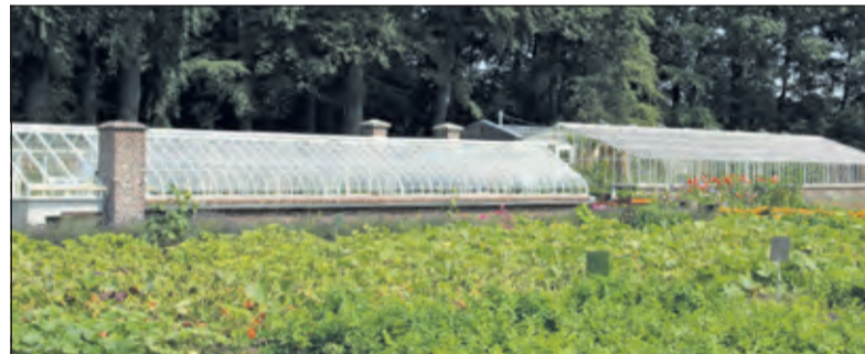
In de moestuin bevinden zich twee bijzondere kassen, die beiden zijn opgenomen in de lijst Rijksmonumenten.

De kassen waren al jaren in slechte staat. Het was bij storm te gevaarlijk geworden om in de kassen te komen vanwege mogelijk vallend glas. Dit jaar kon de lang gekoesterde restauratiewens in vervulling gaan. Beide kassen hebben een zeer grondige restauratie ondergaan en zijn vanaf de grond opnieuw opgebouwd zoveel mogelijk met de oude materialen. Alles is uit elkaar gehaald en gerestaureerd. Ze staan er weer stralend bij.