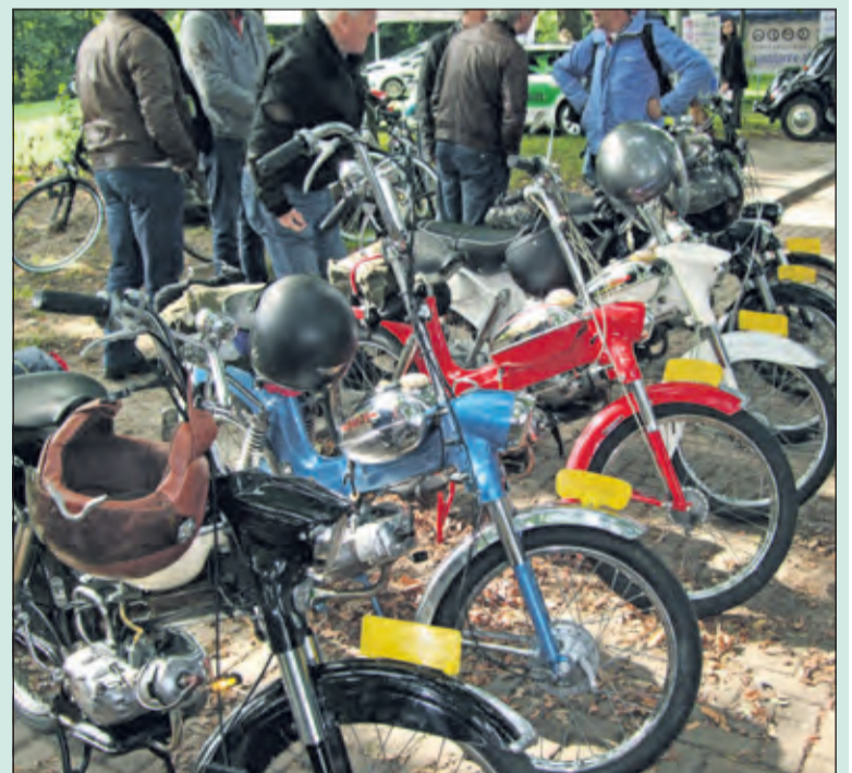
Goud van oud: Puch en Tomos uit de jaren 50 en 60.