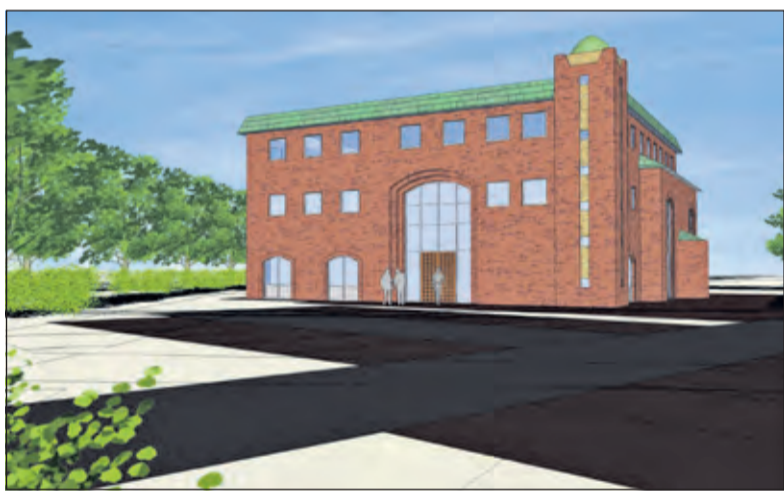
Schetsontwerp van de nieuw te bouwen moskee.

We nemen de opbrengst van de bijeenkomst zeker ter harte bij de verdere uitwerking. Ik heb er alle vertrouwen in, dat de moskee een goede rol in de wijk zal vervullen, net zoals in De Bilt. Fijn te merken hoe de moskee zich inzet om er ook in Bilthoven een succes van te maken, samen met de gemeente en de buurt.'