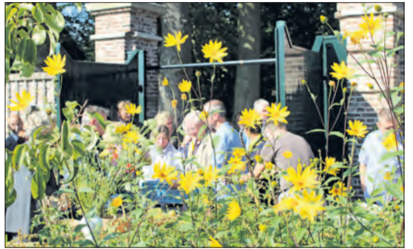
Het gezelschap betreedt de Tuinderij.

Royale bijdragen overheden en fondsen alsmede particuliere giften via de stichting Vrienden van Eyckenstein maakten de restauratie mogelijk. Enkele reparaties die echt niet konden wachten, waren eerder al aangepakt, zoals de deur van de Druivenkas (kosteloos uitgevoerd door Jan de Haan van KlusWijs) en de tussenuitvoering met de Oranjerie (door enkele vrijwilligers). De restaurateur heeft ook nog bijdragen daaraan geleverd. De Stichting Vrienden van Eyckenstein ondersteunt de eigenaar bij het werven van fondsen en vrienden om zo het kostbare beheer en behoud van het landgoed mogelijk te maken. Meer informatie: www.vriendenvaneyckenstein.nl . De kassen zijn tijdens openingstijden van Tuinderij Eyckenstein te bezoeken. Op woensdagmiddag en zaterdag wordt de oogst verkocht in de kraam bij de poort. Dit seizoen nog t/m 18 oktober. Meer informatie www.landgoedgroenten.nl .