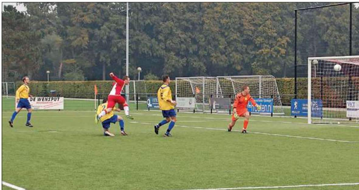
De keeper heeft het nakijken.