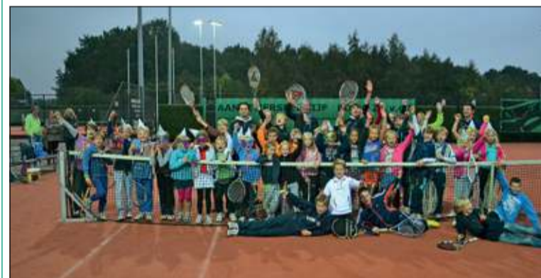
35 kinderen in de leeftijd van 6 t/m 13 jaar traden aan op de FAK-jeugddag.

Zaterdag 12 oktober was de eerste FAK dag voor de jeugd. In het kader van tennis waren er allemaal spelletjes bedacht door de trainer Toon: van het ballenkanon tot balbeheersing door een parcours af te leggen moesten de kinderen in 6 verschillende leeftijdsgroepen langs de banen om verschillende tennisspelletjes te doen. Na de spelletjes werd er gegeten. Door de regen werd het avondprogramma iets omgegooid. Eerst de disco en dan toch maar naar buiten voor het geluidsspel. Regen of niet: de kids hadden er erg veel plezier in. (Pieter Keuning)