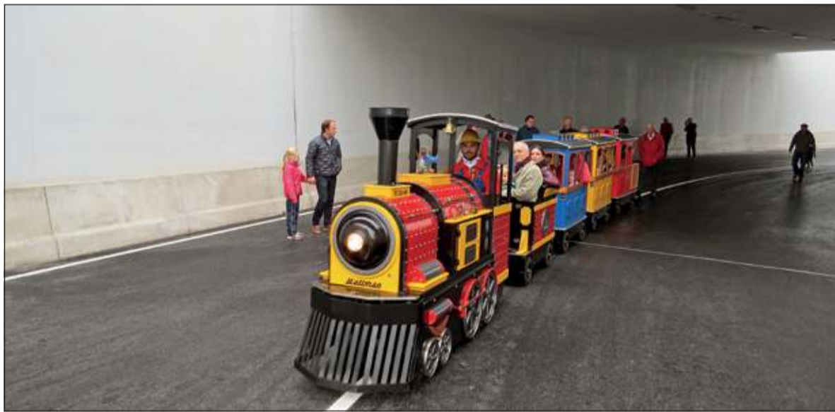
Ook in de nieuwe tunnel rijden op deze openingsdag treinen.

Het werd een unieke gezellige dag met allerlei activiteiten. De opmerkingen over de tunnel waren over het algemeen positief. De meesten vonden de tunnel mooier dan ze gedacht hadden. Sommigen vonden de helling te stijl en de bocht wat kort en vreesden voor ongelukken. Iemand anders vond de witte muren wel een grote uitdaging voor graficafiters.