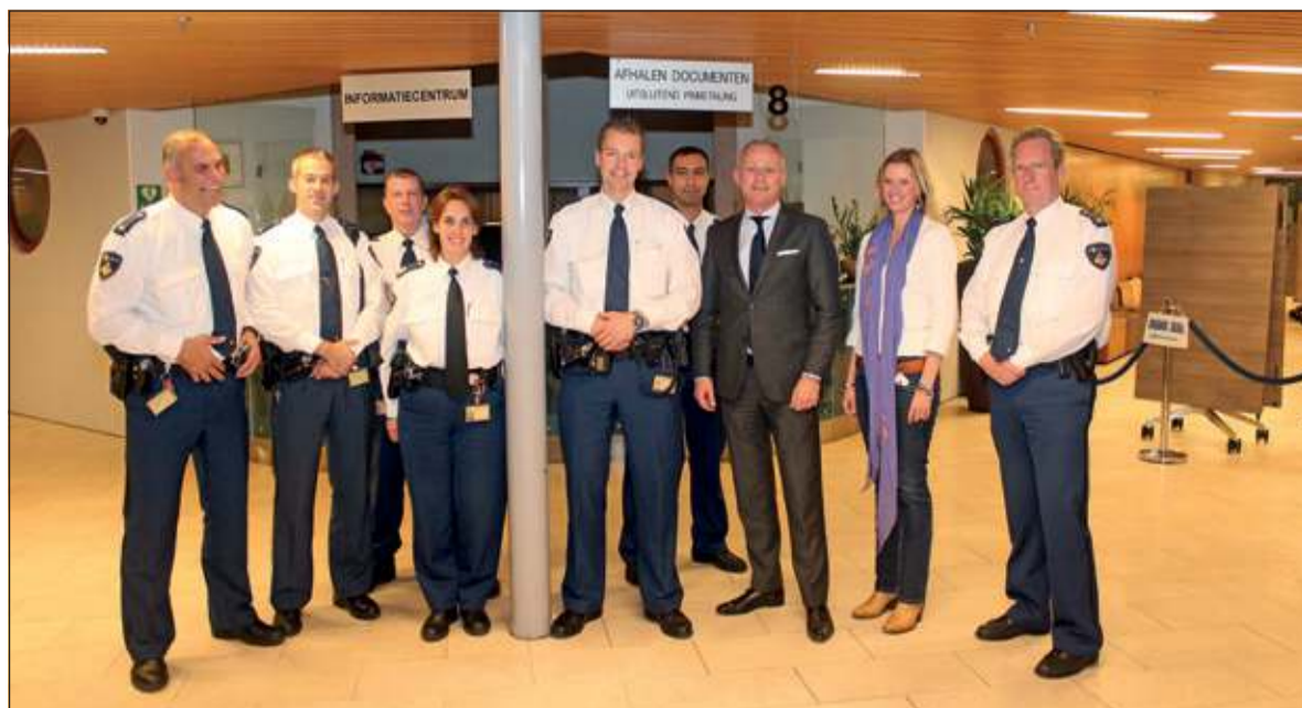
De clinic werd georganiseerd door de gemeente De Bilt samen met leiding en wijkagenten van de politie.

vindt: 'Bij afwijkend gedrag, niet verklaarbare aanwezigheid in de wijk, afwijkende kleding en vermijden van contact'. Met het vertonen van filmpjes werden de aanwezigen getraind in waakzaam en dienstbaar zijn: 'Herkent u enige personen met slechte intenties en herkent u gedrag dat afwijkt en niet past in de omgeving?' Er werden adviezen gegeven hoe te handelen wanneer afwijkend gedrag werd geconstateerd en hoe daardoor mogelijke inbraak kan worden voorkomen. Tenslotte werd de gang van zaken toegelicht, wanneer er iemand 112 heeft gebeld en hoe zo iets wordt afgehandeld en teruggekoppeld. Zowel aan het begin als aan het eind van de clinic werden de aanwezigen getraind door middel van filmpjes.