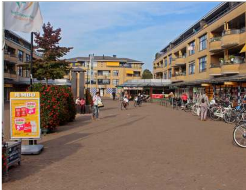
Op 11 oktober zijn er leuke activiteiten voor jong en oud op het Maertensplein.

Bij kwaliteitsslagerij Zweistra is het wildseizoen weer geopend. Zaterdag 11 oktober van 11.00 tot 14.00 uur hernieuwt men de kennismaking met het wildassortiment, bestaande uit o.a. hertenbiefstuk van het Europese wilde hert, wild zwijn en diverse stoofgerechten. Landwaart Culinaire laat olijfolie proeven en laat de bezoekers kennismaken met nieuwe dressings zonder verkeerde E-nummers, waar de lekkerste salades mee gemaakt kunnen worden, in 6 variaties gemaakt met groenten en fruit.