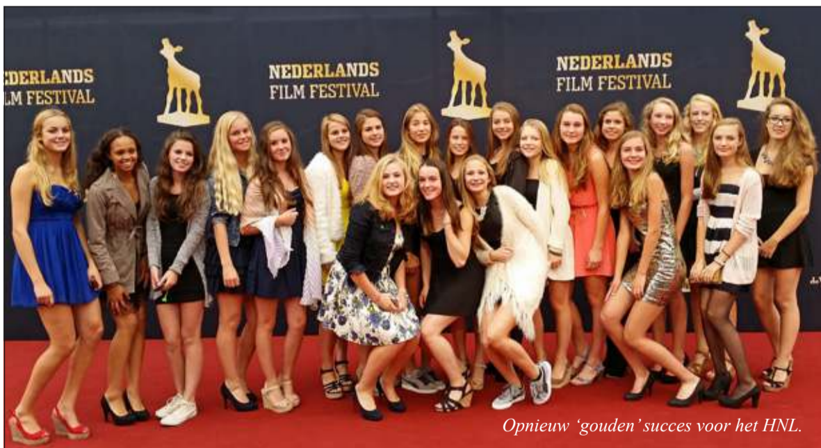
Opnieuw 'gouden' succes voor het HNL.