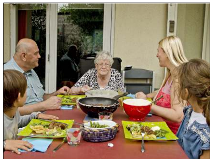
Gezellig aanschuiven bij iemand in de buurt.

Wie een of meerdere keren per maand een oudere als vaste een gast aan tafel wil ontvangen kan zich ook aanmelden via 030 2213498 of info@eetmee.nl. Ook zij worden bezocht om hun wensen te inventariseren. Datum, tijd en frequentie worden in onderling overleg geregeld; na het eten gaat de gast weer naar huis. Na twee maanden bespreekt de Stichting Eet Mee! met beide partijen hoe de match bevalt. Informatie: coördinator Annelies Kastein, Mail: info@eetmee.nl, Tel: 030 2213498, Web: www.eetmee.nl