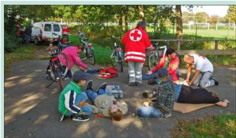
Eerste hulp tussen de velden van SVM en Tweemaal zes. (Lees meer op pag. 13)