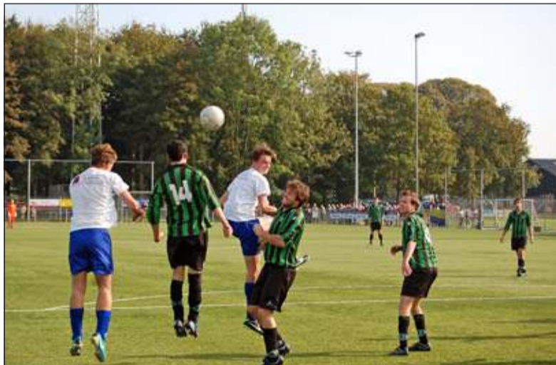
SVM bleef ook in de thuiswedstrijd tegen het Utrechtse Voorwaarts ongeslagen.

Dijk zette de 4-1 eindstand op het scorebord. SVM 2 won met 4-3 van Desto. Zaterdag gaat SVM 1 op bezoek VSC aan de Utrechtse Koningseweg.