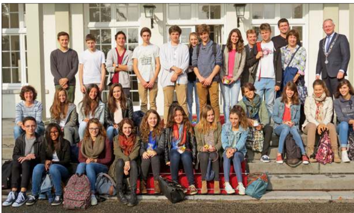
Een groepsfoto op het bordes van gemeentehuis Jagtlust.

ingegaan op de verschillen tussen Nederland en Frankrijk in het lokale bestuur. Hier wordt de burgemeester benoemd, in Frankrijk door de raad gekozen. Ook was er een vraag over de bouw van de tunnels in Bilthoven waarbij de burgemeester de geschiedenis van de spoorlijn schetste en de noodzaak om de tunnels te bouwen. Het werd een geanimeerde bijeenkomst en de scholieren kregen als presentje Nederlandse stroopwafels.