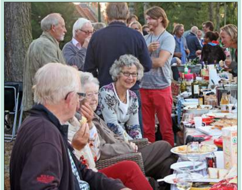
Voor de bewoners van de 80-jarige Röntgenlaan was Burendag een prima dag voor een feestje in de straat.

'Buren vinden burens voor een activiteit' werd genoteerd op een groot prikbord. Zo zijn er inschrijvingen om eens met elkaar te eten. Ook zijn er mensen die best een buur eens willen helpen. Er is ook animo voor het organiseren van een huisconcert met musicerende straatgenoten. En niet te vergeten vraag en aanbod 'oppas'. Menigeen verbaasde zich over de grote hoeveelheid kinderen in de straat. Toen na twaalfen de drank op was en de laatste mensen de straat leegruimden, constateerde men dat er volgend jaar best weer een feestje gebouwd kan worden en dat er geen redenen zijn te wachten tot een volgend lustrum. (Tineke Snel)