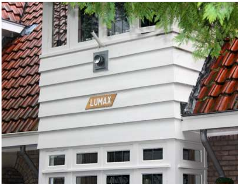
Dr. Julius Röntgenlaan nummer 26 heet weer Lumax.

De huidige generatie bewoont het in 1933 gebouwde huis vanaf 1947: 'Ook andere huizen in deze omgeving droegen namen, maar die zijn in de loop der jaren overgeschilderd. Ook hier is het er een tijdje van af geweest, maar bij een recente schildersbeurt hebben we de naam opnieuw er op laten zetten. Er is geen enkele relatie met de naam en de bewoner. De naam stond er opgeschilderd en wij vonden het leuk om die naam er opnieuw aan te geven'.