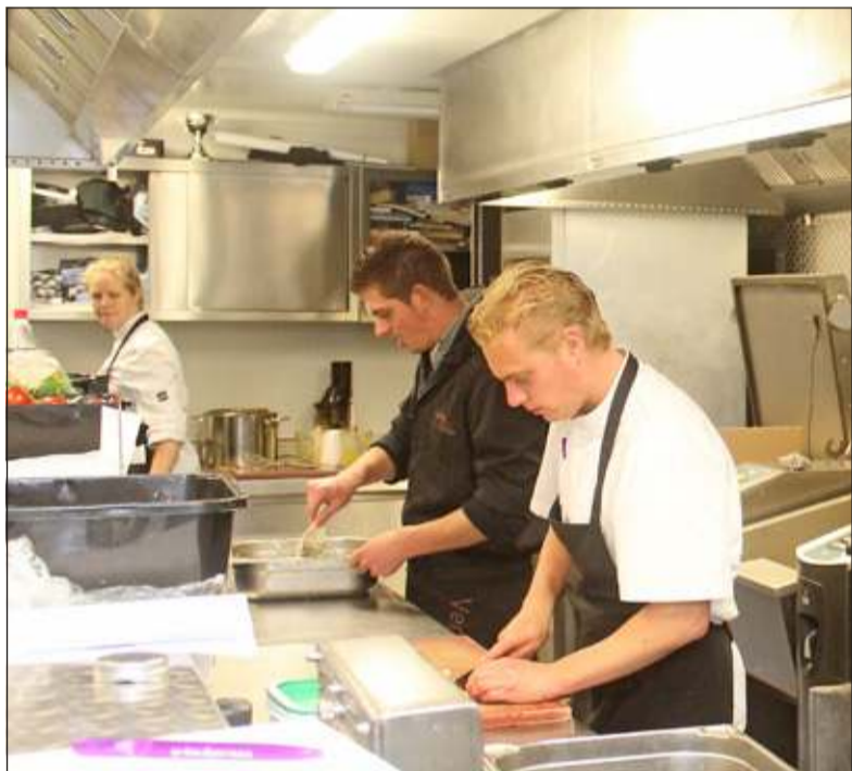
Een kijkje in de keuken van Landwaart. Waar al het lekkers vandaan komt.