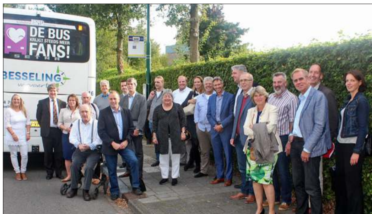
Voorafgaand aan de bijeenkomst was er voor het gezelschap een rondgang door het gebied.