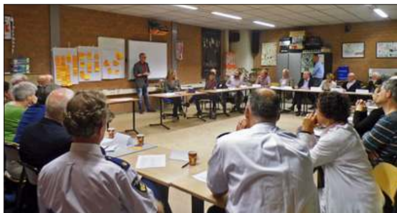
Platform Respectvol Samenleven De Bilt blijft bestaan.

stand gehouden worden', 'Waarom zou het in deze vorm opgeheven moeten worden' en 'Wanneer je kijkt met een helicopterview naar de werkzaamheden van het Platform wat zou dan je advies zijn voor de toekomst?'. De antwoorden werden vervolgens zoveel mogelijk geclusterd en toegelicht waarna de discussie begon. Duidelijk was dat de groep jeugd ontbreekt. Dat het wellicht handig zou zijn om per jaar te kiezen voor één thema. Werken aan een grotere naamsbekendheid. Inspringen op spanningen in de samenleving. Uiteindelijk werd gezamenlijk gezocht naar de rode draad. Die werd gevonden in - Ga door maar herbezin je -. De kerngroep neemt alle adviezen en suggesties meenaar hun overleg op 8 oktober.