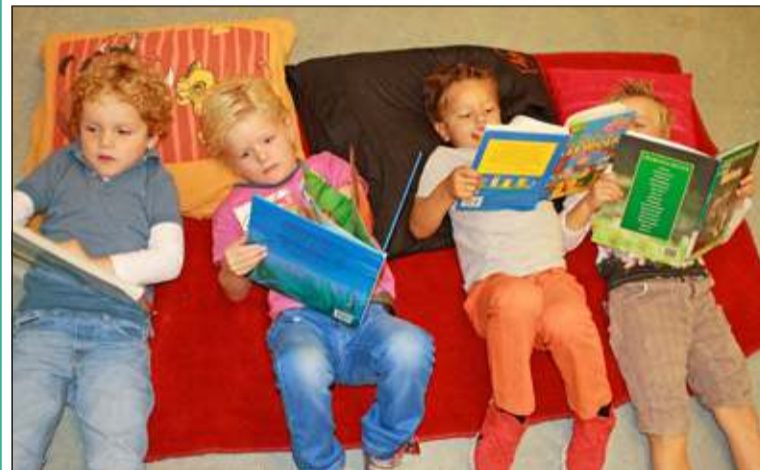
Lekker-lezen-op-je-eigen-kussen-moment. (foto juf Daphne)