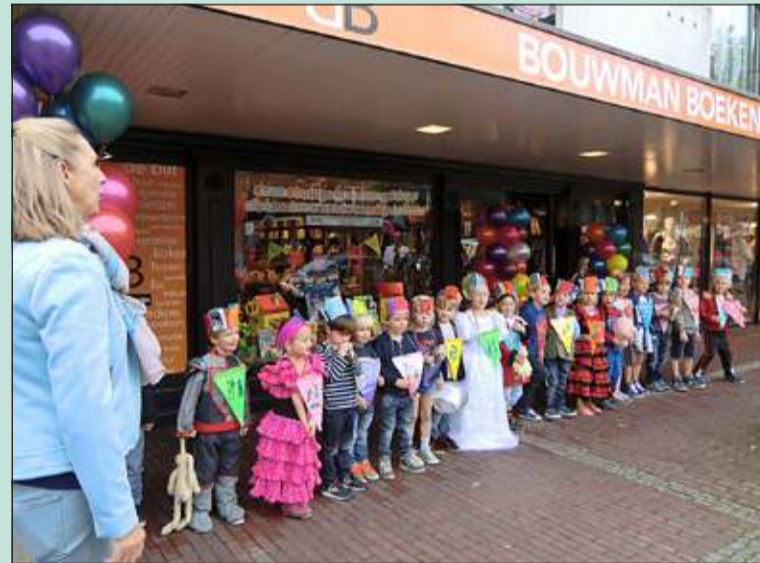
Woensdag 1 oktober stonden alle kleuters klaar om de etalage te bekijken en om de Kinderboekenweek te openen.