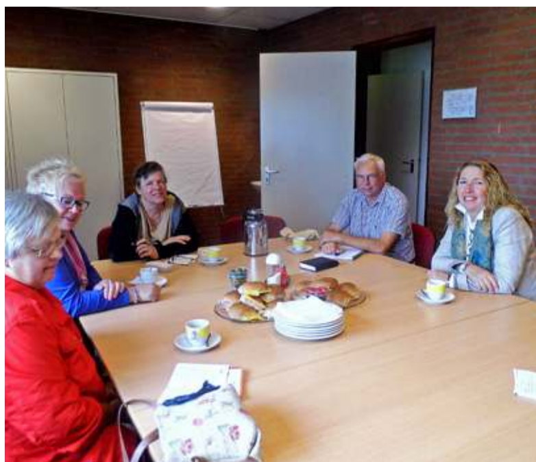
Van de uitnodiging voor een lunch met de wethouder maakte alleen leden van de cliëntenraad gebruik.

Wij zijn daar eenmaal per maand van 11.00 tot 13.00 uur. Wij denken hiermee te voorzien in een behoefte en hopen dat daar wel mensen komen met vragen en opmerkingen'.