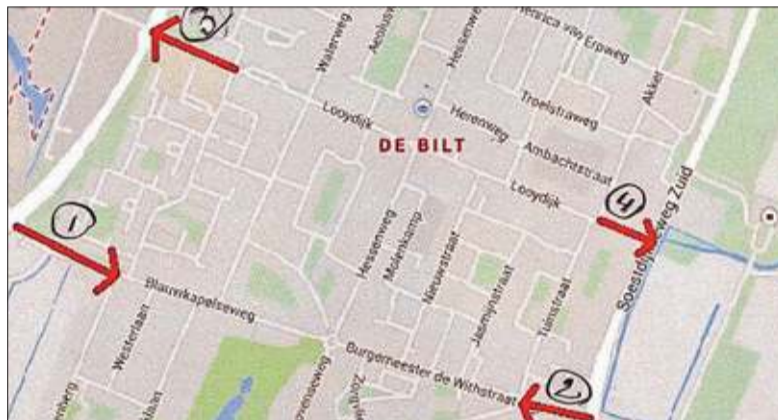
Eenrichtingsverkeer hier leidt tot overlast elders.

harte dat het gemeentebestuur bij de besluitvorming over het Verkeerscirculatieplan dat in oktober zal plaatsvinden zich bewust zal zijn van de nadelen die de variant eenrichtingsverkeer met zich brengt'.