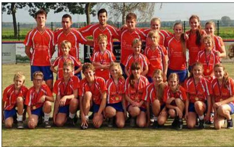
De spelers van DOS 1 met de spelers van de C1 en E2 voorafgaand aan de wedstrijd van DOS 1.

gende week tijdens de laatste speelronde voor de zaalcompetitie start, moet DOS zelf naar runner up Atlantis in Mijdrecht. Een ander spannend duel is dat tussen de beide andere koplopers Fluks en Achilles. De wedstrijd in Mijdrecht start om 16.00 uur.