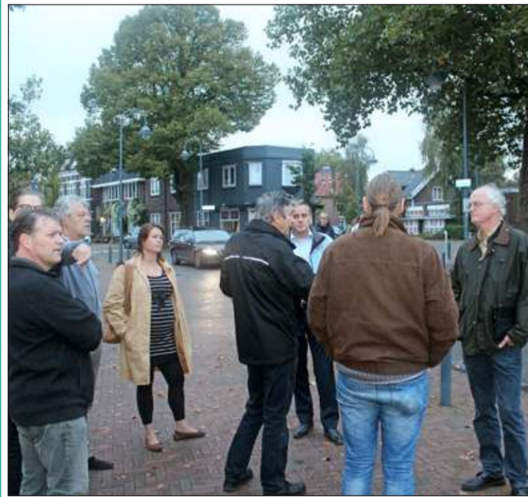
Leden van de gemeenteraad krijgen voorlichting over een fietsknelpunt in De Bilt tijdens de ochtendspits.

De fietsersbond afdeling De Bilt nodigde leden van de gemeenteraad uit dinsdagochtend kennis te komen nemen van de verkeerssituatie in de Biltse Dorpsstraat. Deze maand gaat de raad beslissen over de verkeersstructuur van De Bilt voor de komende tijd. Er ligt naar de mening van de fietsersbond een goed voorstel om een aantal knelpunten in met name de fietsinfrastructuur op te lossen. Omdat niet iedereen een goed beeld heeft van met name de situatie op de Dorpsstraat in de ochtendspits werden de volksvertegenwoordigers uitgenodigd voor een toelichting ter plaatse. [HvdB]