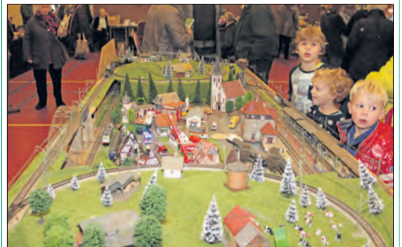
Onder grote belangstelling rijden de treintjes keurig hun rondjes.