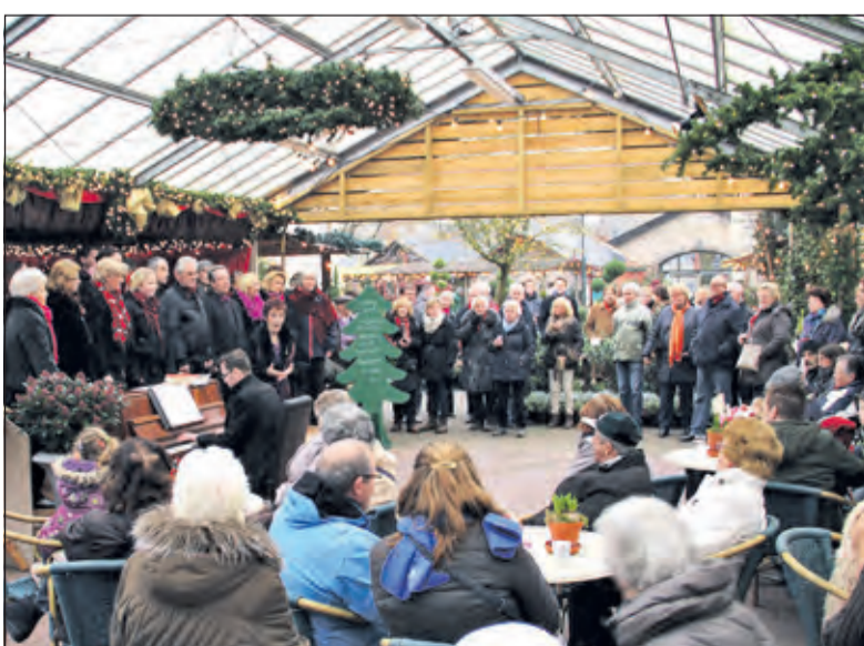
Er zijn optredens van koren, orkesten en andere artiesten.

Tijdens de gehele periode zijn er méér activiteiten voor kinderen. Zelf kaarsen maken of handenarbeid op de Doe-tafels. Honger en dorst is er niet bij, want op het Smulplein zijn diverse eettentjes gevestigd met talloze lekkere winterhapjes en drankjes. Op dit plein is ook het muziektheater waar met grote regelmaat optredens plaatsvinden van koren, orkesten en andere artiesten.