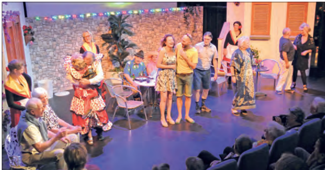
Het eind van het stuk, met eind goed, al goed.

met intriges en verdachtmakingen. Het decor was een vakantieoord aan de Spaanse kust. Zelfs de Guardia Civil moest er aan te pas komen om een diefstal op te lossen. Natuurlijk liep het allemaal goed af in dit blijspel. Het was een plezier om te zien hoe al die verschillende types door de spelers werden neergezet. Aan het eind gaf het publiek de spelers een ovationeel applaus. (Frans Poot)