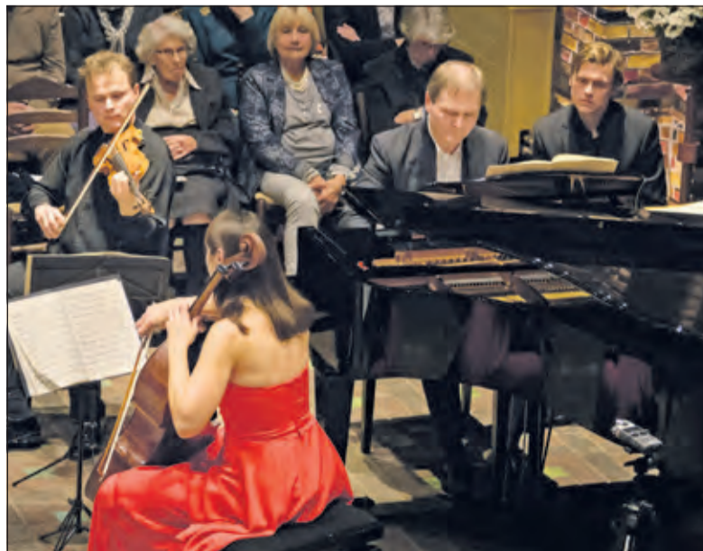
Prachtige muziek in de Woudkapel.