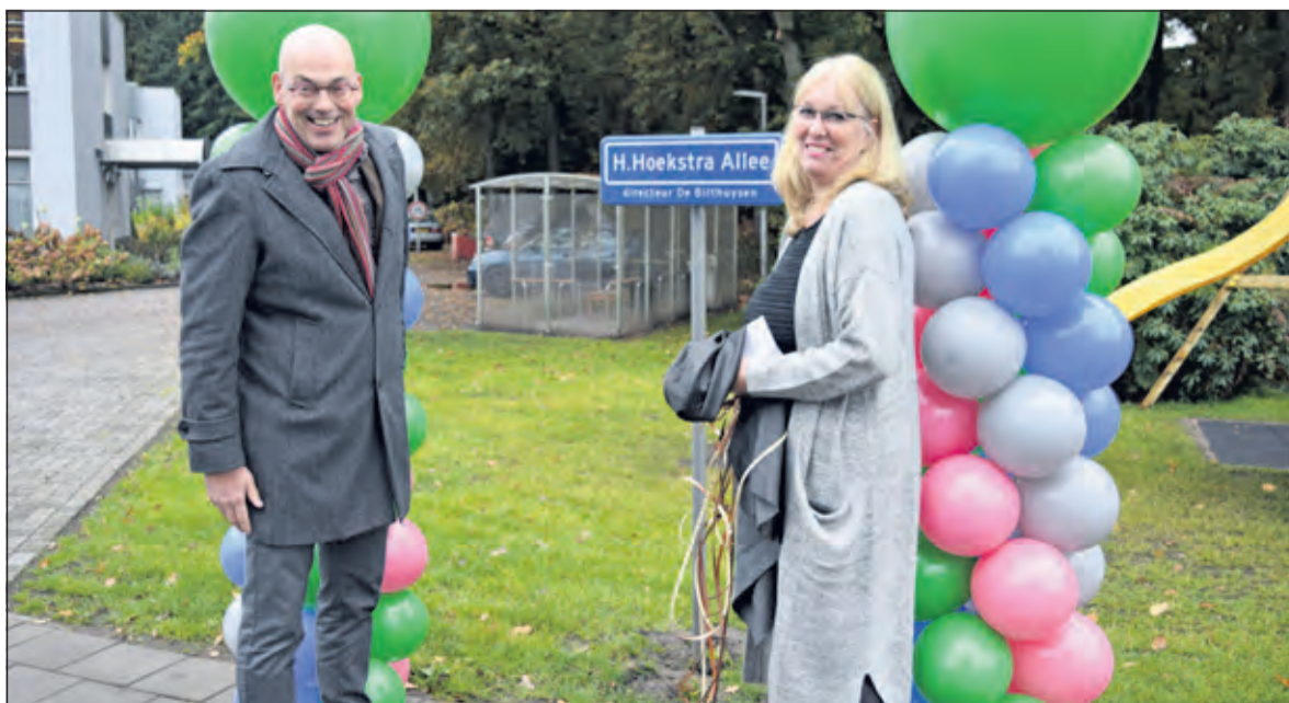
De Hoekstra-allee is een feit.

Zij staan op het gazon voor het terras. Leuk voor de bewoners, als zij naar buiten kijken. Alles in en rond het gebouw is nu op orde. Twee jaar geleden is het hele pand geschilderd, de lantaarnpalen hebben led-verlichting. Volgens mij is het karwei nu wel geklaard'.