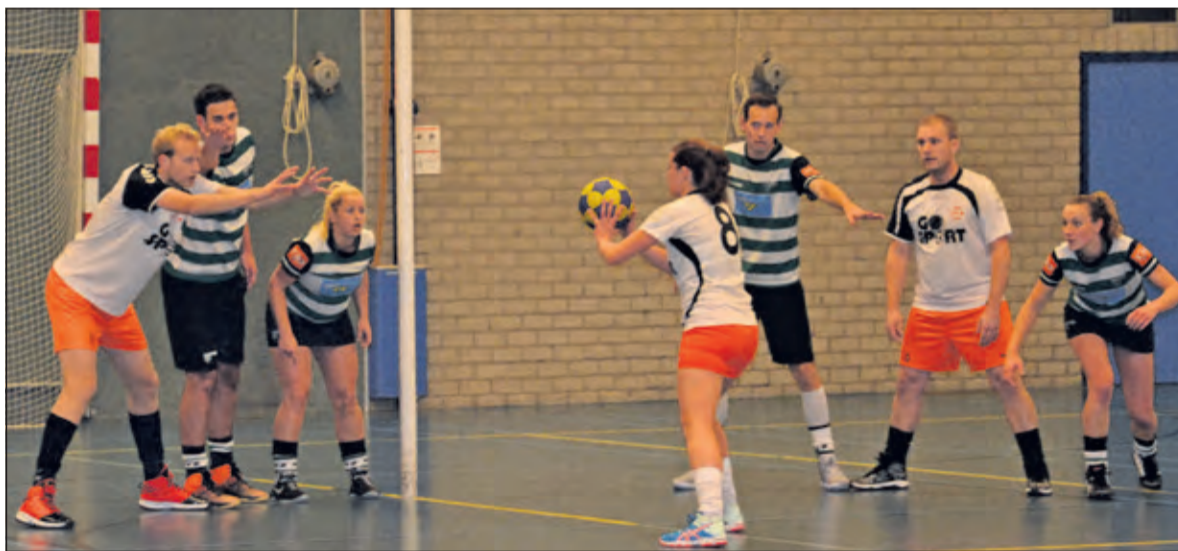
De eerste punten voor TZ zijn binnen.

vallen werd opgevoerd en er werd gevarieerd gespeeld over meerdere schijven. Ook werd er verdedigend meer druk gezet op de speerpunten van KVZ. Luke van Kouterik gaf zijn tegenstander geen centimeter ruimte en in het andere vak werd collectief de gevaarlijk(st)e dame van KVZ uitgeschakeld. Dit werd ook uitgedrukt in de score. Bij 18 - 16 werd er een wederom een serie doelpunten gemaakt en stond het 25 - 16. De wedstrijd was daarmee gespeeld en beide ploegen wisten nog drie keer te scoren (eindstand 28-19).