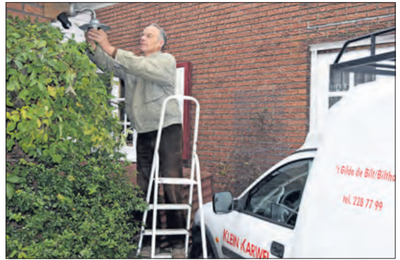
Voor de komende donkere periode is goede verlichting noodzakelijk.

Bedrijven die de bus willen sponsoren kunnen bellen met de penningmeester: Eduard Wammes, telnr. 030 2204920. Meer informatie kunt u vinden op de site van het meldpunt: www.meldpuntdebilt.nl