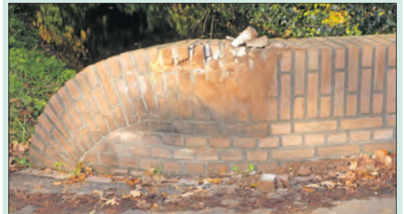
Brug Veldlaan alweer kapot.