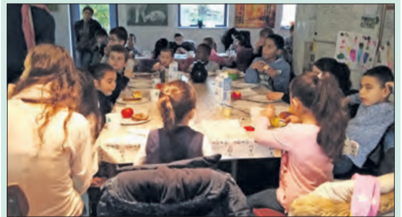
Terwijl de lammetjes toekijken genieten de basisscholieren van het ontbijt met appel en komkommer en halfvolle melk.

Het Nationaal Schoolontbijt is al 13 jaar het grootste educatieve ontbijtevenement van Nederland. Elk jaar begin november wordt in het hele land van ontbijten een feestje gemaakt. Donderdag 10 november kwam groep 3 van de Waterinkschool naar Zorgboerderij Nieuw Toutenburg in Maartensdijk. Via het nationaal schoolontbijt hadden Wouter en Marjolein van Oostrum hun boerderij opengesteld voor een ontbijt bij de boer. [RK]