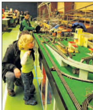
Jong en oud kijkt weer uit naar de Trix Express clubdag.

De club-dag wordt gehouden op zondag 20 november het H.F. Witte Centrum in De Bilt. De openingstijden zijn van 11.00 tot 16.00u. Jongeren onder de 12 jaar mogen onder begeleiding gratis naar binnen. Inlichtingen via 06 21571565 of e-mail: rageskus@planet.nl .