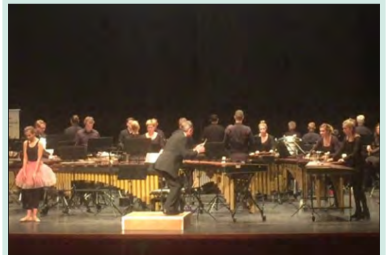
Zaterdag 5 november viel de Melodie Percussiegroep in de prijzen op een concours in Hoozeveen.