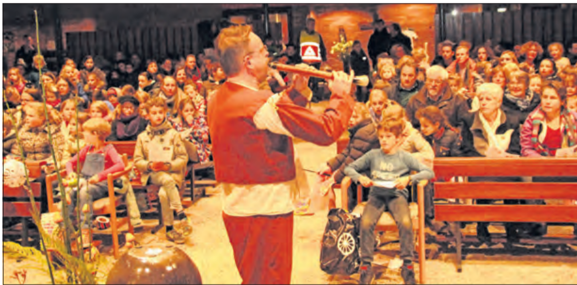
Ruime aandacht voor het verhaal en de figuur van St. Maarten.

Het verhaal van Maarten en de arme man is een oud verhaal. Maarten is door zijn goede daad door de Rooms Katholieke kerk Heilig gemaakt. Daarom staat nu voor zijn naam het woordje Sint. Net als de heilige Sint Nicolaas. De kerk in Maartensdijk werd op 11 november 1966 - het feest van Sint Maarten - ingewijd. En het bijgebouw naast de kerk; het in 2001 geopende parochiecentrum kreeg de naam 'De Mantel' (de officiële naam is: 'De Mantel van Sint Maarten'), omdat de ruimte, net als de mantel van Sint Maarten, in tweeën te delen is. Nog altijd viert men het feest van Sint Maarten. Elk jaar, op 11 november, gaan kinderen met een lampion en een vrolijk liedje bij de mensen langs. Na het verhaal was er chocolademelk, limonade en speculaas. Rond 19.45 uur konden de kinderen het dorp door om aan te bellen bij de huizen, liedjes zingen en snoep verzamelen.