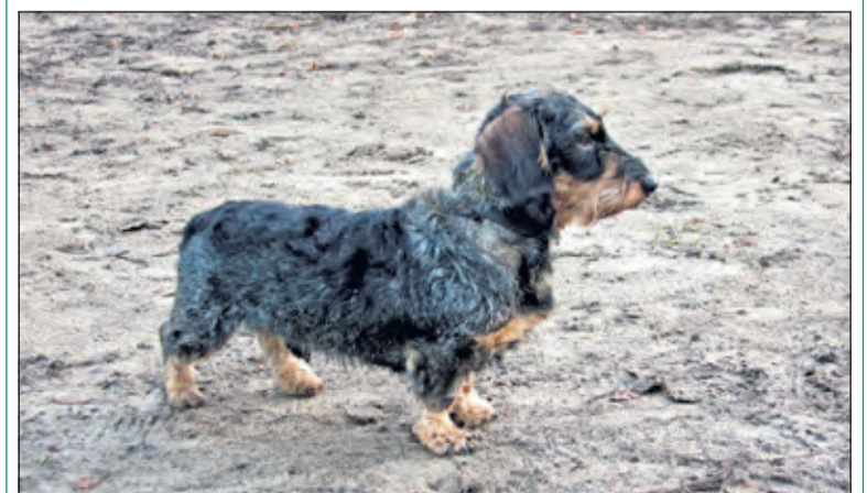
Zondag 20 november zijn er teckels in de Biltse bossen te verwachten.

De Nederlandse Teckel Club organiseert op zondag 20 november een mooie wandelroute op de landgoederen Beerschoten en Houdering in De Bilt. Het is een zeer gevarieerd landschap. Het enige is dat de honden overal, vanwege met name het reewild, aangelijnd moeten blijven. Het Utrechts Landschap controleert daar regelmatig op. Vanaf 13.30 uur wordt er verzameld bij restaurant De Biltse Hoek aan De Holle Bilt 1 in De Bilt. Er is voldoende gratis parkeergelegenheid. Start van de wandeling ca. 14.00 uur. Graag vooraf aanmelden per e-mail secretaris@teckelclub.nl .