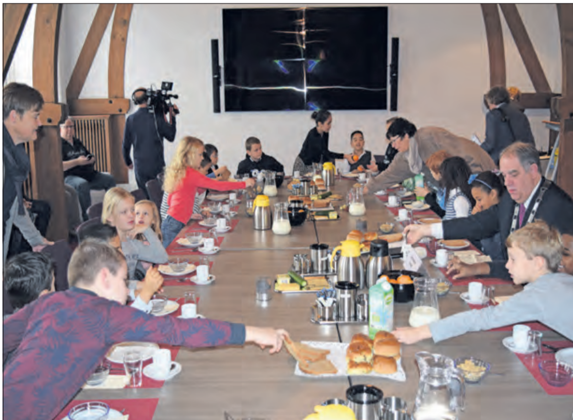
Er wordt stevig ontbeten in de oude raadsaal van Jagtlust.

Net als vorig jaar bestond het ontbijt uit volkorenbrood, tarwebolletjes, krentenbollen, halvarine, fruitstroop, smeerkaas, jam, 30+ kaas, halfvolle melk, fruit, groente, halfvolle yoghurt, biologische muesli en thee. Het ontbijtpakket voldoet aan de nieuwe richtlijnen van het Voedingscentrum. Het Nationaal Schoolontbijt is ambassadeur van Gezonde School, de aanpak die met advies en activiteiten scholen structureel helpt om de gezondheid van hun leerlingen te verbeteren.