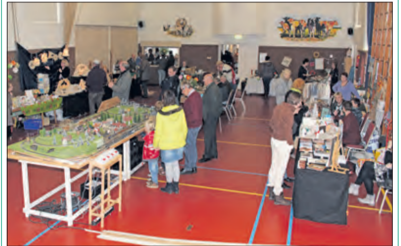
Gezellige drukte tijdens de Westbroekse Hobbybeurs.

Zaterdag 12 november - tussen 10.00 uur en 15.00 uur - vond de hobbymarkt in het Dorpshuis in Westbroek weer plaats. In de hal en foyer en in de grote zaal konden belangstellenden hun hart ophalen aan boeken, houtsnijwerk, keramiek en nog veel meer, verspreid over meer dan 40 tafels.