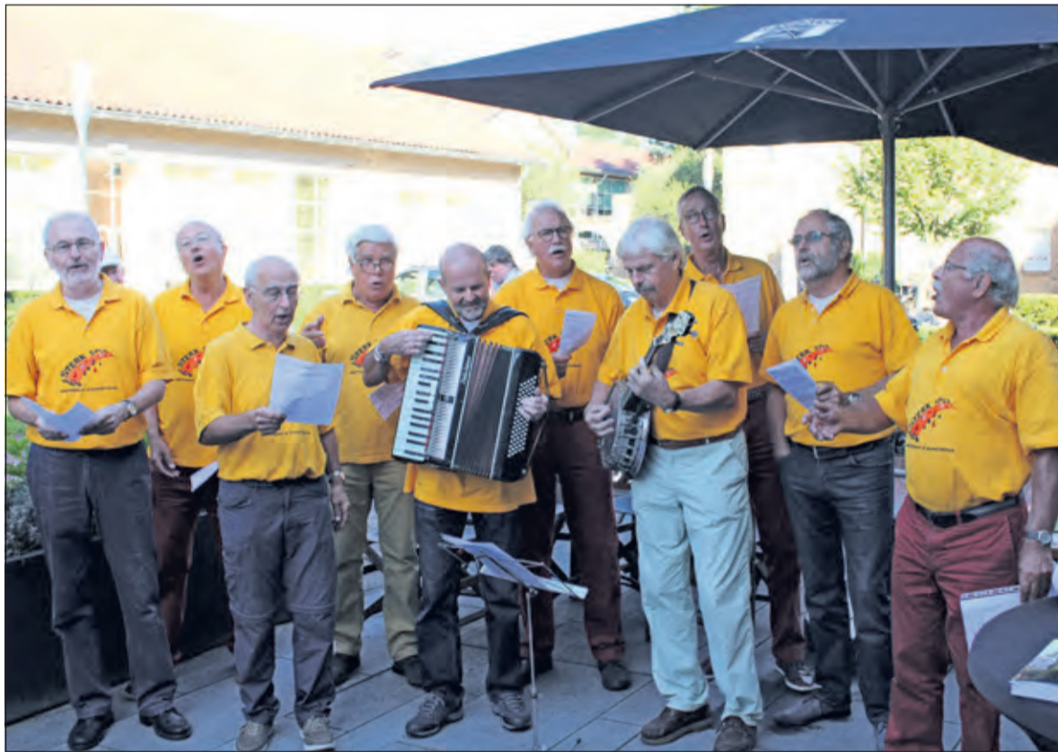
Sterk Spul bij de opening van Open Monumentendag.

Maar soms wordt ook ver buiten de regio gezongen. Zo beleefde Sterk Spul deze zomer een succesvol optreden op het zonnige terras van een strandtent in Nieuw Haamstede op Schouwen-Duiveland. Op dit moment staat een optreden op het programma voor de gasten van het Rode Kruis in wooncentrum Toutenburg en worden er plannen gemaakt voor enkele optredens van Sterk Spul met de kerst. Uiteraard met aangepast repertoire. Mocht u meer willen weten of heeft u een verzoek voor een optreden mail dan naar sterkspulagenda@gmail.com .