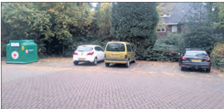
Op de Gregoriuslaan zijn 2 parkeervakken aangewezen als oplaadpunt.

De locaties worden bepaald op basis van aanvragen van eigenaren en bestuurders van elektrische auto's.