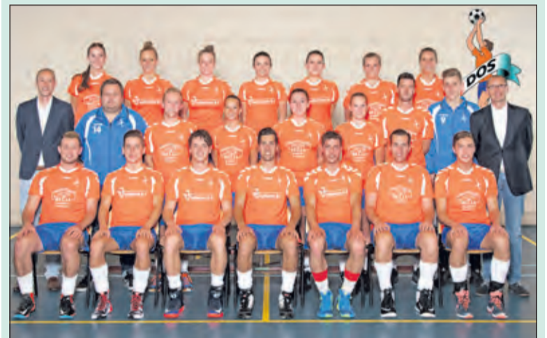
Dos start competitie met klinkende overwinning.