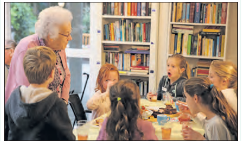
De bakkers smikkelen mee tijdens de high tea voor ouderen.