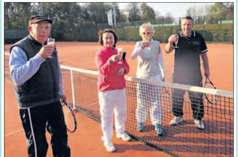
Na zeven dagen tennissen heffen de winnaars sportief het glas.