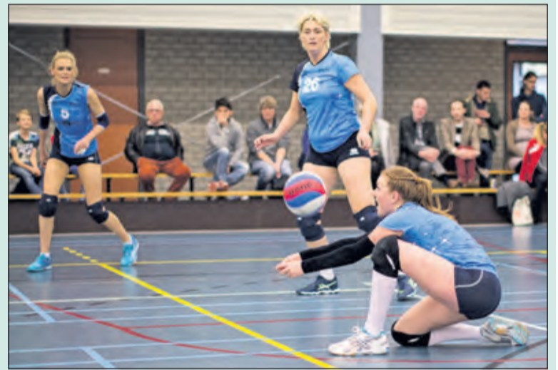
De Irene-dames krijgen vaste grond onder de voeten.