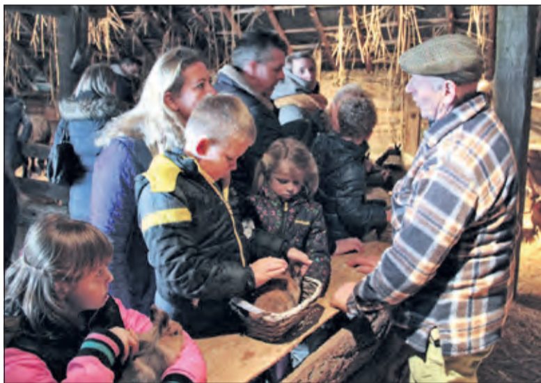
Volop knuffeldieren met hoog aaibaarheidsgehalte.

Sinds enkele jaren is er op vrijdagavond Lichtjesavond tot 21.00 uur.