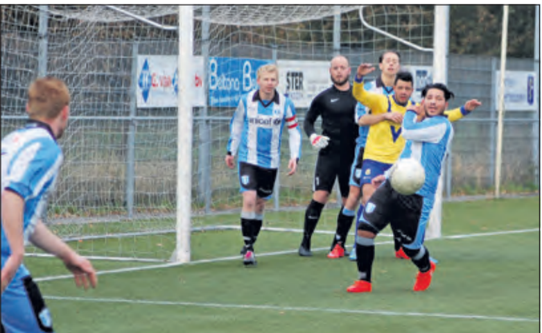
Getuige deze spelsituatie werd SVM al in de 6de minuut een strafschop onthouden.

Zaterdag 12 november ging Salvo dames 1 op bezoek bij de nummer één Sovoco uit Soest. Voor Salvo stond het spelen van een ongedwongen wedstrijd voorop. Bij Sovoco lag de druk om punten te halen en de eerste positie te behouden. Salvo begon direct fel aan de wedstrijd en wist de eerste aanval van Sovoco direct af te blokken. Daarna zorgde Salvo met een paar goede aanvallen voor een voorsprong van een paar punten. Voor Sovoco zorgde dit ervoor dat ze een tandje bijzetten en de achterstand inliepen en de voorsprong vervolgens ook niet meer weggaven. Zij wonnen de eerste set dan ook met 25-13. Toch hield Sovoco dit spel niet direct vast en ging het de tweede set lange tijd gelijk op. Salvo zorgde met een afwisselende aanval voor de nodige punten en Sovoco maakte op haar beurt een aantal onnodige fouten. Toch wist Sovoco zichzelf te herpakken en werd het tempo weer opgevoerd zodat ook de tweede set naar Sovoco ging met 25-17. De derde en vierde set liet Sovoco niets aan het toeval over en zorgde met een gevarieerde aanval, goede service en hoog tempo dat zij het initiatief hielden en de derde en vierde set relatief eenvoudig binnenhaalden met 25-14 en 25-13.