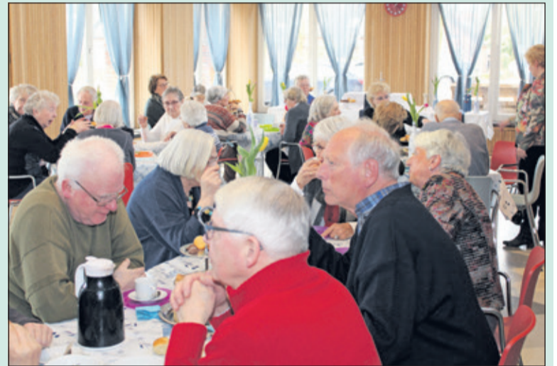
Zo'n 35 mensen op leeftijd waren afgekomen op de lunch / high tea, die op 10 maart door Samen voor Hollandsche Rading in het Dorpshuis werd georganiseerd. Zij kregen een leuke gezellige middag aangeboden met drankjes en hapjes.