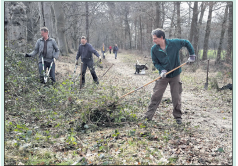
Tien vrijwilligers werken een dagje mee aan het natuurbehoud

De ontvangst op het landgoed door Lex van Boetzelaer was groots. De versnaperingen en uitstekende lunch droegen bij aan de motivatie om op het landgoed samen te werken en ervaringen te delen. Eyckenstein organiseert meerdere keren per jaar een buitenwerkdag voor de 'Vrienden van'. Zie: www.eyckenstein.nl (Bert Tuinzaad, Bilthoven)