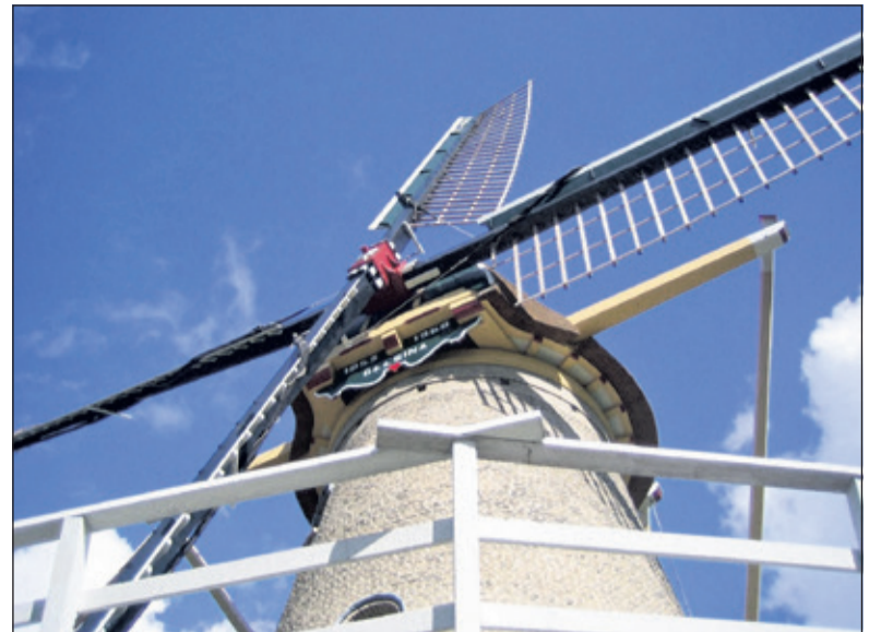
Groenekans glorie vertoont scheuren.

ken duidelijk dat de actie 15 maart gaat beginnen. De actie loopt zowel in maart en april. Per 1 mei wordt er ingezameld. De vrijwilligers zullen met intekenlijsten gaan werken. Er wordt bij voorkeur niet met contant geld gewerkt, maar met eenmalige machtigingen. Er wordt ook een speciale bankrekening voor deze