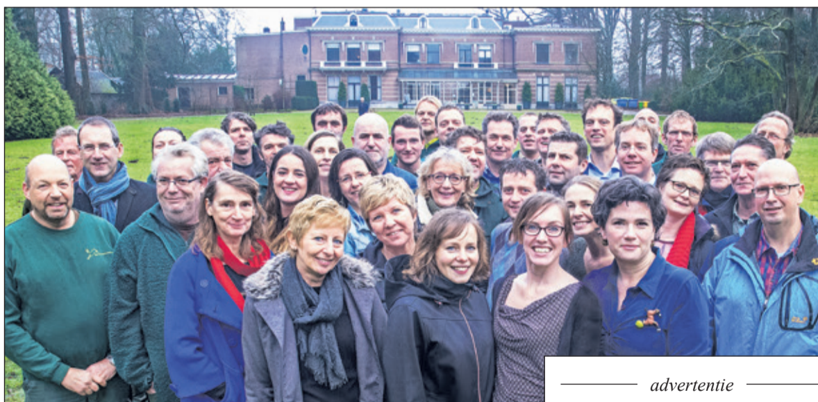
Medewerkers 90-jarige Utrechts Landschap.

Utrechts Landschap werd donderdag 9 maart precies 90 jaar geleden opgericht: op 9 maart 1927. Dat vierden de medewerkers die ochtend met een gezamenlijk ontbijt op landgoed Oostbroek.