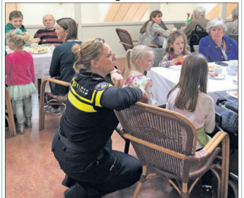
In het kader van NLdoet verzorgden medewerkers van het KLPD uit Driebergen vrijdag 10 maart in verpleeg- en verzorgingshuis de Biltse Hof een High Tea voor cliënten en familieleden.