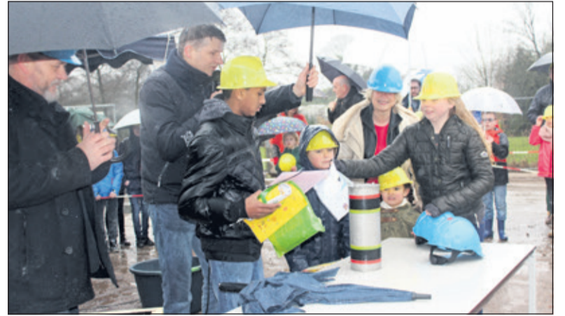
Leerlingen van de Nijepoort stoppen tekeningen en de krant van woensdag 8 maart in de tijdscapsule.