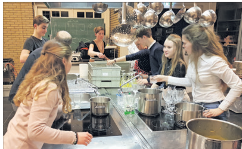
Leerlingen en docenten van de school waren de hele dag bezig met voorbereidingen voor het Charity Dinner.

De opbrengst van de avond werd geschonken aan de Stichting WensAmbulance Utrecht. De Stichting WensAmbulance Utrecht verzorgt het liggend vervoer voor (pre)terminale en chronisch zieke patiënten naar hun WensLocatie. Dit kan een bezoek zijn aan familie, ouderlijk huis, bruiloft, begrafenis, verjaardag of bijvoorbeeld een dagje naar het strand of dierentuin. De avond werd afgesloten met het aanbieden van het bedrag van 1000 euro aan de mensen van de wensambulance Utrecht. Een mooi bedrag waarmee zij hopelijk veel wensen kunnen vervullen. (Peter van Esschoten)