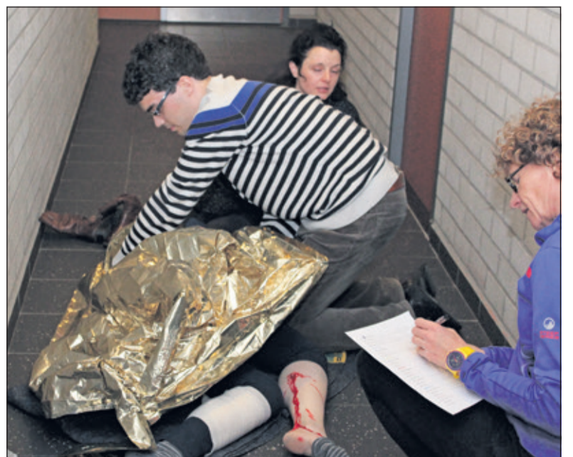
Een vreselijke bloeding aan het onderbeen.