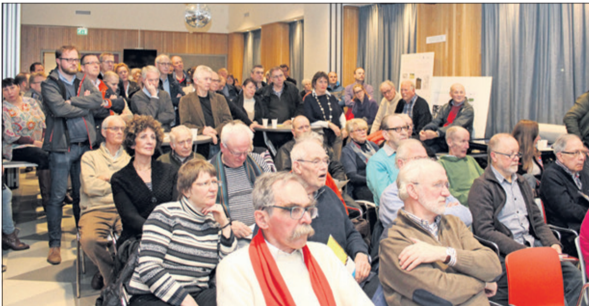
Grote belangstelling, ook nu de werkzaamheden zijn begonnen..

Vanuit heel Nederland werden oproepen verzameld aan de nieuwe Tweede Kamer die op 15 maart verkozen wordt. Tijdens de estafette van ruim 250 kilometer gaven inwoners van maar liefst 29 gemeenten het stokje aan elkaar over. Vanuit elke gemeente werd een oproep aan het estafettestokje toegevoegd. De ChristenUnie in De Bilt vraagt aandacht voor de lange wachttijd voor woningen in de regio.