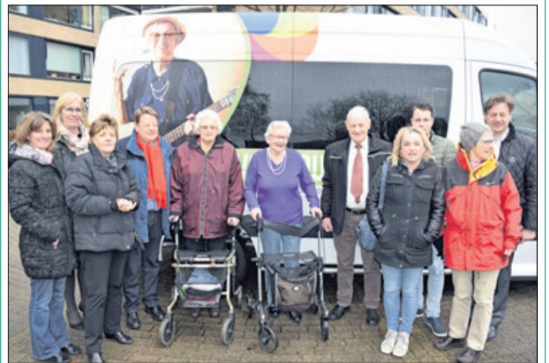
Donderdag 2 maart werd dankzij het traject Waardigheid en Trots een nieuwe rolstoelbus en een aantal rolstoel/- duo-fietsen aangeschaft voor alle bewoners van de Bremhorst in Bilthoven.