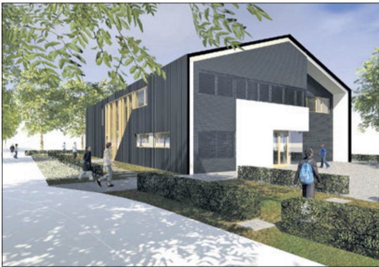
Impressie van het nieuwe schoolgebouw aan de Versteeglaan. (ill. Kristinsson Architecten)

De nieuwbouw was hard nodig omdat De Nijepoort al jaren geleden uit zijn jasje was gegroeid. In de loop van 2004 nam de schoolvereniging het gebouw van de voormalige School met den Bijbel Groenekan als tweede locatie in gebruik om de groei te kunnen opvangen. Meer informatie over de vervangende nieuwbouw en deze basisschool vindt u op de website www.nijepoort.nl .