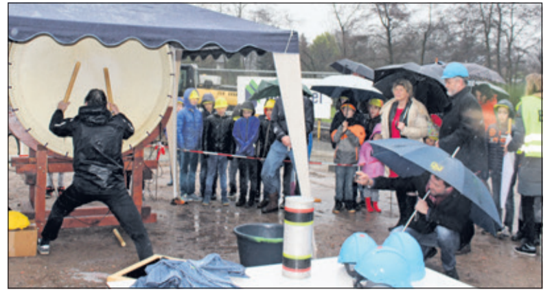
Vooraf werd met slagen op de grote trom - zelfs in de stromende regen - aandacht gevraagd.