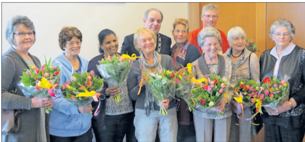
De gehuldigde vrijwilligers met burgemeester Bas Verkerk.

Op dinsdag 14 maart was het Malthidedag, een belangrijke dag voor de gemeente De Bilt. Een aantal vrijwilligers werd in het zonnetje