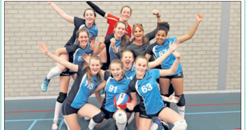
Het uitgelaten MB1 team heeft weer een zege geboekt.

Het zijn drukke tijden voor Irene MB1. Afgelopen week werd in reguliere competitiewedstrijden weer een grote stap gezet richting de titel in de Topklasse van de regio West. Zaterdag 11 maart was nummer 3 uit de competitie Monza MB1 in de Kees Boekehal de tegenstander. Ook deze tegenstander werd aan de zegenkar gebonden (4-0). (Michel Everaert)