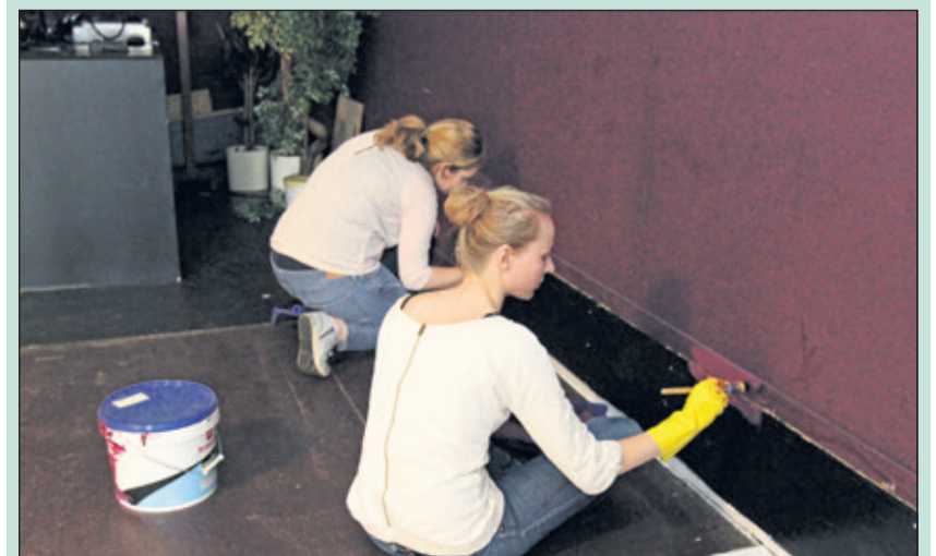
Een groepje ambtenaren aan de slag in het buurtcentrum W4.

Het hele jaar door zet de gemeente zich met haar eigen medewerkers in op het gebied van maatschappelijk betrokken ondernemen, verspreid over de kerntaken. De activiteiten variëren van klusprojecten tot taalondersteuning. Naast de maatschappelijke bijdrage zelf levert deelname de medewerkers elk jaar weer nieuwe inzichten op, getuige de reacties van deelnemers van vorig jaar: 'Je raakt in contact met onderdelen van de maatschappij waar je anders niet mee in aanraking komt' en 'Ik merk dat ik nu nog beter samenhang in het werk weet aan te brengen'. Bovendien vinden de ambtenaren het leuk: 'Een mooie ervaring. De samenwerking met de cliënten maakte de dag speciaal. [HvdB]