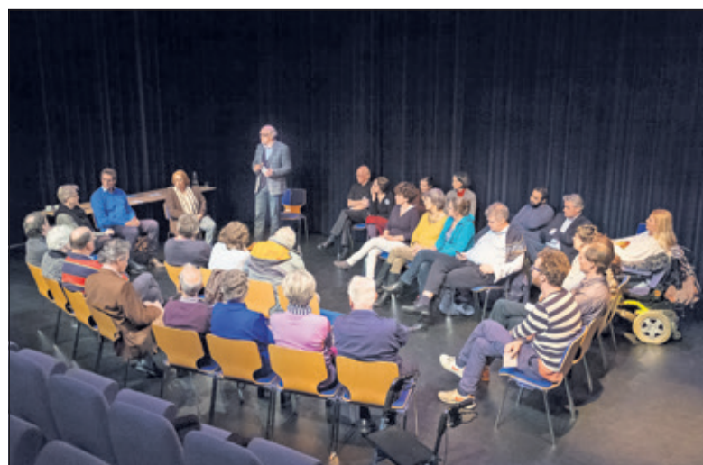
Weinig debat over het thema 'wat is normaal'.