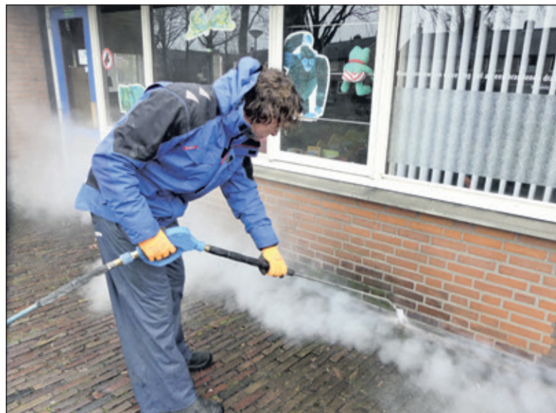
Afgelopen donderdag is de voorkant van De Vierstee gereinigd.

Dit is een mooie opmaat voor wat komende zomer gaat gebeuren. Ik ben echt blij dat dit al vast is gerealiseerd; op naar het vervolg!' Wie Stichting Vierstee 2.0 wil steunen bij meer van deze zaken: Stichting Vierstee 2.0 is bereikbaar via: bestuur@vierstee.nl, meer informatie is te vinden op www.vierstee.nl.