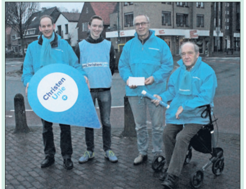
ChristenUnie De Bilt brengt ook een boodschap over.