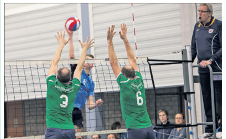
Irene H1 op volle kracht.

Irene heren 1 versloeg in de streekderby Cito H2 met 3-2. De Irene heren zetten hiermee de opgaande lijn die na de kerst is ingezet voort. Dit geeft vertrouwen voor de komende wedstrijd. Op zaterdag 25 maart om 16.00 uur speelt Irene H1 uit tegen Vives H1. (Matthijs Agterberg)