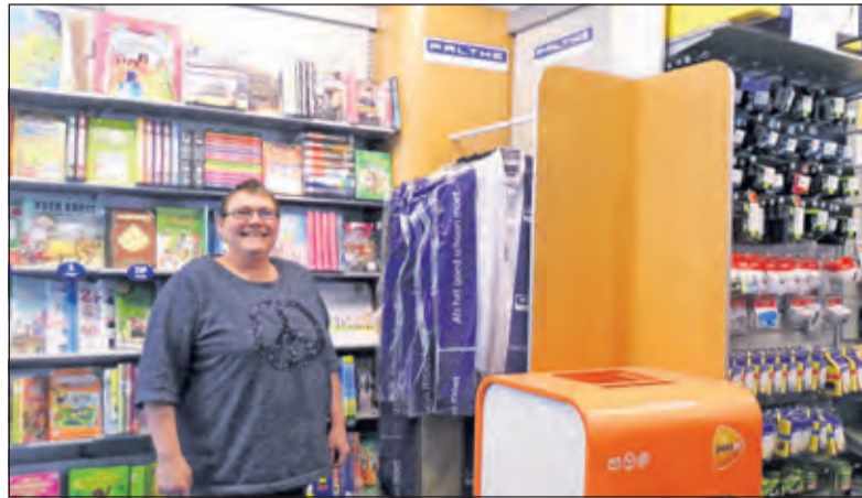
Voor stoomgoed kan men vanaf heden ook terecht op het Maertensplein: de Primera is een Palthe Depot begonnen.

In 1873 kocht de familie Palthe een leegstaand fabrieksgebouw van de Almelosche Brood en Meelfabriek. Het was een met stoom aangedreven maalderij en centrale broodfabriek. De fabriek werd vervolgens omgebouwd voor het productieproces met chemische kleurstoffen. Vijftig jaar na de oprichting bestond Palthe uit maar liefst 720 fabrieksmedewerkers en 80 medewerkers op kantoor. Het was het jaar dat voor het eerst elektriciteit als moderne licht- en krachtbron haar intrede deed in de fabriek. Het werd het jaar van de grote uitbreiding. Een grote strijkzaal en een nieuwe kledingververij werden gebouwd.