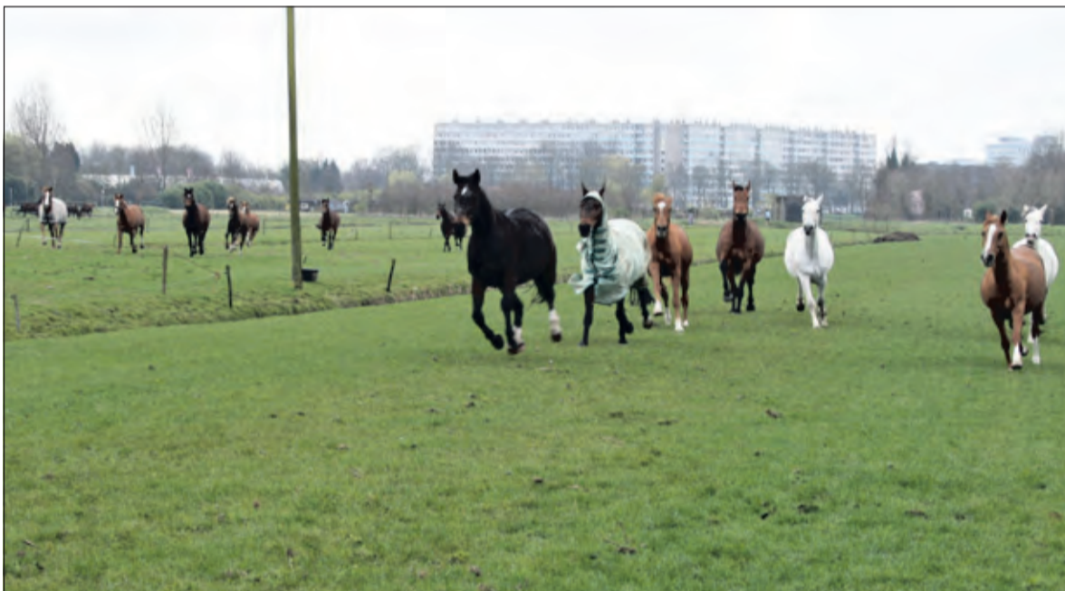
De paarden zijn uitgelaten als zij weer de wei in mogen.

Het Welzijnscertificaat is een jaar geldig. Van Brenk: 'Dit jaar zullen wij allemaal weer onze schouders eronder zetten om volgend jaar opnieuw het keurmerk in ontvangst te kunnen nemen. Zoals wij hier op stal zeggen, 'alles voor het paard'!