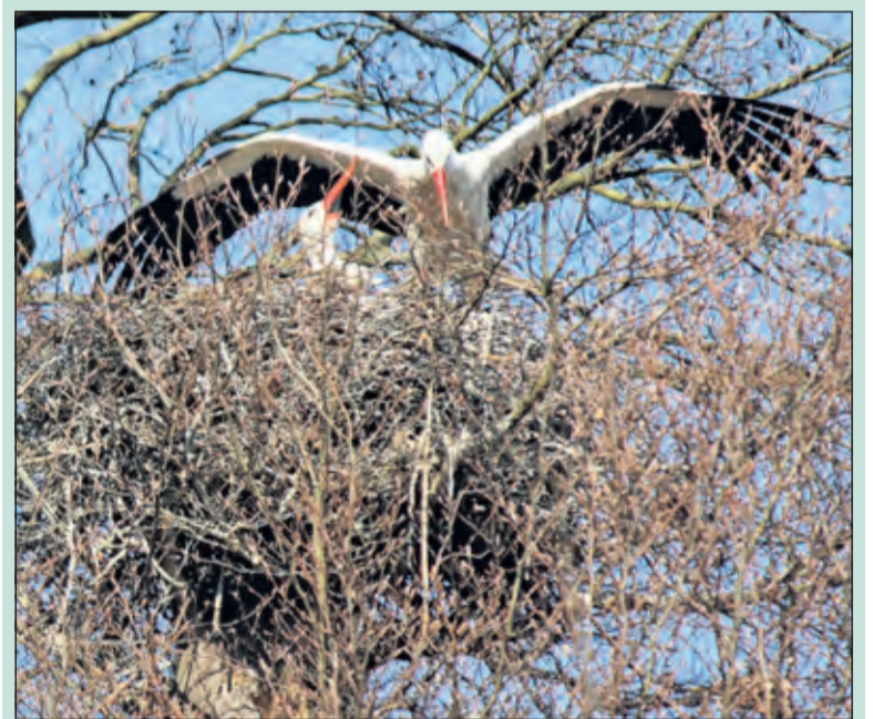
Manlief komt terug van fourageren en wordt door zijn broedende echtgenote verwelkomd.

Ooievaars langs de Kon. Wilhelminaweg Groenekan is al jaren een bekend gezicht. Menigeeen heeft ze tegen de avond zien neerstrijken op de lantaarnpalen bij de rotonde voor Persijn nabij de in de volksmond bekende rotonde 'Het Braadspit'. Nu heeft een paartje ooievaars z'n hemelpaleis gebouwd hoog in een boom op het landgoed van Persijn. Tussen de reigers werken zij aan hun nageslacht, goed zichtbaar vanaf de weg. Begin mei kunnen de jongen uit het ei kruipen.