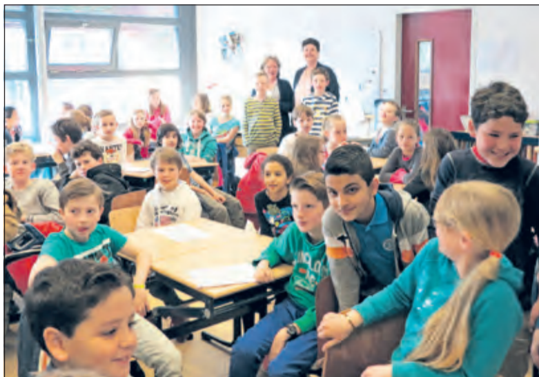
Groepen 7 van De Rietakker en de Julianaschool verzorgden samen een presentatie over stofwisselingsziekten.

Vorig jaar hebben leerlingen van basisschool De Rietakker in De Bilt de Konings spelen ingevuld met activiteiten die geld oprichtten voor onderzoek naar stofwisselingsziekten. Dit jaar gaan de kinderen van de Julianaschool dit doen.