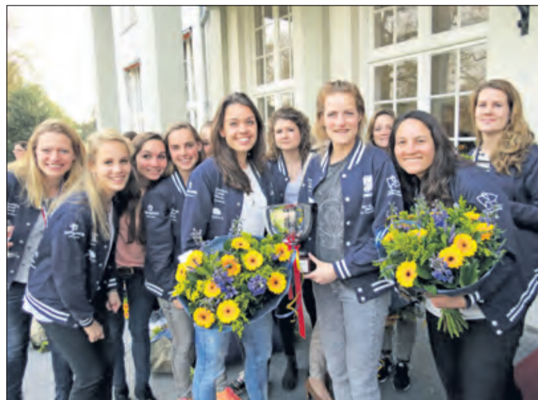
Met veel plezier werd de huldiging ondergaan.

bijzonder. 'Het laatste Europees kampioenschap in de gemeente werd in 1992 behaald door waterpoloclub Brandenburg.' Over het toernooi zegt ze veel complimenten van de buitenlandse teams gekregen te hebben. 'Die zeiden: wat een geweldig toernooi hebben jullie neergezet.' [GG]