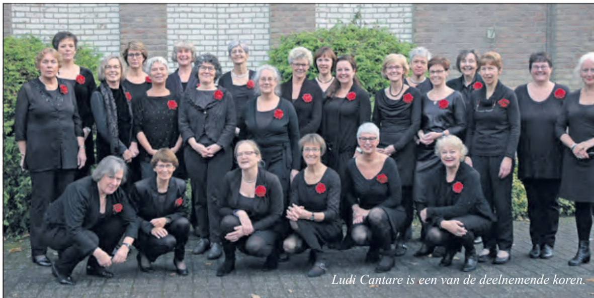
Ludi Cantare is een van de deelnemende koren.

De wens om te genieten van de liederen staat voorop, gekoppeld aan het streven om de koren in onze gemeente nog hoger op de kwaliteitsladder te zetten. Wethouder van o.a. kunst- cultuur- en monumentenbeleid Hans Mieras, zal de middag om kwart voor één openen. De toegang voor het publiek is gratis, maar in de zaal zal een bus staan waarin men kan doneren, zodat de begroting hopelijk helemaal sluitend wordt. Op de website van de SKC, www.stichtingkunstencultuur-debilt.nl staat het laatste nieuws en het programma. (Tonneke Stamps)