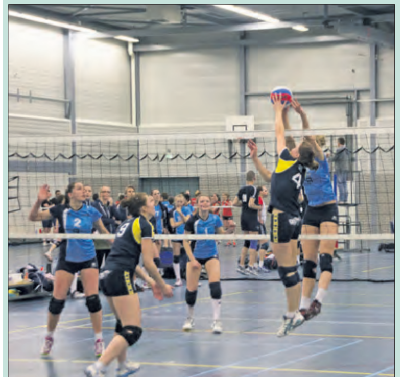
Irene DS 1 is officieel gedegradeerd en speelt volgend jaar promotieklasse.

Irene won de eerste set met 25-22. De dames van VSTS herpakten zich en wonnen de tweede set met 20-25. De derde set spande het er weer om. Net op tijd trok VSTS het spel naar zich toe en won met 22-25. De laatste set wisselde men bij Irene de gehele jeugd in. Deze jonge speelsters zullen volgend jaar ook de basis zijn voor dames 1. De set begon goed voor Irene, maar wederom pakte VSTS de set met 22-25.