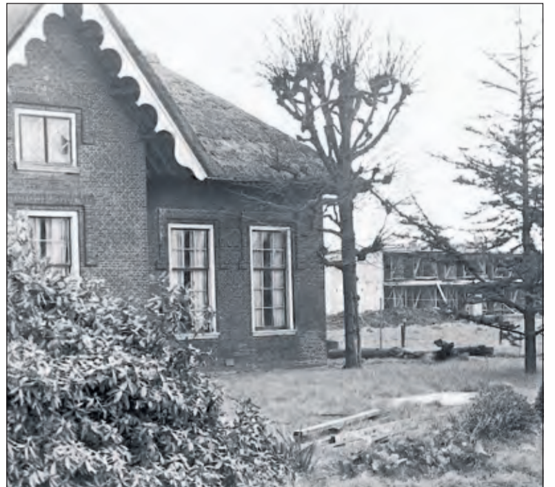
Larenstein in 1967 met op de achtergrond de bouw aan de Tempellaan en Planetenbaan.