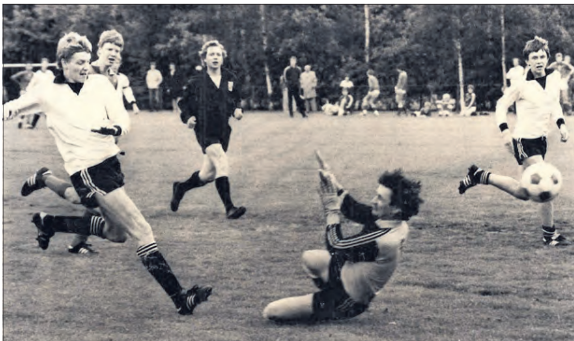
Op sportpark Larenstein ('dat tussen de bossen lag') werd in de zeventiger jaren van de vorige eeuw de wedstrijd B.V.C. - Amstelland gespeeld. B.V.C. maakt hier het derde doelpunt. (uit een privéverzameling).

Larenstein was oorspronkelijk een akkerbouwbedrijf op de zandgrond, maar is later een gemengd bedrijf geworden.