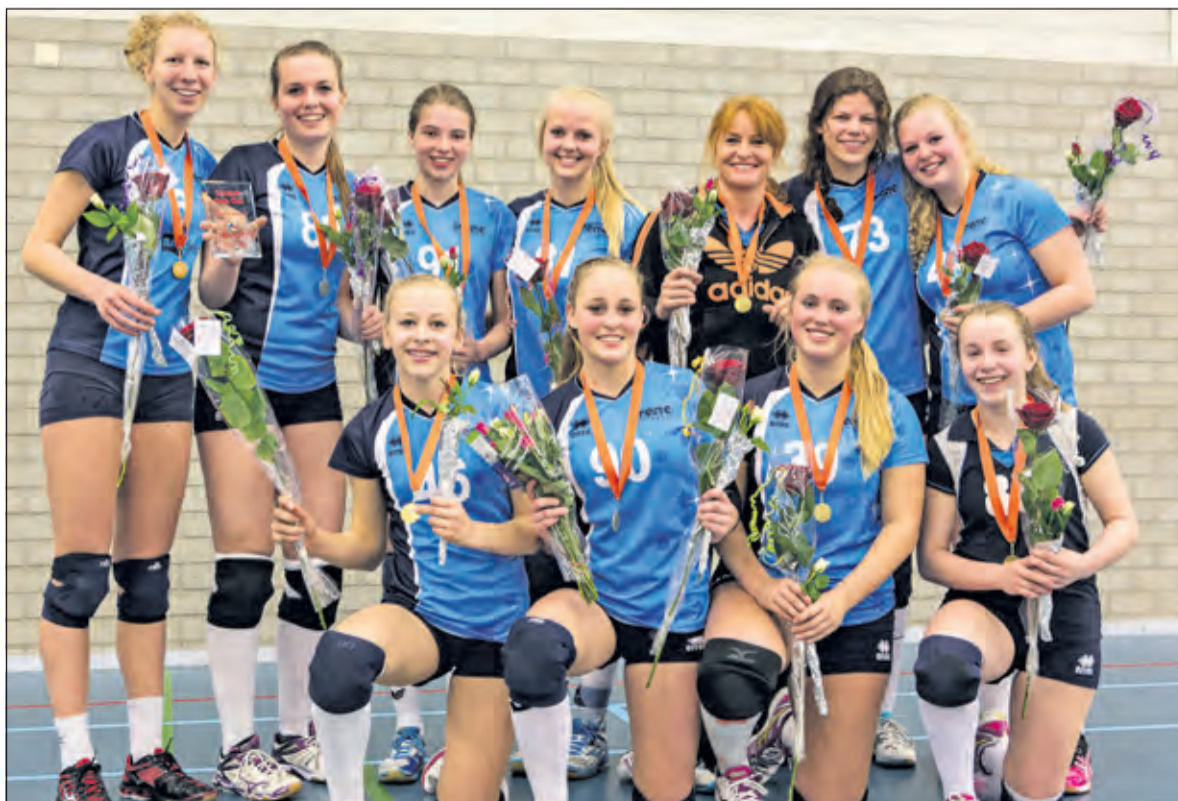
Irene MA1 De beachvolleybalambities moeten nog even in de koelkast.

Nog even doortraineren voor de Irene-meiden, die tussendoor op 16 mei in Voorschoten ook nog de bekerfinale spelen.