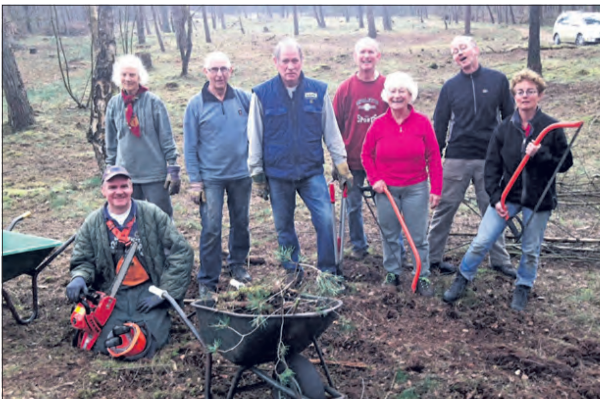
Vrijwilligersgroep De Heikrekels.

De vrijwilligersgroep De Heikrekels is er zaterdag jl. in geslaagd een doorbraak te maken in het oude heidegebied de Heijntjeskamp in De Bilt.