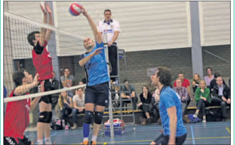
Voor de heren uit Bithoven zat er geen stunt in tegen de nummer één uit de competitie.

Irene paste de opstelling in de derde en vierde set opnieuw aan, maar het mocht niet baten. VCV haalde ook deze sets, met 25-14 en 25-16, binnen. VCV won overtuigend met 0-4. Zaterdag 18 april om 17.30 uur staat de laatste wedstrijd van het seizoen op het programma, in Nieuwegein tegen NVC HS1.