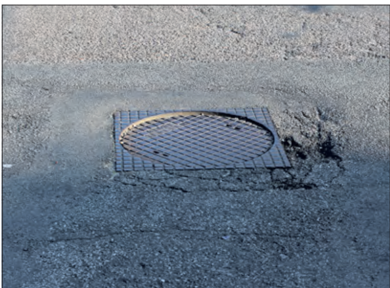
Het wegdek van de Hessenweg vraagt om een onderhoudsbeurt.

Om een verdere verslechtering van het wegdek van de Hessenweg-zuid gedurende de aanstaande winterperiode tegen te gaan heeft het College besloten al direct enkele kleinere onderhoudsmaatregelen te nemen. Verder treffen Burgemeester en Wethouders voorbereidingen om de voorzienige wegdekrenovatie direct na de winterperiode uit te voeren.