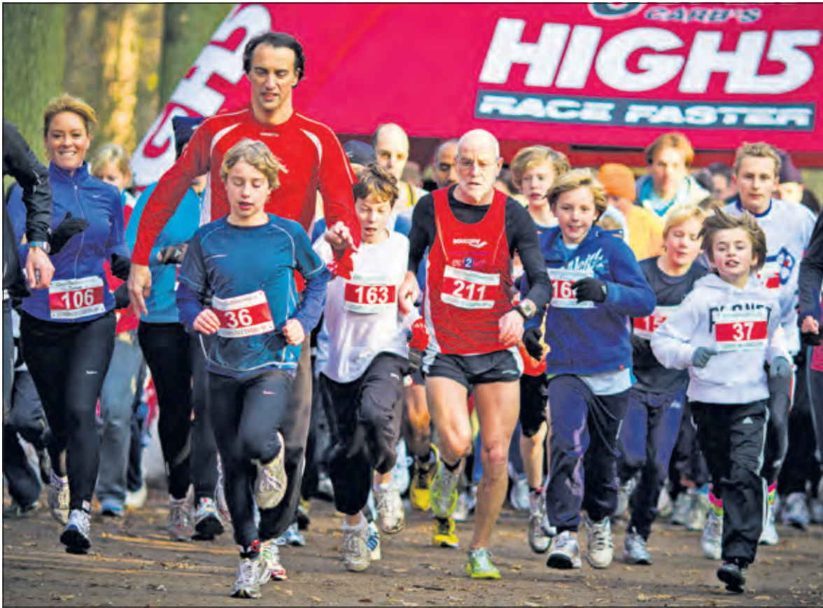
Jong en oud aan de start bij de chocolademelkloop.

Op zondag 29 november wordt voor de 12e keer de Chocolademelkloop in de gemeente De Bilt georganiseerd. Het doel van de loop is om kinderen en volwassenen te laten genieten van hardlopen.