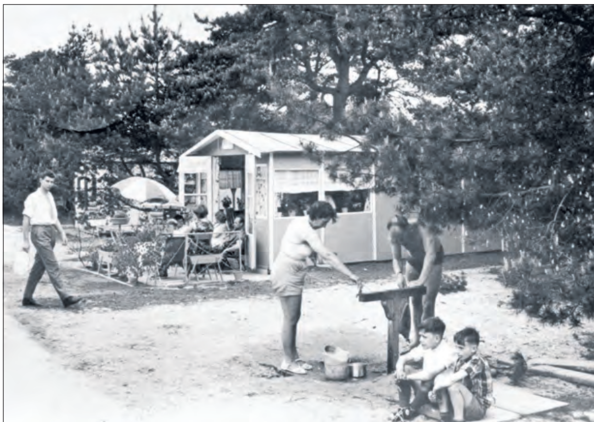
Een foto uit 1960.

naar verhalen en foto's van vroeger. Maar het kan natuurlijk ook anderen aangaan, die nu geen campinggast meer zijn, maar er wellicht wel nog heel wat over weten te vertellen'. Beesemer en Meijer nodigen belangstellenden graag uit eventuele verhalen aan het papier toe te vertrouwen en voor het boek beschikbaar te stellen. Eventueel