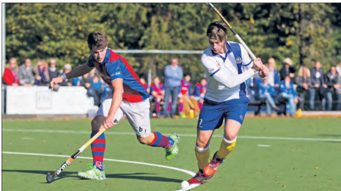
Afgelopen zondag bezocht kwam SCHC (Bilthoven) op bezoek in Groenekan. Een spannende wedstrijd waarbij SCHC de punten veroverde, uitslag 1-2.