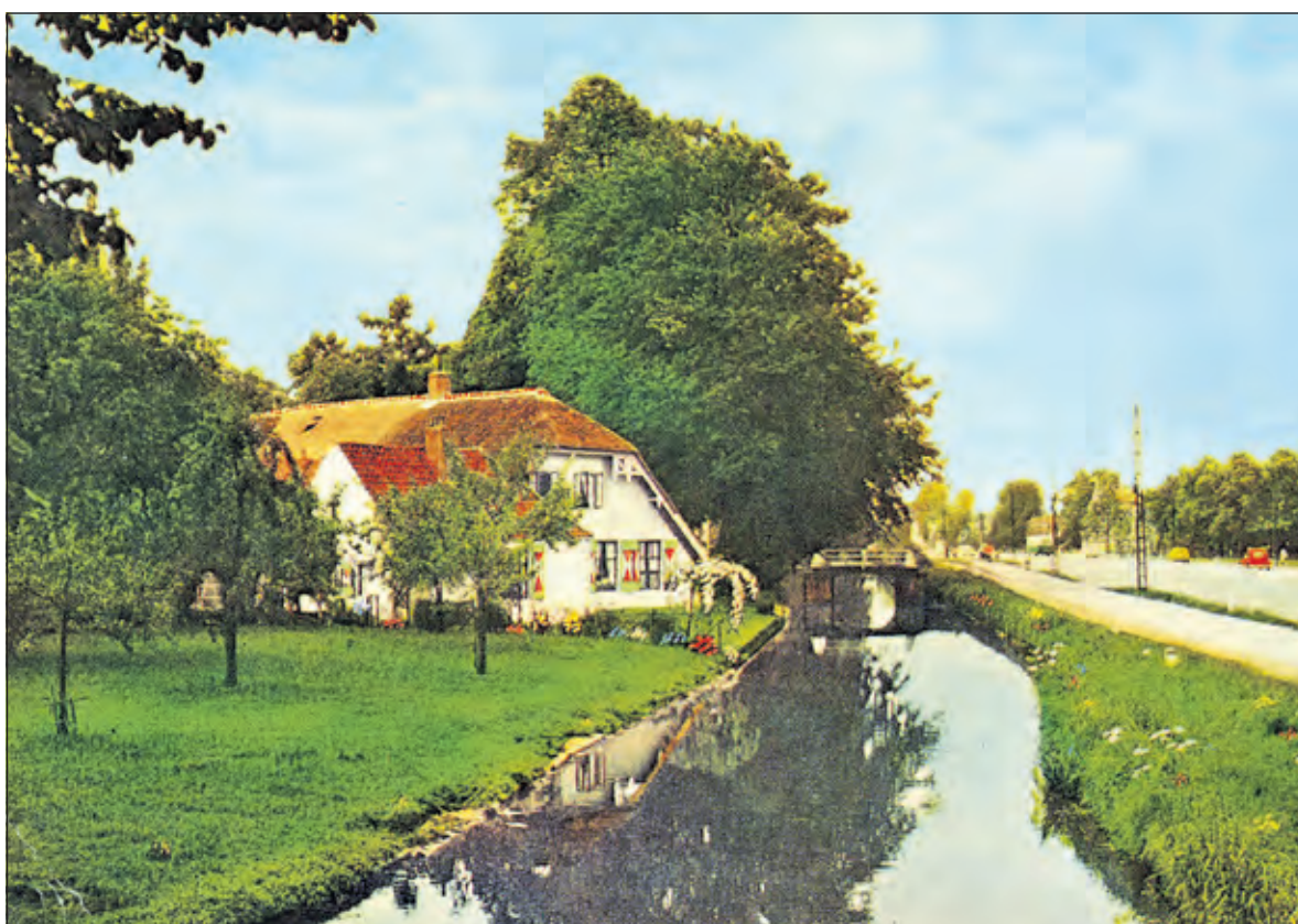
De Utrechtseweg (301) in 1966.

De grond waarop de grote langhuisboerderij Oost-Indiën (Utrechtseweg 301) is gebouwd behoorde toe aan het Vrouwenklooster. J. Spinhoven heeft tot 1997 als laatste boer de boerderij met grond gepacht. Daarna heeft de grond bij de boerderij een natuurbestemming gekregen.