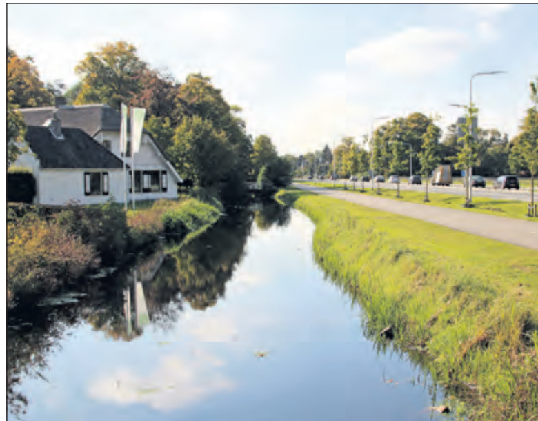
De Utrechtseweg (301) in 2015 waar nog steeds de Biltse Grift voor langs loopt. [foto Henk van de Bunt]

De start van de tentoonstellingsreeks vindt plaats in Figi, Zeist van 18 tot en met 25 oktober na een openingsmoment op 17 oktober in Zeist. Vervolgens op 7 en 8 nov. bij WVT aan Talinglaan 10 te Bilthoven en van 23 nov. t/m 4 dec.