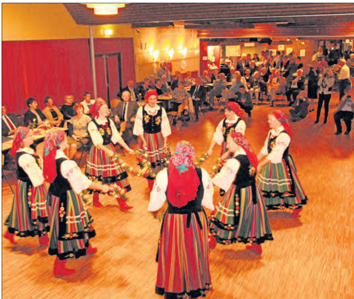
Het volksdansensemble Garoon luistert het jubileumfeest op.

nieuwe gemeente De Bilt voortgezet. Ook in De Bilt werd nu het jubileum gevierd met de mensen die zich in de afgelopen 25 jaar actief voor de stedenband hebben ingezet en voor hen die zich hiervoor willen gaan inzetten. Het was een avond met Nederlandse en Poolse gasten. Afgevaardigden