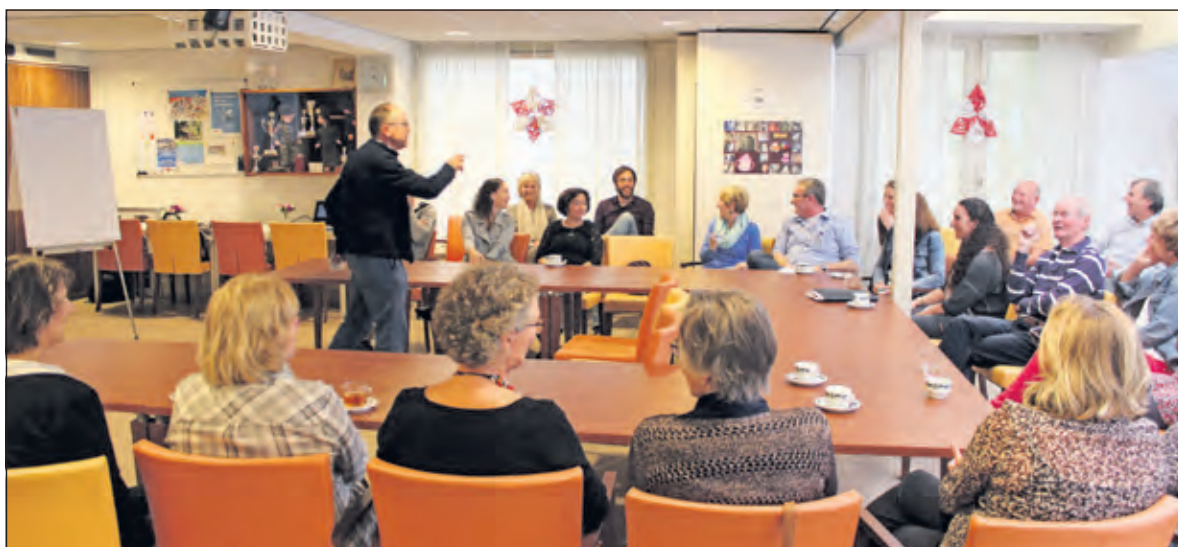
Woensdag 7 oktober was er in Maartensdijk een (eerste) bijeenkomst van lokale zorgverleners met als doel een wijkgerichte zorginfrastructuur op te zetten.

De aanwezigen reageerden enthousiast en gaven collectief aan belangstelling te hebben voor een vervolgt raject, waarbij de verbinding naar, coördinatie van en samenwerking met andere zorgverlenerspraktijken en welzijnsorganisaties verder uitgewerkt gaat worden. Deze eerste bijeenkomst werd onder het genot van een hapje en een drankje afgesloten.