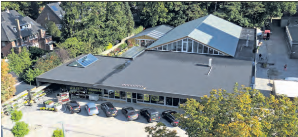
Hubo, Tuinmarkt en Rijwielpaleis samen in een aantrekkelijk nieuw complex.

Hubo verschilt vooral van andere bouwmarkten in het leveren van maatwerk. 'Daar waar de grote organisaties geen oplossing hebben, leveren wij die. Kasten, zonwering, we kunnen alles op maat maken. In de werkplaats kunnen we ideeën van klanten uitwerken en helemaal naar wens maken. Hubo geeft om de twee weken een folder uit. Op www.hubobilthoven.nl staat informatie over de zaak in Bilthoven. Er verschijnt een openingskrant met extra laag geprijsde artikelen.