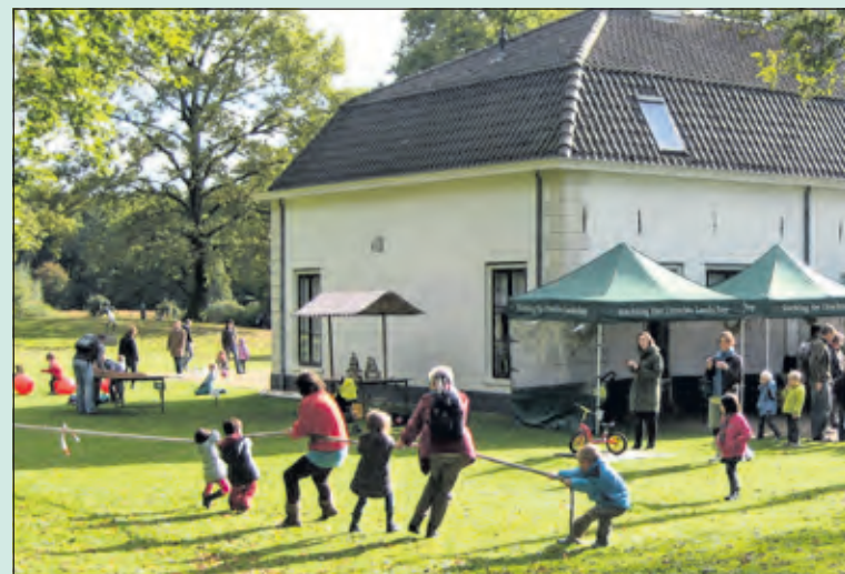
Aanstaande zondag bruist het van de activiteiten op Beerschoten.

Er is die dag ook een wandelexcursie over het landgoed Beerschoten en Houdering. Informatie hierover op de website www.utrechtslandschap.nl . De start om 14.00 uur bij paviljoen Beerschoten, De Holle Bilt 6 in De Bilt;