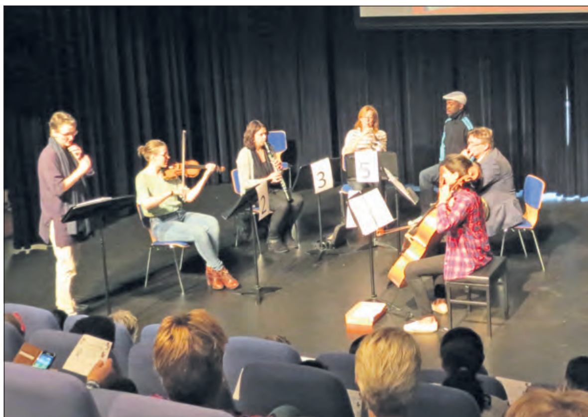
Leerlingen maken kennis met de instrumenten die ze gaan bespelen.

muziekgroep voor de cliënten van Reinaerde. De Koninklijke Biltse Harmonie en de Brandweerharmonie worden betrokken bij het ontwikkelen van het vervolgtraject voor kinderen die na een jaar door willen gaan met muziekles. [GG]