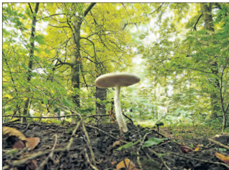
De zeer giftige Panteramaniet op Sandwijck.

Men kan zich voor de wandeling aanmelden tot uiterlijk vrijdag 16 oktober 18.00 uur op website info@ivndebilt.nl o.v.v. naam, e-mailadres en telefoonnummer. Startpunt parkeerterrein landgoed Sandwijck aan de Utrechtseweg 301-305, De Bilt. Deelname is gratis, honden zijn niet toegestaan. Voor meer informatie Jaap Milius 030 2288636.