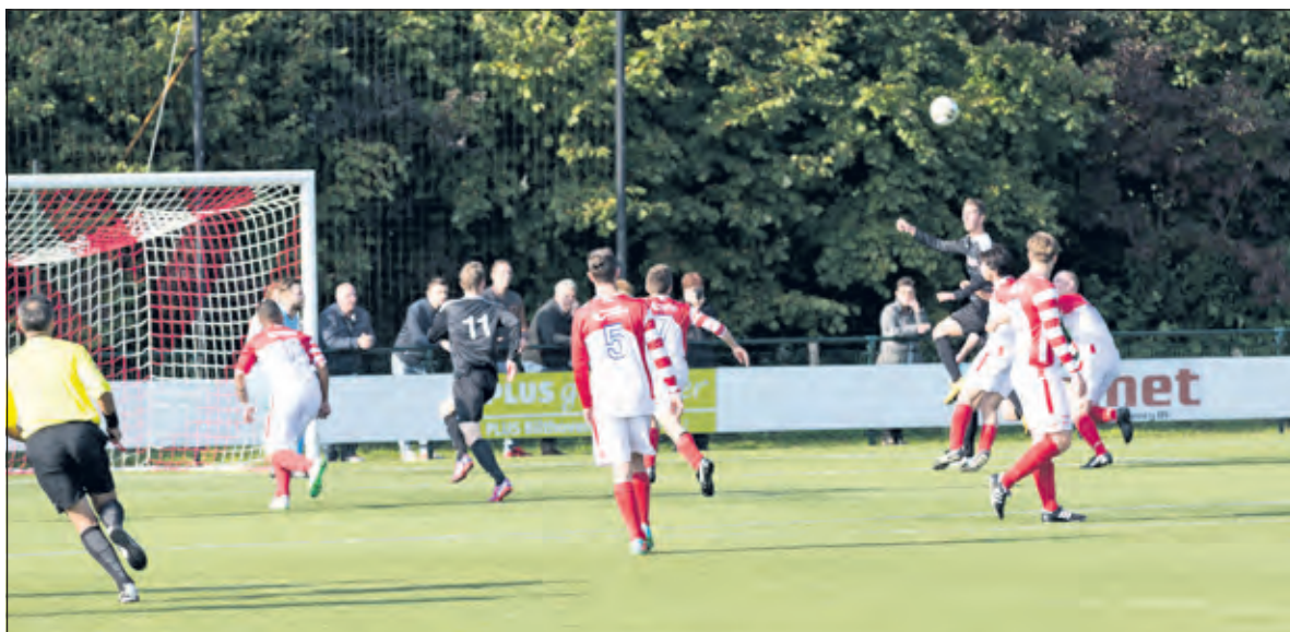
Druk op het doel.

de 1-2 op. En vanaf toen stortte de Biltse brigade in elkaar. Roland van Dijk liep tegen een gele kaart op na een harde overtreding. Uit de toegesende vrije bal kopte Benschop tegen de paal, maar uit de volgende aanval was het wel 1-3 en even later zelfs 1-4. Beide doelpunten leken op elkaar. Een goede voorzet werd goed raak gekopt. En FC De Bilt kon daar weinig tegenover zetten. Karim Aref en Sam Eerdmans vervingen Victor Veldman en Jelle Vlieg. Alleen Mike kreeg nog een paar kleine mogelijkheden. De grootste kansen waren voor de gasten, maar die wisten niet meer te scoren.