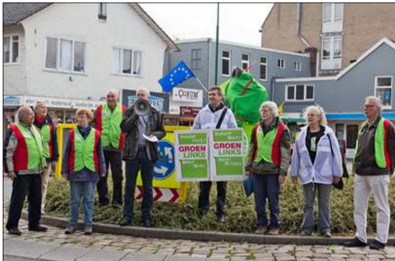
GroenLinks bij de vergroende 'Roof van Europa'.

Dat betekent volgens De Boer overigens niet dat er geen verbeteringen mogelijk en zelfs noodzakelijk zijn. 'Het Europese project is de afgelopen decennia (te) sterk gedomineerd door de economie van de korte termijn en door de euro.