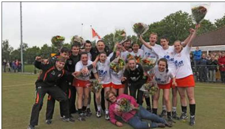
Feest bij TZ.

In de eerste helft slaagde TZ er niet in het niveauverschil in scores uit te drukken. Wellicht was het de spanning, maar ook de slechte weersomstandigheden speelden een rol. De kampioenskandidaat startte stroef, aanvullend werden er te weinig kansen gecreëerd. ZKV kon daar ook niet veel tegenover stellen, hoewel de tactiek die de Zaandammers bedacht hadden het Tweemaal Zes niet gemakkelijk maakte. Bij 5-5 konden de korfballers de droge kleedkamer opzoeken.