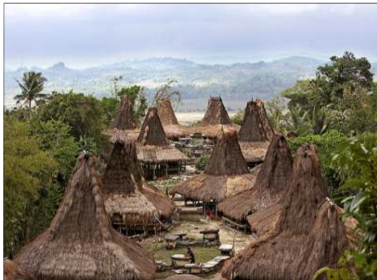
De stand van Stichting Ontwikkelings Samenwerking De Bilt is goed herkenbaar aan de beachflag met deze foto.

Voor dit project heeft SOS De Bilt ervoor gekozen om samen te werken met Hivos, een internationaal werkende organisatie voor ontwikkelingssamenwerking op humanistische grondslag. Zaterdag 17 mei zijn ze met een kraam aanwezig op de Duurzaamheidsmarkt aan de Julianalaan en vindt de officiële start van dit nieuwe projectwerk plaats. In de komende maanden wordt contact gezocht met scholen, bedrijven en instellingen om hun werk