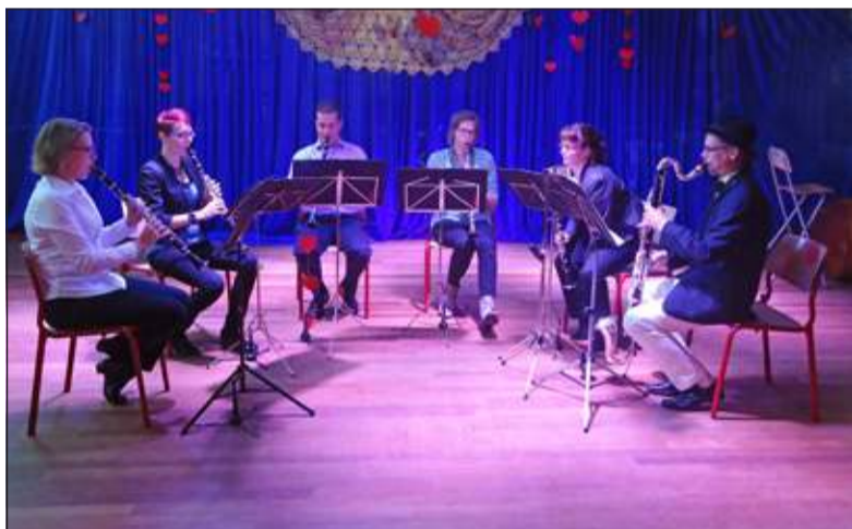
Het klarinetensemble van de KBH tijdens het High Tea Moederdagconcert.

Orkestleden van de Koninklijke Biltsche Harmonie hadden bijzonder lekkere en vooral ook mooi opge-