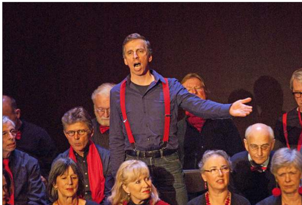
Zing en Swing concert komt er aan.

Zelf meezingen met het meezingevenement kan ook nog, maar er is nog slechts een beperkt aantal plaatsen voor zangers beschikbaar. Aanmelding kan via de website www.azmweb.nl .