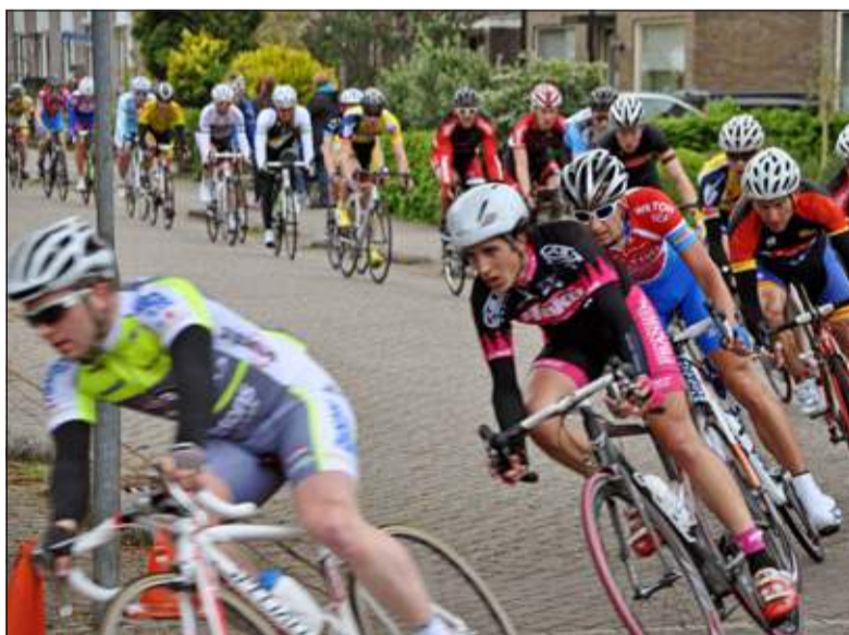
Komende zaterdag draaien de renners weer door de bochten tijdens 44e Maartensdijkse Acht.

Het belooft bij de amateurs een spannende wedstrijd te worden. Er staan diverse renners aan de start die de afgelopen jaren hebben aangetoond goed overweg te kunnen met het bochtige parcours in Maartensdijk. Oud-winnaars Al-