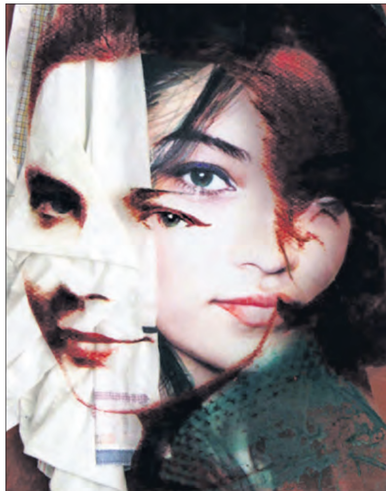
Een deel van de uitnodigingsprospectus.

In haar collages en assemblages toont zij deze hybride wereld van constante verandering en maakt gebruik van een breed arsenaal van fotografisch materiaal, geschilderde onderdelen, materialen als stof, touw en papier en gevonden voorwerpen. Zij exposeert regelmatig in binnen- en buitenland en haar werk is opgenomen in verschillende musea en particuliere verzamelingen.