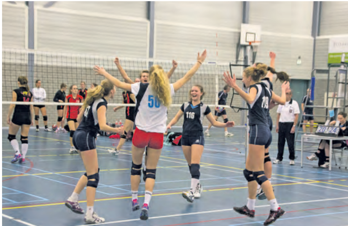
Blijdschap van het 1e damesteam van Irene volleybal na 3-1 winst op VVU.

Zaterdag 10 januari 2015 mocht Dames1 van s.v. Irene het opnemen tegen Dames 2 van VVU. De dames van Irene wisten, dat hier kansen lagen en begonnen de wedstrijd met zenuwen. Hierdoor haalden zij in de eerste set niet het eigen niveau en ging deze uiteindelijk naar VVU. De tweede set wisten de dames van Irene zich te herpakken en bouwden een voorsprong op. Halverwege de set gaven ze deze uit handen en leek het erop dat de set weer naar Utrecht zou gaan. Gelukkig kwam Irene er bovenop en behaalde uiteindelijk de winst van die set. De derde set was een herhaling van de tweede set, die Irene uiteindelijk pakte met goede serseries. De vierde set nam Irene duidelijk het voortouw en de dames wonnen deze met een constante voorsprong. De vreugde was groot toen Dames 1 van Irene hun eerste 3-1 winst boekten van 2015. Hopelijk wordt deze lijn voortgezet.