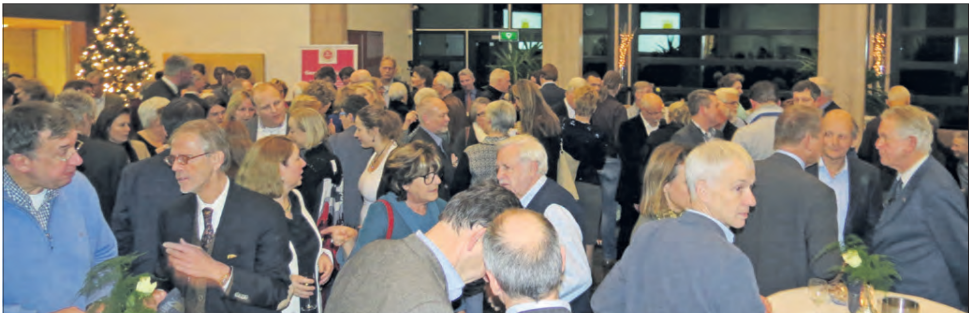
De nieuwjaarsreceptie in de Mathildezaal trok grote belangstelling.

enigingen, trouwe mantelzorgers, wijk- en dorpsraden, ondernemers, sportverenigingen, hulpdiensten zoals politie en brandweer. In cultuur, kunst en muziek, overal zie je vrijwillige en beroepsmatige inzet om samen een samenleving te zijn. Wij laten ons niet uit elkaar spelen. Wij horen bij elkaar.’