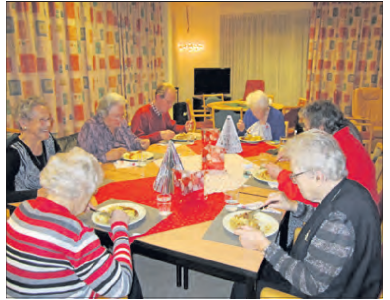
Op maandag, woensdag en vrijdag is er gelegenheid om gezamenlijk een maaltijd te nuttigen.

Ook is er een ruimte waar computer- en tabletcursussen gegeven kunnen worden. Een groep enthousiaste docenten geven les op maat. Ze laten u kennis maken met uw computer en/of een tablet. Woensdag 21 januari 2015 is er weer een open dag (10.00 – 15.00 uur). Er ligt dan ook een nieuw programma met cursussen klaar. Elke maandag-