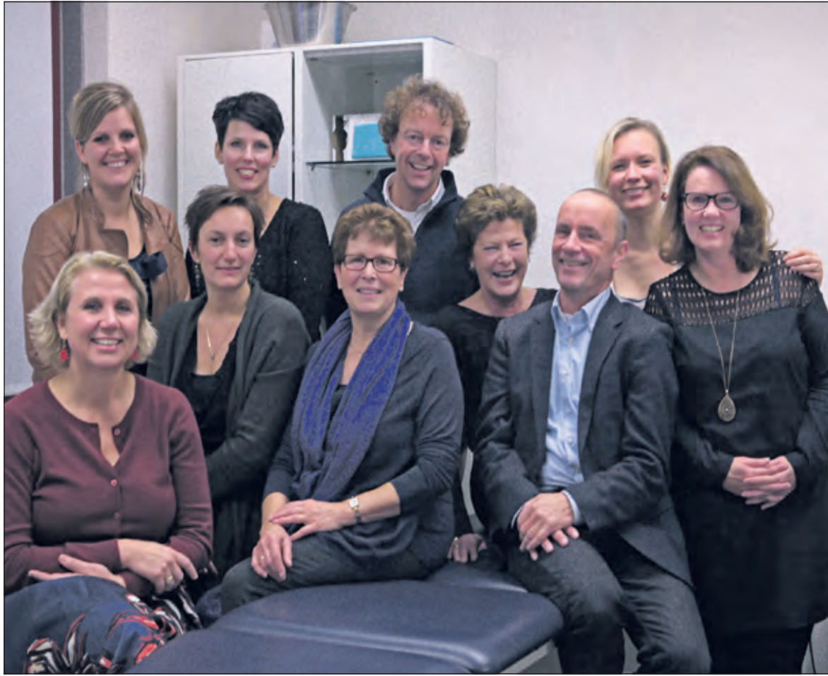
Het team van de Huisartsenpraktijk Maartensdijk

In een gezellige sfeer met elkaar samenwerken doen de huisartsen van de praktijk aan de Molenweg graag. Maar door ruimtegebrek in het pand werd het daar wel heel erg knus. Voor de huisartsen die een rondje lopen door de nieuwe praktijkruimtes in het Centrum voor Zorg en Welzijn op het Maertensplein is het dan ook een verademing: rust en ruimte. 'Dat zal de zorg ten goede komen.'