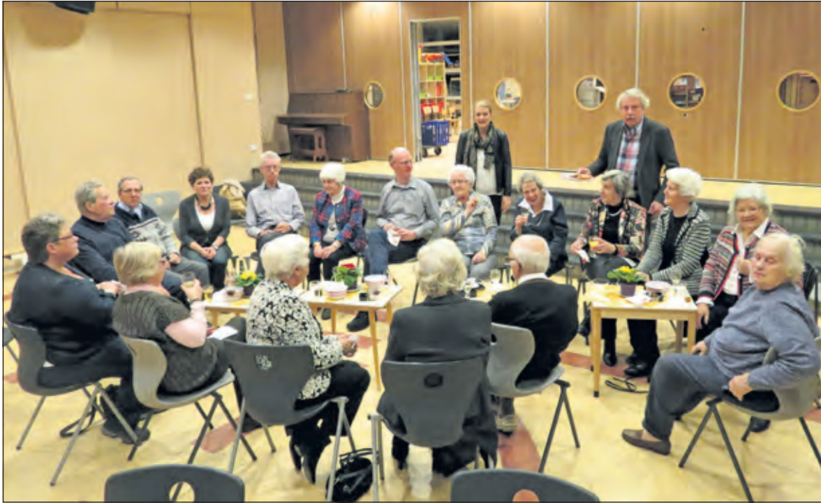
Goede contacten worden over en weer erg gewaardeerd.