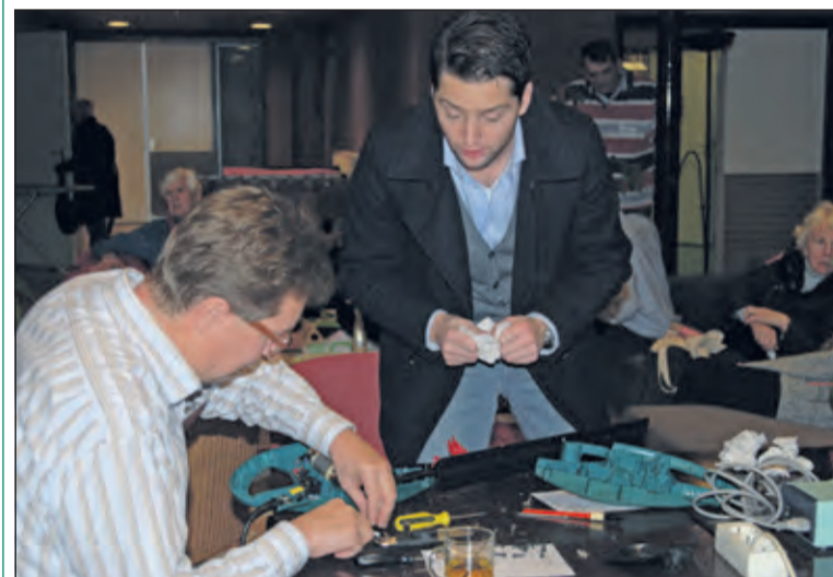
Het repareren van een heggenschaar kost aardig wat moeite.