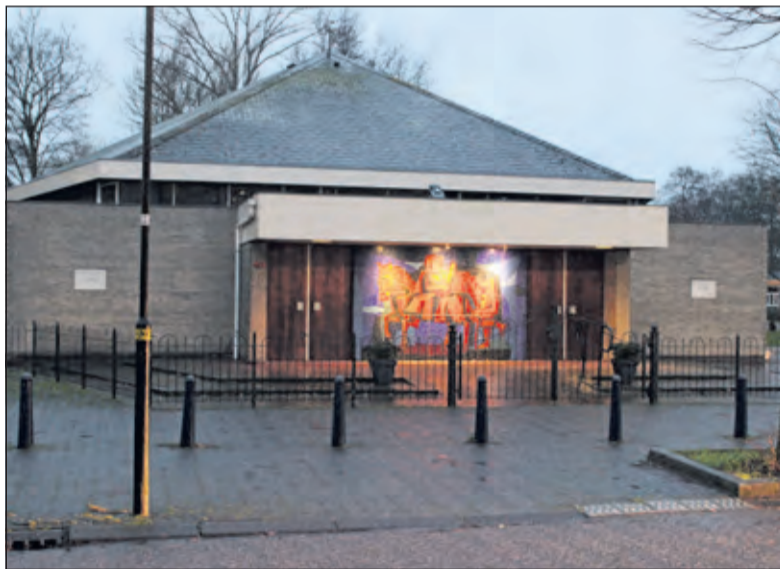
De Volkskerstzang is in de St. Maartenskerk te Maartensdijk.