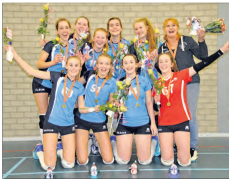
De kampioenen met coach.

De Irene meiden hebben er de laatste twee wedstrijden geen gras over laten groeien en de zegereeks voortgezet. Thuis in de Kees Boekahal wint Irene op 26 november van VCV MB1 uit Veenendaal ook weer met 4-0. De laatste wedstrijd 3 december in Almere, speelde Irene wederom tegen VC Allvo MB1, waarbij de Irene-meiden weer alle vier de sets wonnen. Dat de Irene meiden zeer gemotiveerd zijn, blijkt in de tussentijdse trainingen, waar ze schijnbaar met het grootste gemak maar zeker met plezier zeer intensieve oefeningen doen. Irene MB1 sluit de eerste seizoenshelft in de hoofdklasse af zonder een set verlies en promoveert naar de Topklasse.