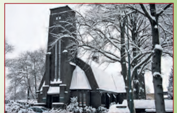
Immanuelkerk, Soestdijkseweg Zuid 49, De Bilt