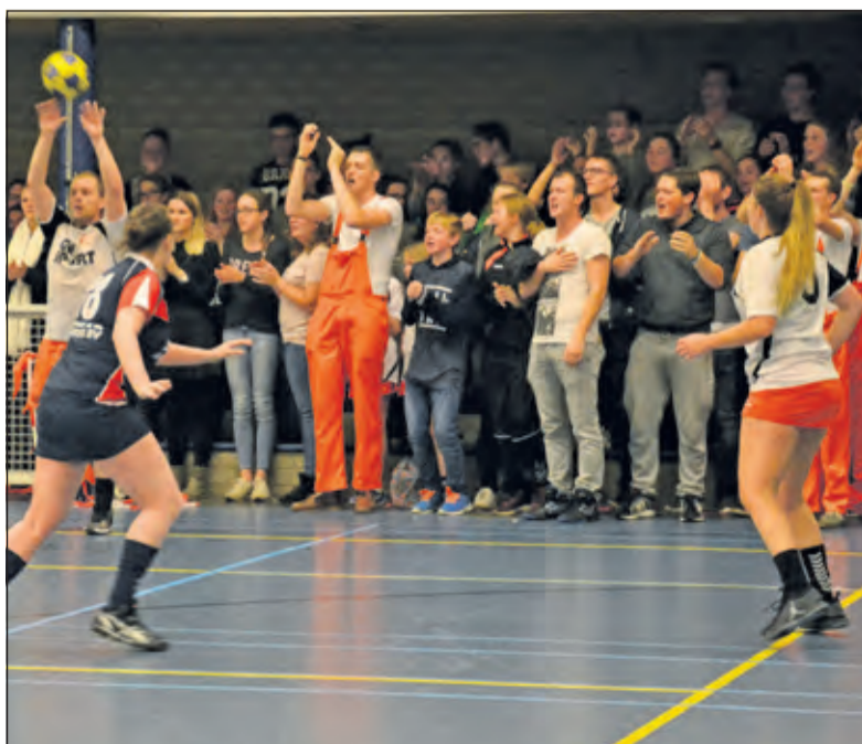
Eén van de laatste schoten van de wedstrijd voor een enthousiaste Tzide.

Volgende week wacht SKF, wederom thuis in Maartensdijk. De ploeg uit Veenendaal won afgelopen zaterdag van De Meeuwen. De resultaten van SKF zijn wisselvallig, maar de ploeg heeft wel