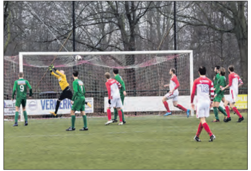
Het weer en de wedstrijd waren niet best.

Ricardo af te gaan, maar daar was de nog snellere Ashwin de Ruijter die net op de tijd een schitterende verdedigende actie inzette en erger voorkwam. Dat leek wel het startsein voor een waar slotoffensief van de Biltse mannen en in de resterende minuten werd de 2-3 achterstand in een 5-3 winst omgezet met een doelpunt van Steven van den Berg en twee van Tom Karst. De competitie wordt hervat op zaterdag 28 januari 2017 met de uitwedstrijd tegen TAVV.