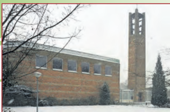
Opstandingskerk, 1ste Brandenburgerweg 34, Bilthoven