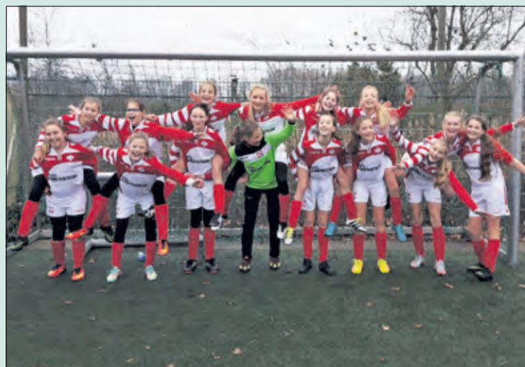
Na de winterstop zijn er maar liefst negen meisjesteams actief bij FC De Bilt in vijf verschillende leeftijdscategorieën.