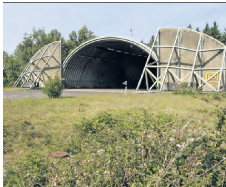
Utrechts Landschap hoopt eigenaar van het park te worden.

blijvend in goede handen. We zijn de grootste natuurbeheerder in de provincie, doen dit al bijna 90 jaar met hart en ziel en met de steun van tienduizenden Utrechters. Bovendien stellen we onze natuurgebieden gratis open voor bezoekers'. Utrechts Landschap heeft