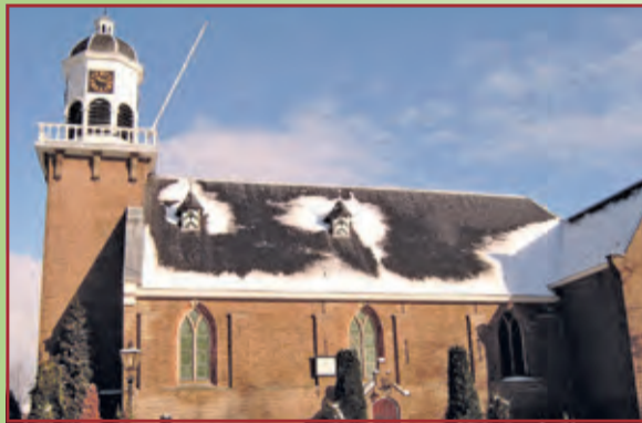
Dorpskerk, Burgemeester De Withstraat 29a, De Bilt