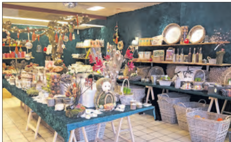
De Kwinkelier is met de Kerstcadeau-shop weer een pop-up store rijker.

In de kerstcadeau-shop treft men allerlei leuke zaken aan voor in en om het huis: van openhaard blokken tot verlengsnoeren en van vogelvoer tot kerstversieringen.