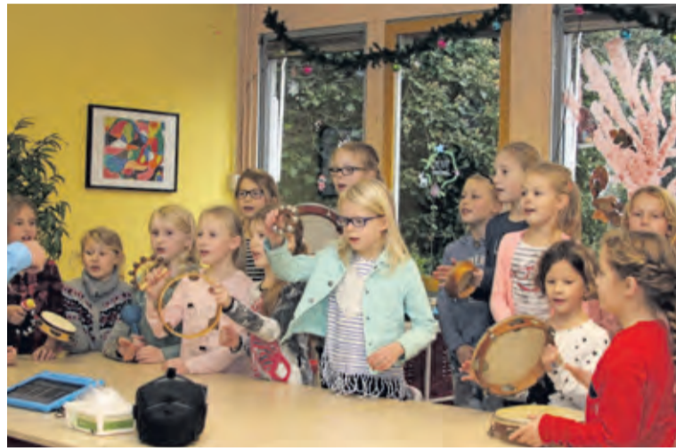
Kinderen van de Nijepoort oefenen voor hun optreden in de Dorpskerk.

Iedereen is welkom op woensdag 21 december in de Dorpskerk aan de Groenekanseweg. De kerstzang begint om 19.30 uur. De opbrengst van de collecte is bestemd voor de Voedselbank in De Bilt.