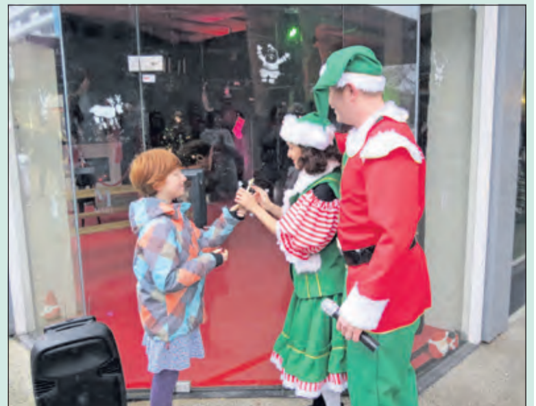
De officiële opening van het Kersthuis.

Voorafgaand aan de opening trad het kerstkoor Close Focus op verschillende plekken in Bilthoven Centrum a capella op met kerstsongs. Na de feestelijke opening van het Kersthuis bracht het koor bij de grote kerstboom op het plein nog een aantal liederen ten gehore. Op de zaterdagen en woensdagen tot Kerstmis en koopzondag 18 december zullen kerstengelen in het Kersthuis aanwezig zijn om kinderen te vermaken en kerstknutsels te maken. Op 18 december komen Chloe en haar Toverkast op visite in het Kersthuis. Chloe's Toverkast is een Brits-Amerikaans kinderprogramma. In Nederland wordt het door RTL uitgezonden bij RTL Telekids. De hoofdrol in de serie wordt gespeeld door de vierjarige Chloe. Zij ontdekt in iedere aflevering vanuit haar slaapkamer een magische nieuwe wereld als ze zichzelf verkleedt. [GG]