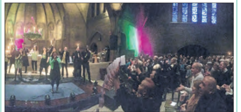
Enthousiast applaus voor Wazzup.

Het Kerstconcert van de Rotaryclubs Zandzegge en De Bilt-Bilthoven is een jaarlijks terugkerende traditie waaraan telkens een ander goed doel wordt verbonden: dit jaar gaat de opbrengst naar verschillende bijzondere Biltse goede doelen op gebied van cultuurbevordering, gemeenschapszin en medemenselijkheid. (Peter Schlamlich)