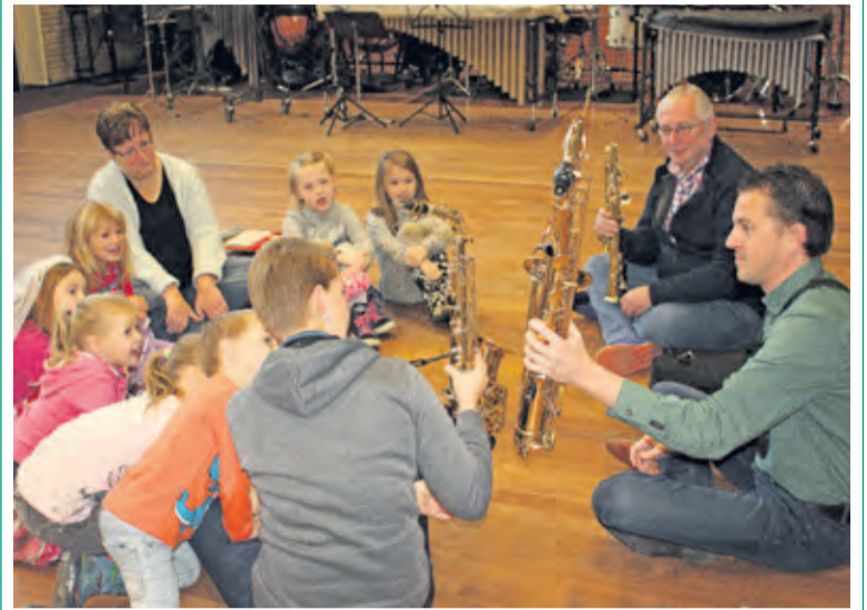
Superkids maken kennis met muziek.