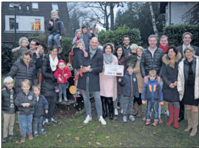
Met een donatie van 6.000 euro kan de speeltuin bij de Merellaan/Koekoekslaan tot grote vreugde van de wijkbewoners opgeknapt worden.