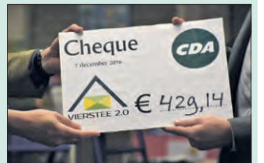
Duit in het zakje voor Vierstee 2.0.

Woensdag 7 december was de afdeling CDA De Bilt - Maartensdijk te gast in De Vierstee in Maartensdijk voor haar Algemene Ledenvergadering. Voorafgaand aan de vergadering praatte Stichting Vierstee 2.0 de aanwezigen bij over de komende Vierstee-renovatie en de plannen om van de gerenoveerde accommodatie een nog aantrekkelijker locatie te maken. Na de presentatie en rondleiding ging de pet rond bij de leden en kon de penningmeester van het CDA de Stichting een mooie cheque van maar liefst 429,14 euro overhandigen.