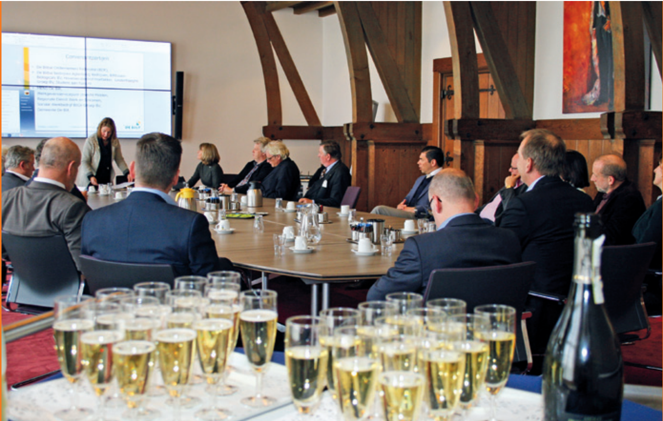
Een raadszaal vol betrokken ondernemers en instanties kan een toast uitbrengen op een mooie samenwerking.

we extra begeleiding in of maken we gebruik van andere voorzieningen of financiële regelingen. De grootte van het bedrijf is van ondergeschikt belang, alles wat we doen is maatwerk. De werkgever krijgt een goed gemotiveerde arbeidskracht en kan zo een belangrijke impuls geven aan de lokale arbeidsmarkt.'