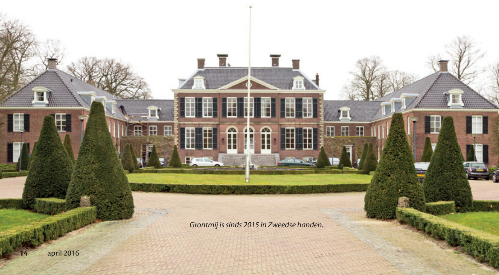
Grontmij is sinds 2015 in Zweedse handen.