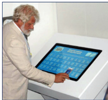
Ondernemers uit Westbroek presenteren zich digitaal op het ondernemersportaal.

verscheidenheid aan thema-avonden. Een greep uit de avonden die georganiseerd zijn: verkiezingsavond met de politieke partijen uit de gemeente De Bilt, Belastingdienst, bedrijfsverzekeringen, workshop gebaseerd op het gedachtegoed van Steven Covey, informele netwerk avond met opdrachten tot verbinden en een bedrijfsbezoek bij De Wilde Metaal. Ter afsluiting van het jaar is er een WOC-diner avond. Tijdens de WOC avonden presenteert een Woccer zijn of haar bedrijf onder de noemer van de WOC-pan presentatie. Zo is er een wijnproeverij geweest en een brainstormavond voor het nieuwe groene schoolplein van de basisschool het Kompas.