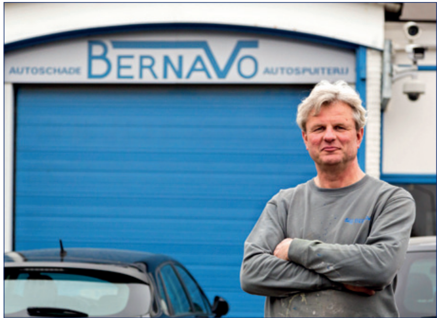
Bernavo is sinds 1991 gevestigd op het industrieterrein.