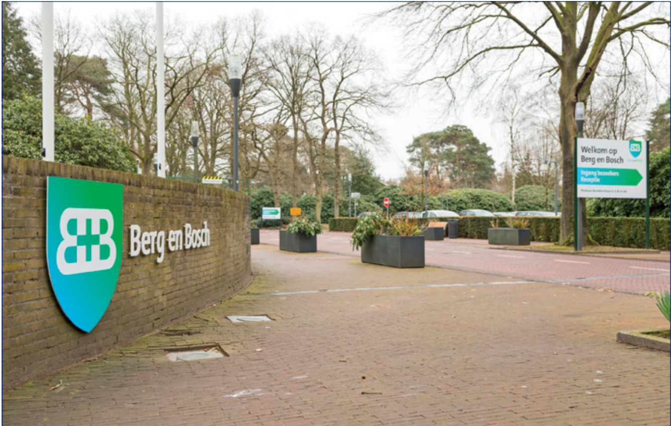
Het Berg en Boschterrein is inmiddels eigendom van een investeringsgroep uit Singapore.

onaal georiënteerde sector, waarvoor internationale acquisitie van groot belang is. Een specifiek economisch profiel vraagt ook specifieke acquisitie. Voor internationale acquisitie is een goede samenwerking nodig met