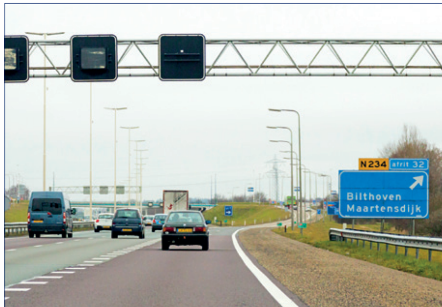
Het industrieterrein is goed bereikbaar vanaf de A27.