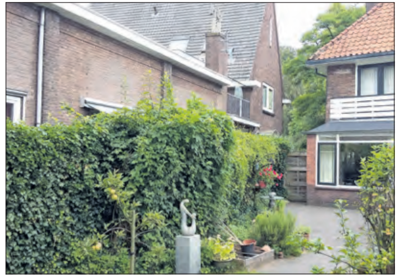
Links het KDV, recht het huis van omwonenden aan de Groen van Prinstererweg.

De omwonenden zeggen dat voor hen de maat vol is: 'Wij zijn zo netjes geweest om de gemeente te geloven dat er uiterlijk 2009 een oplossing zou zijn. We leven thans in