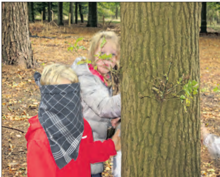
Neem waar met je zintuigen.

Het Utrechts Landschap (HUL) organiseert in samenwerking met het IVN De Bilt bij Paviljoen Beerschoten in De Bilt een leuke en leerzame middag voor kinderen van 6 tot en met 10 jaar op woensdag 21 september van 14.30 tot 16.30 uur. Het thema is Zintuigen. Horen, zien, voelen, ruiken en proeven. Zintuigen zijn uitwendige organen die ons maar ook dieren de mogelijkheid geven om dingen waar te nemen. Maximaal 3 kinderen per opgave aanmelden. Maximaal 10 kinderen per middag. Bij minder dan 4 aanmeldingen gaat de middag niet door. Aanmelden kan alleen per e-mail tot en met zondag 18 september KinderNatuurActiviteiten@gmail.com.