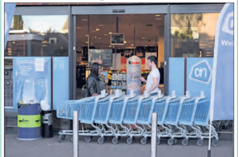
De Albert Heijn aan de Herenweg in De Bilt is vrijdag 9 september vanaf 14.00 uur ontruimd geweest vanwege een CO2-lek. Zaterdag 10 september vanaf 8.00 uur waren de klanten weer van harte welkom om hun boodschappen te doen.

Frans parlement en investeerde zijn inkomen in de huisvesting van slachtoffers van de woningnood in Parijs. Bij de verkiezing van de Grootste Fransman ooit werd hij derde. Abbé Pierre overleed in 2007 op 94-jarige leeftijd in Parijs.