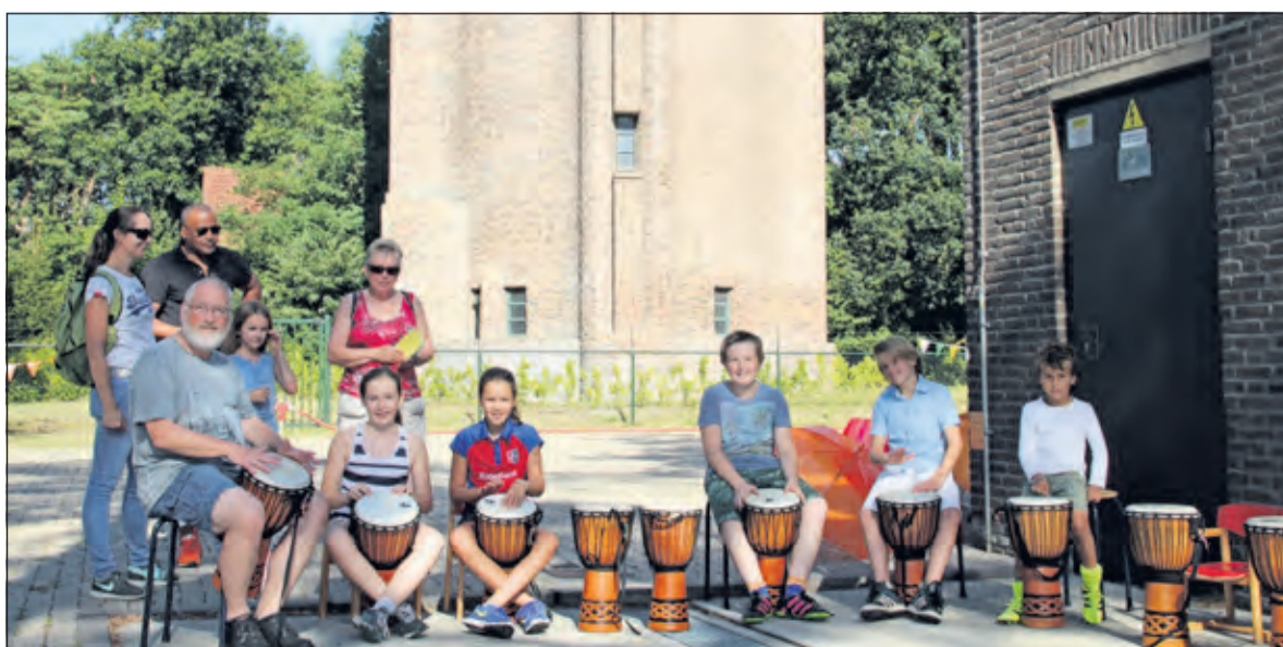
Leerlingen van de Julianaschool verzorgen een muzikal optreden bij de watertoren.

ter (spuiten en rondleiding bij het bassin) en 's ochtends verzorgden leerlingen van de Bilthovense Julianaschool muzikale optredens.