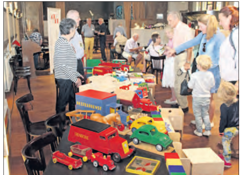
Sterk Spul zong er ook over: 'En men maakte hier ook speelgoed. Het symbool daarvan, 'ADO'. Degelijk en mooi ontworpen, en voor toen een pracht cadeau'.

'Het Berg en Bosch-terrein is een van de landelijk bekende iconen, en ook onderdeel van de Life-science-as, die dwars door de gemeente loopt. Daarmee sluit het ook perfect aan op het thema van deze monumentendag 'Iconen en symbolen. Hoewel ik, kijkend naar het programma, misschien ook wel mag spreken over 'Verborgen Iconen en Symbolen'. Plekken die symbool staan voor onze gemeente of voor onze identiteit, maar soms ook onbekend en veelal bewust verborgen zijn. Zo zou je niet meteen verwachten dat in dat bos aan de Kanaaldijk in Hollandsche Rading