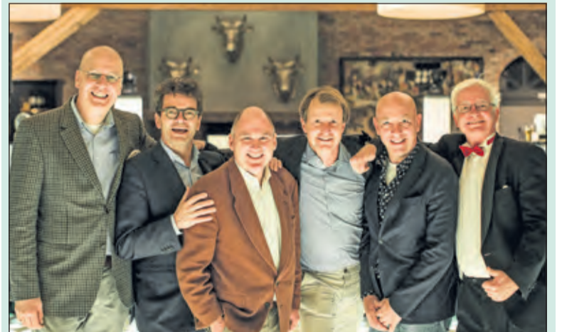
Op zaterdag 17 september speelt TSWINGS vanaf 22.00 uur in PK Bar & Kitchen Bilthoven (Julianalaan 10), ter gelegenheid van de ALS Lenteloop Afterparty, de toegang is gratis.

Het uiteindelijke ingezamelde bedrag voor het goede doel is € 235.000,-. Een gigantisch groot bedrag dat bij elkaar is gebracht dankzij de vele deelnemers, vrijwilligers en het grote aantal sponsors die er aan verbonden waren.