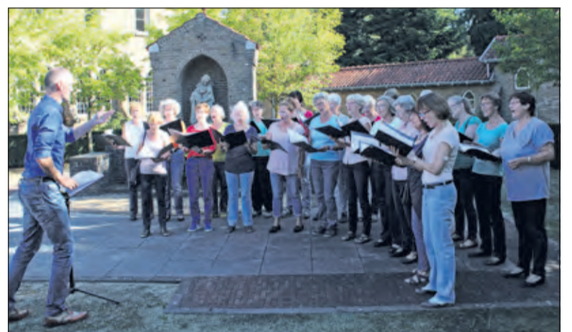
Vrouwenkoor 'Ludi Cantare' (opgericht in 1984). Ludi Cantare betekent 'zingen met speelse ondertoon', populair gezegd: 'lekker zingen' een dat werd ook bij de opening van Open Monumentendag 2016 aangetoond.