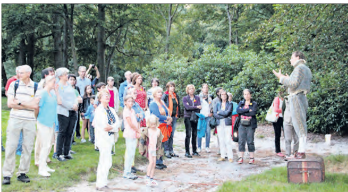
De avondwandelingen 'Geheimen in de duisternis' voerden de bezoekers terug naar het Eyckenstein van 200 jaar geleden.

ren er twee bijna 'uitverkochte' historische avondwandelingen onder leiding van 'Burgemeester Maurits Eyck van Zuylichem'. Belangstellende gingen in het park op zoek naar onraad.