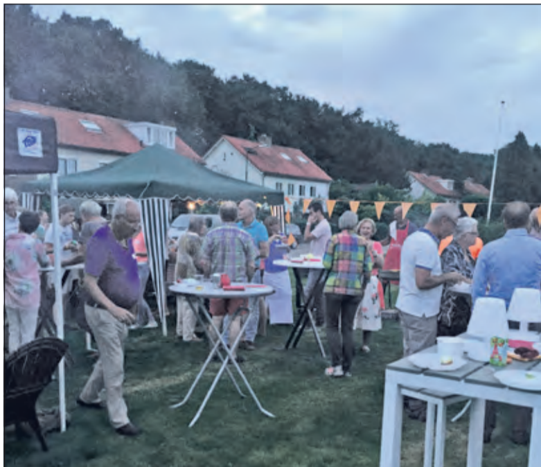
Inwoners van Hollandsche Rading vinden elkaar tijdens een bijzondere sfeervolle avond op de Tolakkerweg.

Zaterdag 10 september was het culinair genieten aan de Tolakkerweg in Hollandsche Rading; zo'n 75 bewoners van het Vierkantje aan de Tolakkerweg hadden de buurtbarbecue nieuw leven ingeblazen. Het weer werkte goed mee, de zon scheen volop en de voorspelde kleine regenbui bleef gelukkig uit.