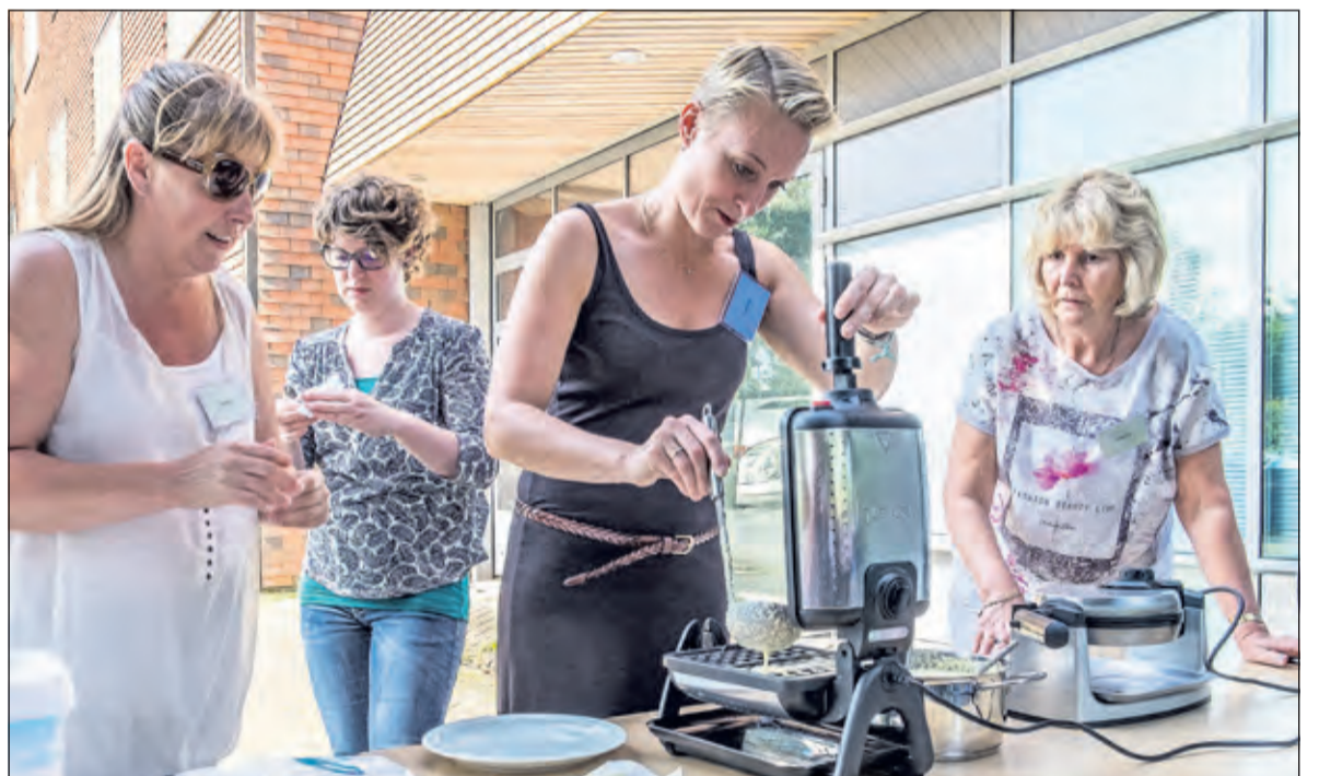
Wafels BAKKEN in de Koperwiek.

woners van het huis getraakteerd op een lekker stukje gebak. Bij de Rinnebeek hebben bewoners uit volle borst meegezongen met een draaiorgel tijdens een gezellige oud Hollandse middag. Ook hier trakteerden RIVM'ers op warme verse wafels. Bij het Leendert Meeshuis op het Berg en Bosch terrein bakte men heerlijke zandkoekjes, werd gewandeld en werden spelletjes gedaan.