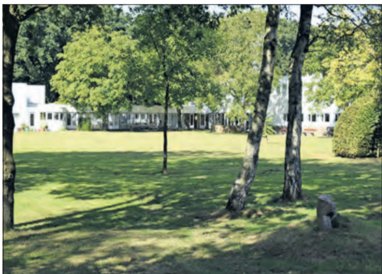
Ook congrescentrum Renova gooide haar deuren open tijdens de monumentendag.