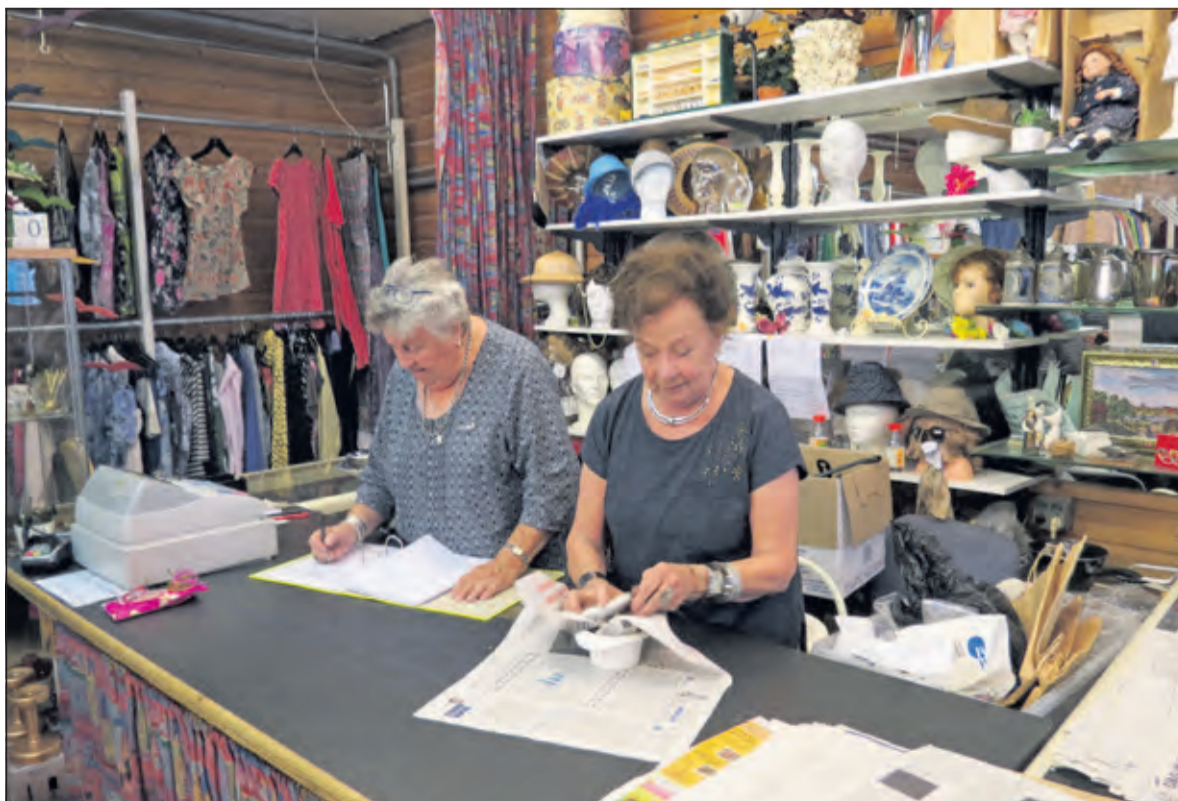
Het is hard werken in de winkel.

stuur van Emmaus Bilthoven de secretarisrol. Verder doet hij aan het promoten van de doelstelling van de organisatie. Hij is sinds 2005 bij Emmaus Bilthoven betrokken. Emmaus is een wereldwijde beweging die mensen die het meest lijden ondersteunt. De Emmausbeweging werd in 1949 opgericht door Abbé Pierre, een Franse priester die zich inzette voor armen en daklozen. Hij was van 1945 tot 1951 lid van het