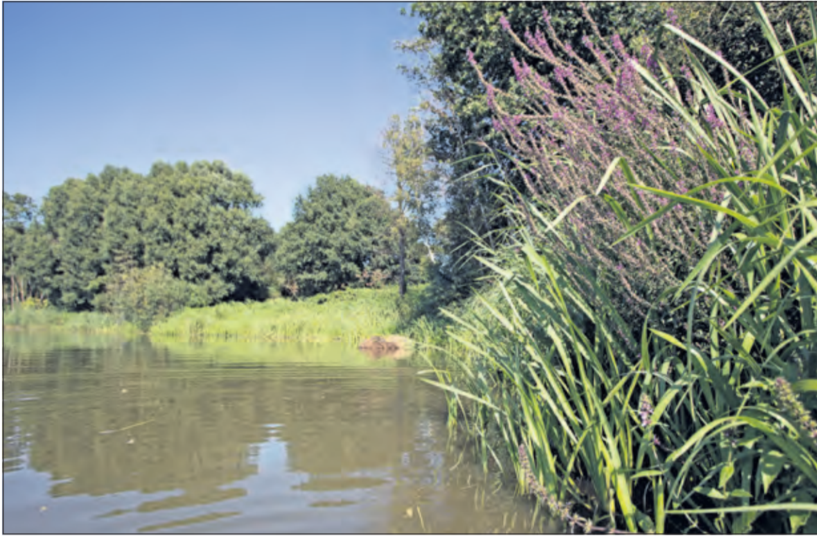
Oeverzone met egelskop, liesgras en bloeiende kattenstaart.

Het Utrechts Landschap heeft als eigenaar van de Hooge Kampse Plas opdracht gegeven om deze voormalige zandwinplas en stortplaats om te vormen tot een prachtig natuurgebied.