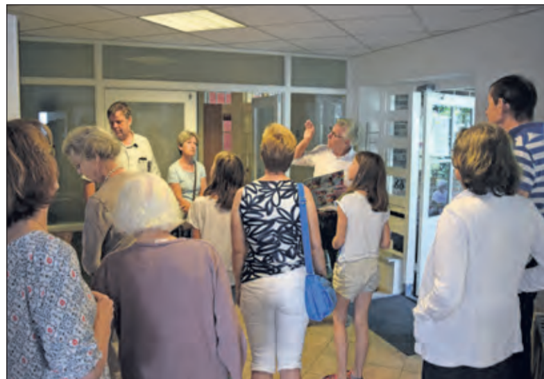
Gedurende de gehele Open Monumentendag werden belangstellenden rondgeleid door de voormalige Kees Boekeschool aan de Frans Halslaan in Bilthoven.