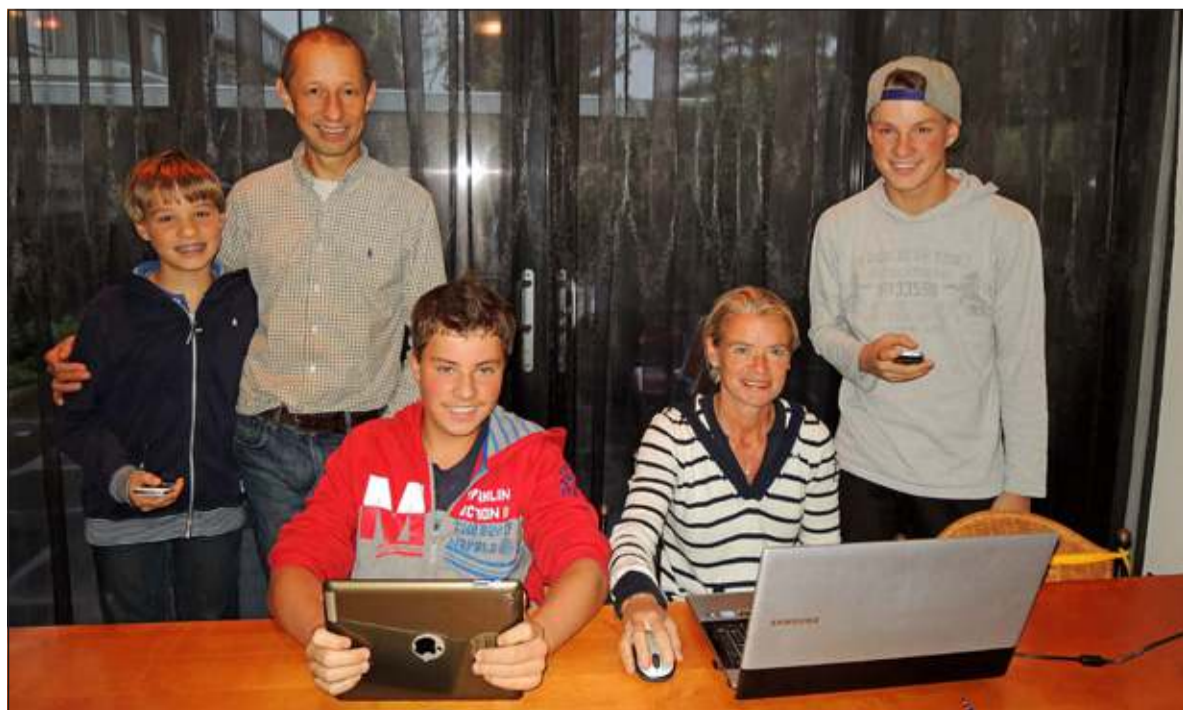
Voor de familie Elling was de keuze voor glasvezel snel gemaakt.

glasvezel, de aanleg en glasvezelabonnementen terecht in de glasvezelwinkel van Reggefiber aan de Kwinkelier 25 in Bilthoven. De glasvezelwinkel is geopend van woensdag tot en met zaterdag. Reggefiber organiseert tevens een informatieavond in Bilthoven. Alle inwoners zijn op maandagavond 2 december om 19.30 uur van harte welkom bij de Werkplaats Kindergemeenschap aan de Kees Boekelaan 12. Meer informatie is ook te vinden op de website van Reggefiber www.eindelijkglasvezel.nl/bilthoven .