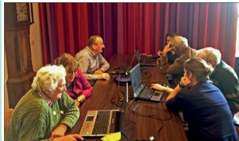
Door middel van intensief 1-op-1 contact maakten de ouderen kennis met de verschillende zoeksystemen en mailprogramma's op de computer.

In wijkrestaurant Bij De Tijd werden belangstellende senioren van De Bilthuysen op dinsdag 29 oktober getraakteerd op een heuse computerles. Deze les werd gegeven in het kader van de vrijwilligersactiviteiten van de gemeente De Bilt. Na een gezellige kennismaking en een uitgebreide lunch nestelden de ouderen zich achter de laptops om kennis te maken met de wondere wereld van de computer. Computers kennen voor de jongere generaties nog nauwelijks geheimen. Maar hoe anders is dat voor mensen in het verzorgingshuis. De enorme opmars van internet, social media en digitale informatie-uitwisseling is grotendeels aan hen voorbij gegaan. Vandaar dat het idee werd opgevat om de ouderen een les te geven in de basisbeginselen van de computer. Hoe verstuur je een mail? Hoe kan je informatie opzoeken op het internet? Waar kan ik terecht voor filmpjes, liedjes of foto's? Kortom een kennismaking met de grondbeginselen van de digitale wereld.