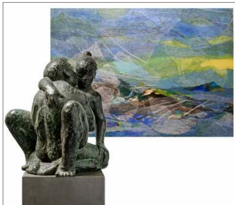
Zephyros en Hooglied