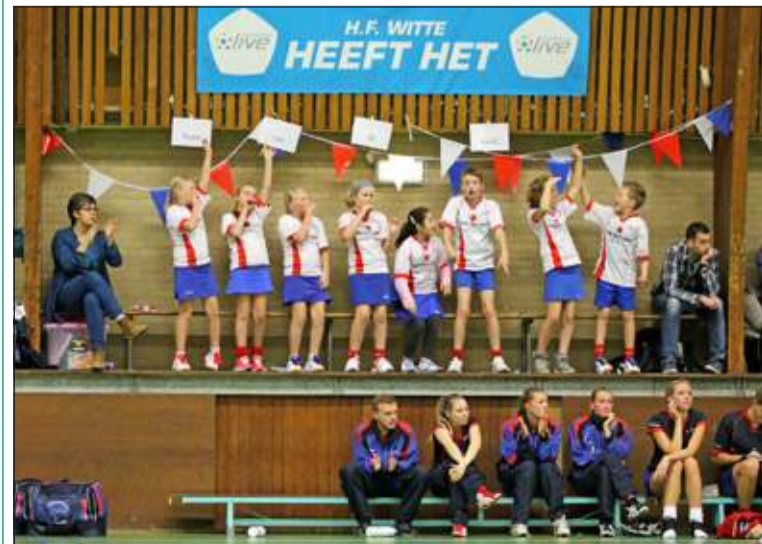
Het team van de week moedigde Nova aan in de sporthal van het HF Wittecentrum.

Ondanks het verlies kan Nova terug kijken op een zeer positieve wedstrijd. Met de uitwedstrijd tegen Viking in het verschiet is het ook belangrijk om dit gevoel vast te houden en om de punten dan mee richting Bilthoven te nemen. De wedstrijd tegen Viking start om 20.00 in Wijk bij Duurstede.