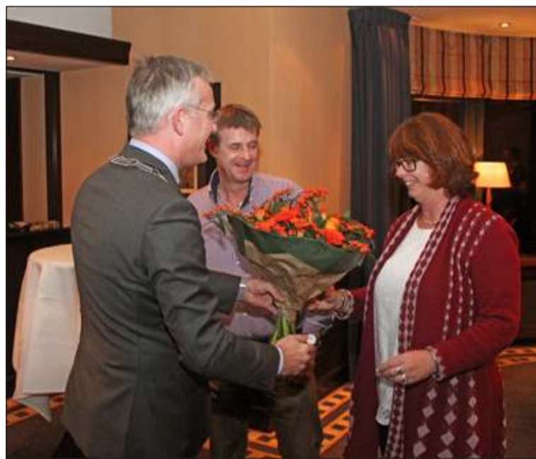
Een onderscheiding en bloemen voor het echtpaar Gielen.

De heer Gielen is koninklijk onderscheiden vanwege zijn grote verdiensten voor de Biltse brandweer. Van 1975 tot 2013 is betrokkene actief geweest voor de vrijwillige brandweer van De Bilt, post Bilthoven. Hij heeft hiermee een langdurige bijdrage geleverd aan de openbare orde en veiligheid in zijn woonplaats en de regio. Hij kan worden gekwalificeerd als iemand die zich geruime tijd ten bate van de samenleving heeft ingespannen of anderen heeft gestimuleerd.