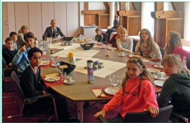
Aan de ontbijttafel maakten de kinderen en de burgemeester uitgebreid kennis met elkaar en wisselden ze van gedachten.