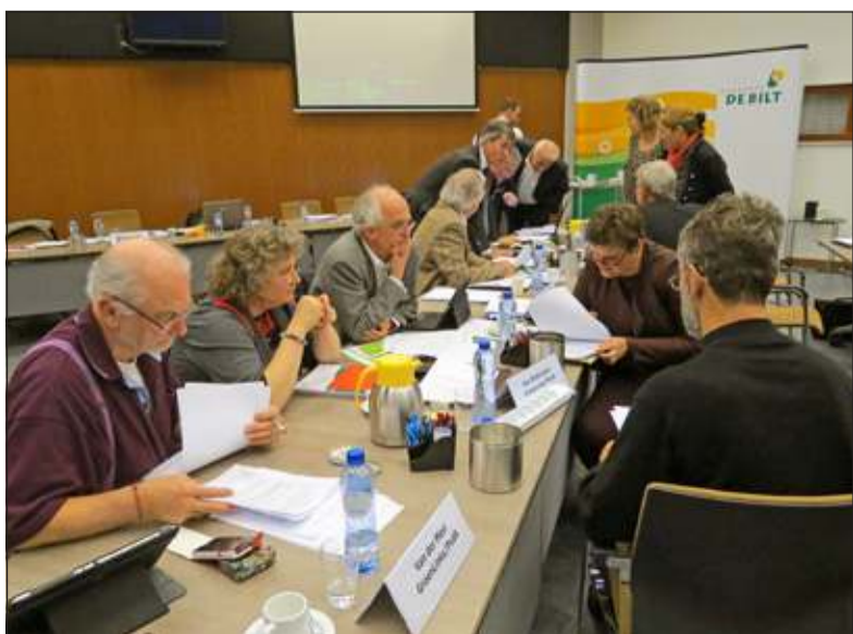
Tijdens een schorsing vindt overleg plaats over ingediende moties.