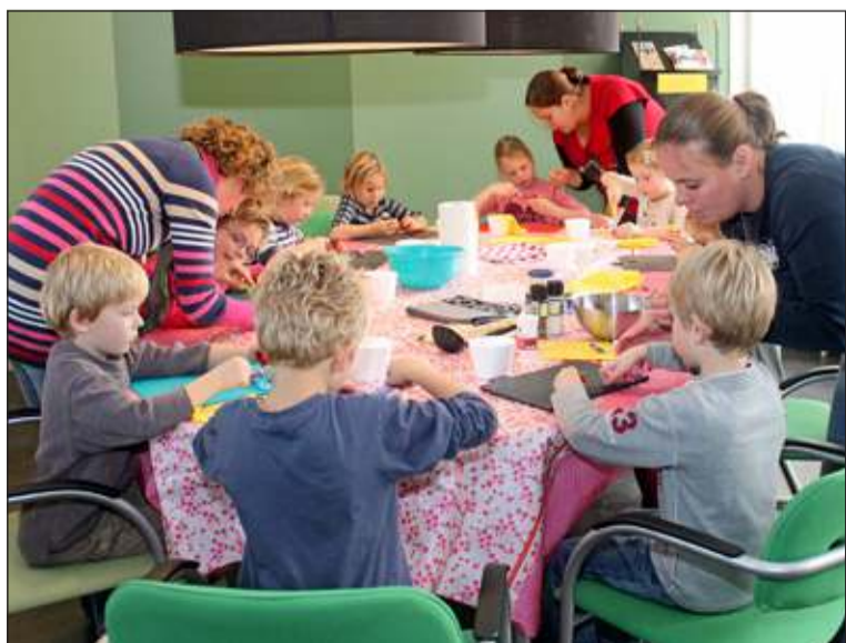
Vrijdag 8 november was er o.a. een workshop koken.

De zegereeks van de hockeysters van Voordaan blijft voortduren: Vier zeges op rij in twee weken zorgden voor een spectaculaire sprong op de ranglijst: de dames klommen van de elfde naar de zevende plaats. De mannen van Voordaan speelden Union van de mat en wonnen in Groenekan met 5-2.