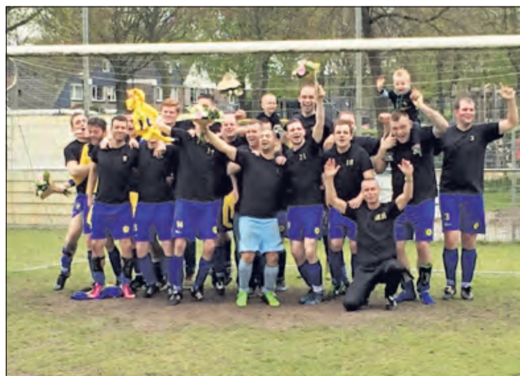
Het vijfde team van SVM is het zgn. 'Biltse team' onder de Maartensdijkers. Het bestaat volledig uit in De Bilt woonachtige spelers. Op 25 april werden ze kampioen in hun klasse. Met 16 overwinningen, 2 gelijke spelen en slechts 3 verloren duels eindigden zij 9 punten voor op FC De Bilt 10. [HvdB]