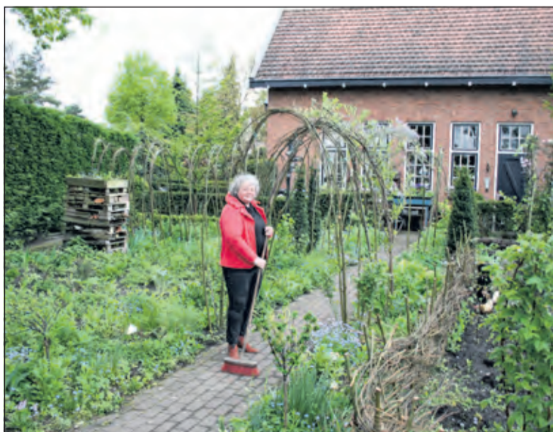
Op zaterdag 16 mei staat de opening van het tuinseizoen weer voor de deur.

De Theetuin kunt u bezoeken op zaterdag 16 mei van 10.00 tot 16.00 uur, elke woensdag in juni, de eerste drie woensdagen in augustus én maandag 16 juni en zaterdag 28 juni.