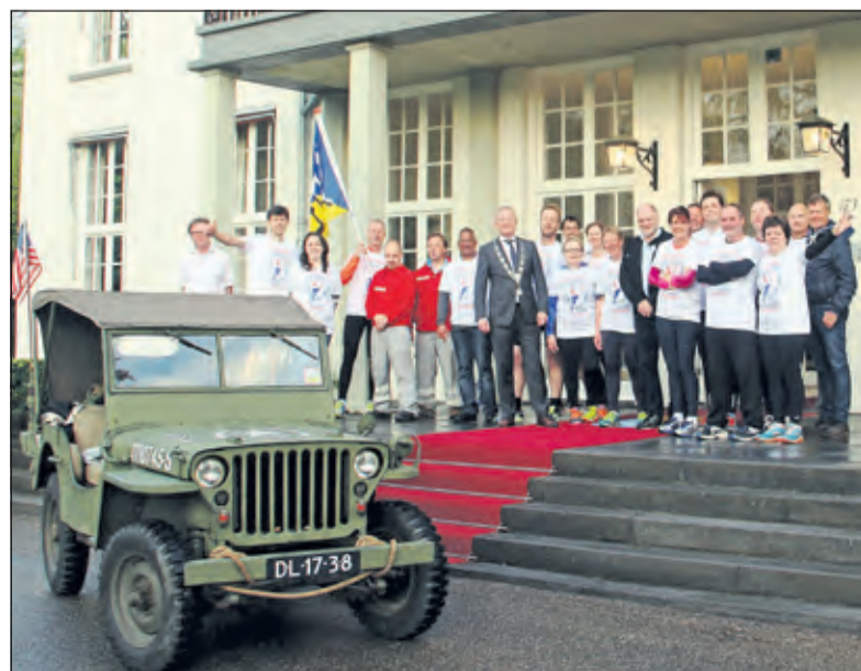
Op 5 mei rond 7.00 uur was de gehele groep fris en fruitig weer te gast op het gemeentehuis voor het zogenaamde Bevrijdingsontbijt.