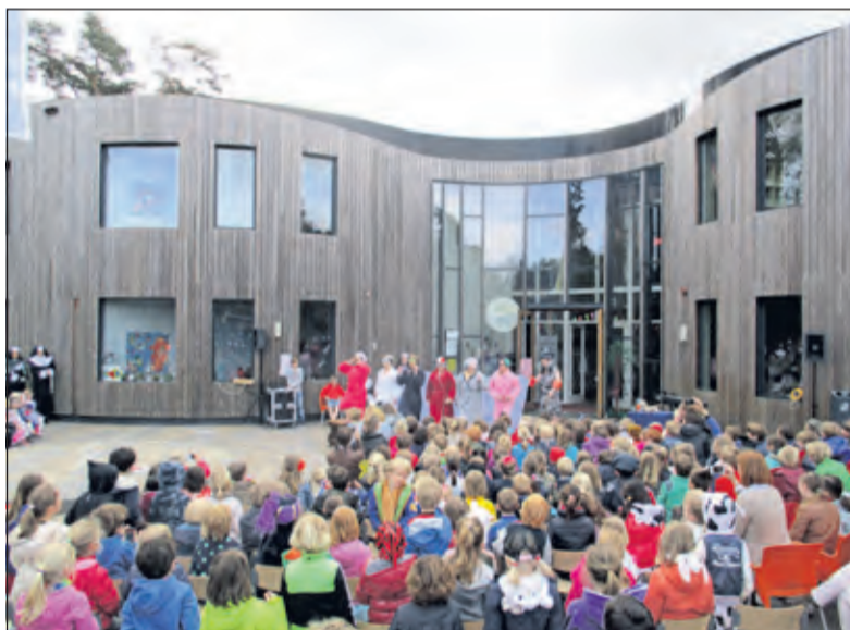
Een pleinfest t.g.v. 90 jaar St. Theresiaschool.