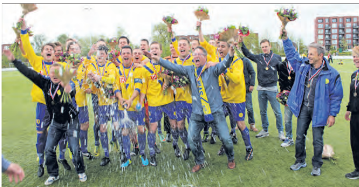
Na de bloemen en de KNVB-medailles was er champagne.

De talrijke supporters gaven de hele groep een daverend applaus bij de thuiskomst. Spelers en staf gingen in het kampioensshirt de platte kar op voor de traditionele rondrit door het dorp.