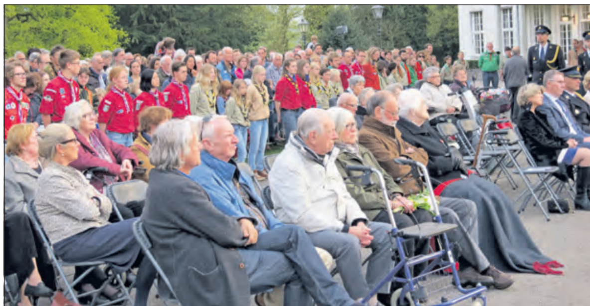
Veel mensen woonden de Dodenherdenking bij Jagtlust bij.