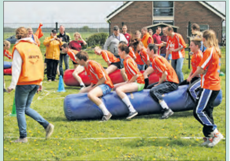
Het was dikke pret tijdens de Zeskamp in Westbroek. Diverse teams probeerden elkaar af te troeven op sportief gebied.

Zeventig jaar vrijheid werd merkbaar gevierd in Westbroek en de Bilt. Op het gazon voor gemeentehuis Jagtlust vond een Taptoe plaats. In Westbroek werd veel georganiseerd voor de bewoners. Er was een fietstocht, een sportief middagprogramma en aan het eind van de festiviteiten vond nog een barbecue plaats. Meer dan 250 mensen hadden zich aangemeld.