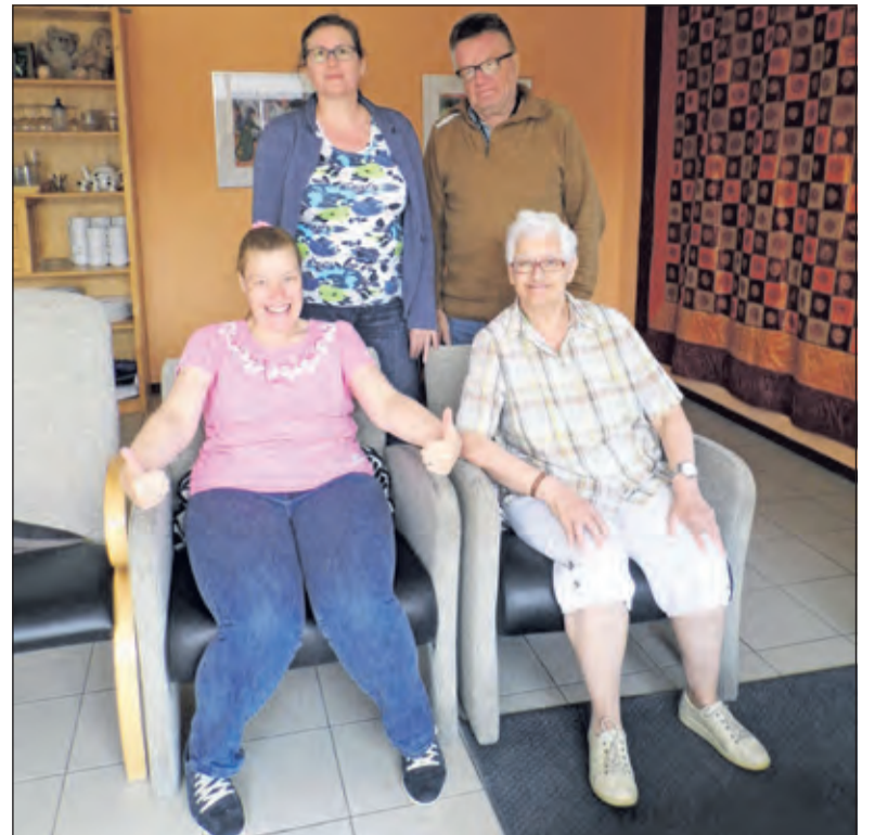
De bewoners van Zideris wacht een spannende tijd; veel gaan er verhuizen.