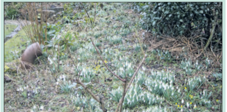
In februari van dit jaar stond de tuin vol met sneeuwkllokjes.