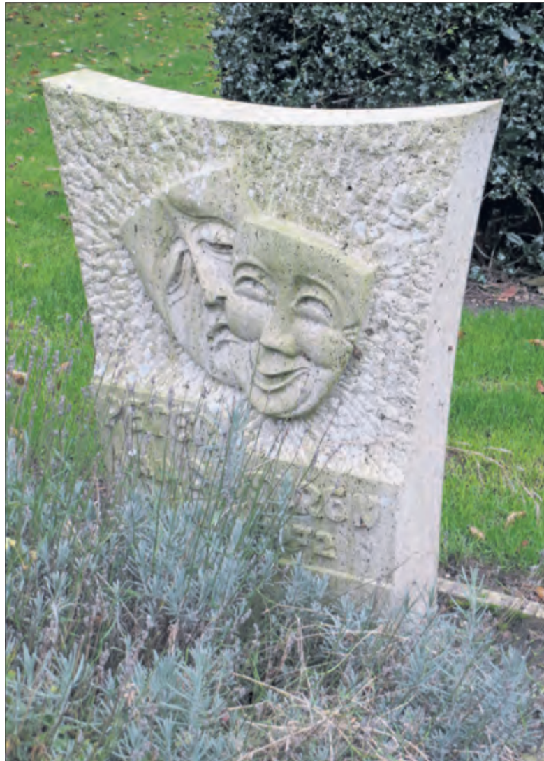
Jantje lacht en jantje huilt. Een bijzonder grafmonument over wat de emoties rond sterven kunnen zijn.

De rondleiding duurt een uur en start om 14.00 uur. Er wordt uitgegaan van een groepsgrootte van ongeveer 20 personen. Bij een grotere belangstelling komt er een tweede ronde die om 15.00 uur begint. Voor leden van de Historische Kring is de rondleiding gratis. Anderen betalen € 2,50. Mocht het zo zijn dat er op het moment van de