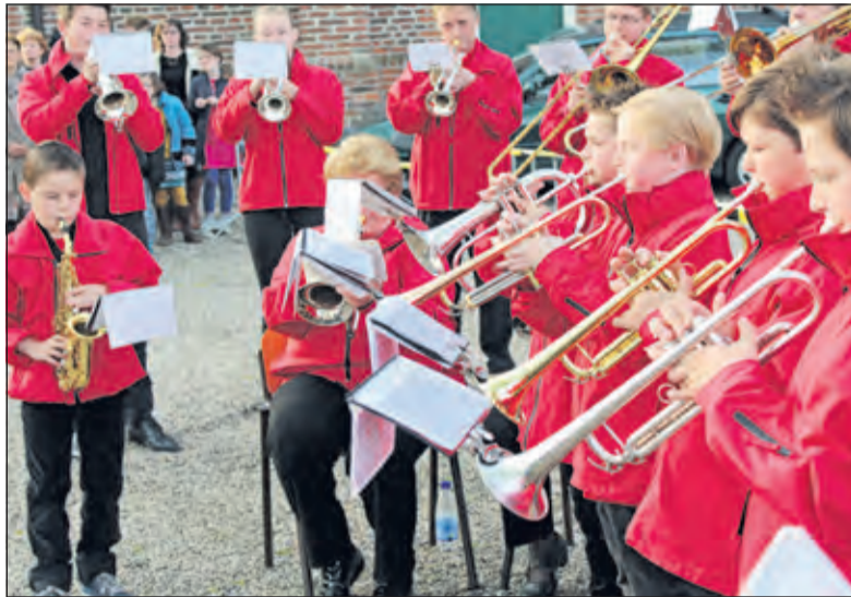
Muzikale bijdrage van (jeugd-)leden van Muziekvereniging Vriendenkring.

‘Vandaag herdenken legt dan ook op ieder van ons de plicht om ónze vrijheid, maar óók die van de ander, waar dan ook, te beschermen. Het eerste is een stuk gemakkelijker dan het tweede’, aldus Gerritsen. ‘Herdenken verplicht ons verdraagzaam te zijn naar wie anders is dan wij. Herdenken vraagt dat we zorgvuldig omgaan met wat voor een ander van waarde is. Herdenken vergt dat we herbergen wie op de vlucht is of vervolgd wordt. We hebben in eigen land kunnen zien wat er gebeurt als we dat niet doen. Als we achteloos zijn over onze medemens, als we niet opkomen voor wat recht en billijk is. Wij zijn gewaarschuwde mensen’.