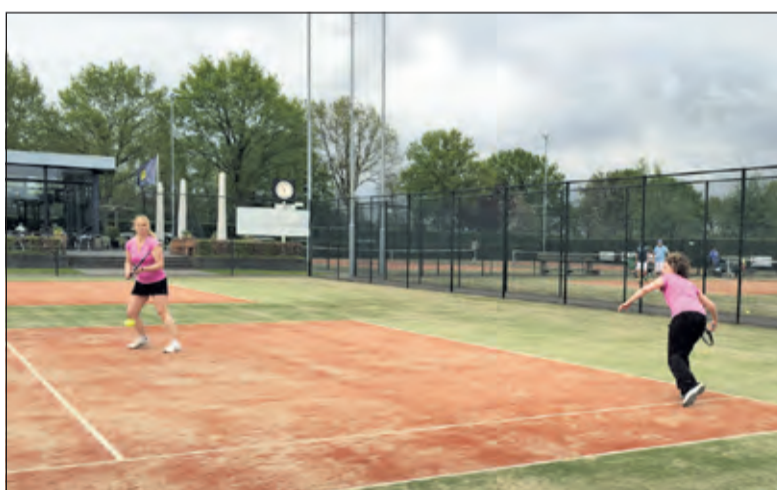
De damesdubbel aan slag.