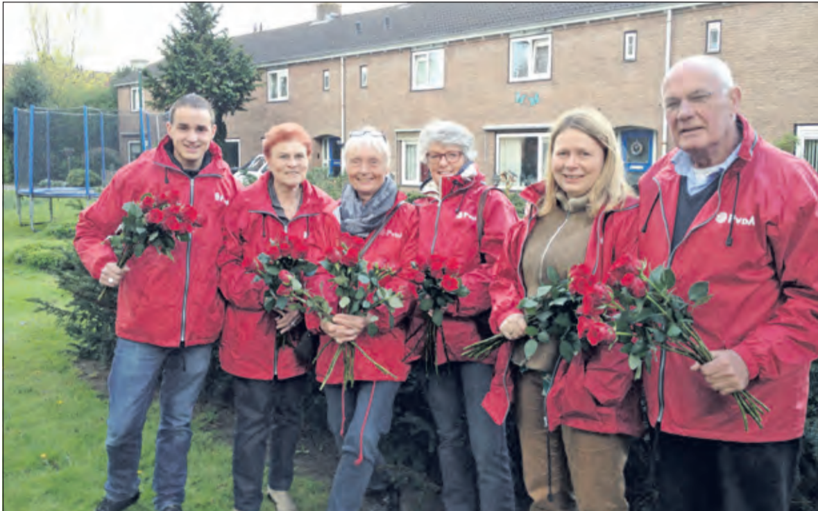
Wijkteam PvdA op bezoek in de omgeving Meidoornpad.

Het Biltse PvdA wijkteam is aan de vooravond van 1 mei op wijkbezoek geweest op het Meidoornpad, in de Sering- en in de Tuinstraat. In dit deel van De Bilt blijken over de huisvesting ernstige klachten te bestaan en was men duidelijk ontevreden over de afhandeling daar van.