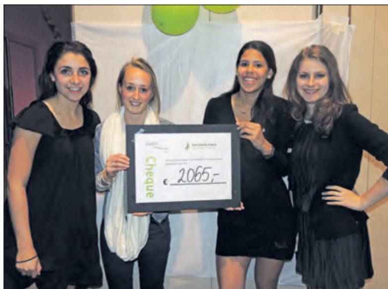
Een deel van de organisatoren toont het mooie resultaat.

De avond werd georganiseerd door werkers uit VWO 3, 4, en 5 van De Werkplaats. Sinds december 2013 heeft de school een samenwerkingsverband met het HDI. Een groep van ongeveer 25 werkers zet zich actief in als ambassadeur en