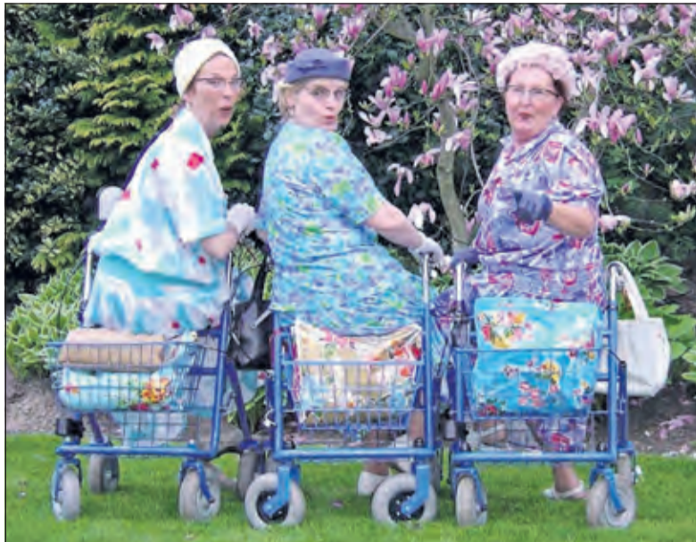
Het organiseren van gezamenlijke activiteiten moet mogelijk zijn.

Het gebouw zelf moet uitnodigen tot sociaal contact waar en wanneer