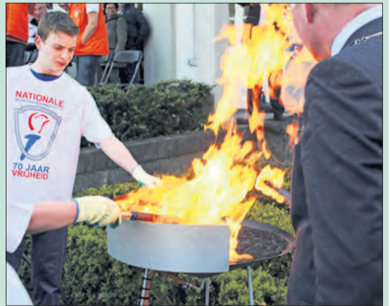
Het uit Wageningen opgehaalde bevrijdingsvuur wordt ontstoken.