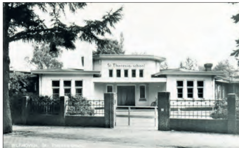
De Theresiaschool aan de Gregoriuslaan 10 uit 1968.

nementen. Dit is al het 2e diner dat zij organiseren voor het HDI.