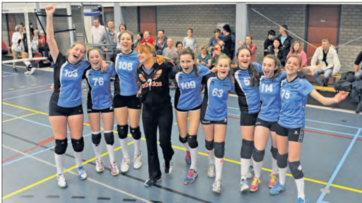
Vreugde bij de kampioenen.

Op een imponerende manier heeft Irene volleybal meisjes B2 dit seizoen de titel binnengehaald. Het jonge team dat veelal moest spelen tegen oudere speelsters begon zeker niet als favoriet aan deze competitie. Maar door hard trai-