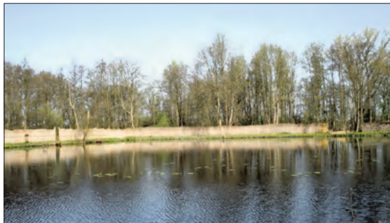
Gidsen van natuurmonumenten geven een kijkje achter de schermen van de eendekooi.

Op genoemde dagen laten gidsen van Natuurmonumenten van circa 12.00 uur tot 15.00 uur de schermen, de vangarmen, de kooiplas, de kooiplas en het kooikershuisje zien en vertellen over de rijke historie van deze eendekooi en over het herstel van het dichtbij de eendekooi gelegen trilvenengebied. De