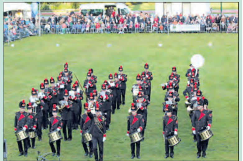
Ruime publieke belangstelling voor de taptoe.