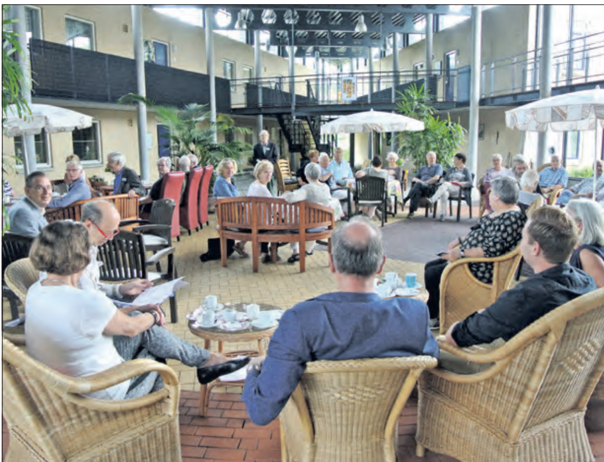
Bewoners en genodigden in het prachtige atrium.

Zaterdag was het feest op Lugtensteyn in verband met het 15-jarig jubileum. In het atrium, de mooie binnenruimte, was er gelegenheid tot ontmoeting van bewoners en genodigden, o.a. van de SSW, Reinaerde, de voormalige SWO en enkele raadsleden.