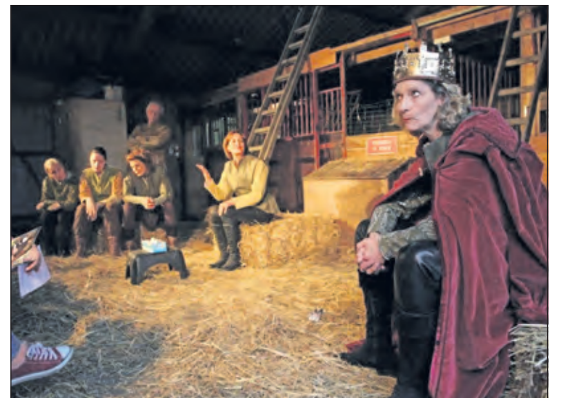
Mediation tussen Karel de Grote en de 4 Heemskinderen.