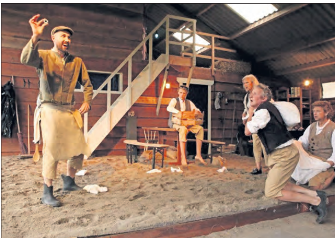
Toverende knechten op de Zwarte Molen.

Beide voorstellingen leverden staande ovaties op en het aange-naam verraste publiek toonde tijdens de borrel na affloop alweer veel belangstelling voor een volgende voorstelling van Theater in 't Groen. Dat zou dan een grote voorstelling worden op weer een andere aansprekende locatie in gemeente de Bilt. (Rien Thomassen)