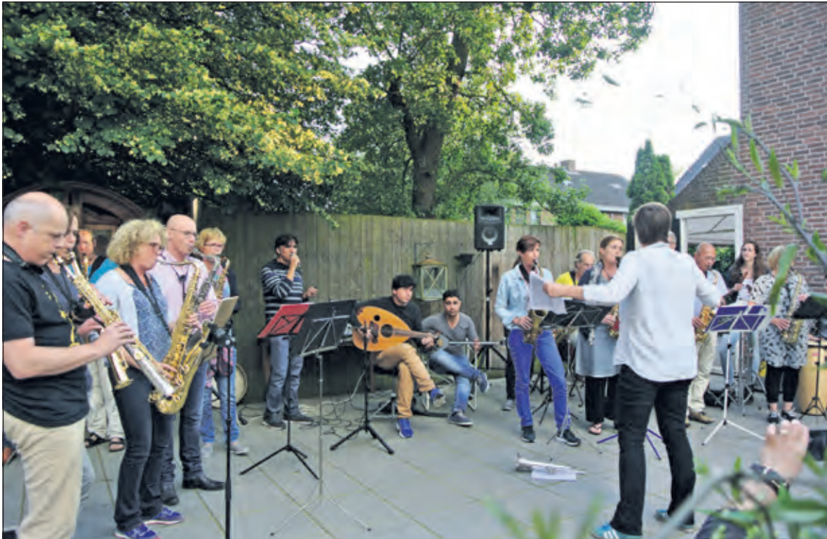
Het Utrechts Straatorkest Tutti Saxi luistert het feest op samen met de Iraakse zanger, Koerdische gitaarspeler zijn en Syrisch/Koerdische saz-speler.

Vorige week zaterdag was in de voormalige artspraktijk aan de Essenkamp een open huis voor iedereen die een kijkje wilde nemen in de nieuwe huisvesting voor statushouders. Dit is een te prijzen initiatief dat uit de buurt zelf komt. De bewoners willen de statushouders welkom heten en in hun midden opnemen.