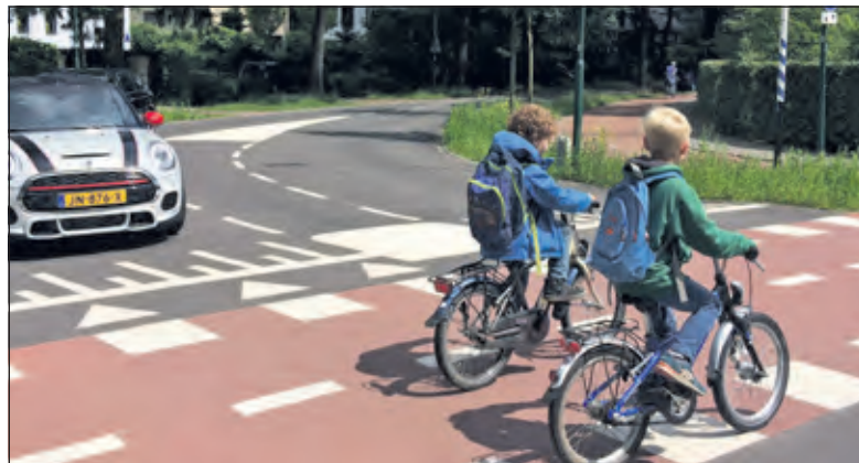
Inmiddels kan er veilig overgestoken worden op de kruising Sperwerlaan/Julianalaan.