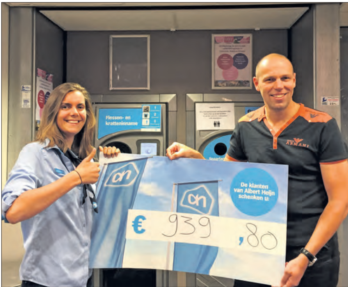
De opbrengst van 2 maanden emballagebonnen.

De afgelopen 2 maanden werd er door veel klanten van AH De Bilt lege flessenbonnen geschonken aan Roparun Team 19 van het Diaconessenziekenhuis. Dit team doet al vele jaren mee aan de estafeteloop tussen Parijs en Rotterdam om geld in te zamelen voor mensen, die steun nodig hebben omdat ze kanker hebben.