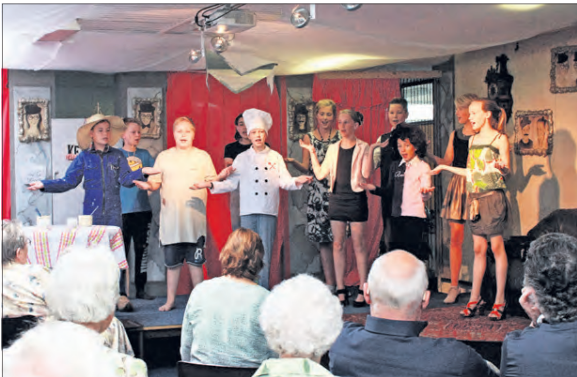
Leerlingen van ‘t Kompas spelen ‘Het dak eraf’ voor de Zonnebloemgasten.

Het begint langzamerhand traditie te worden dat de gasten van de Zonnebloem afdeling Maartensdijk uitgenodigd worden voor de musical van groep 8 van basisschool ‘t Kompas uit Westbroek. Op vrijdagmiddag 1 juli was iedereen die daar belangstelling voor had welkom om een extra voorstelling van de musical ‘Het dak eraf’ bij te wonen.