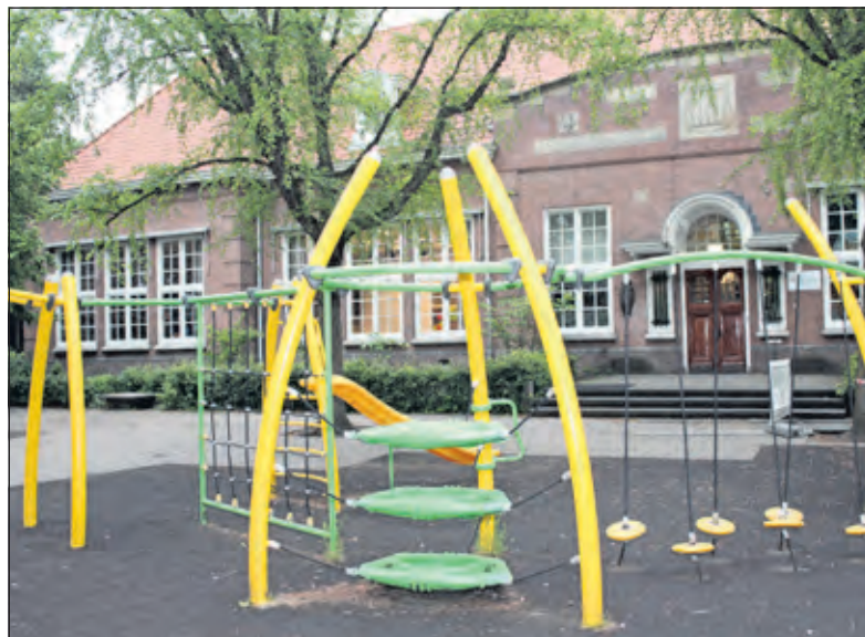
De van Dijkschool kan in oktober 2017 gewoon het 100-jarig bestaan vieren.

waren aanwezig. Iedere leerkracht stelde zich kort voor en kreeg vervolgens een warm applaus. Tot slot beantwoordden Rob en Martin nog enkele vragen. Het viel op dat de informatie duidelijk was en dat de aanwezigen vooral heel tevreden waren met de nieuwe ontwikkelingen op hun school.