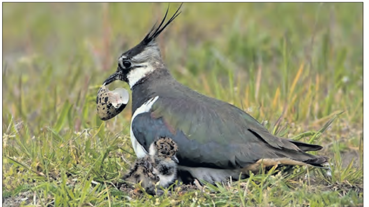
Ook Kieviten voelen zich prima thuis in de broedstrook.

15 juli worden de weidevogelzones voor het eerst gemaaid! De avond ervoor gaan de leden van de Wildbeheereenheid er eerst, met hun staande honden, door. Dit om te voorkomen dat jonge hazen alsnog het haasje zullen zijn. In de ene zone hebben 8 koppels Kieviten 25 kuikens groot gebracht, in de tweede zone hebben 10 broedparen Kieviten 27 jongen groot gebracht. In zone 2 heeft een gruttopaar 3 jongen groot gebracht. Dit zijn veelbelovende aantallen en moedigt alleen maar aan het in 2017 nog beter te gaan doen. Voor 2017 hebben zich inmiddels 4 agrariërs aangemeld. DE VONI gaat proberen de Provincies en Campina te interesseren voor dit project en hen vragen hieraan een bijdrage te leveren.