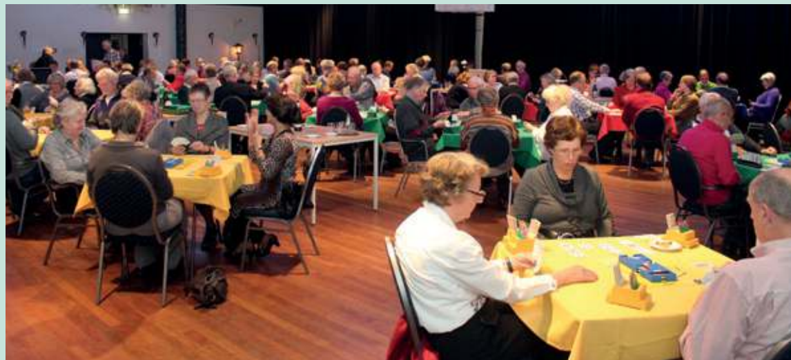
Een van de speellocaties is het HF Witte Centrum in De Bilt, waar ook in november 2012 de Open Biltse Bridgekampioenschappen werden georganiseerd.

De locaties zijn WVT in Bilthoven, het H.F. Witte Centrum in De Bilt, het tijdelijk Dorpshuis in Hollandse Rading en De Vierstee in Maartensdijk. Inschrijving kan plaatsvinden via e-mail voogelaar.m@planet.nl met vermelding van namen van beide spelers, lid van welke of geen club en speelsterkte. Of bel voor meer informatie 030 6062137.