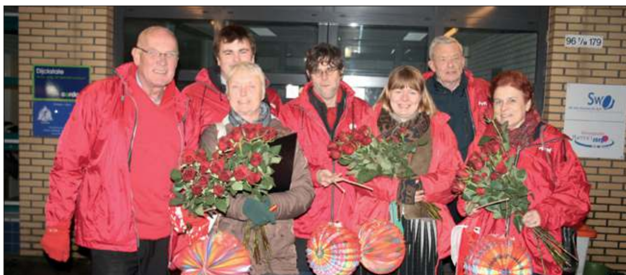
Lokaal PvdA-team (op bezoek in Maartensdijk) vertrekt vanuit Dijkstate op wijkbezoek naar de koninginnebuurt.