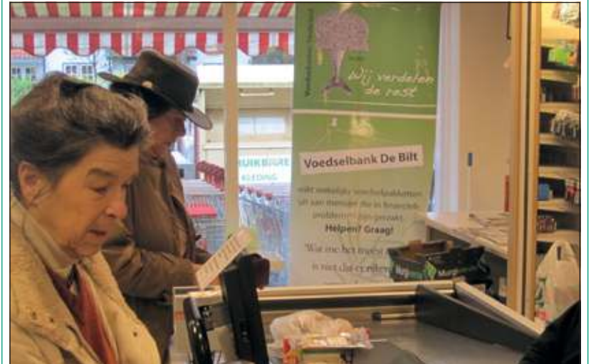
Voedselbank De Bilt geeft inmiddels 45 voedselpakketten uit aan gezinnen in financiële nood.