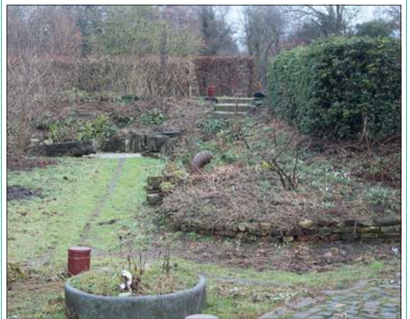
Volop voorjaar in de tuin aan de Kerkdijk 132

Op de eerste open tuindag zullen duizenden 'gewone' sneeuwkllokjes samen met de boerencrocus en andere crocussoorten massaal bloeien. Dan bloeien ook de andere sneeuwkllokjes soorten, zoals het Turks sneeuwkllokje, het gerimpeld sneeuwkllokje en het glanzend sneeuwkllokje. En de vele variëteiten en kruisingen ervan die de laatste jaren zijn aangeplant. Verder zullen dan massaal bloeien diverse soorten nieskruiden (Helleborus), lenteklokjes, cyclamen, winterakonieten en nog diverse andere voorjaarsbolletjes. Van de bomen en struiken bloeien waarschijnlijk nog de toverhazelaars en de gele kornoelje, en wellicht al de staartaar, het meloenboompje, de Engelse Garria, de gaspelidoorn en de Parrottia. Kortom, volop voorjaar in de tuin.