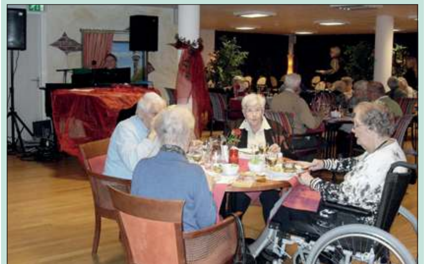
In romantische valentijns-setting genieten bewoners van De Koperwiek van een uitgebreid diner.