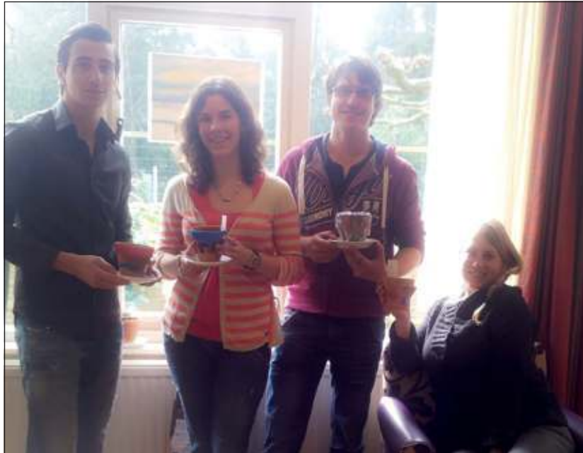
Vier studenten van de Faculteit Gezondheidszorg van de Hogeschool Utrecht.

Omdat het in februari nog geen tijd is om buiten te zaaien hebben de studenten met een tiental bewoners de zaden in potten voor binnen gedaan om ze op te kweken. Op advies is het pepermunt, bonenkruid, oregano en pottomaten geworden. De kruiden groeien redelijk snel en kunnen goed tegen de warmte van een huiskamer. Maar voordat de zaadjes in de potten werden gedaan hebben de bewoners eerst zelf de potten kleurrijk beschilderd.