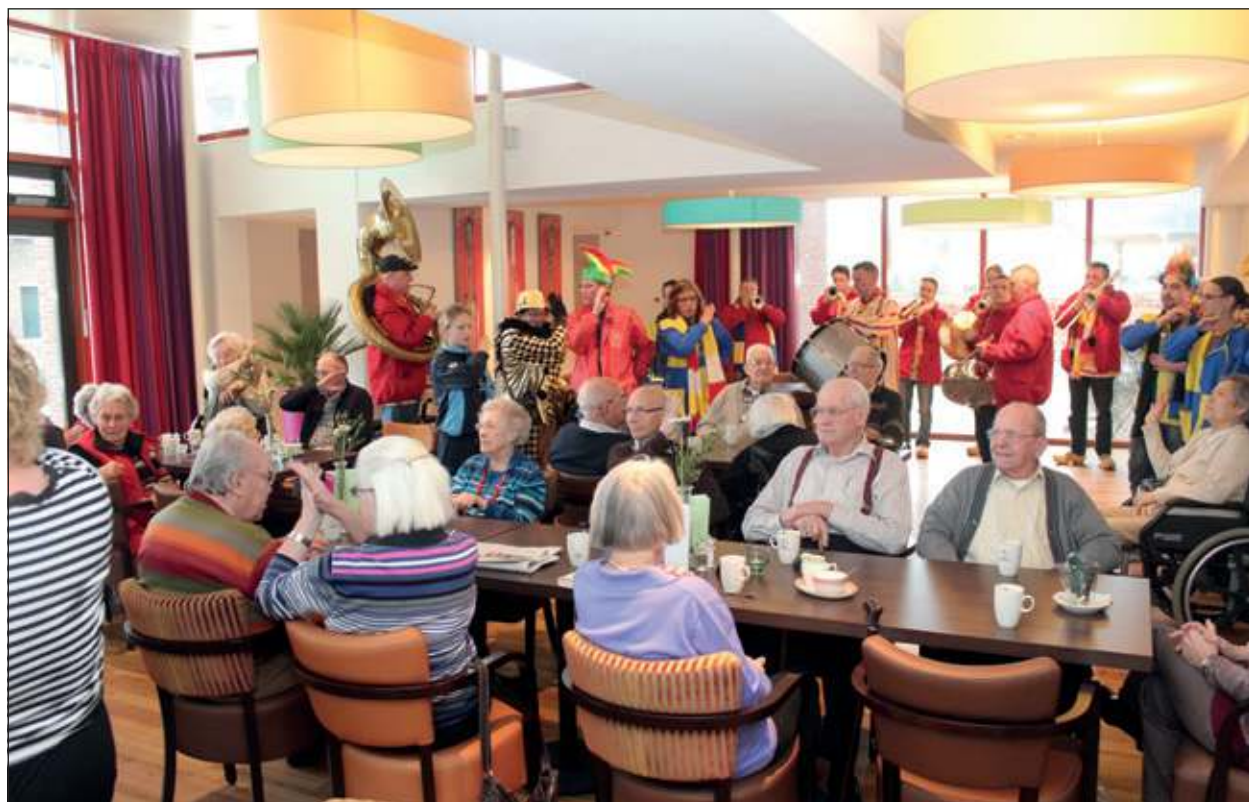
Dolle pret in het restaurant.

De Ijsbrekers hun opwachting met muziek. Zij speelden meezingers en muziek om op te dansen/polo-naise lopen.