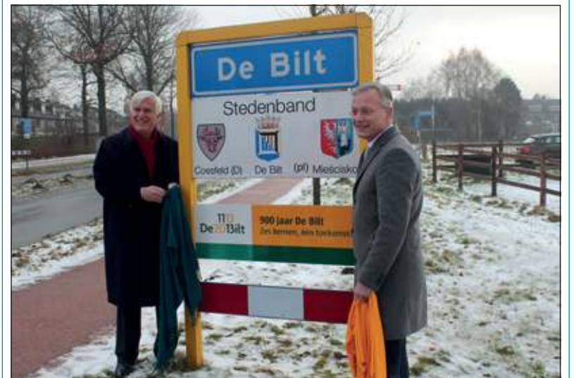
Voor het officiële moment was dit bord keurig gesopt. [HvdB]

Op Mathildedag, 14 maart aanstaande, is de officiële start. In de aanloop naar die dag zijn er verschillende momenten die het jubileum aankondigen. Zo ook het plaatsen van borden aan de rand van de verschillende dorpskernen met het motto: 900 jaar De Bilt, zes kernen, één toekomst.