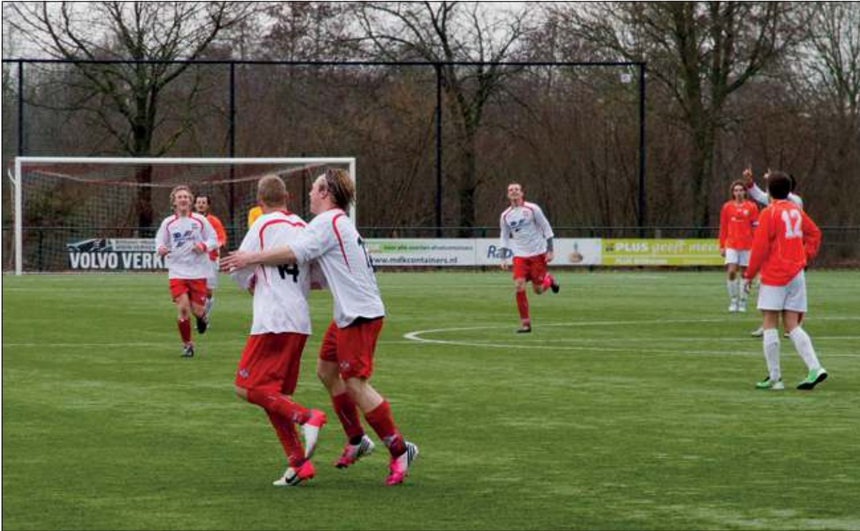
FC De Bilt zorgde afgelopen weekend voor een boeiende wedstrijd. Na een zeer slechte eerste helft met een ruststand 2-3, herpakte de ploeg zich in de tweede helft perfect en werd het 5-3.