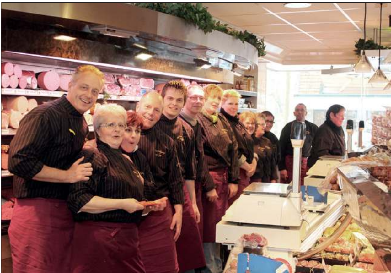
Altijd 'volle bak' bij van Loo; voor en achter de toonbank.

liteit fijnvezelig en overwegend mager vlees met veel smaak en een fijne dooradering van natuurlijk, gelijkmatig verdeeld vet. Die karakteristieken zorgen voor een mals en sappig stukje vlees. Dit alles is te danken aan de absoluut natuurlijke leefwijze van de zuivere France Limousin runderen. Zo grazen ze buiten op weiden, die rijk zijn aan verschillende grassoorten en wilde kruiden. En omdat de Franse Limousin runderen nog één zijn met de natuur zorgen zij zelf, dat ze alles krijgen wat nodig is. Het resultaat: vlees zoals vlees moet zijn, gezond, mals en heerlijk sappig. Bovendien zijn de fok-, voedings- en totale leefwijze van deze beroemde runderen zeer streng geregeld. In het 'Cahier des Charges' staat onder andere beschreven dat preventieve antibiotica en groeihormonen ten strengste verboden zijn en de kalfjes bij de moeder blijven zuigen. Je weet wat je eet'.