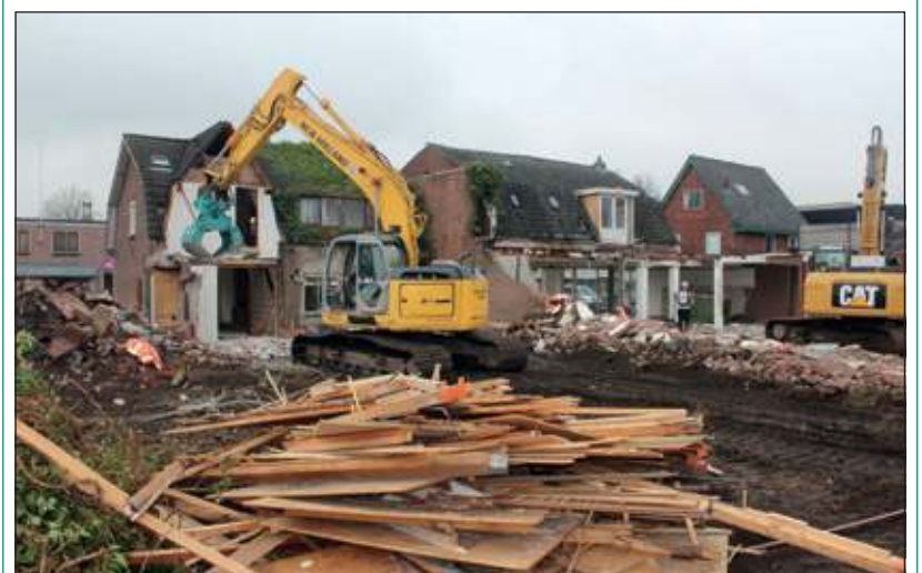
Ook afgelopen zaterdag gingen de sloopwerkzaamheden door.

Slopers zijn vorige week begonnen met het afbreken van de woningen aan de Looydijk 120 tot en met 124 in De Bilt. In totaal worden drie woningen en de voormalige Action afgebroken, zodat de nieuwe parkeergarage uitgegraven en gebouwd kan worden. Op deze plek komt ook een tijdelijke parkeervoorziening voor de bezoekers van de Albert Heijn. Over enkele maanden wordt de AH-winkel gesloopt, nadat aan het Henri Dunantplein de noodwinkel is geopend. Nieuwbouwproject Herenplein aan de Looydijk en Herenweg bestaat uit een nieuwe Albert Heijn supermarkt, een Gall&Gall, een HEMA en 37 appartementen. [HvdB]