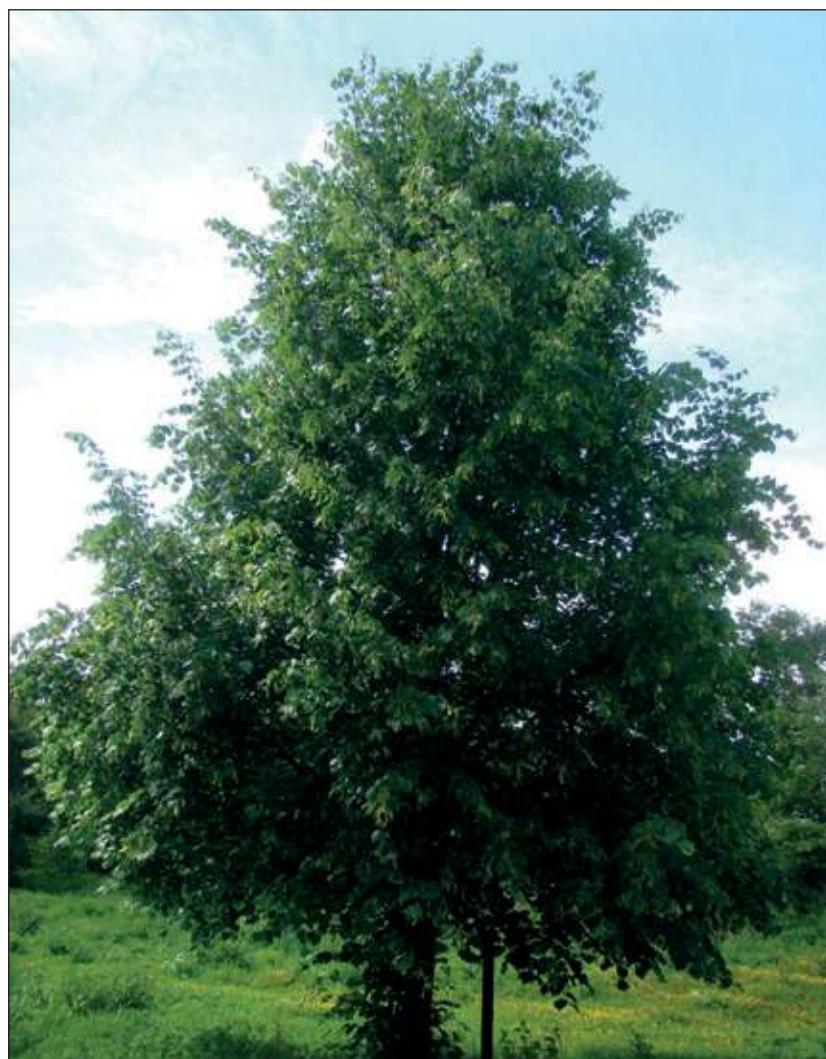
Een koningslinde in volle glorie.