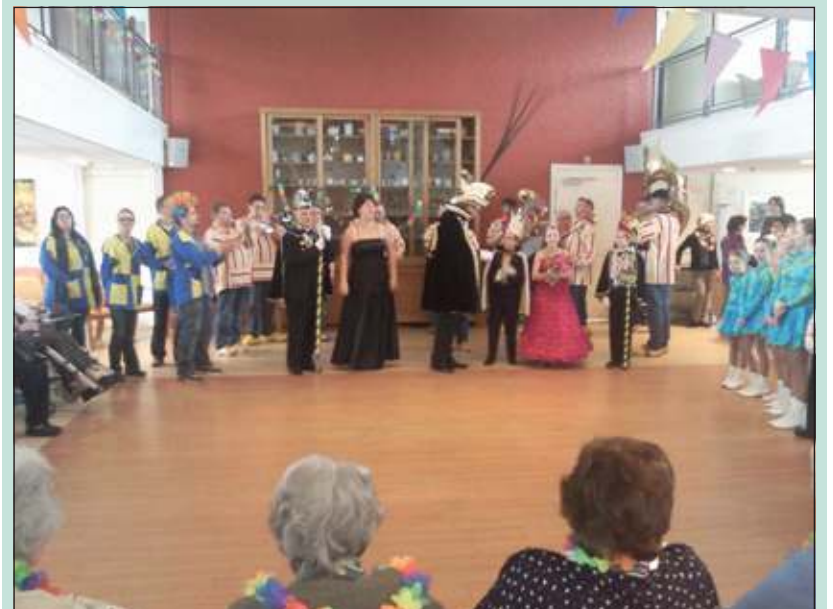
De weergodden zorgden voor een vrolijk uurtje in De Bremhorst.

Dankzij hen en enkele vrijwilligers is het een middag uit duizenden geworden. Feestelijke muziek, slingers en ballonnen. Een spetterend optreden van de prinsen, verklede mensen en de dansmariekes. Hapjes, drankjes en natuurlijk de polonaise kwamen allemaal voorbij. De bewoners vonden het erg jammer dat het optreden maar een uurtje duurde. (Joke Ruiter)