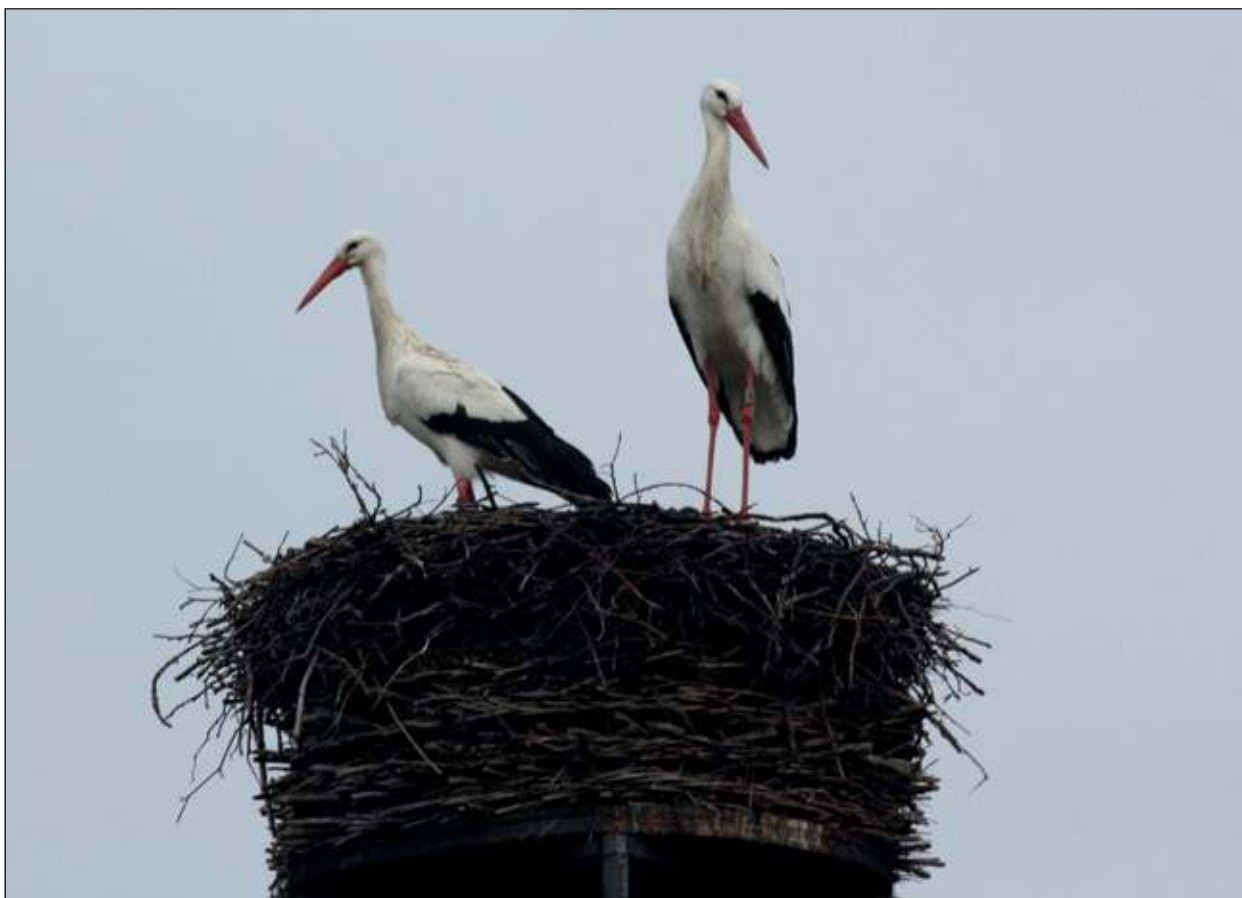
Op zaterdag 16 februari zijn deze ooievaars waargenomen langs de zuidzijde van de Kerkdijk in Westbroek.

gaan. Als de partner arriveert wordt deze al op grote afstand herkend en met luid snavelgeklepper begroet. Het nest wordt dan afgebouwd of hersteld en er vinden diverse paringen plaats. [HvdB]