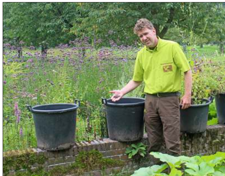
De tarwe stond in speciale bakken in de kruidentuin op Landgoed Oostbroek in De Bilt.

locatie had hij nog een paar planten staan waar hij het nu verder mee moet doen. Utrechtse Blauwe is een oude tarwesoort die lastiger te oogsten is dan andere soorten en daarom in Nederland geleidelijk is verdwenen. De tarwe kreeg zijn naam omdat het een donkerblauwe gloed heeft en in deze provincie veel door boeren werd gebruikt.