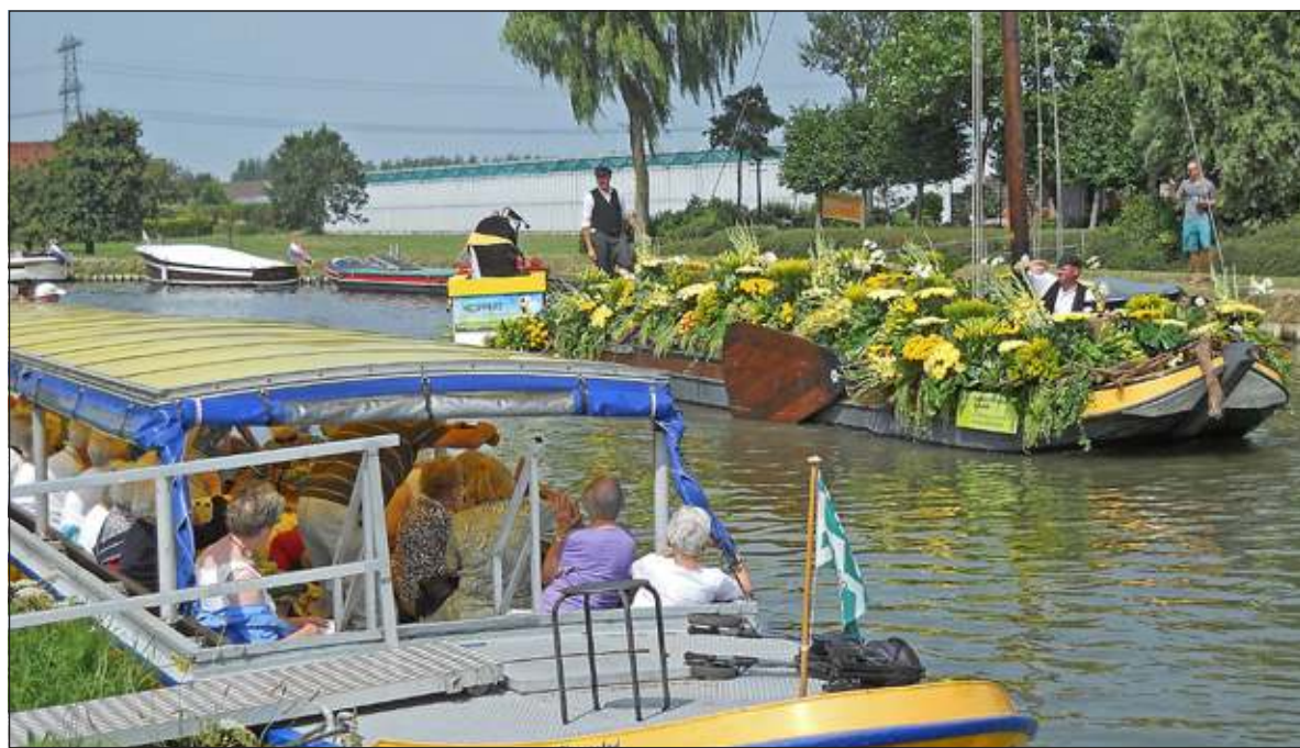
Vrijdag 1 augustus 2014 was zonovergoten en een mooie start van het nieuwe seizoen. Varend vanuit Naaldwijk met een echte Westlander en ruim 40 gasten van het UITbureau voor Ouderen voer men naar een mooie plek om het jaarlijks feest; Varend Corso Westland te bewonderen!

maar waar, dan had ik inkomsten. Van 2007 tot 2014 kregen wij subsidie van de gemeente De Bilt. Vanaf begin dit jaar krijgen we geen subsidie meer. Het enige dat daartegenover is komen te staan is een club Vrienden van het UITbureau; een niet tegenvallend aantal mensen werd voor minimaal 25 euro ondersteunende vriend. Op dit moment vult De Bilthuysen de tekorten aan; daarom ook vindt je die naam (nog)