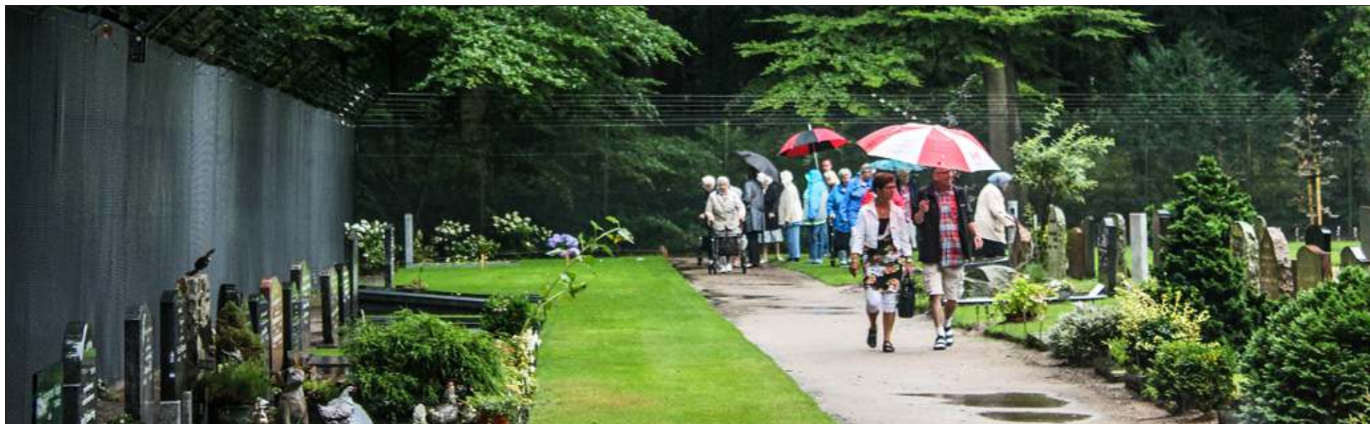
Het is zondag 10 augustus. Ook in de stromende regen blijft het graf van de prins een echte publiekstrekker.

Nu er een steen op het graf van Friso ligt, is dit een prachtig fotomoment. Met piëteit en respect voor de overledene en zijn familie heeft dit natuurlijk niets te maken. De prins die tijdens zijn leven zo'n uitgesproken hekel had aan camera's, heeft er nu constant twee op zich gericht. Elke dag, weer of geen weer, trekken tientallen, bezoekers langs het eenvoudige graf van de prins, in een hoek van de begraafplaats. Vaak combineren ze het bezoek aan de begraafplaats met iets anders in de buurt. Fiets huren, graf bezoeken en pannenkoek eten bij één van de vele restaurants in het dorp.