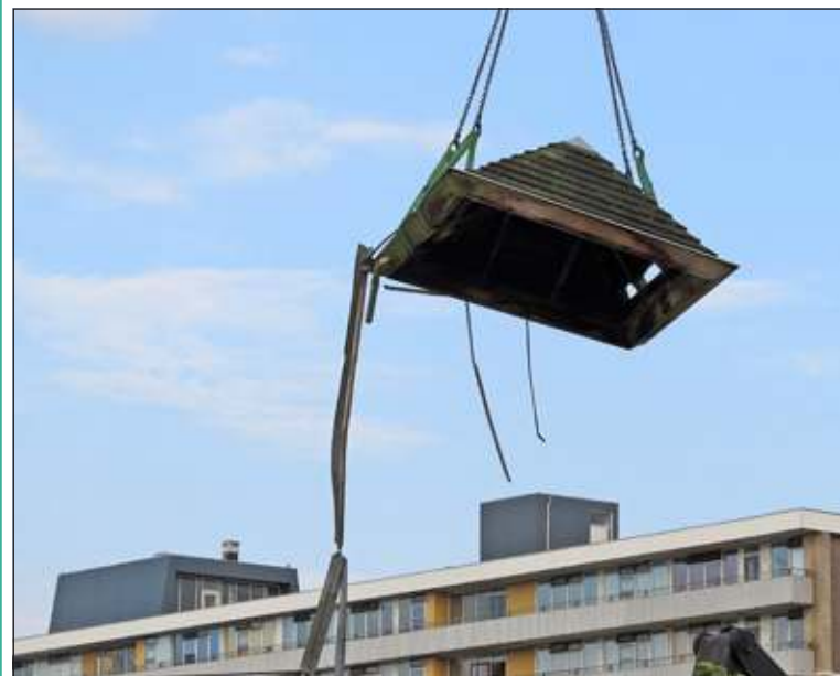
Met een enorme kraanwagen werd donderdag 7 augustus een aantal van de kappen in De Kwinkelier ontmanteld. [GG]