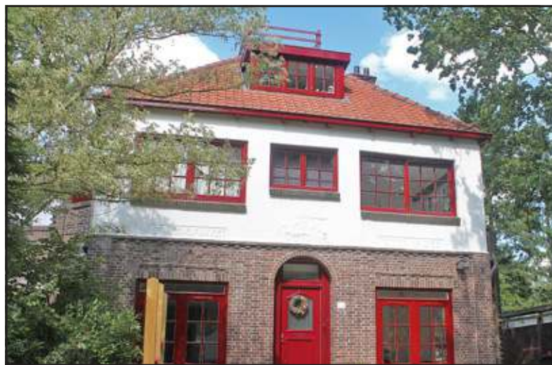
Het huis aan de Parklaan 88 met uitkijkpost. Links in de gevel staat 'Vliegt de Blauwvoet', rechts 'Storm op zee'.

De rails waren 18 meter lang en met tussenruimten van zeven mm. Minnaert berekende o.a. via de uitzettingscoëfficiënt hoe warm de staven in de zomer mochten worden.