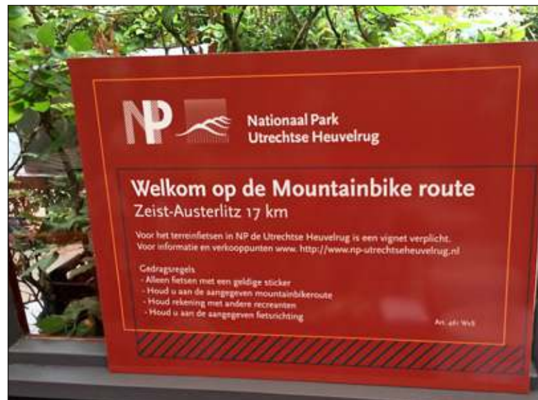
Een voorbeeldbord van een Mountainbikeroute (bij het Jagershuis in Zeist).

Torsius licht nog toe: 'De bijdrage die we van de mountainbiker gaan vragen wordt vooral gestoken in de ontwikkeling van nieuwe routes. Na anderhalf jaar gaan we kijken hoe het systeem functioneert. Overigens is de NTFU normaliter terughoudend met een gebruiker-betaalt-systeem van-