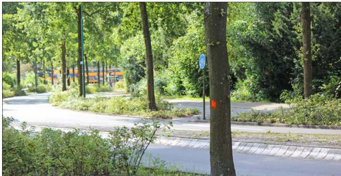
41 bomen moeten het veld ruimen voor de aanleg van de rotonde.

Om de rotonde mogelijk te maken moeten 41 bomen worden gekapt. Op 10 juni 2014 is hiervoor een kapvergunning afgegeven. Deze bomen zijn ondertussen gemerkt met een oranje stip. Om de overlast voor het verkeer te beperken worden de bomen gekapt tijdens de vakantieperiode in de week van 18 augustus. Tijdens de werkzaamheden wordt steeds voor een korte periode een rijrichting afgesloten. Verkeersregelaars zijn aanwezig om het verkeer goed te leiden.