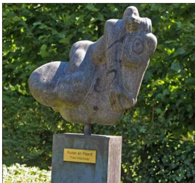
Op de sokkel wordt de Ruiter het eerst genoemd.

1924), roepnaam 'Theet'. Ze was professor beeldhouwkunst aan de Rijksacademie in Amsterdam. Ze heeft altijd getekend in Artis maar door reuma, die het zware werk van beeldhouwen moeilijk maakt tekende ze de laatste jaren steeds meer en beeldhouwde nog op beperkte schaal. Al haar beelden, in beperkte oplagen gegoten, zijn 'uitverkocht'. Enkele beelden van haar hand staan ook in privébezit in huizen en tuinen in verschillende kernen van deze gemeente.