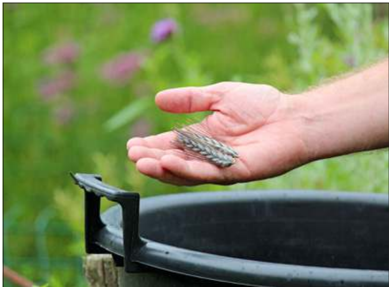
Utrechtse Blauwe heeft vier rijen blauwgrijze zaden en lange zwarte baarden.

De kruidentuin op Oostbroek werkt met veel vrijwilligers. Zij verzorgen met veel inzet en enthousiasme ook dit deel van de tuin. De tarwe stond in speciale bakken in de kruidentuin op Landgoed Oostbroek in De Bilt. Iemand heeft de planten met daarin de zeldzame zaadjes afgeknippt. Hellevoort is nu bijna de gehele oogst kwijt. Op een andere