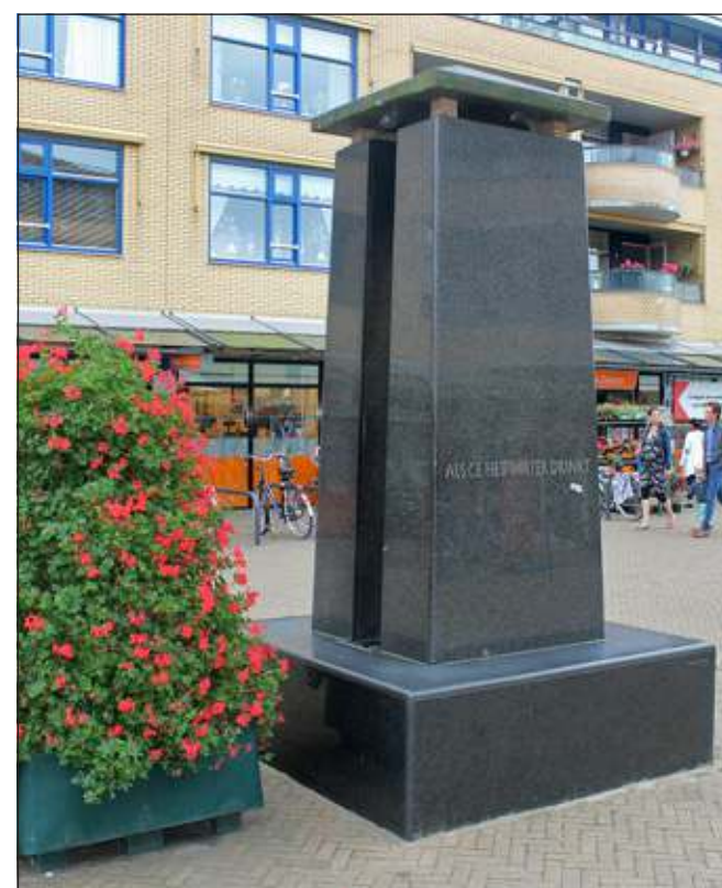
De Maartensdijkse dorpspomp heeft al heel wat discussies doen oplaaien.

Terug naar de bron (van deze tocht) betekent: terug naar Maartensdijk. In het kunstwerk dat op het Maartensplein staat zitten typische Hedda Buijs-vormen. Eigenlijk ziet het eruit of het met een grote blokkendoos is gebouwd. Twee enorme blokken recht opgezet op een onder-blok. Dakje erbovenop, een wat smaller en lager blok met ribbeltjes tussen die twee enorme blokken en klaar. Een pomp op het plein zie je tegenwoordig niet vaak meer. En als je in een dorp een pomp ziet is het vaak nep, er komt geen water meer uit. Vroeger was de pomp heel belangrijk. De eerste waterleidingen zijn ongeveer 150 jaar oud. Voor die tijd en in veel plaatsen nog tot ver in de twintigste eeuw, moest het drinkwater dus uit de grond omhoog gepompt worden. Zo'n pomp midden op een plein was behalve belangrijk ook een ontmoetingspunt. Zonder water kan een mens niet leven. Water komt uit een bron. In de zijkant staat een tekst geschreven die uit