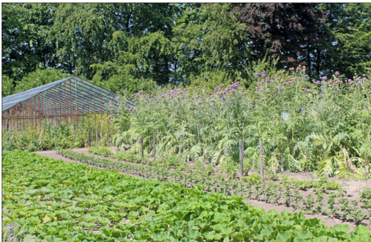
Bezoekers worden geïnspireerd door de charme van het seizoen en de overdaad aan geur en kleur van de bloemrijke moestuin.

meer tot leven komen. In de tuin is nog van alles te proef en te koop en in de aangrenzende oranjerie zal door drie chefs een proeverij worden verzorgd. Alles met ingrediënten uit de tuin en uit de streek, duurzaam en diervriendelijk. De opbrengst van de moestuindag zal besteed worden aan het herstel van de toegangsdeuren van de ronde kas. De moestuindag is zondag 31 augustus van 10.00 tot 17.00 uur. Vooraf aanmelden kan via Lucie@landgoedvollenhoven.nl .