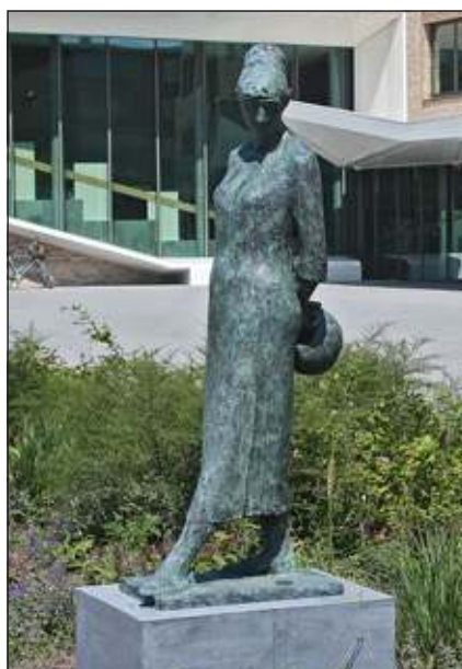
'De vrouw met boodschappenmand' is vaak een stille getuige al het moois in Het Lichtruim.

Rustig doortrappend komen we bij Het Lichtruim in Bilthoven aan het Planetenplein. Het 'Beeld vrouw met boodschappenmand' is daar op 11 maart 2014 teruggeplaatst. In 1966 werd het beeld van de Biltse kunstenaar Jop Goldenbeld geplaatst voor het Winkelcentrum Planetenbaan. In januari 2013 moest het wijken voor de herinrichting van het plein. Het beeld staat nu