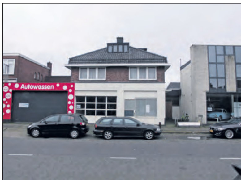
Het oorspronkelijk garagebedrijf.

de huizen. 'Dan kan om te beginnen het hele bouwblok 5 à 6 meter naar achteren. Als het complex dan ook nog een verdieping lager wordt gebouwd, zullen er al veel van de bezwaren niet meer aanwezig zijn. Het poortgebouw kan worden versmald, zodat er alleen nog fietsers onderdoor kunnen. Dat zou een stap in de goede richting kunnen zijn'. Chris van Basten wijst erop, dat voordat er kan worden gebouwd de bodem voor de garage eerst wel grondig zal moeten worden schoongemaakt. De bewoners wensen duidelijkheid wat de bodemvervuiling precies voor hen betekent, hoe groot is de vervuiling is en hoe de sanering uitgevoerd gaat worden.