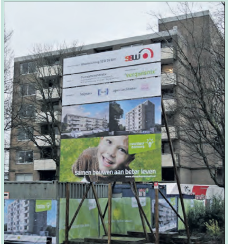
Het bouwbord met de flat Henrica van Erpweg op de achtergrond.

Het is een ambitieuze operatie: de duurzame renovatie van twee flats van woningcorporatie SSW in De Bilt. De Verduurzamers zijn begin januari begonnen met de werkzaamheden aan de Henrica van Erpweg. Met een nieuwe warme jas worden de woningen uit de jaren '70 weer helemaal bij de tijd gebracht: energiezuinig en comfortabel met een passende, eigentijdse uitstraling.