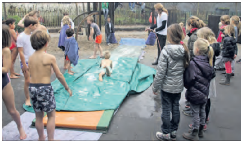
Kinderen van BSO De Poema in De Bilt nemen een ‘nieuwjaarsduik’.

BSO-medewerkers Linda en Lisa deden bovendien mee aan de ‘echte’ Nieuwjaarsduik in Scheveningen. Zij zamelden met die duik nog een mooi bedrag in voor de Voedselbank. (Ellien ten Cate)