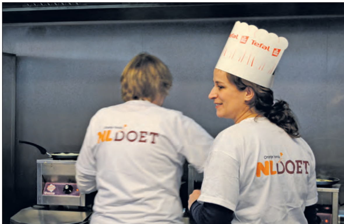
Tijdens NLdoet kun je alles doen.

Nu Kunst en Muziek gaan fuseren valt er vast nog meer te creëren met Zeist en De Bilt was die fusie gewild we zien uit naar wat ze presteren