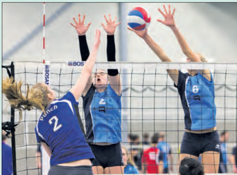
De Irenedames vormen een prachtig blok.