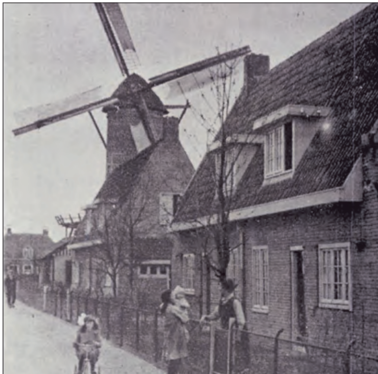
In 1930 zag de Molenweg er zo uit.

De Maartensdijkse Molenweg was tot 1920 een zandweg, die van de Dorpsweg naar de in de zestiger jaren van de vorige eeuw afgebroken molen + omliggende bebouwing leidde. Vanaf de molen liep een pad (het Zwarte weggetje of Scharrelaantje genaamd) naar de boerderij(-en) in het land. De Marijkelaan tussen Molenweg en Fazantlaan is hiervoor ongeveer in de plaats gekomen. Aan het einde van de Molenweg werden in 1922 de eerste woningen van de Woningbouwvereniging gebouwd (oostzijde de huisnr's. 51 t/m 61 en westzijde 50 t/m 56 zie foto). Het waren huizen van een vriendelijk ontwerp met aan ieder huis een stenen kippenhok met kippentrapje. Na nr. 56 (nu parkeerplaats) wordt in 1920 de eerste houten bungalow van Maartensdijk gebouwd. In 1939 wordt deze tijdelijke woning weer afgebroken.