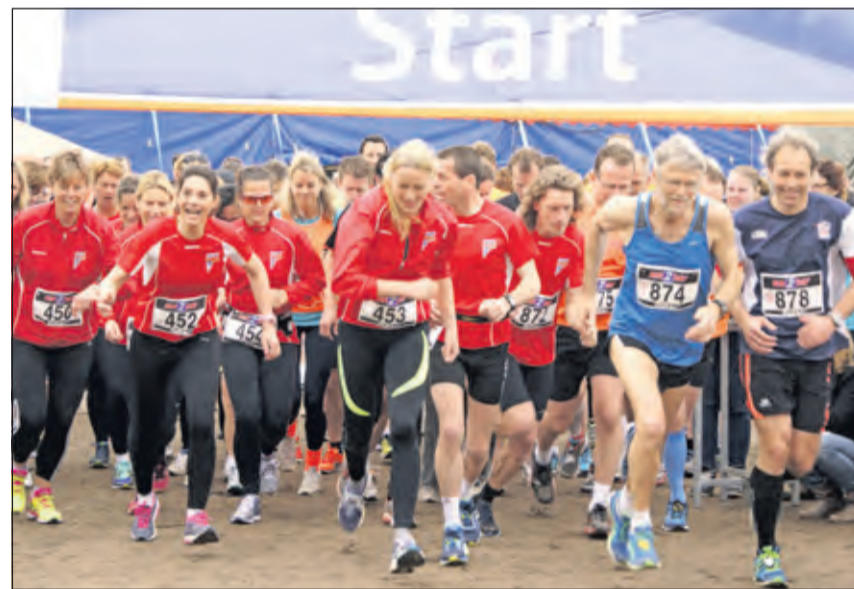
Klaar voor de start (in 2015).