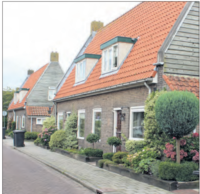
De westzijde van de Molenweg 85 jaar later.