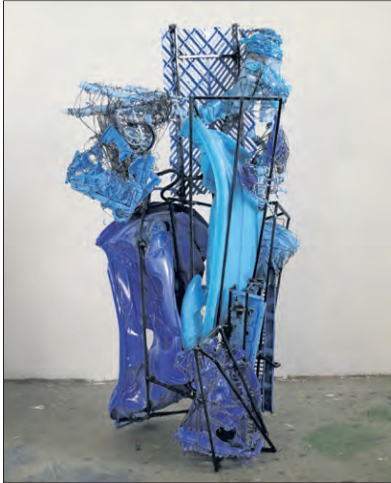
Ben Oldenhof gebruikt in feite alles wat hij in zijn directe omgeving vindt en maakt objecten die (nog) binding hebben met de werkelijkheid, maar die als geheel abstract zijn.

Maar van dichtbij zinderen en vibreren de doeken met hun dikke verflagen uitbundig. Onregelmatigheden en rafelige randen onderstrepen dat de abstracte vormen niet door een machine, maar door een mens van vlees en bloed zijn gemaakt.