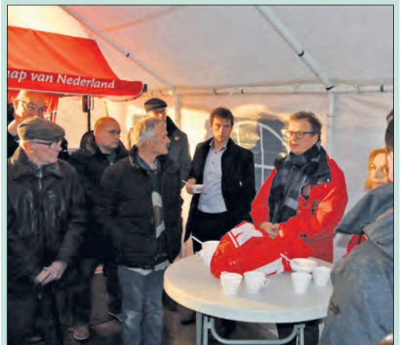
Donderdag 7 januari was het startmoment met de bewoners.

De renovatie start aan de Henrica van Erpweg. De woningen krijgen hier een Energielabel A. Het complex aan de Samuel van Houtenweg staat voor maart op het programma. Deze woningen worden Nul-Op-De-Meter uitgevoerd. [WE]