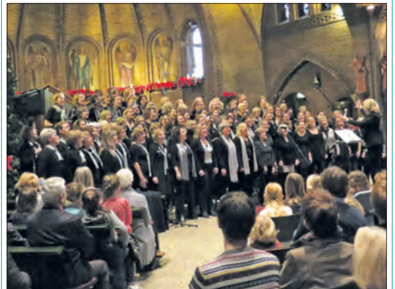
Het koor The Voices of Bilthoven zong de sterren van de hemel.