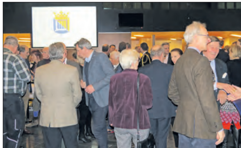
Gezellige drukte in de Mathildezaal.

'We kunnen een heel gerust leven leiden, maar er is ook veel dat die gerustheid onder druk zet.' Gerritsen constateert dat er veel aan de hand is in de wereld om ons heen. 'Ver weg en angstaanjagend dichtbij staan mensen elkaar naar het leven, worden oorlogen gevoerd en worden onschuldige mensen op afgrijselijke wijze vermoord om anderen doodsbang te maken. Gebruikmakend van een begrijpelijke angst voor het onbekende, worden de mensen die voor dat geweld op de vlucht slaan op één hoop gegooid met de daders van dat geweld. Het beroep op onze liefdeloosheid, het beroep op onze onherbergzaamheid wordt aangewakkerd. Zelfs zover,