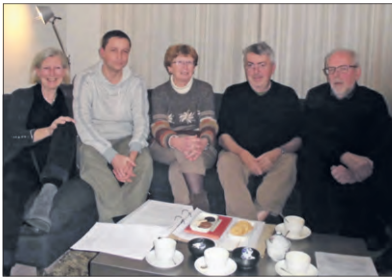
Omwonenden aan de Hessenweg en het Comité HartvoorDeBilt.

Op 24 november 2015 heeft het College besloten in principe een positieve grondhouding aan te nemen ten aanzien van de plannen. Om de ontwikkeling mogelijk te maken dient het bestemmingsplan aangepast te worden. Naar verwachting zal de procedure in februari opgestart worden.