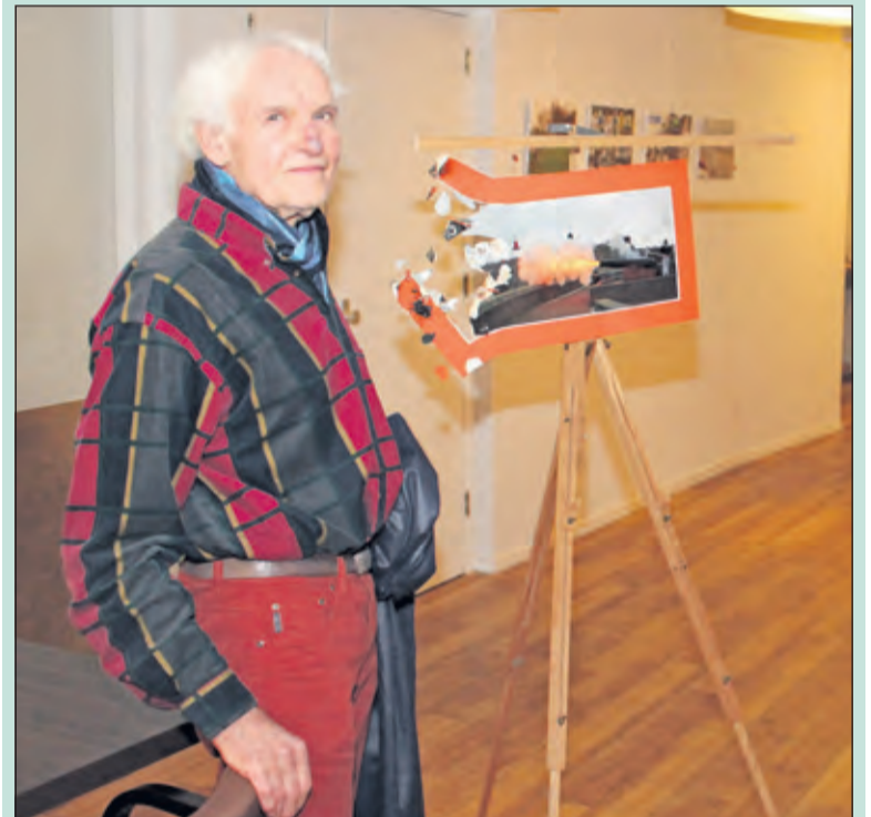
Explosieve openings Actie fotoclub. [foto Henk van de Bunt]

Elk jaar wordt door de club een jaarthema gekozen. Dit keer is dat 'Actie'. Elk lid heeft zijn/haar eigen visie op het thema in een foto laten zien. Het thema 'Actie' lijkt eenvoudig, maar toch.....het laat zich van veel kanten benaderen; dat is op de tentoonstelling goed naar voren gekomen. Meer informatie over de fotoclub is te vinden op: www.fotoclubbilthoven.nl .