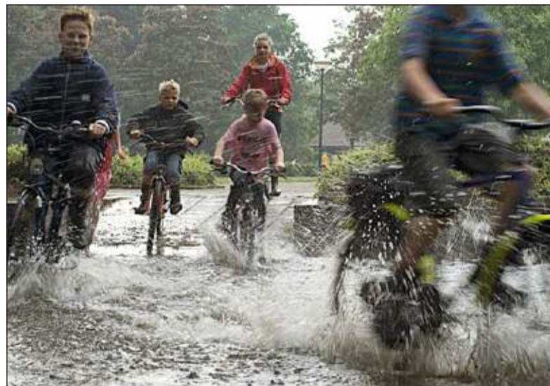
Wateroverlast komt op meerdere plekken in de gemeente voor.

zicht van doelstellingen en knelpunten en een pakket van maatregelen. Over de uitvoering van de maatregelen maken de betrokken waterpartijen (gemeente en waterschap met bijvoorbeeld het drinkwaterbedrijf) onderling afspraken. Doel is om anders om te gaan met regenwater, afvalwater, drinkwater, oppervlaktewater en grondwater in de bebouwde omgeving, waardoor het mogelijk is om problemen tegen te gaan, zoals verdroging, de kwaliteit van het water, wateroverlast, gebrekkige ecologische verbandingen langs de watergangen in de stad en de overstorten van de riolering.