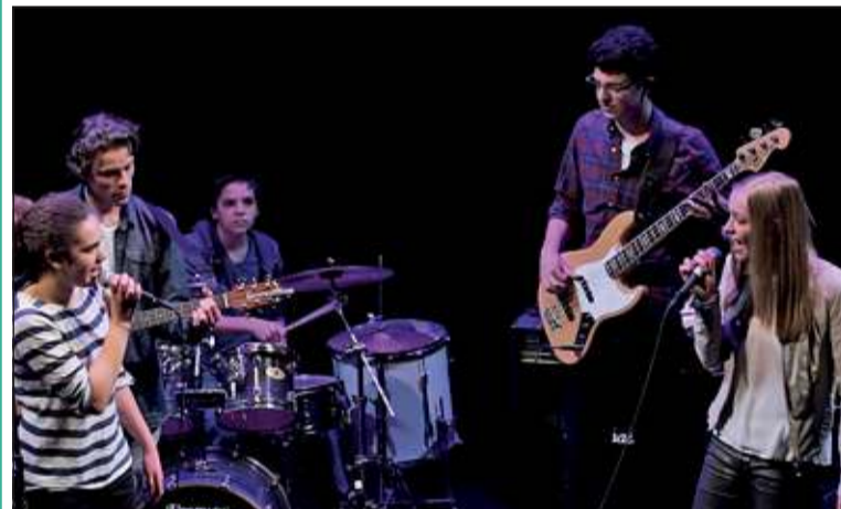
De onlangs opgeleverde Theaterzaal Het Lichtruim beleefde hiermee haar 'maiden voyage' als poptempel van De Bilt.