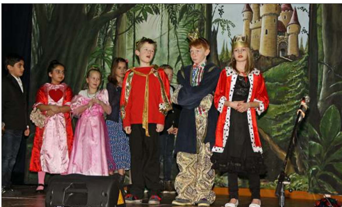
Om het plaatje helemaal compleet te maken, droegen de kinderen prachtige kostuums.