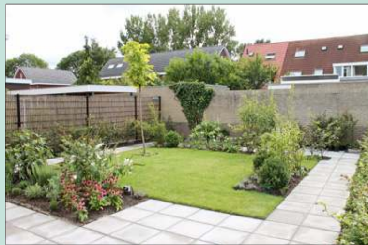
Het eindresultaat van de tuin van Troost.

Komende tijd zijn de cursussen en weer. De groepen bij De Koning zijn altijd klein: minimaal 4 en maximaal 12 deelnemers. Of men een grote of kleine tuin heeft maakt niets uit en De Koning benadrukt maar weer eens dat de sfeer informeel is met veel ruimte voor vraag en antwoord.