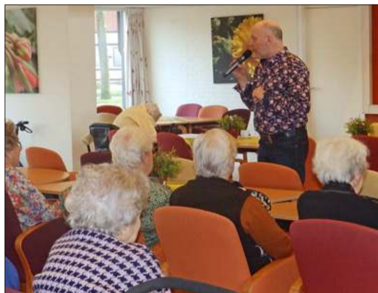
De bewoners genoten erg van het optreden dat vooral uit Nederlandstalige liedjes bestond. De bekende (school-)liedjes werden vrolijk meegezongen.