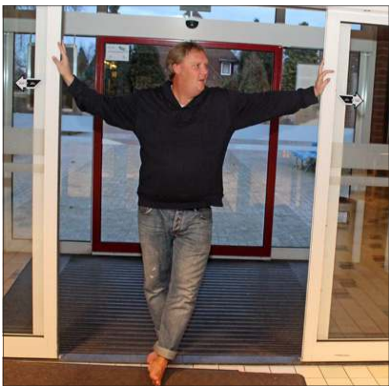
Havekotte probeert de deur naar nieuw zwembad open te houden.