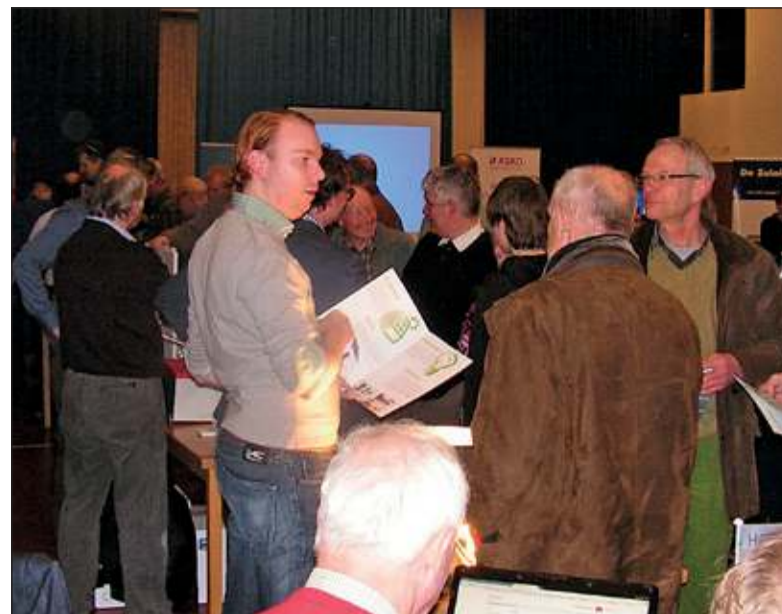
Gezellige drukte op de BENG! energieavond in het Dorpshuis van Westbroek.