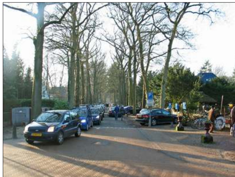
Wisselende verhuur kan grote gevolgen hebben voor de toch al aanzienlijke mobiliteitsproblematiek rond Lage Vuursche, zoals bijvoorbeeld zondag 12 januari jl.