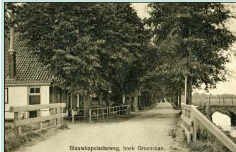
Rechts de brug met ijzeren 'leunings' over de Maartensdijkse vaart naar de Ruigenhoekse dijk, de Polderbrug (voor 1915).

Meteen over de brug linksaf wordt het rijtje huizen dat daar langs de Maartensdijkse vaart staat door echte Groenekanners 'Groenekan over het Water' of 'Het Rooie Dorp' genoemd. Deze in 1923 gerealiseerde woningbouw werd al spoedig het Rooie Dorp genoemd. Naar verluidt vanwege de rooie pannen op de daken van de tien huurwoningen. Deze naam raakte ingeburgerd en is nog altijd in gebruik, bijvoorbeeld voorkomend in de notulen van de Dorpsraad (dec. 2010), waarin staat vermeld m.b.t. verkeersoverlast 'Overigens, sinds een fietspad is aangelegd naar het recreatiegebied, doet deze overlast zich ook voor op de ventweg langs de KW-weg, door het rooie dorp!'