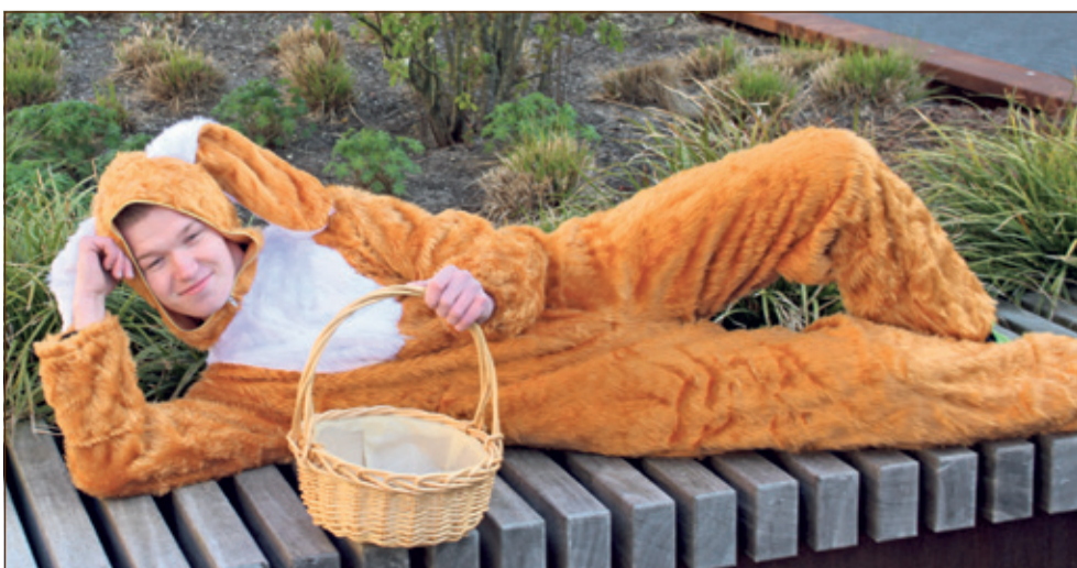
De paashaas zal op diverse plekken in de gemeente te vinden zijn. Aankomend weekend is zijn mandje beslist met eitjes gevuld.

Vrijdag 14 april en zaterdag 15 april is het extra aantrekkelijk om paasinkopen in Bilthoven Centrum en de Kwinkelier te doen. Als welkom krijgt het gehele winkelgebied een feestelijke uitstraling; de gele lopers worden uitgelegd en ballonnen zorgen voor een extra vrolijk accent bij de entrees. Tijdens deze twee dagen voor Pasen wordt een aantal acties georganiseerd, waaronder een speurtocht voor kinderen en een winactie. Op zijn paasbest hopt de paashaas vrijdagmiddag en zaterdag gezellig door het Centrum en de Kwinkelier en deelt paaseitjes uit. Natuurlijk mag iedereen met hem op de foto. Zaterdagochtend in alle vroegte gaat hij in het centrum paaseitjes verstopten. Hij wacht alle kinderen en hun (groot-)ouders rond de klok van elf uur op bij Bubbles & Blessings; het paaseitjes zoeken begint om 11.15 uur.