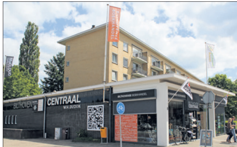
Het complex van Dudok uit de jaren vijftig van de vorige eeuw: ook het lage deel, waarin de Bilthovense Boekhandel is gevestigd is door Dudok ontworpen.

Kaarten kunnen vanaf nu besteld worden via de website www.vierstee.nl . Aanvang van de avond is 20.00 uur. Kaarten worden vanaf april a.s. ook verkocht via Primera (Maartensplein 24, Maartensdijk), De Bilthovense Boekhandel (Julianalaan 1, Bilthoven) en Boekhandel Bouwman (Hessenweg 168, De Bilt).