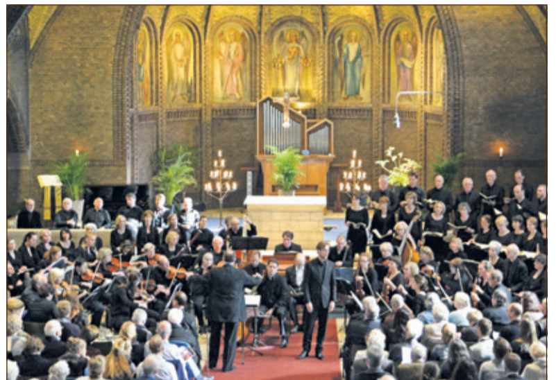
De uitvoering door het Dudokensemble in de OLV-kerk in Bilthoven was het absolute muzikale hoogtepunt van het Biltse culturele seizoen.