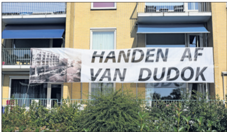
De bewoners van het Dudokcomplex aan de Bilthovense Julianalaan protesteerden regelmatig tegen de gedeeltelijke sloop van het complex; zo ook in september 2016 middels een groot spandoek op de flat.

Na afweging van alle betrokken belangen gaf het College aan het verzoek van de VvE af te wijzen: 'De locatie van het winkelpand is een locatie, waar op basis van de plannen voor het centrum van Bilthoven een herontwikkeling is gepland. Aan de herontwikkeling liggen diverse, door de raad vastgestelde, ruimtelijke en financiële kaders ten grondslag. Wij zijn tot de conclusie gekomen, dat het financieel-economisch belang van de ontwikkeling van het centrumgebied zwaarder weegt dan het cultuurhistorische belang om het Julianacomplex in zijn geheel aan te wijzen als monument'. Hiertegen heeft de vereniging van eigenaren beroep ingediend. De rechtbank heeft nu geoordeeld dat het College, met inachtneming van de uitspraak, een nieuw besluit moet nemen. Het college volgt deze uitspraak op.