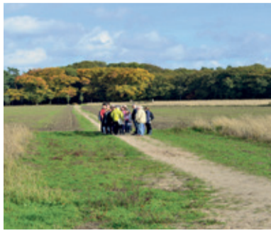
Tijdens de wandeling over Beerschoten vertelt de gids over de rijke historie van deze landgoederen.

Het is weer gezellig bij Landgoed Beerschoten op 1e en 2e paasdag. Er is een speurtocht 'Lentekrabbels'. 1e Paasdag kan men vanaf 12.00 uur broodjes bakken in de vuurkorf, totdat ze op zijn. Het infocentrum is op beide dagen open van 11.00 tot 16.30 uur.