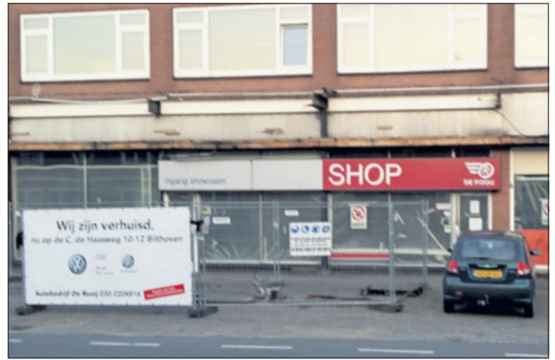
Er is inmiddels een begin gemaakt met de realisering van bouwplan op het voormalige garagerrein van De Rooij. De benzinepompen zijn inmiddels verwijderd.

Omdat er zoveel wel of niet was afgesproken en er steeds door de gemeente werd teruggegrepen op niet te controleren gemaakte afspraken wilde ‘HartvoorDeBilt’ inzicht krijgen in die achterliggende afspraken. De gemeente gaf die echter niet vrij. Daarom werd een WOB-verzoek (Wet Openbaarheid van Bestuur) bij de gemeente ingediend. Omdat er op het WOB-verzoek geen reactie kwam werd op 7 juni 2016 een bezwaar ingediend tegen het niet tijdig reageren door de gemeente. Op 23 juni 2016 kwam de reactie van de gemeente, die inhield dat van de 27 betreffende documenten er slechts 7 openbaar mochten worden gemaakt. Tegen