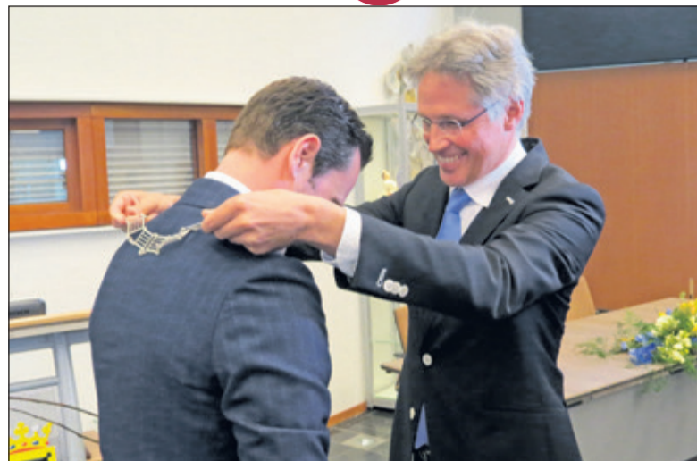
Het omhangen van de ambtsketen maakt de installatie compleet.