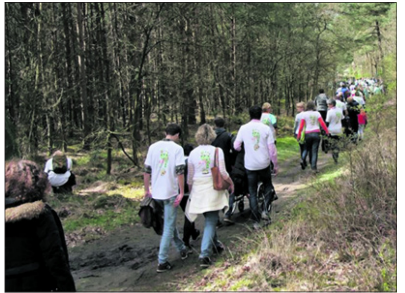
In 2016 was de ALS lenteloop al direct een groot succes.

Start Het evenemententerrein wordt om 13.00 uur geopend. Het startschot voor de loop wordt gegeven door de burgemeester om 14.00 uur. Er kunnen verschillende afstanden worden gelopen (kidsrun van 2,5 km, en 5 of 10 km voor volwassenen) of gewandeld (5 km of iets minder, of de 500 meter special). De dag wordt rond 18.30 uur afgerond met een muzikale Grande Finale. Er is genoeg te doen, ook wanneer men niet loopt. Dus meld je nu aan of steun een team met een donatie. Ineke Zaal