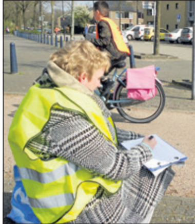
Controleposten met gele hesjes en fietsende kinderen met oranje hesjes vormden het straatbeeld tijdens het verkeersexamen.

Veilig Verkeer Nederland, afdeling De Bilt organiseert dit belangrijke gebeuren in samenwerking met de gemeente. Alle scholen kwamen met de leerlingen verdeeld over de ochtend naar de School met de Bijbel om vandaar uit het praktijkdeel van het verkeersexamen te gaan afleggen. Al zeven jaar treedt de school op als vertrekpunt van dit evenement. Alle kinderen waren geslaagd voor het theoriegedeelte van het examen. Na het startschot rond 9.00 uur vertrok er om de minuut een leerling om de route door Maartensdijk af te leggen. De laatste leerling vertrok rond 12.00 uur, geobserveerd door de talrijke controleposten langs de route die de handelingen en het gedrag van de leerlingen beoordeelden. De personen die de controleposten - dit jaar ca 160 - bezetten hebben een trainingsavond gevolgd om goed geïnformeerd en op de hoogte te zijn van de laatste veranderde verkeersregels en situaties.