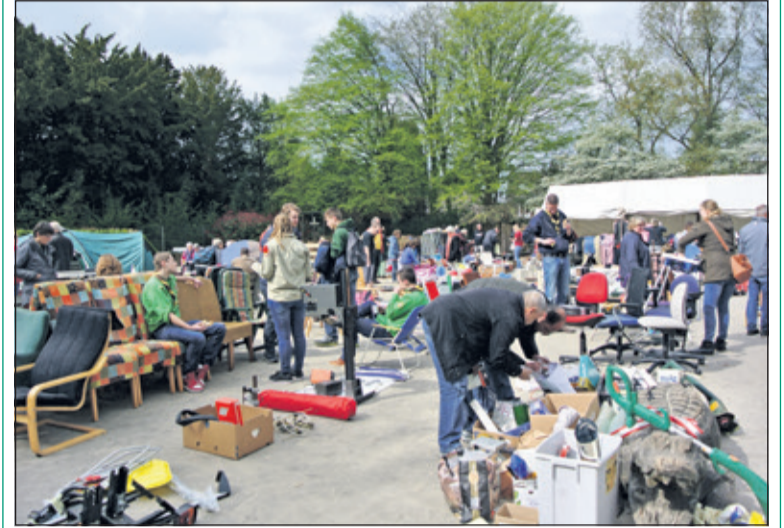
Ruime belangstelling voor de rommelmarkt van Scouting Ben Labre.