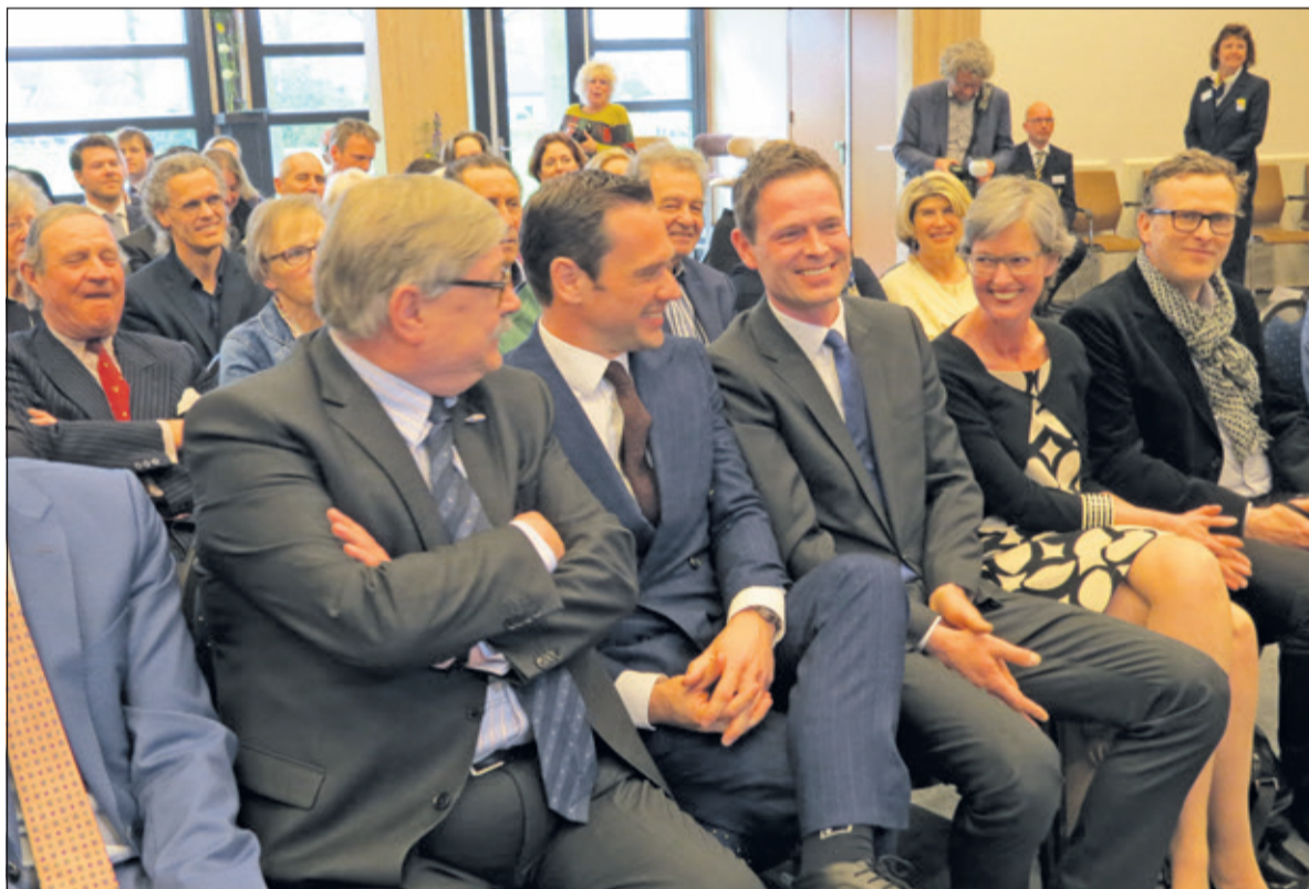
De nieuwe burgemeester met partner en familie.