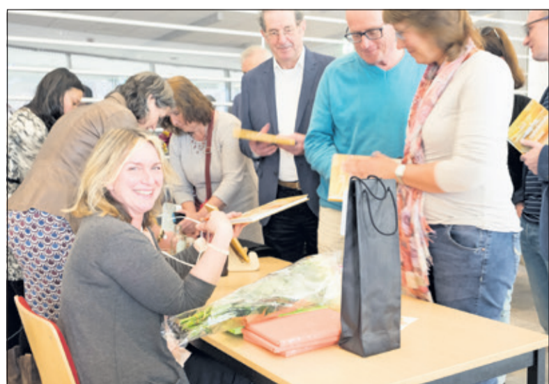
Over haar ervaringen is nu een boek geschreven, waarin haar gedichten, teksten en schilderijen zijn opgenomen.

spreken', zegt ze met Eckhart von Hochheim, de middeleeuwse theoloog, en gelijk heeft ze!