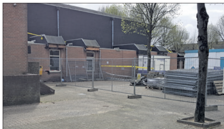
Momenteel worden de renovatiewerkzaamheden aan de buitenzijde van de Vierstee uitgevoerd.

uitgenodigd voor de inloopavond op woensdag 19 april tussen 19.30 en 20.30 uur in De Vierstee. Medewerkers van bouwbedrijf Vaessen en de gemeente De Bilt zijn aanwezig om toelichting te geven op impressies van het pand en eventuele vragen te beantwoorden. Zie voor meer informatie ook www.debilt.nl/vierstee .