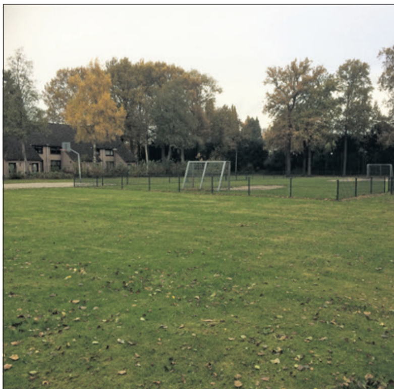
Omwonenden van het speelveldje in de Leijen maken zich zorgen over de gezondheidsrisico's van straling als daar een zendmast wordt geplaatst.

In de raadscommissievergadering van 16 maart is door Beter De Bilt een voorstel ingediend waarin het College van Burgemeester en Wethouders wordt gevraagd een startnotitie op te willen stellen voor een antennebeleid.