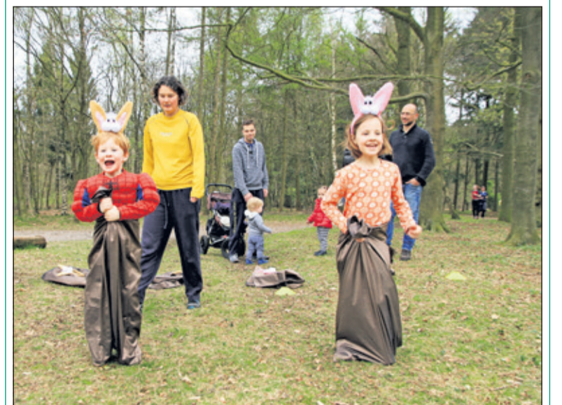
Paashastraining voor de jongsten tijdens het parcours.

In het kader van zijn 100 jarig bestaan organiseerde Fraternitas De Bilt op zaterdag 8 april een recreatieve Paaseierenloop in het Houdringebos. Een gezelschap van zo'n 70 deelnemers van alle leeftijden begon om 8.45 uur enthousiast met een warming up bij het schaatsmeertje. Daarna startte een 2km parcours waar op 3 punten een leuk spel was ingebouwd. Om 9.45 uur werd afgefloten voor de cooling down gevolgd door een drankje, paaseitjes en gezelligheid en de kinderen konden paaseitjes zoeken. Het was een heel geslaagde activiteit