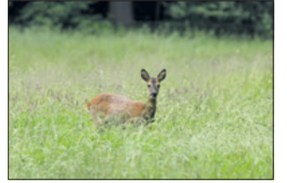
Het Utrechts Landschap spant zich in om reeën en andere bewoners in het natuurgebied te beschermen.

Utrechts Landschap stelt graag haar natuurgebieden open voor publiek. Honden zijn welkom in de meeste van deze gebieden.