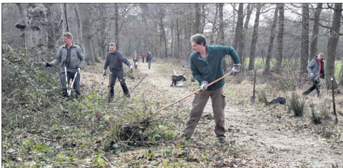
Voor onderhoud van het landgoed kan Eyckenstein nog wel wat extra handen gebruiken.