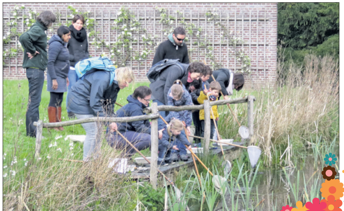
Waterdierjes scheppen op Oostbroek

Het park van Oostbroek is in 1887 ontworpen door I.H.J. van Lunteren. Twee jaar geleden heeft Utrechts Landschap het park ingrijpend gerestaureerd. Paden werden geschikt gemaakt voor wandelwagens en rolstoelen, er is een nieuwe brug geplaatst over de slingerijver en over het moerasbos is een spectaculaire cortenstalen wandelbrug aangelegd.