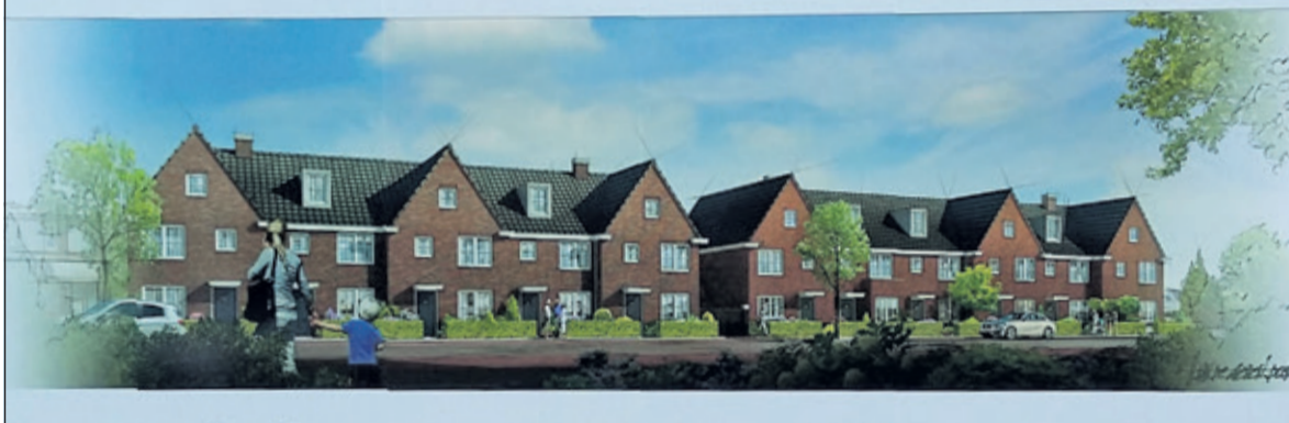
Er is reeds een aanvang gemaakt met de verkoop van de woningen.