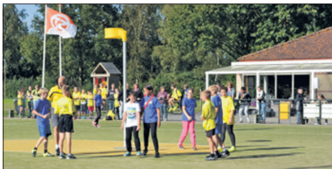
De finale ging tussen het blauw uit Maartensdijk en het geel uit Westbroek.