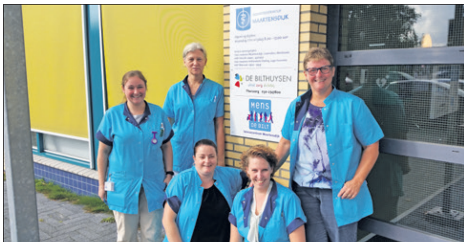
Elke ochtend start het 'blauwe team' vanuit Dijkstate om de wijk in te gaan en daar hun werk in de thuiszorg te doen.

Het ziet er naar uit dat in de toekomst de straten nog blauwer zullen kleuren, want De Bilthuysen zoekt versterking. Klanten geven De Bilthuysen niet alleen bijnamen maar ook hun waardering. In juni dit jaar is de klanttevredenheid gemeten, met als resultaat een 8,1 voor team Thuiszorg. 'Derhalve herkent u het team dus niet alleen aan hun blauwe uniform en gele auto, maar ook aan hun warme hart en grote inzet', meldt beleidsmedewerker Anne van Middelaar. Het team ondersteunt klanten bij het leiden van hun leven op eigen wijze. Zie ook de personeelsadvertentie in deze krant van De Bilthuysen.