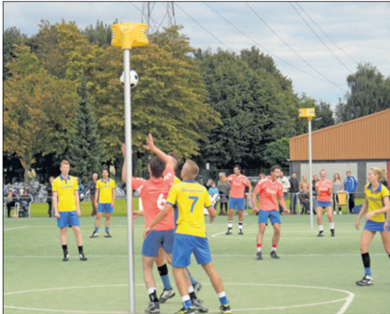
Hoogstaand spel in Veenendaal.

Een prima resultaat en mooie wedstrijd. DOS blijft op de derde positie staan met een punt achterstand op beide koplopers. Volgende week wacht de laatste wedstrijd van het eerste deel van de veldcompetitie. In Westbroek spelen om 15.30 uur de korfbalsters uit Drachten..