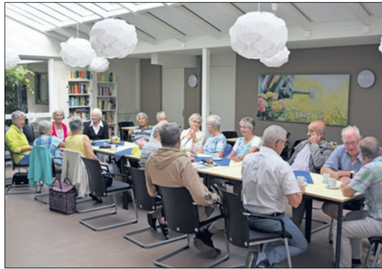
Voorafgaand aan de fietstocht is er een gezellig samenzijn en koffie.

vakantie in de Peel, op de grens van Brabant en Limburg bracht mij in extase'.