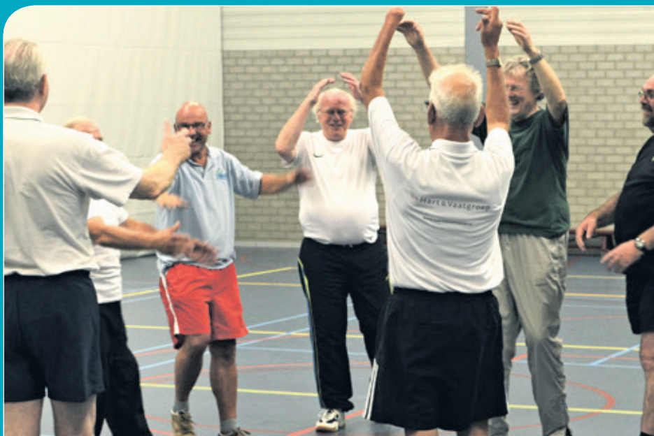
Het enthousiasme is groot bij deze sporters.