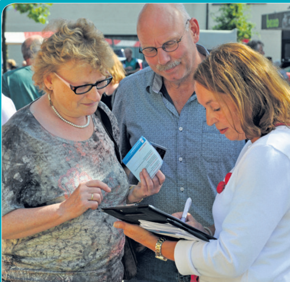
Steunpunt Mantelzorg De Bilt op zoek naar mantelzorgers in De Bilt.