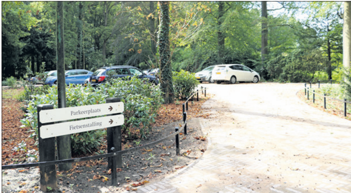
De nieuwe parkeerplaats heeft dezelfde oppervlakte als de vorige, maar door hem anders in te delen kunnen er meer auto's geparkeerd worden.