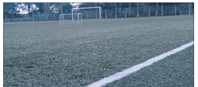
Kunstgras ligt ook bij FC De Bilt.

land wachten ook De Bilt en Maartensdijk de uitkomsten hiervan met grote belangstelling af. Maandag 10 oktober spraken het RIVM, de Vereniging Sport & Gemeenten en kunstgrasfabrikanten verder met elkaar. Gehoopt wordt op snelle duidelijkheid; in afwachting van nieuwe ontwikkelingen blijven de voetbalvelden in gebruik.