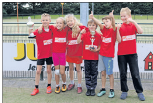
De Wereldkidz Kievit-winnaars.