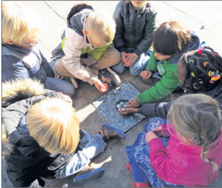
Kinderen van groep 1 spelen bij een knikkertegel van gerecycled plastic.