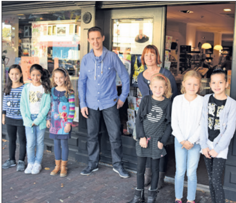
Vol trots staan leerlingen van de Regenboogschool voor hun zelf versierde etalage bij Boekhandel Bouwman.

Woensdag 5 oktober vond de opening van de Kinderboekenweek plaats in gemeente De Bilt. Boekhandel Bouwman uit De Bilt en de Bilthovense Boekhandel uit Bilthoven waren gastvrouw/-heer voor de kids van de Regenboogschool uit De Bilt en voor de Van Dijkschool uit Bilthoven.