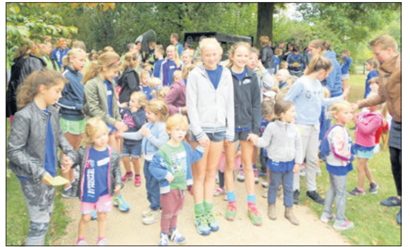
De kleuters staan samen met hun begeleiders uit groep 8 te wachten op het startschot voor het lopen van hun ronde.

De sponsorloop wordt in drie etappes gelopen. Eerst de kleuters. Begeleid door kinderen uit groep acht liepen zij een kleine ronde. Daarna was het de beurt aan de groepen 3, 4 en 5 om in een kwartier zoveel mogelijk rondjes te lopen, waarna de groepen 6, 7 en 8 hun rondjes liepen. De in grote getale opgekomen (groot-)ouders moedigden de leerlingen enthousiast aan.