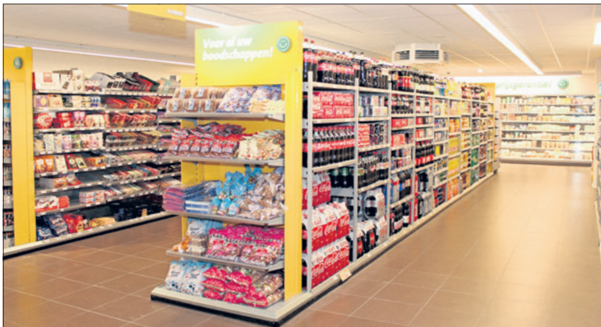
Door die 200m 2 erbij te betrekken is Jumbo Maartensdijk ruimer van opzet geworden.

stellingen, die 24 uur eerder met alle collega's ruim gevuld waren. Klanten moesten misschien even wennen aan een andere plek voor hetgeen zij zochten, maar waren later meer dan tevreden over de grotere ruimte en de daarbij behorende overzichtelijkheid. De loop kwam er meer dan in; de grandioze inzet van alle collega's de afgelopen vijf dagen werd op deze wijze dan ook meer dan beloond'.