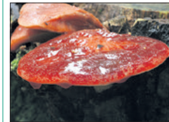
Biefstukzwam bij Drakensteyn.

Ina van den Berge (030 2286511) of Jaap Milius (030 2288636).