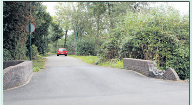
Het bruggetje bij de Veldlaan in Groenekan is maar heel kort heel geweest.

De renovatie neemt ongeveer een maand in beslag. Samen met omwonenden was gekeken of de renovatie aangegepen kon worden om de verkeerssituatie van de smalle brug te verbeteren. In mei van dit jaar volgde het besluit van het College van Burgemeester en Wethouders: ‘de brug op de kruispunt Groenekanseweg / Veldlaan is niet geschikt voor zwaar verkeer. Dit vanwege de geringe breedte en de conditie van constructie van de brug; zwaar verkeer kan gebruik maken van de bredere brug van de Vijverlaan; dit slechts een geringe omweg betreft; enz. Inmiddels is de brug weer aanzienlijk beschadigd.