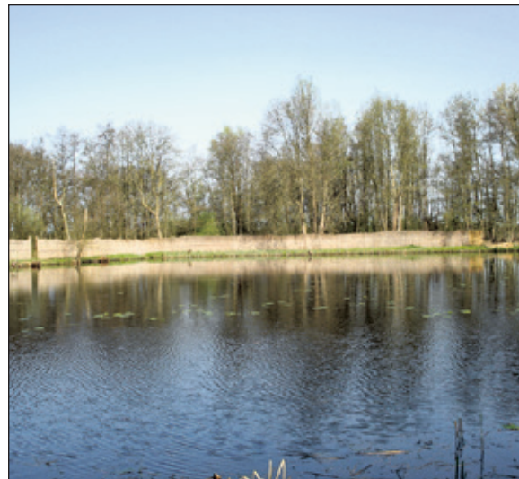
Er zijn nog 3 dagen dit jaar waarop je achter de schermen van de eendenkooi kan kijken.

De rondleidingen duren circa 45 minuten. Vooraf aan- melden om hieraan deel te nemen is niet nodig en deel- name is gratis. Een vrijwillige bijdrage voor de resta- uratiekosten van de eendenkooi wordt op prijs gesteld. De rondleidingen starten halfweg de Kanaaldijk, een fiets en wandelpad gelegen tussen Hollandsche Rading en Tienhoven. Te bereiken vanuit Hollandsche Rading via het verlengde van de Graaf Floris V weg en van- uit Tienhoven via de Dwarsdijk. Bij regenachtig weer zijn er geen rondleidingen. (Eric Immikhuizen)