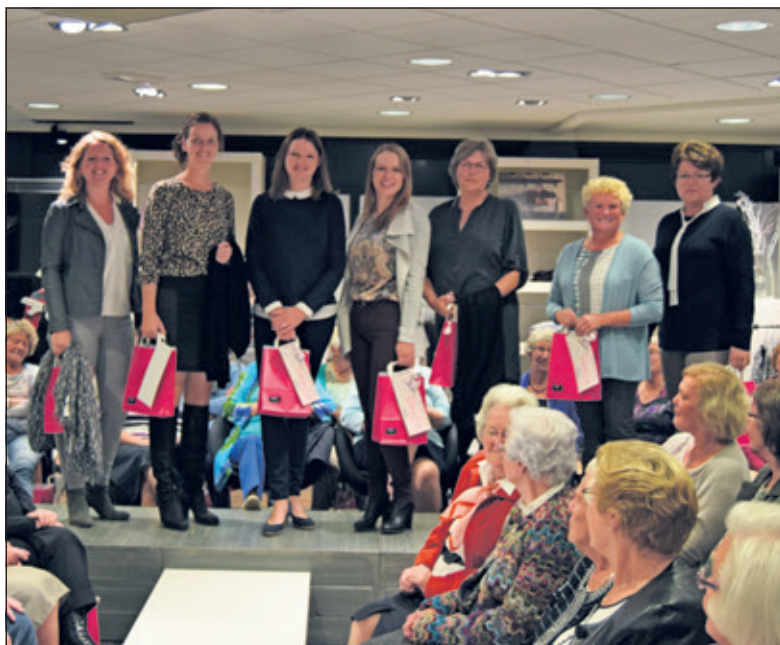
Gedurende een 20 minuten durende show presenteerde Nagel de najaarscollectie tijdens Fashion Eve.

Op deze avond werd een deel van de najaarscollectie uit de winkel getoond. De collectie bestaat dit najaar uit prachtige materialen en warme tinten die op vele manieren te combineren zijn. Stijlvol, chique, sportief, gekleed of feestelijk voor alledaags. De modellen die de sets showen variëren in maat van 36/38 tot maat 46. Daarmee werd de brede lijn van de damescollectie prachtig onderstreept. De verschillende merken en stijlen bleken op diverse manieren te combineren waardoor er voor elke leeftijd en voor ieder wat wils is. Na de presentatie was er gelegenheid voor een