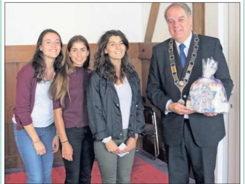
Een cadeautje voor de burgemeester.