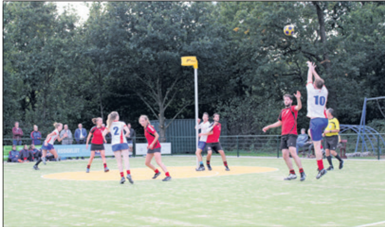
Midlandia (rood) werd op een 26-9 nederlaag getrakteerd.

Zaterdag 15 oktober staat alweer de laatste veldwedstrijd vóór het zaalseizoen op het programma. Nova reist af naar Alkmaar, om daar aan te treden tegen hekkensluiter DSO. Aanvang: 15.30 uur.