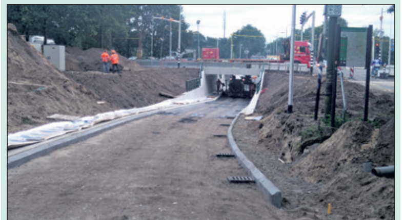
Maandagochtend 10 oktober werd de weg weer opengesteld en konden de fietsers gebruik maken van de nieuwe fietstunnel. Ook zijn de nieuwe verkeerslichten in bedrijf.

In het weekend van 7 t/m 10 oktober voerde de provincie asfaltwerkzaamheden uit aan de kruising Utrechtseweg/Amersfoortseweg (kruising Vollenhoven) in De Bilt. Door het kruispunt anders in te richten en een fietstunnel aan te leggen, verbeteren de doorstroming en de verkeersveiligheid. Om deze asfaltwerkzaamheden te kunnen uitvoeren moest de kruising dit weekend worden afgesloten. Na de weekendafsluiting worden nog kleine afrondende werkzaamheden uitgevoerd en wordt er groen aangeplant. Deze werkzaamheden geven geen verkeershinder en duren naar verwachting tot het einde van dit jaar.