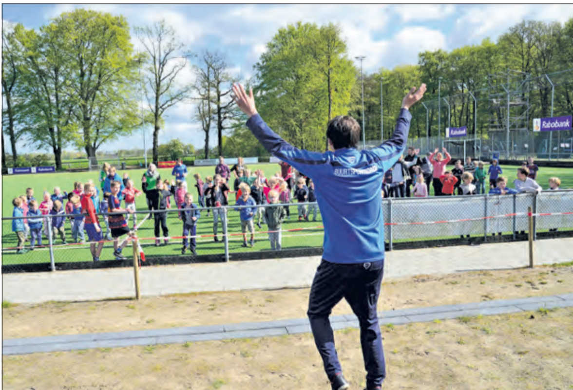
De buurtsportcoach geeft het ritme aan.

Alle BSO kinderen van Kinderopvang De Bilt konden tijdens een sportdag kennis maken met verschillende sporten. Dit jaar stond onder