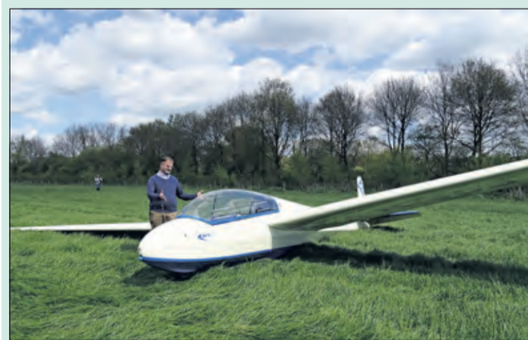
Noodlanding op het weiland bij de Charles Weddepothlaan. (foto Gerrit van Gorp R.Hom)

Woensdag 4 mei maakte een zweefvliegtuig een noodlanding in het weiland bij de Charles Weddepothlaan in Hollandsche Rading. Door het wegvallen van de thermiek daalde het vliegtuig te snel en miste de piloot het vliegveld. Hij kon het vliegtuig ongeschonden in het weiland aan de grond zetten waarna dorpsbewoners met vereende krachten hielden het vliegtuig op een trailer te plaatsen die het terugbracht naar de thuishaven.