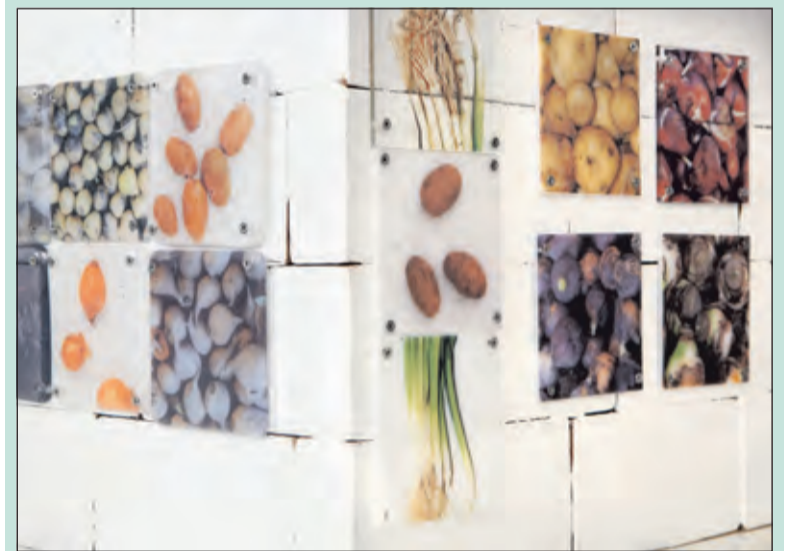
Nieuwe expositie in ruimte voor kunst.

De (officiële) opening is op 21 mei om 17.00 uur (met hapje en drankje). De openingstijden van de expositie zijn donderdags van 14.00 tot 18.00u, vrijdag van 11.00 tot 18.00u en zaterdag van 11.00 tot 17.00u. In het openingsweekend van deze expositie ook op zondag van 12.00 tot 17.00u.