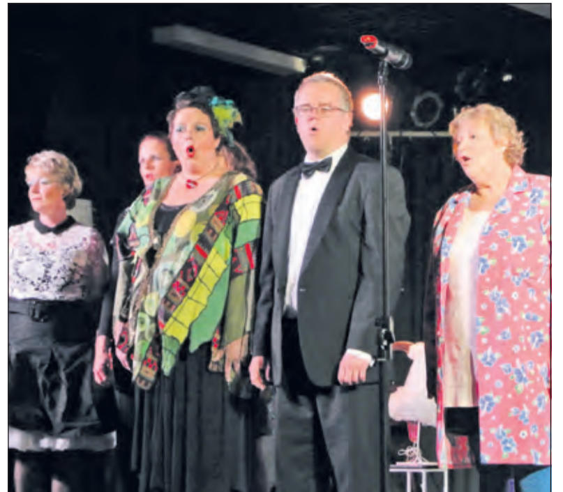
Sojater zet de avond luister bij.

Kaartverkoop via: Primera Maartensdijk, De Vierklank in Groenekan en tuincentrum Karel Hendriksen in Hollandsche Rading. In Bilthoven bij de Bilthovense Boekhandel en in De Bilt bij Bouwman Boeken. Toegangs-prijs € 7,50. Info. E-mail: evt@ebbevantonningen.com of tel. 06 53225908.