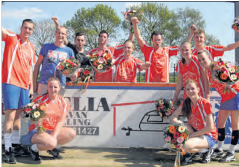
DOS in de bloemen.

Bleef het in de zaalcompetitie tot de laatste minuut spannend, in het veld was DOS heer en meester. Twee wedstrijden voor het einde van de competitie was de titel dan ook al binnen, na een ongeslagen reeks wedstrijden. Het verschil met de nummer twee bedraagt zes punten op de ranglijst.