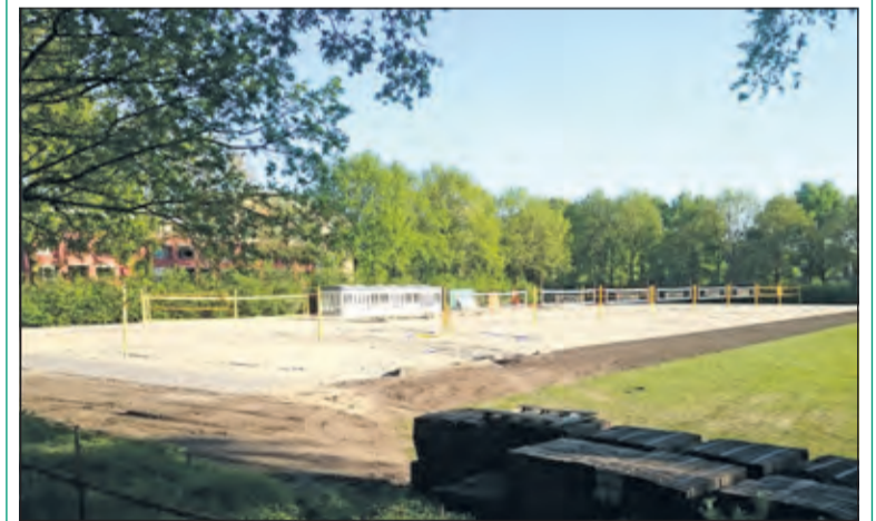
De nieuwe beachlocatie.

Met 12 velden op sportpark Larenstein heeft Irene Beach een toplocatie voor Eredivisie, en andere divisietoernooien, uiteraard is er ook voldoende plek voor recreatief beachvolleybal. Op maandagavond is er de gebruikelijke inloopcompetitie waarbij alle leden onderling in wisselende samenstelling een balletje kunnen slaan. Dinsdag, woensdag en donderdag staan in het teken van de trainingen; hier wordt jong talent de mogelijkheid geboden om 3 avonden in de week te trainen om het topniveau te bereiken. De vrijdagen staan in het teken van de Utrechtse Beachcompetitie. Ruim 80 teams strijden de komende 10 weken om de eer in een laddercompetitie op Irene Beach en de volleybal velden in het Utrechtse Zuilen. (Rocco Wammes)