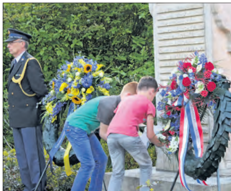
Leerlingen van Groen van Prinstererschool leggen bloemen.