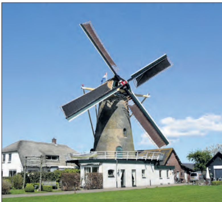
Molen Geesina zet de deuren open voor publiek tijdens de molendagen.

Om deze dag nog aantrekkelijker te maken, organiseren vele molenaars extra activiteiten zoals molenmarkten, fietstochten, pannenkoeken eten en spelletjes. Voor de kinderen is op iedere molen een gratis Molen Doe-boekje beschikbaar. Dit boekje staat vol met molenweetjes, spelletjes en raadsels. Een leuke manier om de molen te ontdekken. En in het kader van haar 40-jarig bestaan, organiseert het Ambachtelijk Korenmolenaars Gilde een bakwedstrijd. Meer informatie vind je op www.molens.nl