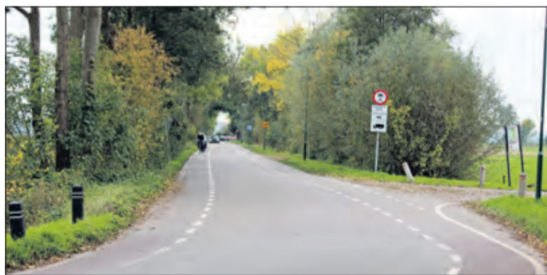
Van maandag t/m vrijdag mag tussen 6.00 en 9.00 uur niet zonder ontheffing naar Westbroek worden afgereisd via de Korssesteeg.

De memo bevat tevens de bijkomende conclusie, dat het zeer aan-