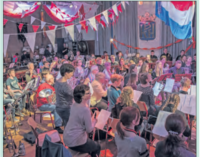
's Avonds werd de week afgesloten met een klein concert voor leden van de KBH en genodigden, waarbij beide orkesten en de majorettes zich van hun beste kant hebben laten zien.

De donderdag erna was tijd voor wat ontspanning. De jongeren maakten in Amsterdam een rondvaart en een wandeling in het centrum. Vrijdagmorgen stond de Piramide in Austerlitz op het programma nadat zij in een quiz vijftien vragen hadden beantwoord over De Bilt en Nederland. De drie besten werden beloond met een kleine attentie. Vrijdagmiddag hebben de jeugdleden van beide orkesten bij FC De Bilt gestreden in een zeskamp. Er was na afloop puur Hollands eten dat je als buitenlandse gast niet mag missen. Met dit bezoek is opnieuw de goede band die De Bilt heeft met Miescisko verstevigd. (Joke Nederhof)