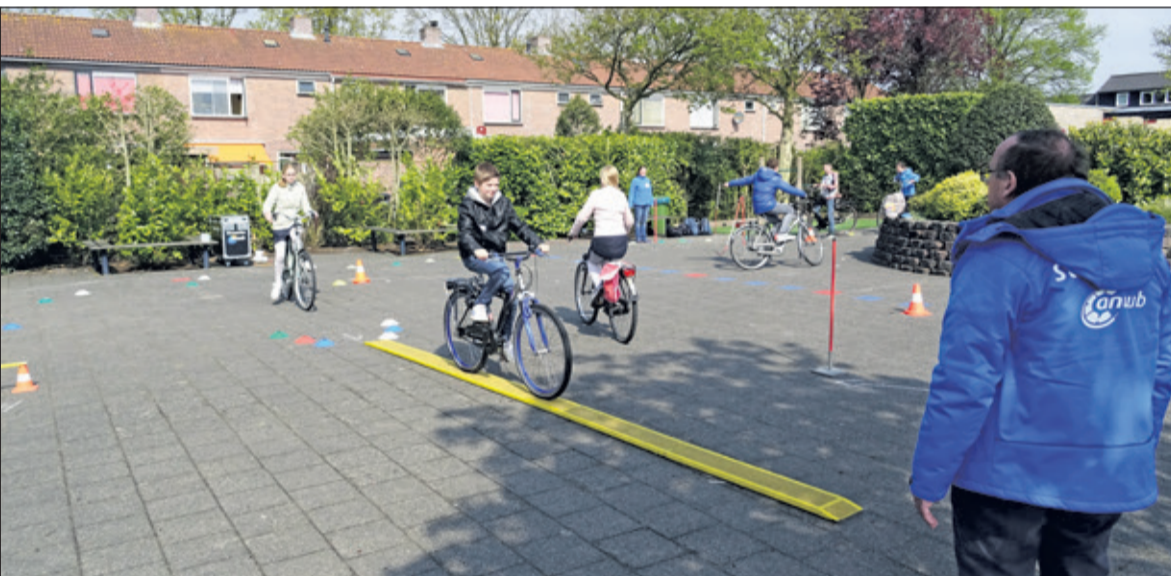
Leerlingen van de groepen 7 en 8 leggen een lastig parcours af op het schoolplein. Alle leerlingen sloegen zich onder toezicht van de instructeurs kranig door de beproevingen heen.