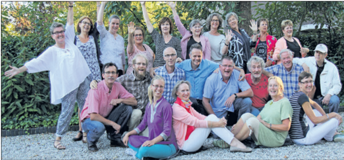
Het enthousiaste kamerkoor kijkt uit naar hun optreden in de Immanuelkerk aan de Soestdijkseweg 49a in De Bilt.

Aanvang 15.00 uur. Kaarten reserveren of meer informatie op www.kamerkoordebilt.nl