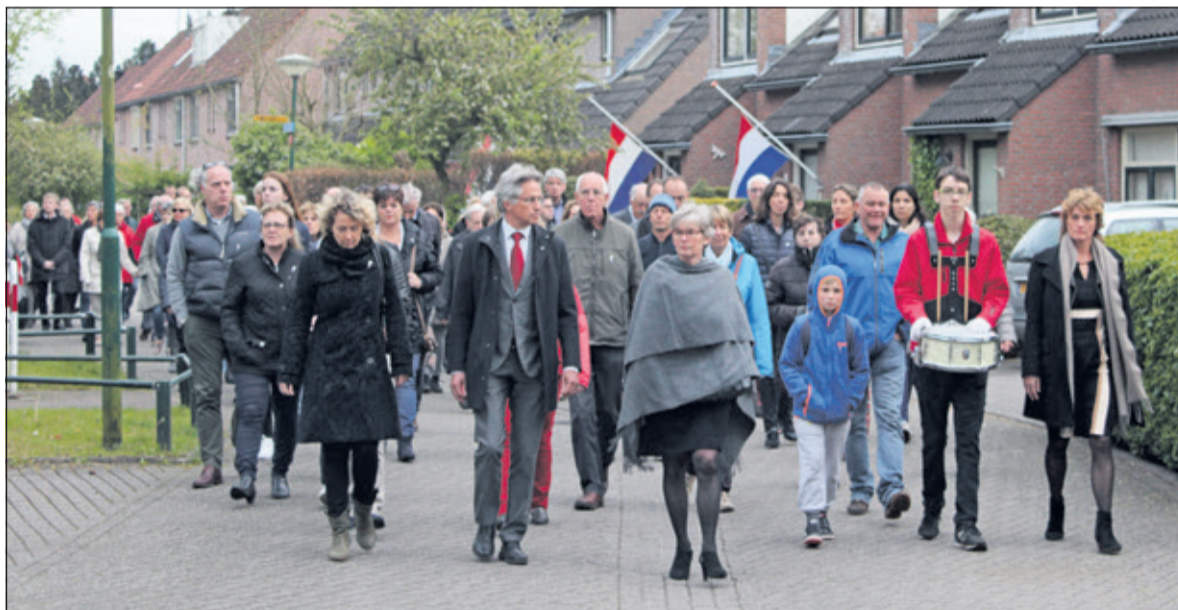
Er was een stille tocht door Hollandsche Rading.

door Vriendenkring uit Westbroek diverse koralen gespeeld. Na het taptoesignaal was het twee minuten stil. Daarna werden de coupletten 1 en 6 van het Wilhelmus gezongen, begeleid door Vriendenkring. Er werd nog een gedicht voorgedragen door twee jongeren. Na afloop was er een kopje koffie of thee in het Dorpshuis voor de aanwezigen, aangeboden en verzorgd door Leut; een vrijwilligersinitiatief binnen het dorpsshuis.