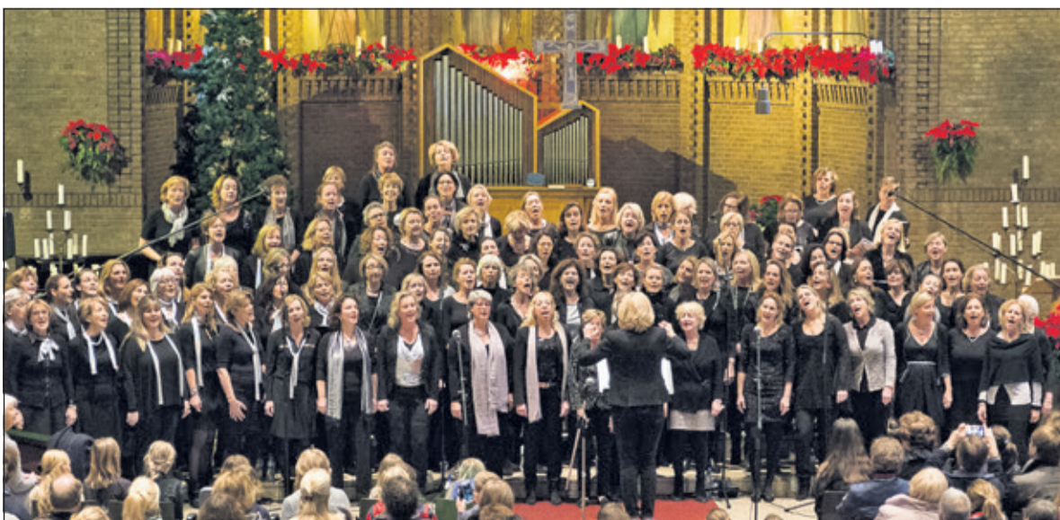
De Voices of Bilthoven tijdens een optreden in het kerkgebouw van de OLV-parochie in Bilthoven.