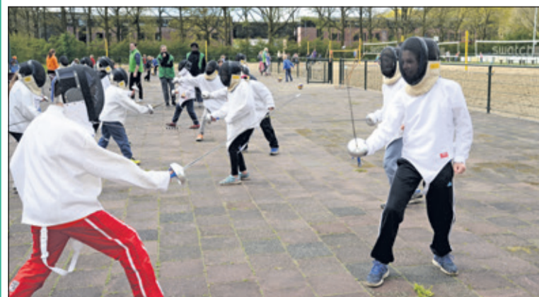
Kinderen doen enthousiast mee aan een clinic schermen.

In de meivakantie organiseerde Kinderopvang De Bilt haar jaarlijkse Sportdag. Honderddertig kinderen van de BSO-locaties van Kinderopvang De Bilt trotseerden de kou en deden enthousiast mee aan de actieve sport-clinics die er werden gegeven in samenwerking met Mens De Bilt. Dit jaar werd gebruikgemaakt van de accommodatie bij Korfbalvereniging NOVA, welke ideale mogelijkheden biedt voor clinics over schermen, beachvolleybal, en uiteraard korfbal. (Nicole Quadackers)