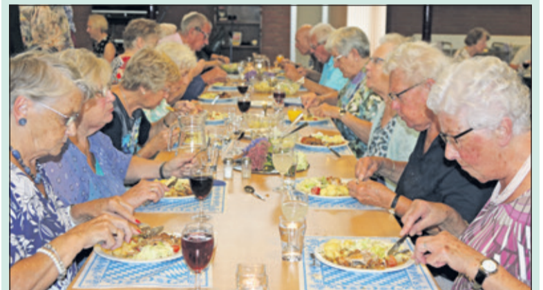
De maandelijkse Eet es mee avond bij WVT wordt goed bezocht.

In de Bilthovense wijk Tuindorp wisten ze 93 jaar geleden al dat je als buurtbewoners samen tot mooie dingen kunt komen. WVT werd opgericht als klein buurtinitiatief, met een focus op kinderactiviteiten en belangenbehartiging. Inmiddels is de vereniging uitgegroeid tot een gemeente brede welzijnsorganisatie met rond de 4000 leden, een eigen gebouw en activiteiten voor alle leeftijden. Gerund door maar liefst 220 vrijwilligers en enkele betaalde krachten.