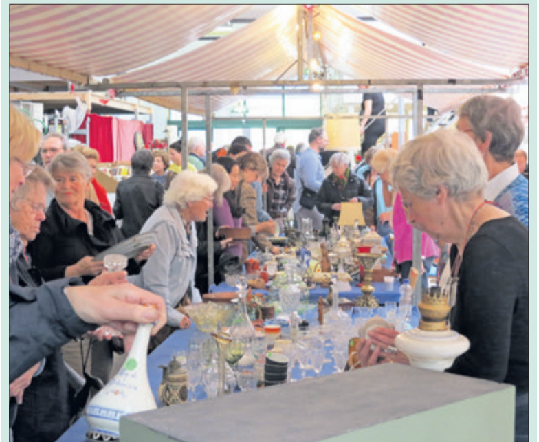
Het liep storm bij de Lentemarkt.