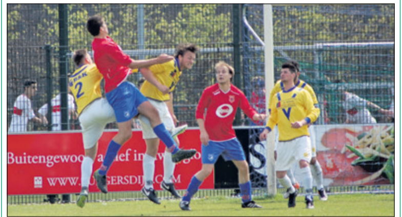
Twee spelers van DOSC springen hoger dan vier Maartensdijkers.

Over de wedstrijd van afgelopen zaterdag zelf: 'Vanaf de aftrap, ging DOSC het strafschopgebied van SVM in, diverse verdedigers van SVM lieten niet goed op en de thuisclub kwam al meteen op voorsprong (1-0). DOSC kreeg van meet af aan alle ruimte: in de 4e minuut mochten de gastheren met een mooi schot de 2-0 laten aantekenen. SVM zelf was heel matig en er viel slechts één kans (37ste minuut) te noteren. In de tweede helft 'pakten' drie spelers van SVM binnen vijf minuten een gele kaart voor overtredingen en mocht een enkeling zelfs van geluk spreken, dat er een 'tweede' uitbleef. Diederik Hafkemeijer werd gewisseld voor Derk de Brauw en Joey Engel voor Bas van Dijk, maar ook zij konden niet voor de ommekeer zorgen. In de 89e minuut maakte DOSC nog de 3 - 0. Naast de bezoekers was ook het talrijk opgekomen Maartensdijkse publiek de grote verliezer. (Nanne de Vries)