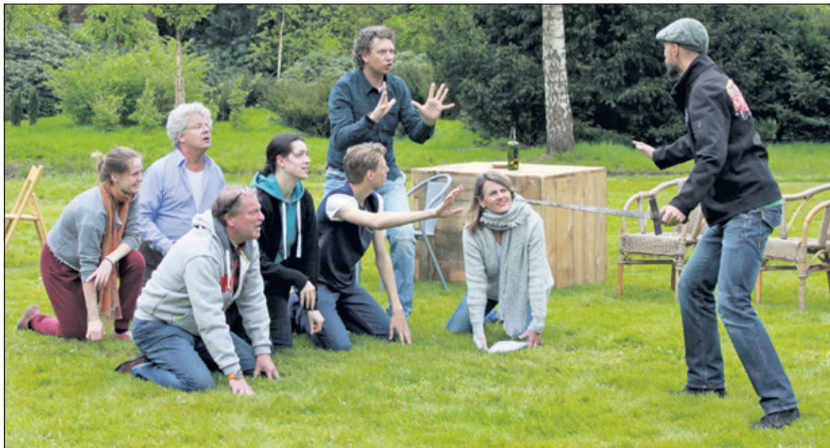
Theater in 't Groen oefent op locatie.

Toegangskarten voor 'Don Quichot' zijn te koop in de webwinkel via www.theaterinhetgroen.nl/kaartverkoop en vanaf 22 mei ook bij Fa. van der Neut, Groenekaneweg 5/13 in Groenekan, bij Primera, Maartensplein 24 in Maartensdijk, bij de Bilthovense Boekhandel, Julianalaan 1 in Bilthoven en bij Bouwman Boeken aan de Hessenweg 168 in De Bilt. Op deze verkooppunten is telefonisch reserveren niet mogelijk. Meer informatie en contact: www.theaterinhetgroen.nl .