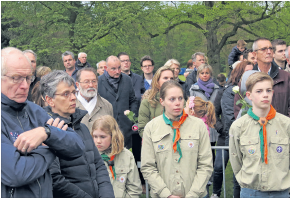
Veel belangstelling bij de stijlvolle herdenking.