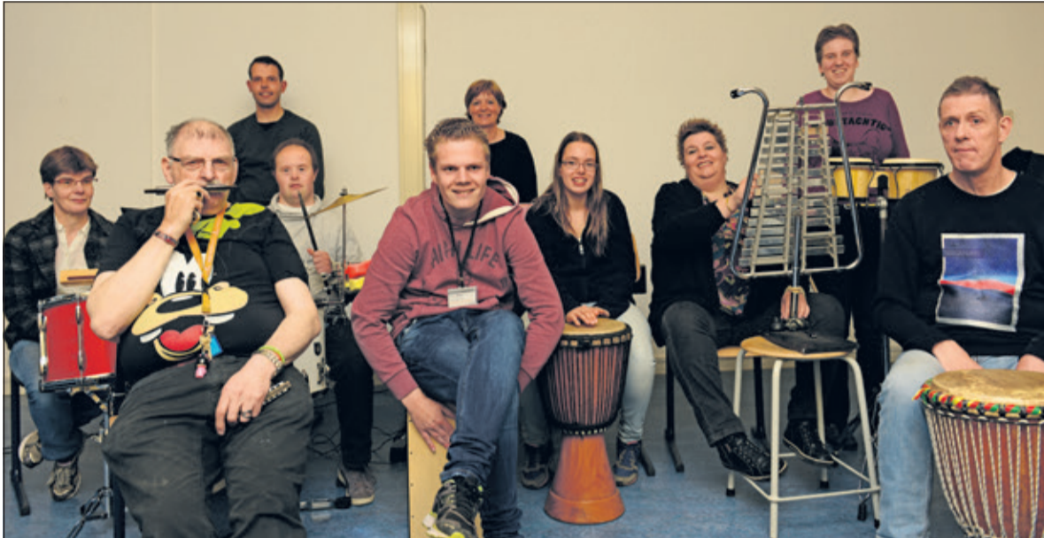
De Tornado's treden vrijdag 12 mei op in De Kroeg.