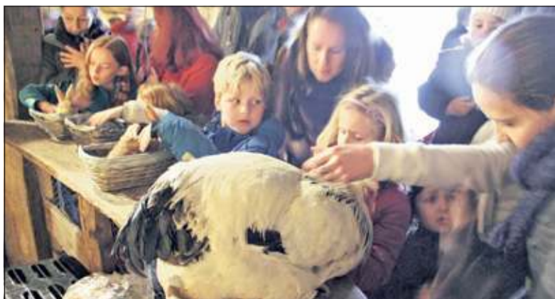
Het aabare kleinvee valt bij de jeugdige bezoekers zeer in de smaak.

Voor de kerstinkopen kan de bezoeker terecht bij de Kerstshow in de overdekte ruimtes. Bij deze show is alles te vinden om thuis de Kerstperiode extra gezellig aan te kleden. Er is een enorme collectie kunstbomen, maar houdt u het liever bij "echt" dan vindt u op het buitenterrein een grote keus bomen.