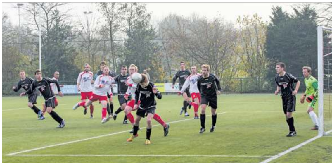
Vaste fotograaf www.fotowillemsen.nl was zaterdag na een lange blessure weer present om deze wedstrijd foto te maken.

de mannen uit Zevenhoven helemaal opgegeten en in de 62e minuut scoorde Bart Kuijpers de gelijkmaker. Het laatste half uur was het voor de toeschouwers genieten van de diepte in het spel van De Bilt en het was meer dan terecht geweest als de drie punten in De Bilt waren gebleven. Aan beide kanten werden in de laatste fase nog enkele corners genomen en die zijn met de lange mannen uit Zevenhoven voor het Biltse doel gevaarlijk, maar de verdediging o.l.v. Ricardo maakte ook de hoge voorzetten onschadelijk. Daarmee werd het 5e gelijkspel bewaarheid.