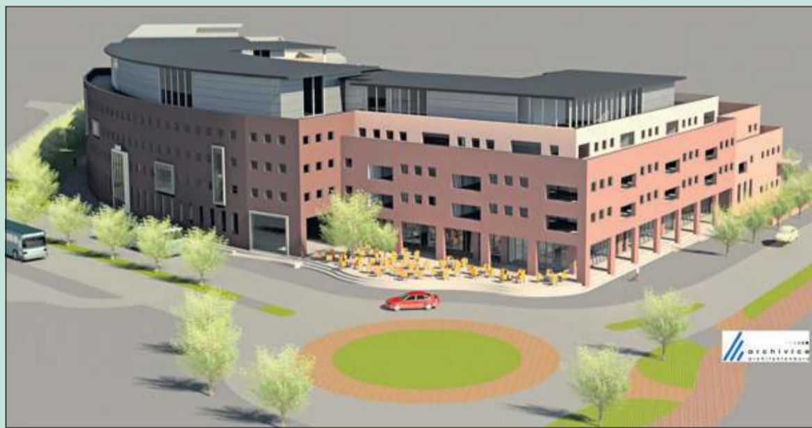
De bouwplannen aan de overkant van de Kwinkelier stuiten op nogal wat weerstand.

varen. Het is augustus 1666 en Nederland zit midden in een oorlog met Engeland. Tot nu toe werden de slagen op zee uitgevochten, maar op dat moment ligt de gehavende vloot van admiraal de Ruyter in Zeeland. Dus wat doen die Engelsen voor de Vlielandse kust? Er volgt een ramp van enorme omvang. Een vergeten ramp die nooit in onze schoolboeken terecht is gekomen.