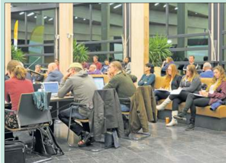
De raad begon met een goedgevulde publieke tribune.

Bij hamerslag worden de volgende agendapunten vastgesteld: de verklaring geen bezwaar financiële jaarstukken RHC Vecht en Venen, het bestemmingsplan Prinsenlaan 80 Groenekan, het voorbereidingsbesluit voor perceel Dorpsstraat 41-43 De Bilt, de Verordening jeugdhulp De Bilt 2015, het voorstel tot besluit Instellen commissie decentralisatie sociale domein en het verzamelvoorstel begrotingswijzigingen.