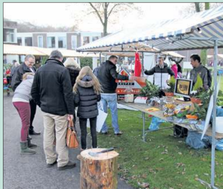
De feestweek van het jubilerende d' Amandelboom werd afgesloten met een drukbezochte winterfair.