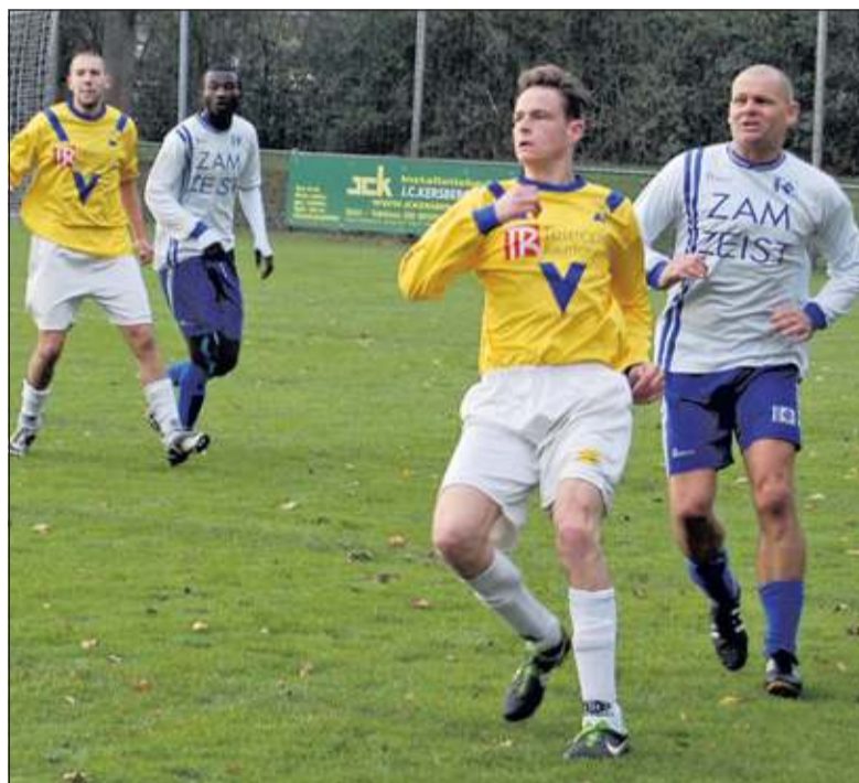
SVM was lekker op dreef in Zeist.