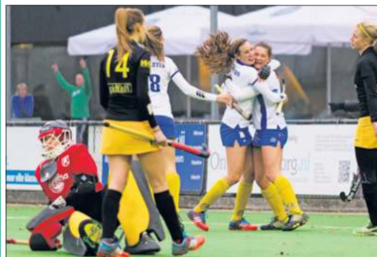
De dames van Voordaan wisten een mooie 2-0 stand op het scorebord te zetten.