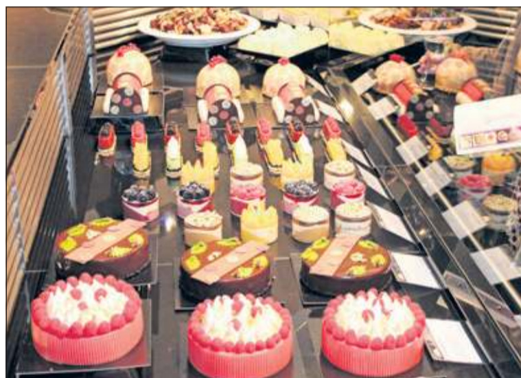
Desserts voor 6 - 8 personen maar ook in 1-persoons uitvoeringen.

Op vrijdag waren met name alle collega's en brancheleden welkom om een kijkje in de keuken te komen nemen bij Landwaart Culinaire en er ideeën op te doen voor de eigen winkel of suggesties te delen met de collega's. Op zaterdag was e.e.a. gecombineerd met de proeverij, welke ook andere winkels en bedrijven hadden georganiseerd aan het Maartensdijkse Maartensplein. Bestellingen bij Landwaart kunnen nog tot en met 20 december worden gedaan.