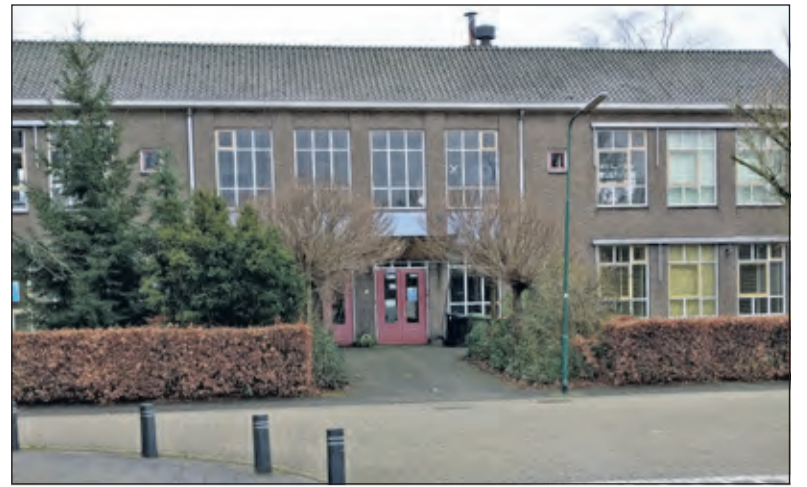
Nieuwe plannen voor het verlaten pand van De Werkschuit.

De Woonstichting SSW is de primaire partner bij sociale woningbouwontwikkelingen. In haar 'Bod 2020' geeft SSW aan dat zij op de locatie De Werkschuit graag gebruik maakt van de mogelijkheden om sociale en midden-huurwoningen te realiseren. Het College heeft SSW gevraagd om binnen een termijn van zes maanden een haalbaarheidsonderzoek en een bod voor deze locatie uit te brengen. Daarnaast gebruikt het College deze tijd om de sloop van de huidige bebouwing voor te bereiden.