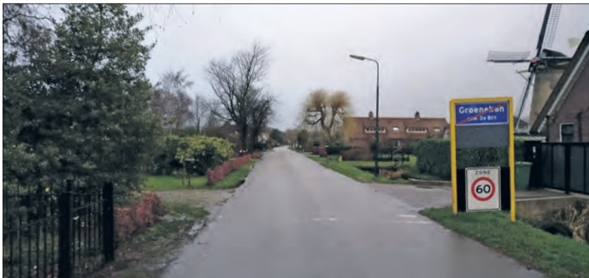
De Ruigenhoeksedijk te Groenekan wordt een 30 kilometer zone.

Het nieuwe beleid gaat gelden voor de nieuwe aanvragen. De bestaande, op kenteken uitgegeven ontheffingen, blijven geldig totdat ze zijn verlopen. Overigens blijft Westbroek ook voor niet-onthef-