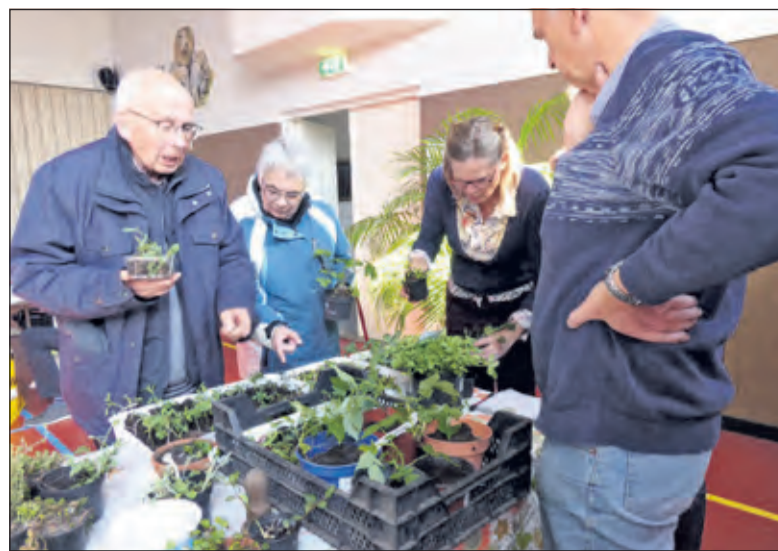
Tijdens het Repair Café in Westbroek wisselen groen, zaai en stekjes van eigenaar.

Emmaus Bilthoven organiseert de eerste themamarkt. De groepen 7 van de basisscholen legden het praktische verkeersexamen af onder een strakblauwe lucht. Het debatteam van de Werkplaats Kindergemeenschap wint het International Debate Tournament. Het programma van Koningsdag 2019 wordt gepresenteerd. Omwonenden van de Ruigenhoekse dijk maken hun verontrusting over de verkeersoverlast op de dijk kenbaar met 200 handtekeningen die