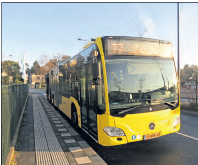
Buslijn 77 met een lange bus bij station Bilthoven.