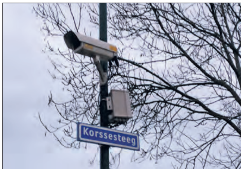
Bij de Korssesteeg in Westbroek moet camerahandhaving het sluipverkeer tegen gaan.

ving-houders steeds bereikbaar via de Burg. Huydecoperweg en Kerkdijk. Zodra het College voor de camerahandhaving toestemming heeft wordt het nieuwe beleid ingevoerd. [HvdB]