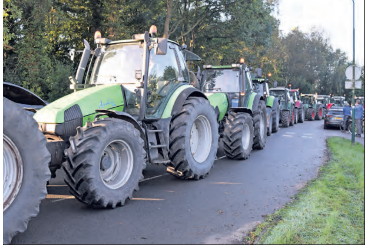
Op de Biltse Rading staan 2.500 trekkers opgesteld.

Buurtbemiddeling De Bilt viert tienjarig bestaan. De Vierklank verschijnt met een Duurzaamheidsbijlage. Leo Fijen vertelt en leest voor tijdens de Voorleeskoffie in Schutsmantel. Ouderen in de gemeente konden op de Nationale Dag van de Ouderen pannenkoe-