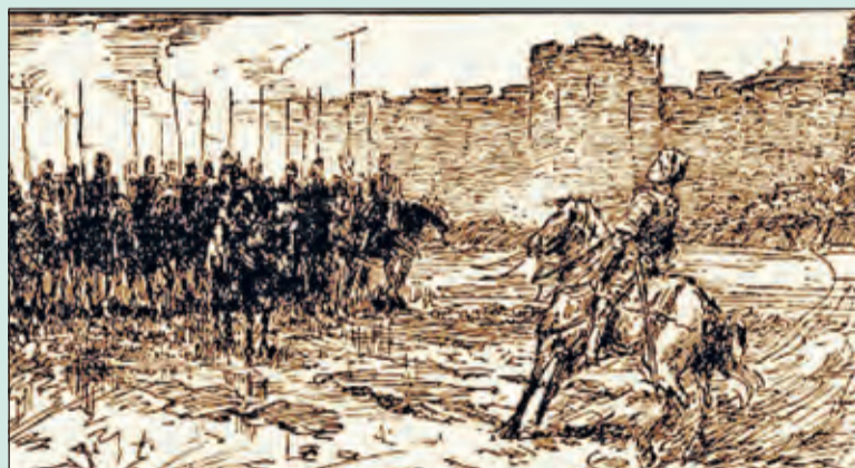
Prent in Oltmans' boek 'De Schaapherder'; getoond wordt de troep die Westbroek aanviel onder de muren van Utrecht.

Om te horen hoe dit verhaal verder gaat is men van harte welkom op dinsdag 7 januari van 14.30u tot 16.30u. in Het Dorpshuis van Westbroek, Prinses Christinastraat 2 bij Westbroek Ontmoet. De kosten bedragen 3,50 euro, inclusief koffie of thee. Wanneer men wél wil komen, maar niet weet hoe, kan vervoer worden geregeld via de familie Kalisvaart (tel: 0346 281181). Ook wanneer men niet in Westbroek woont, is men van harte welkom.