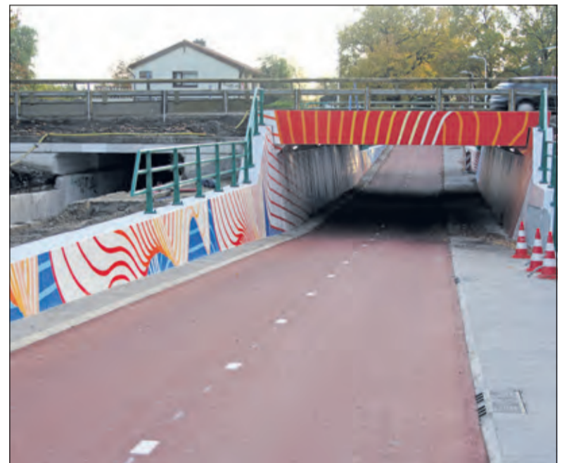
De fietstunnel onder de Utrechtseweg in De Bilt.

en 10 december kleurde Jagtlust oranje om aandacht te geven aan de internationale campagne tegen geweld tegen vrouwen. In WVT vond de expositie 'Kunst uit eigen provincie' plaats. Op 21 december nam wethouder Anne Brommers-