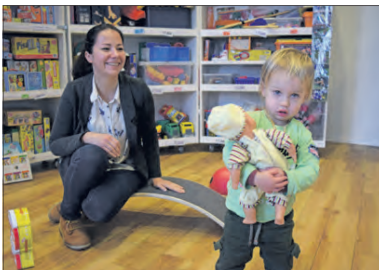
Veel speelgoed in de Speel-o-theek De Bilt.