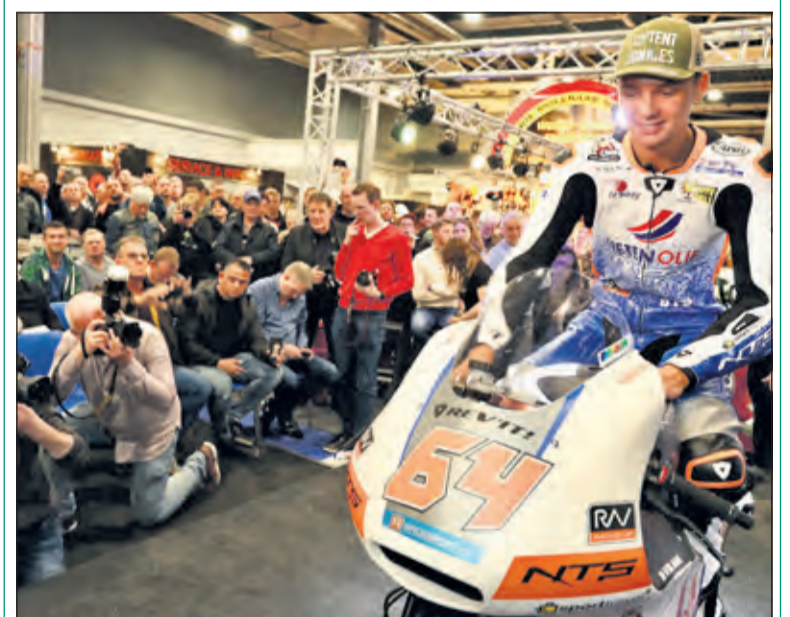
Een van de vele nieuwe motor modellen met een motorrijder erop. Deze wordt gefotografeerd door de pers en bekeken door omstanders

Om hiervoor in aanmerking te komen stuurt u een mail naar info@vierklank.nl met in het onderwerp Motorbeurs. De kaarten worden onder de lezers verloot. Iedereen krijgt bericht.