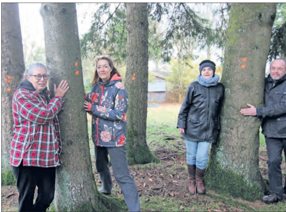
Vier bewoners van het park bij vier van de veel meer bedreigde bomen.

jectontwikkelaars toepassen is kappen onder het mom van achterstallig onderhoud. Na 10 jaar eerst ons mooie park te hebben laten verloederen en er geen enkele vorm van onderhoud te plegen vinden wij het ongeloofwaardig, dat het nu ineens wél om onderhoud zou gaan en wilden wij Topparken - die bezig is een groener imago op te bouwen - wederom oproepen te wachten met de bomenkap tot de bestemmingsplanwijziging afgerond is en tot duidelijk is wat het uiteindelijke inrichtingsplan überhaupt wordt. Vooral ook omdat de voorbarige kap ongetwijfeld ook bedoeld is om de laatste huisjeseigenaren van het park te krijgen. Van een van overheidswege opgelegde her-plant-plicht na de rigoureuze kap is daarbij geen sprake, terwijl er nog zoveel onduidelijk is over de toekomst van het park'.