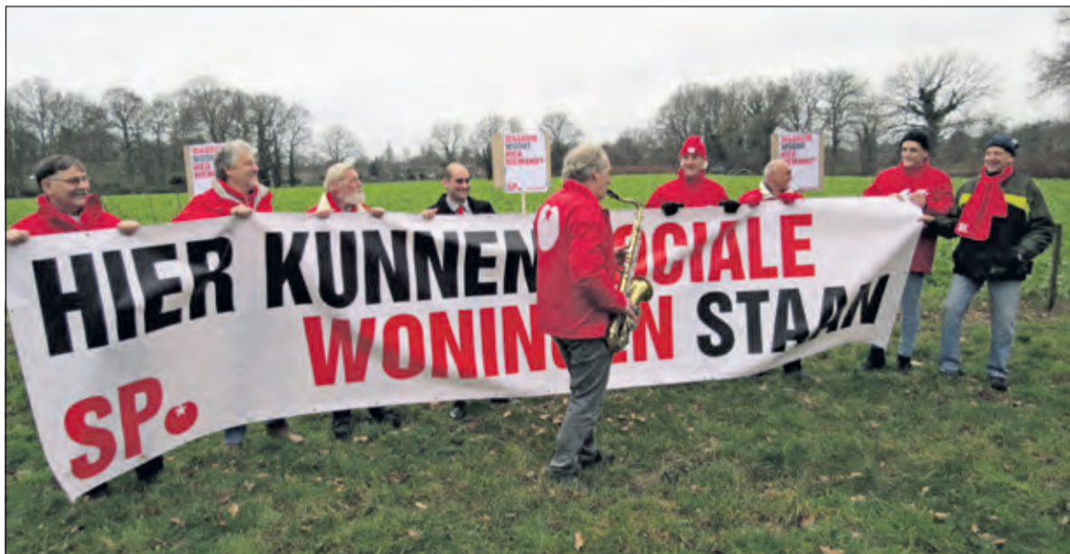
Het spandoek geeft aan wat de SP met de Schapenweide wil.

De vijftiendste jaargang van De Vierklank deed in 2019 verslag van heel veel gebeurtenissen uit de regio op velerlei gebied. Elke woensdag zorgen trouwe bezorgers dat de 'groene' krant aan huis wordt bezorgd. Een samenvatting van die enorme hoeveelheid nieuwsfeiten uit eigen omgeving laat natuurlijk heel veel liggen, maar geeft wel een indruk van dit jubileumjaar.