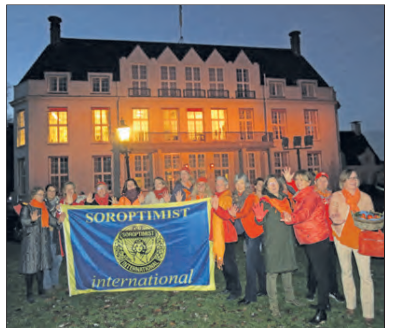
Jagtlust kleurt oranje vanwege de internationale campagne tegen geweld tegen vrouwen.

ma de eerste Slimme Bandenpomp in de gemeente in gebruik. Aan de Henrica van Erpweg in De Bilt werd een winterfeest gehouden als start van een periode waarin buurtbewoners de samenhang in de buurt verder gaan versterken. De Julianaschool neemt feestelijk een voedselbosje in gebruik.