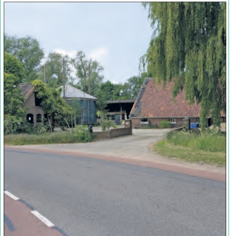
Locatie Kerkdijk 176 in Westbroek is financieel niet haalbaar als locatie voor brandweerpost Westbroek - Tienhoven. [foto Henk van de Bunt]

Nu zal onderzocht worden of de huidige brandweerpost Westbroek kan worden omgebouwd tot nieuwe hoofdvestiging voor Tienhoven - Westbroek. Omdat deze locatie zich niet centraal in het dekkingsgebied bevindt is een nevenlocatie in Tienhoven nodig. Om zo spoedig mogelijk te voldoen aan de eisen van de Arbowetgeving zal voor de brandweerpost Westbroek per februari 2020 uitgeweken worden naar een tijdelijke locatie aan de Dr. Welfferweg in Westbroek. [HvdB]