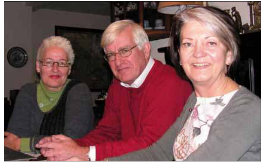
Drie vrijwilligers die zich samen met hun andere collega dorpsraadleden inzetten voor Groenekan.

Het steeds intenser wordende verkeer blijft de grootste zorg van de dorpsraad. De Groenekansweg en de Kon. Wilhelminaweg hebben zich ontwikkeld tot een steeds drukker wordende sluiptrouwe. De dorpsraad ziet dit als een aantasting van het recht om te wonen langs die wegen. Siegerink: 'Wij komen op voor de belangen van de inwoners van Groenekan. Natuurlijk willen we de problemen die het toenemende verkeer met zich meebrengt niet bij anderen over de schutting gooien. We proberen samen met de andere partijen zoals gemeente, provincie en Rijkswaterstaat tot een op-