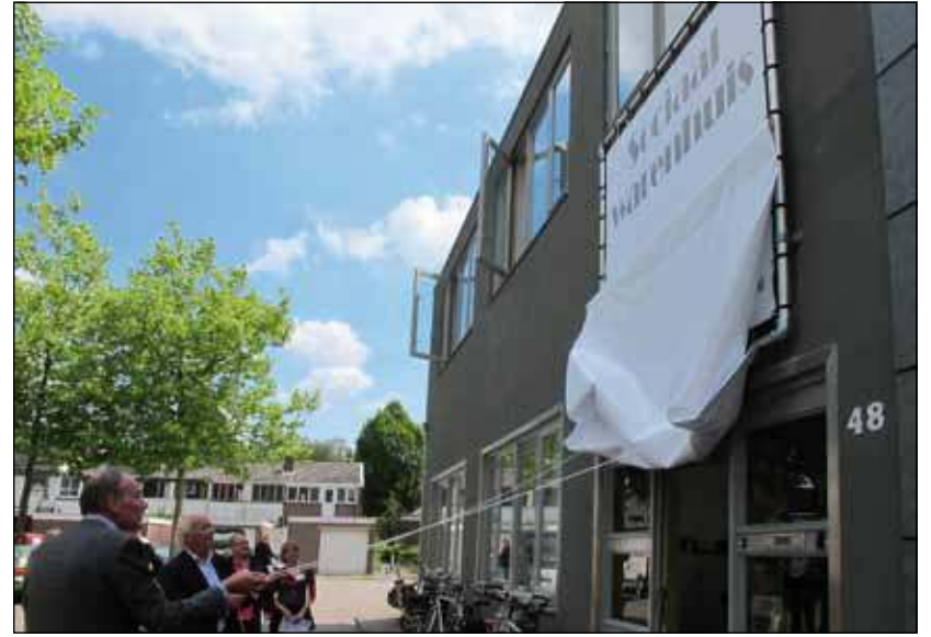
Voedselbank De Bilt is gevestigd in het Sociaal Warenhuis aan de Molenkamp 48 in De Bilt, dat op 9 juni 2011 werd geopend.

Curves De Bilt hecht veel belang aan het werk van de voedselbank. In 2011 kon ruim tweehonderd kilo voedsel aan de Voedselbank Zeist worden overhandigd. Het fitnesscentrum doet ook dit jaar een beroep op alle Biltse vrouwen om mee te doen aan de Curves Voedselactie. “De hele maand maart stimuleren we leden om voedsel te doneren, maar ook niet-leden kunnen etenswaren bij de club langsbrengen”, zegt Margreet Vrieze van Curves De Bilt. “Wie tussen 1 en 16 maart lid wordt, betaalt geen begeleidingskosten als zij een tas met niet-bederfelijke levensmiddelen do-