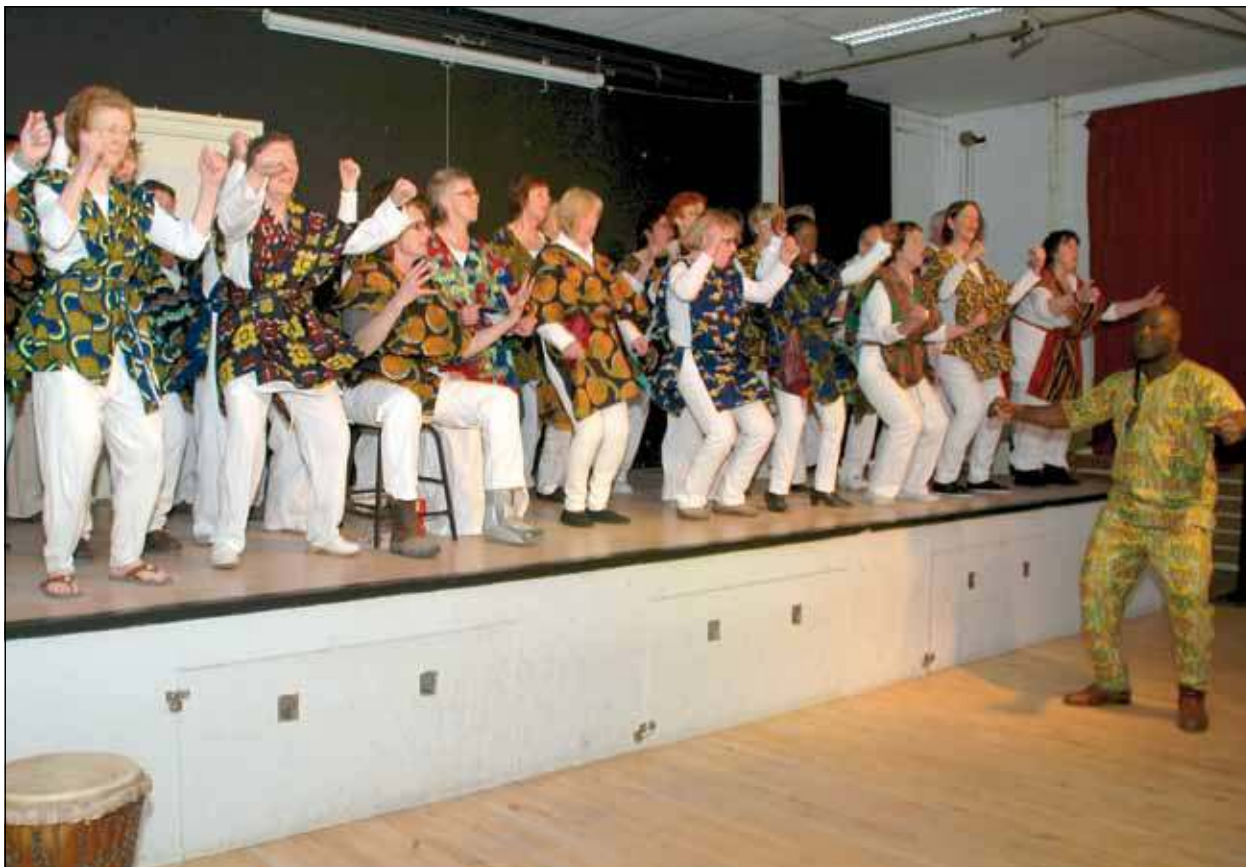
Het 'Jambo Afrikakoor' tijdens een generale repetitie.