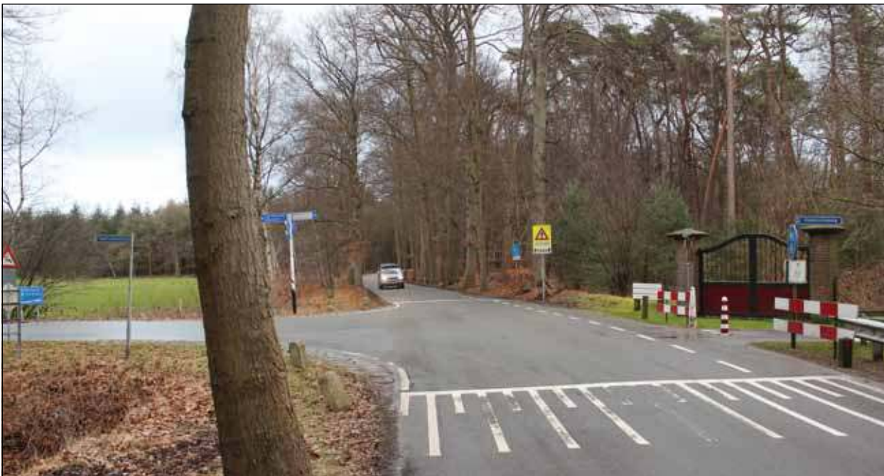
Op de T-splitsing met de Vuurse Steeg begint de Embranchementsweg, welke in oostelijke richting naar de N234 loopt.

Embranchementweg deze zomer zal worden aangepakt. Het onderzoek en het werk zal worden uitgevoerd door de gemeente Zeist dat vervolgens een rekening voor het Baarnse deel van de weg zal declareren. Dat mag vreemd klinken maar dat komt doordat de weg van 1240 meter lang onder drie gemeenten valt. De weg die al vanaf 1300 dezelfde naam draagt ligt 930 meter op grond van Zeist, 220 meter op grond van Baarn en 90 meter op grond van De Bilt. En de Franse naam van de weg betekent: 'Uitmonding van een weg die op een andere weg uitkomt.'