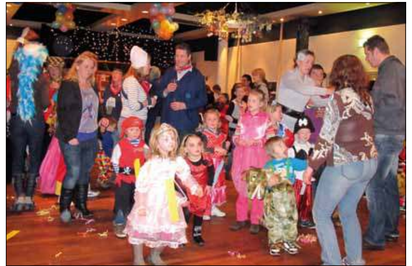
De prachtige verklede kinderen en hun ouders hadden het geweldig naar hun zin op het Kindercarnaval bij de Weergodden in De Bilt.