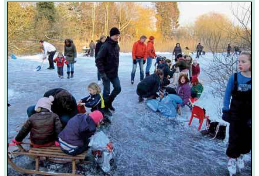
Bewoners van Tuindorp Brandenburg hopen de natuur aan de Talinglaan te behouden, en nog vele jaren van de eigen sport- en schaatsvijver te kunnen genieten.

In de afgelopen tijd hebben bewoners van Tuindorp Brandenburg in grote getale kunnen schaatsen op de vijver aan de Talinglaan. Dankzij de inzet van buurtbewoners en de WVT lag er een sneeuwrijke en gladde ondergrond. Jong en oud (onder meer grootouders die zelf op deze plek hebben leren schaatsen, kleinkinderen die nu de eerste pasjes leerden) deelden in het plezier. De WVT zorgde voor koek en zopie, verlichting 's avonds en muziek.