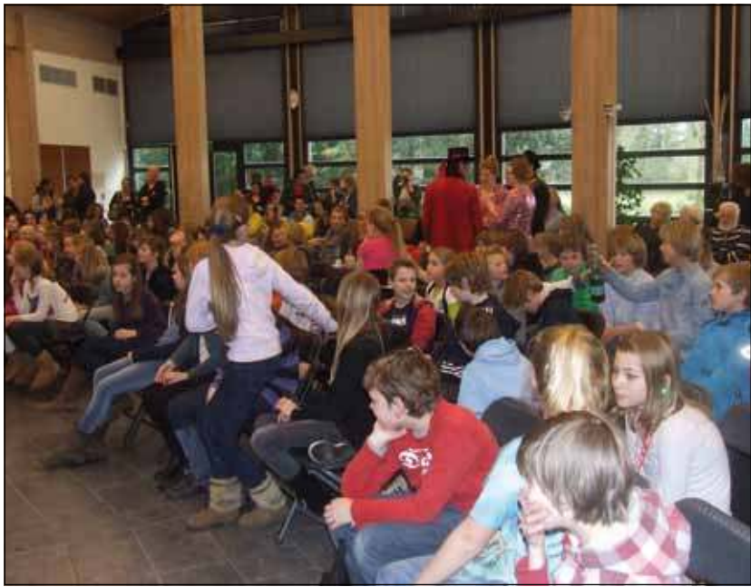
In spanning wachten op de prijsuitreiking.