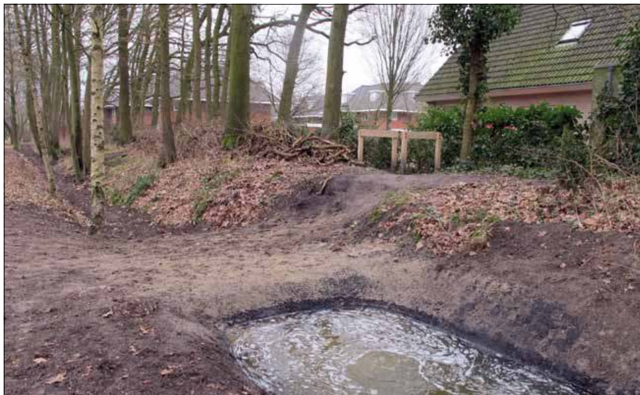
Het grondwater van Huize Het Oosten komt ter hoogte van de Apollolaan bovengronds en wordt afgevoerd via sloten in en langs de rand van het Leijense bos.

Dat er graafwerkzaamheden plaats vonden langs de Dwarsweg aan de kant van het Leijense bos in Bilthoven, was voorbijgangers al opgevallen. Ondiepe sloten werden uitgediept, holle buizen werden geplaatst waar wegen en wandelpaden de sloten kruisten. Op donderdag 16 februari werd gelig water in deze sloten gepompt in het gedeelte tegenover de Kees Boekeschool, langs de toerit naar manege de Paddock en nog een stuk verder langs de Dwarsweg.