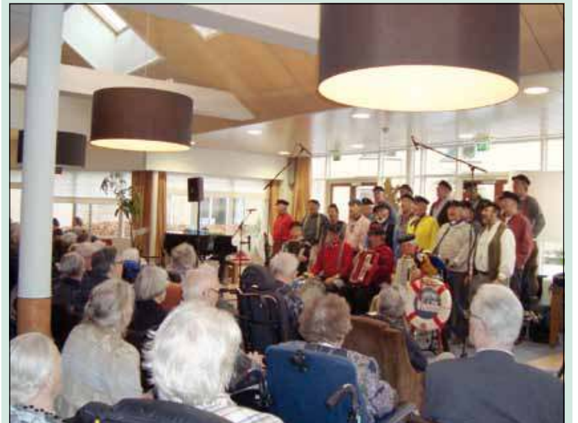
Maandag 13 februari was er een spetterend optreden van het Shantychoor Windstilte in De Biltse Hof. 3 locaties genoten van dit optreden: De Biltse Hof, de Rinnebeek en Weltevreden zorgden voor een hele volle zaal waar de sfeer goed in zat. Er werd driftig mee gezongen en gedeind op de zeemannsliederen. (Monique v Mansum)