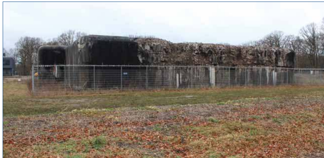
Het bunker-kavel is weer vrij voor een nieuwe gegadigde.

Omdat het een eigen afweging is voor de bedrijven of zij belangstelling hebben voor een kavel op Larenstein, maakt de gemeente in dit stadium geen namen bekend van bedrijven waarmee zij in gesprek is.