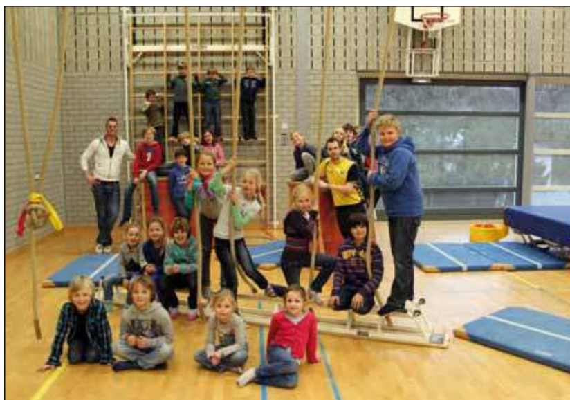
Dinsdag 14 februari jl. was het weer gezellig druk in de prachtige gymzaal van de Julianaschool in Bilthoven.