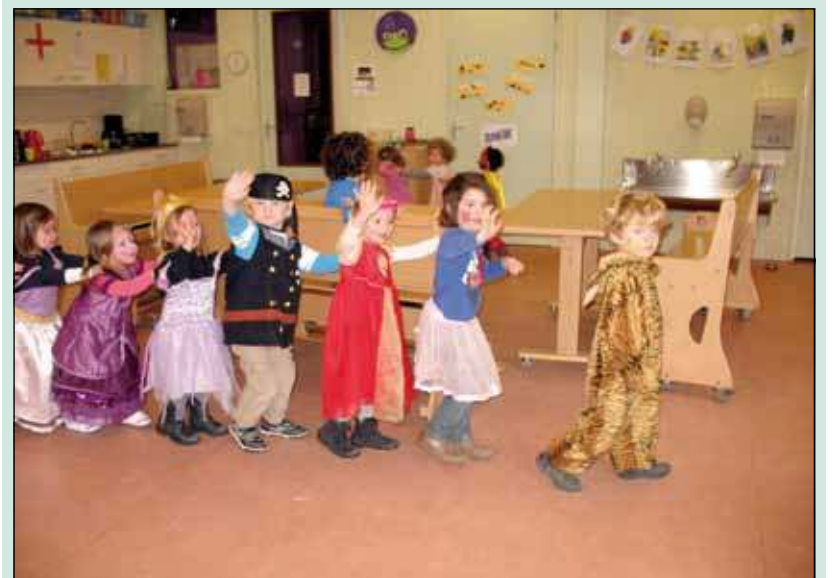
Polonaise op de peuterspeelzaal.