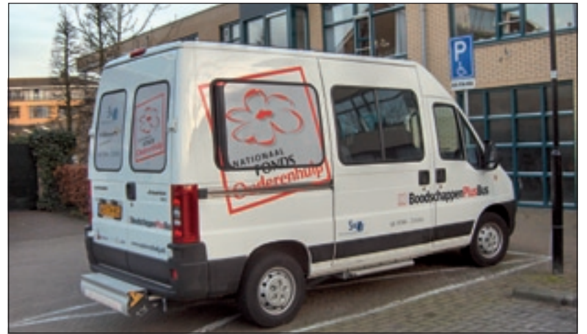
De BoodschappenPlusBus rijdt al driekwart jaar in deze gemeente en wil meer 'klanten' uit de Maartensdijkse kernen.