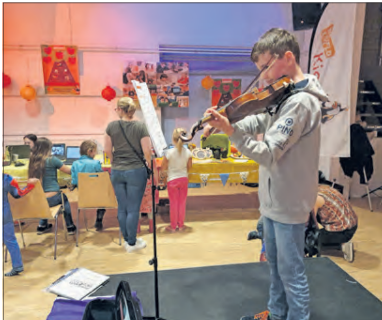
Met vioolspelen werd geld opgehaald voor het KWF.

Naast de rommel- en curiosamarkt organiseerde De Vierstee 2.0 een activiteitenmarkt. 'In het midden van de zaal staat een groot podium. Iedereen mag hiervan gebruik maken', legt Plug uit. 'Als je iets te vertellen hebt, moppen wilt tappen, een liedje wil zingen, spring op het podium en doe je ding'. Hiervan maakte menigeen gebruik, zoals een vioolspelertje die geld ophaalde voor het KWF. Aan het eind van de middag vond de Maartensdijkse borrel plaats. En het bleef nog lang gezellig in en rond De Vierstee.