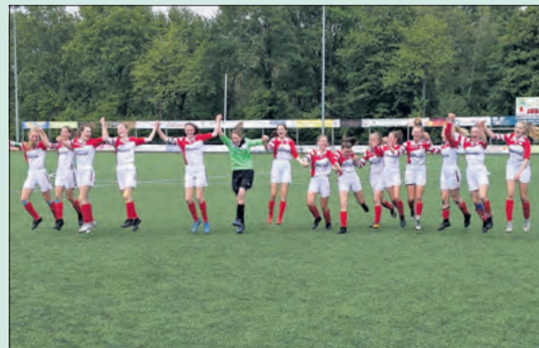
Grote bleidschap bij de meiden van FC De Bilt.