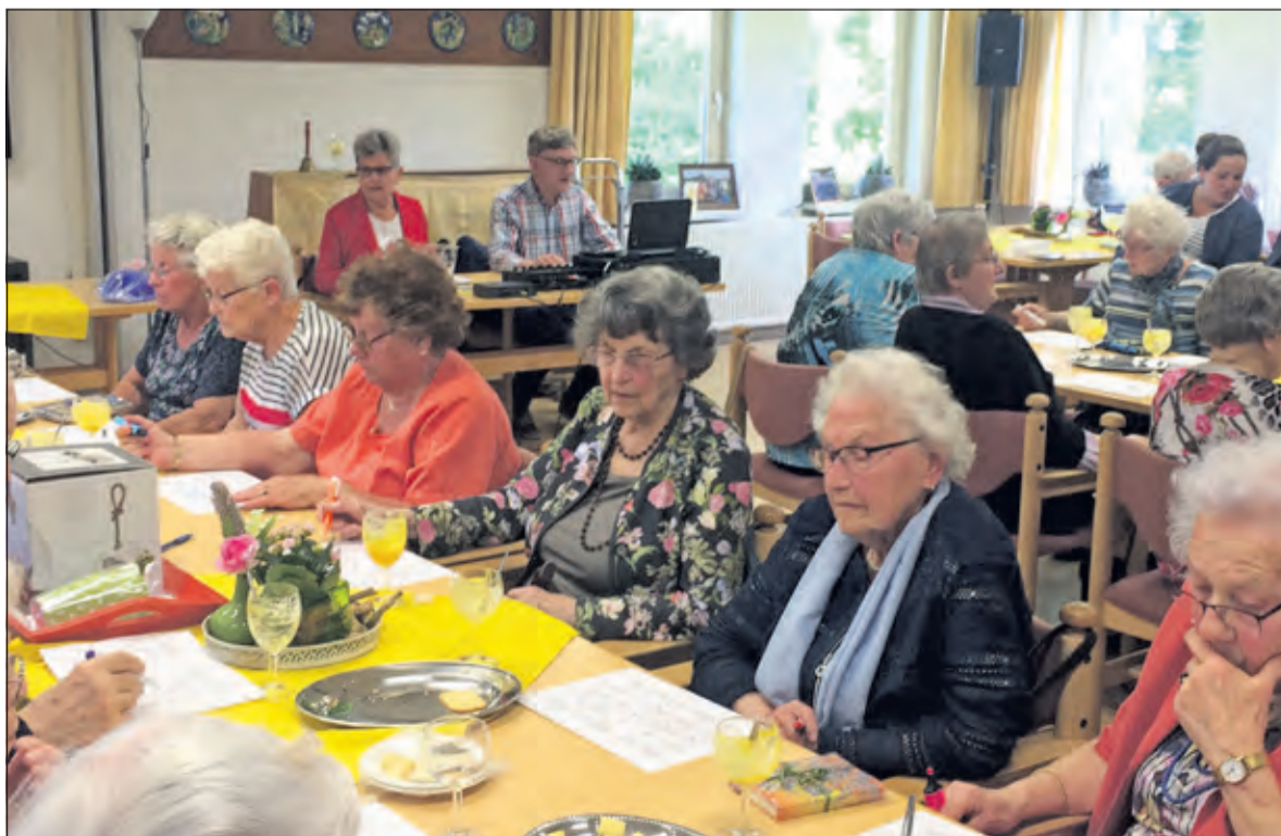
Top sfeertje tijdens de muziekbingo van de Zonnebloem.