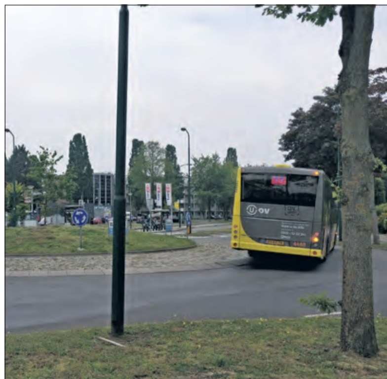
Ook buslijn 77 gaat een alternatieve route rijden en zal dan tijdelijk niet rechtsaf gaan.