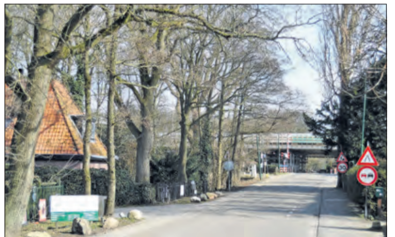
Hier blikken we naar het oosten, waar de grens de spoorlijn en het viaduct van de A27 kruist. Tegenwoordig Egelshoek genoemd.

Aansluitend volgde de bekeruitreiking, een rit door het dorp op de platte kar.