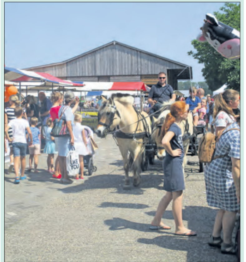
De lentemarkt wordt ieder jaar druk bezocht.

Op de Lentemarkt presenteren zich diverse (landelijke) bedrijven uit de wijde omtrek met een veelheid aan producten, van allerlei biologische en fairtrade producten tot tuinmachines en home accessoires. Daarnaast is er weer genoeg te zien en te doen op de Lentemarkt: pasgeboren kuikentjes en lammetjes, een ritje op een pony, leuke kramen en uitgebreide catering. Dit jaar demonstreert de brandweer van Maartensdijk hun nieuwe blusvoertuig en mogen kinderen de proef op de som nemen. Vanaf 14.00 uur worden de schapen geschoren.