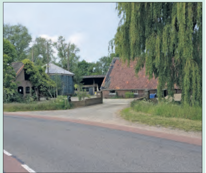
De colleges van B&W van gemeenten De Bilt en Stichtse Vecht hebben op 14 mei 2019 hun voorkeur uitgesproken voor de locatie Kerkdijk 176 te Westbroek als brandweerpost.

Over een nieuwe gefuseerde brandweerpost voor Westbroek en Tienhoven vond op 6 december 2018 een raadsavond plaats voor de gezamenlijke (gemeente-)raden van de gemeenten De Bilt en Stichtse Vecht. Daarbij is een locatie van Natuurmonumenten, in het gebied nabij de Nedereindse Vaardijk in Westbroek en de Heuvellaan in Oud Maarsseveen, gepresenteerd als voorkeurslocatie.