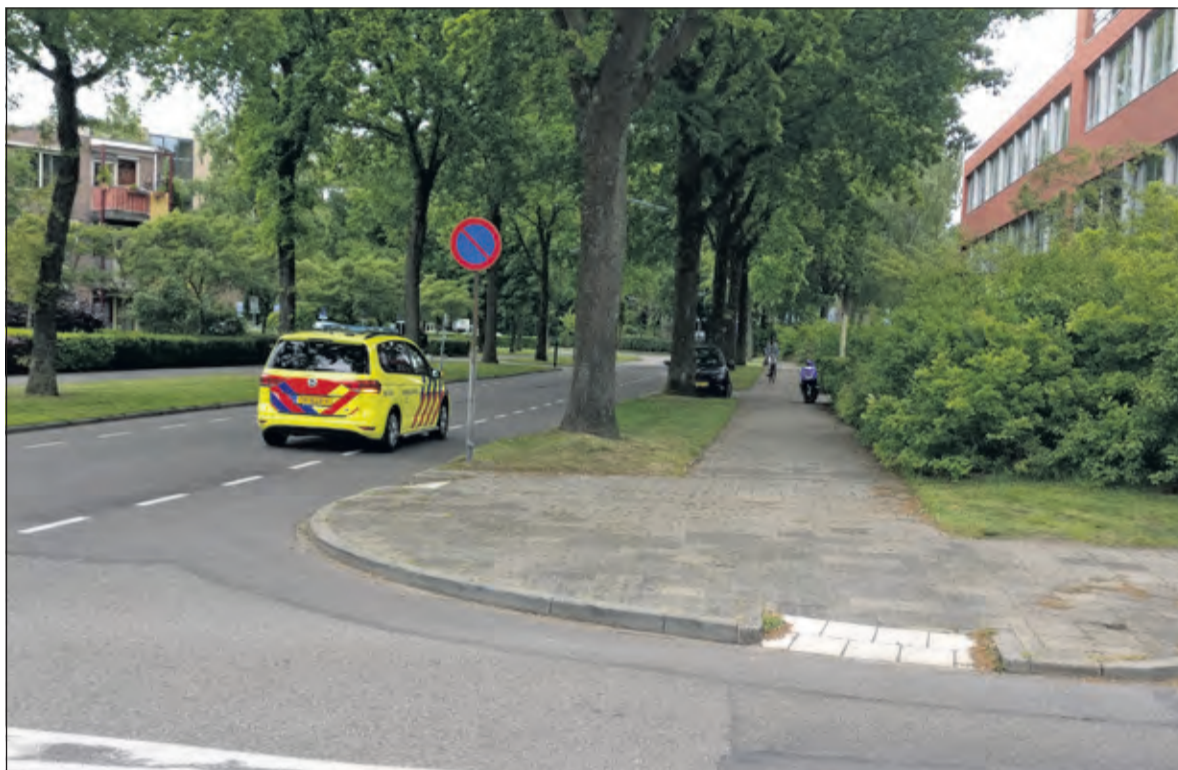
Hoek Massijslaan-Jan van Eijklaan met de Rogier van der Weydenlaan: 'De ambulance kan in ieder geval weer rechtdoor'.

de beperkende maatregelen te wensen over laten, er staan veel te weinig 30km borden en 30km aanduidingen op de weg. Bewoners vrezen de komst van vrachtwagens en bussen in het drukke straatbeeld, die rijden er nu nog niet in verband met de gedeeltelijke afsluiting. Omdat de werkzaamheden van Stedin in de Rembrandtlaan nog niet zijn afgerond, is de Jan Steenlaan nog niet per