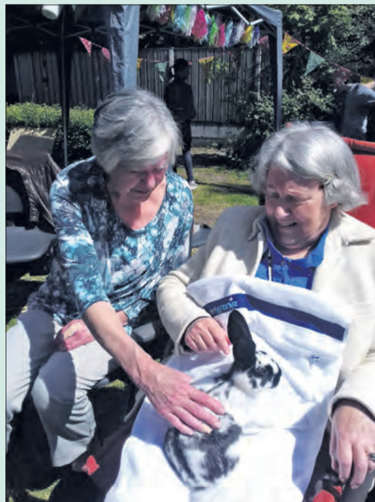
Dierenknuffelmiddag bij Ontmoetingscentrum Rinnebeek.

Ontmoetingscentrum Rinnebeek ondersteunt ouderen met dementie of andere beperkingen en hun mantelzorgers. Elke vrijdagmiddag kunnen buurtgenoten elkaar ontmoeten in het Ontmoetingscentrum Rinnebeek aan de Sint Laurensse 11 in De Bilt en genieten van gratis koffie met iets lekkers. Bezoekers zijn vanaf 14.30 uur van harte welkom