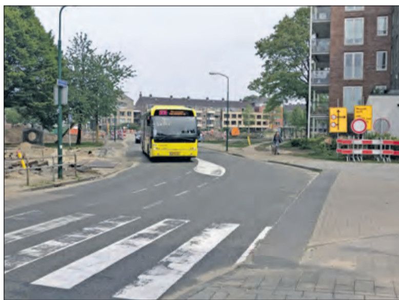
Vanaf eind september rijdt de bus hier weer.

vierenlaan richting de fietstunnel naar De Leijen. Voor voetgangers wordt een tijdelijk voetpad aangelegd langs Lugtensteijn.