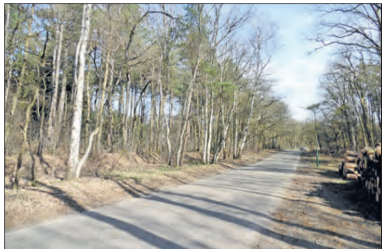
De grens loopt vervolgens een kilometer langs de Vuurse Dreef om dan naar het noordoosten af te buigen.