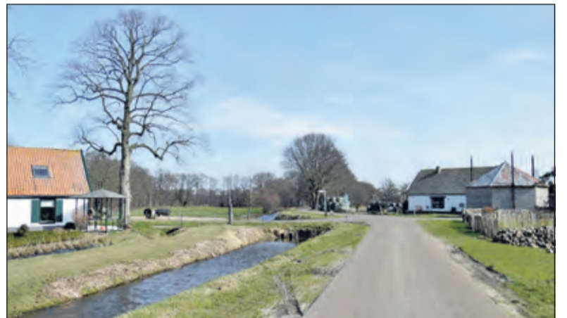
De grens loopt over de Floris V weg naar het oosten, richting Hollandse Rading. Daar volgt de grens de abrupte overgang van het veenweidegebied naar bos.