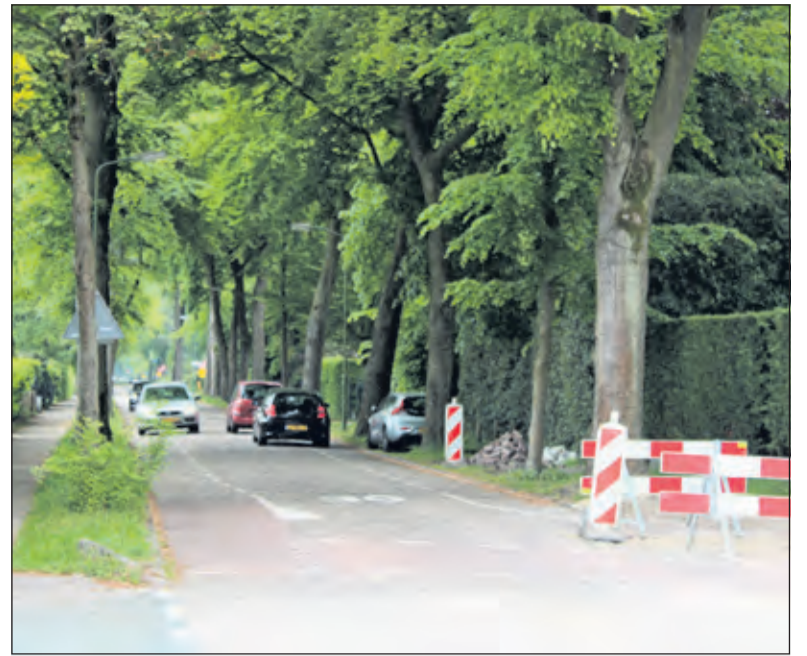
Zaterdagmiddag was de Jan Steenlaan weer even vrijgegeven in twee rijrichtingen.