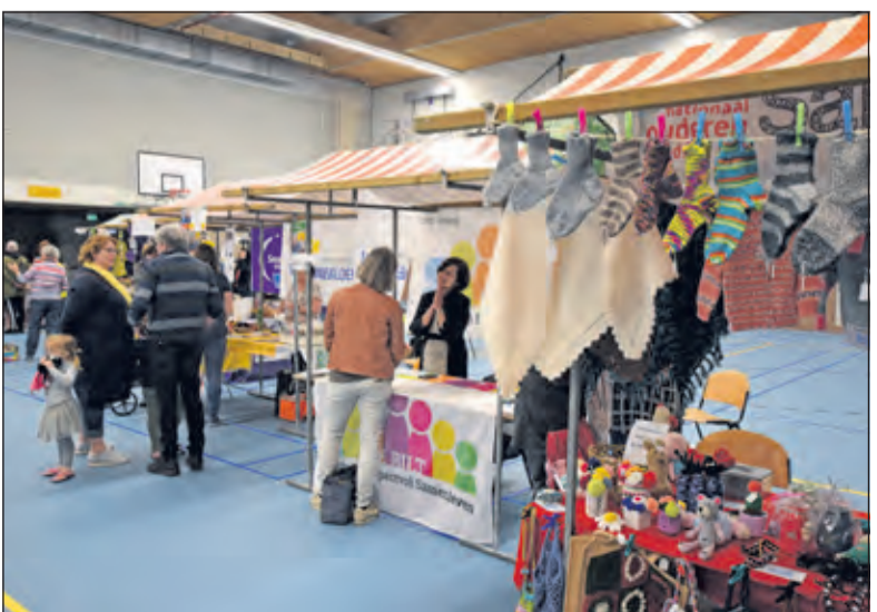
Maatschappelijke organisaties waren ook ruim vertegenwoordigd.