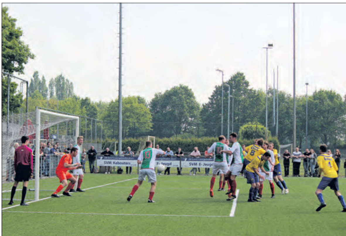
SVM mag een hoekschop nemen; is hier sprake van strafbaar hands?

waren na het laatste fluitsignaal van scheidsrechter Junick tevreden met de uitslag. SVM houdt met 2 punten voorsprong op EDO de 2e plek en EDO pakte met dank aan kampioen Hercules een periodetitel. A.s. zaterdag gaat SVM voor de laatste wedstrijd op bezoek bij Elinkwijk en zal toch nog gewoon moeten winnen om als 2e te eindigen in de competitie.