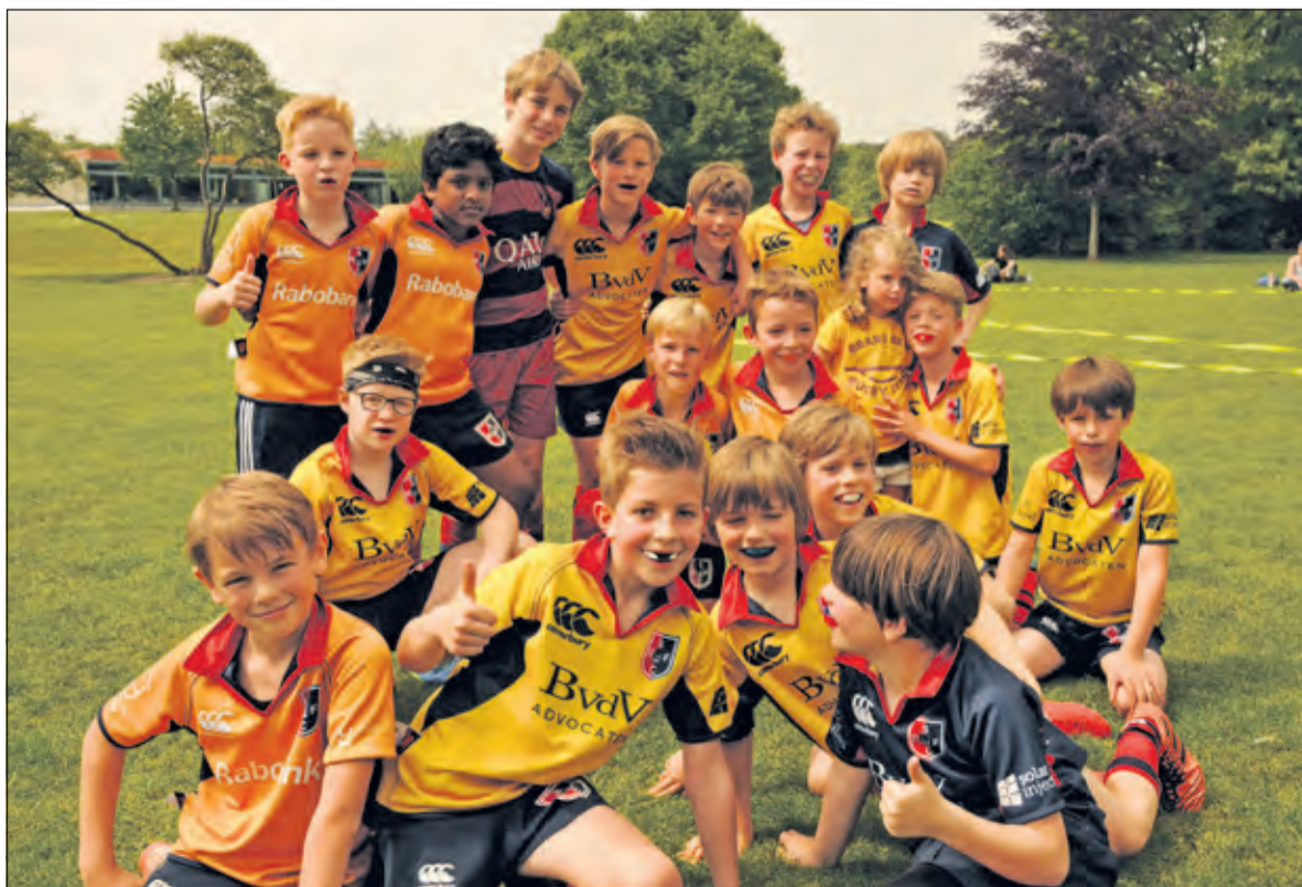
SRFC U10 teams trots op tweede en derde plek op eigen rugbytoernooi.