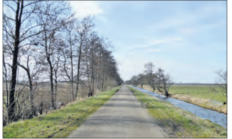
De grens volgt de Kanaaldijk tot deze enkele honderden meters verderop afbuigt naar het zuidwesten, evenwijdig aan het Bert Bospad.