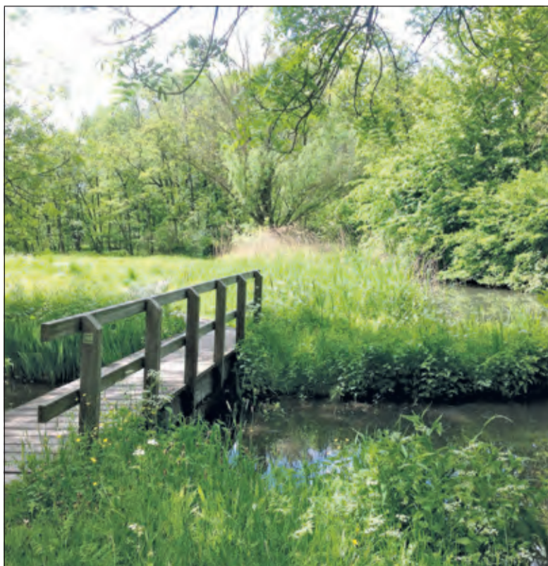
Bloeyendaal biedt een verrassend wandelgebied met inheemse bomen en een zich nog steeds verder ontwikkelende flora en fauna.

De start van de wandeling op zondag 26 mei is om 11.00 uur in het Paviljoen van de Stichting Bloeyendaal, Archimedeslaan 1 te Utrecht. Aanmelding niet nodig, deelname gratis. Info Jaap Milius, tel. 030 2288636.