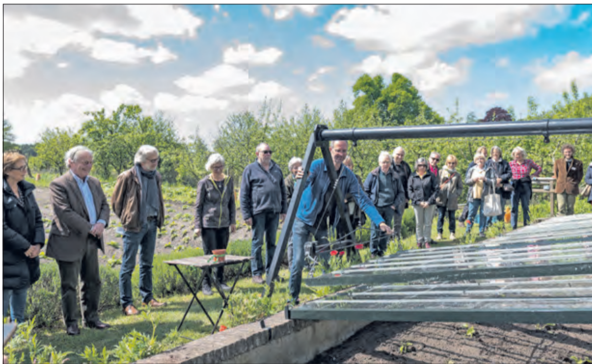
Een innovatief systeem maakt werken met een koude bak stukken eenvoudiger.