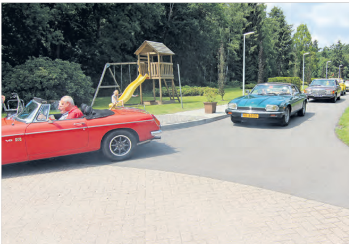
Een prachtig beeld in 2018: Oldtimers op weg naar Oldtimers.

eigenaren van mooie, leuk en /of bijzondere auto's zich te melden via christiaan@RallyTours.nl . Ook zijn er nog vrijwilligers nodig om alles in goede banen te leiden bij De Koperwiek te Bilthoven. Zij kunnen zich melden bij Judith Scheepstra via j.scheepstra@debilthuysen.nl .