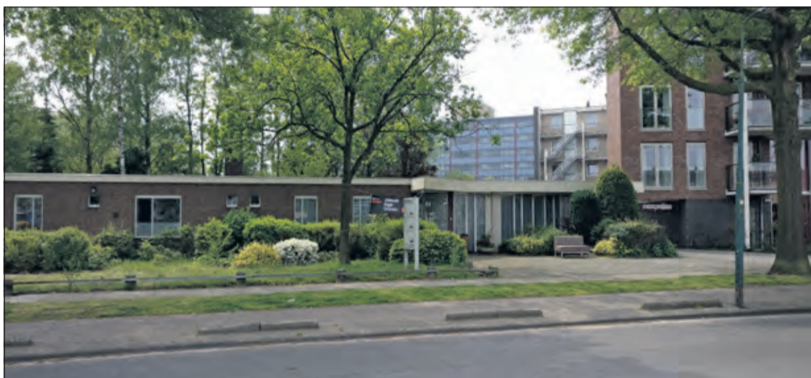
De eigenaar van het perceel Melkweg 3 (het perceel tussen appartementencomplex La Luna en de voetbalcourt in) wil op deze locatie appartementen realiseren. De gemeente staat positief in deze ontwikkeling. Een bestemmingsplanwijziging maakt onderdeel uit van het vervolgproces.

De ruimtes tussen deze blokken maken onderdeel uit van de bouwplaats. De aannemer heeft deze nodig voor opslag van bouwmaterialen en bouwketen. Vanwege onder meer veiligheid is het niet mogelijk en niet toegestaan om u tussen deze bouwblokken te bevinden. Dat betekent dat automobilisten, fietsers en voetgangers van de Melkweg naar de Weegschaal worden om-