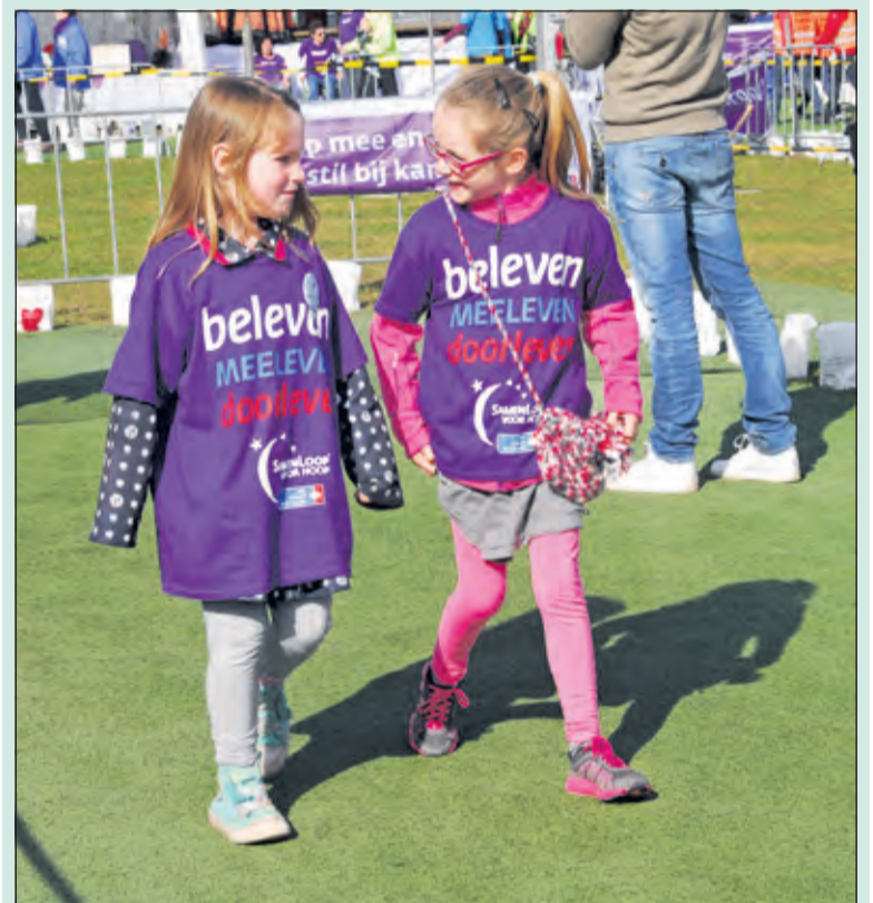
Kinderen in de basisschoolleeftijd krijgen aan de start een paars SamenLoop t-shirt.

Basisscholen uit de buurt die meedoen combineren de Kinderloop vaak met aandacht voor kanker in de klas. Het is de bedoeling dat kinderen die meelopen zich laten sponsoren door bijvoorbeeld opa's en oma's, ooms en tantes, burens en andere vrienden en bekenden. Ze kunnen ook klusjes doen zoals lege flessen inleveren, muziek maken, met hun sportteam geld ophalen enzovoort. Aan de overkant van het terrein voor gemeentehuis Jagtlust, worden tijdens het evenement allemaal leuke activiteiten georganiseerd voor kinderen in de basisschoolleeftijd: schminken, sport en spel, enz. Wil je ook mee doen met de kinderen uit de klas? Voor info debilt@samenloopvoorhoop.nl of meld je aan op www.samenloopvoorhoop.nl/debilt . (Dianne Westerink)