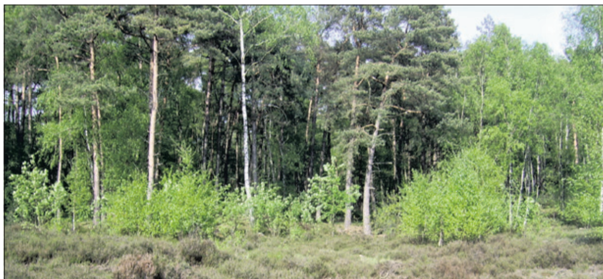
De boompjes op het heideveld zijn flink uitgelopen

www.naastdeburen.nl Groenekanseweg 168, Groenekan