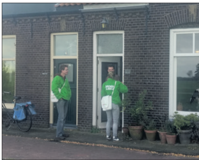
GroenLinks langs de weg in Groenekan.