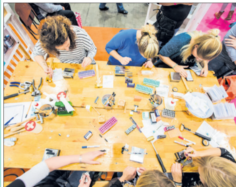
Tijdens KreaDoe doe je creatieve inspiratie op en zijn er tal van workshops te volgen.

Voor de lezers van De Vierklank is een aantal gratis toegangskarten beschikbaar. Om hiervoor in aanmerking te komen stuur je een mail naar info@vierklank.nl . Maandag 30 oktober ontvang je bericht of je tot een van de gelukkigen behoort.