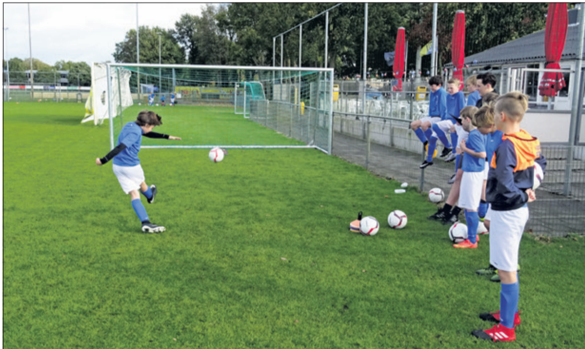
Er zijn veel uitdagende voetbalspellen tijdens het voetbalkamp. Doelschieten met een snelheidsmeter in doel om te meten hoe hard je kunt schieten is er een voorbeeld van.