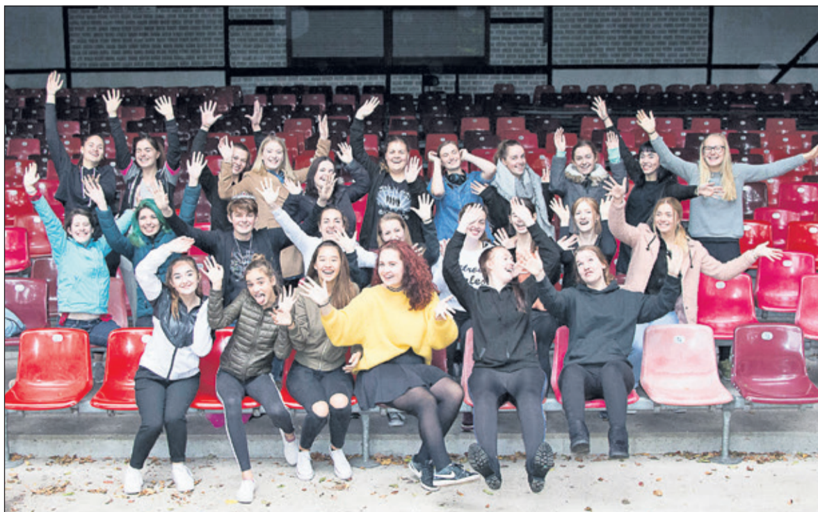
Theaterkinderen uit De Bilt en Coesfeld ontmoeten elkaar