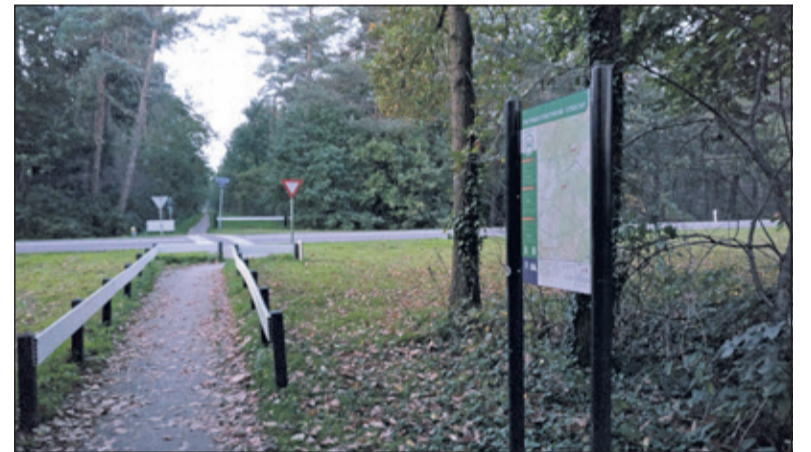
Het verzamelpunt is bij het bord Fietsrondennetwerk 94 t.o. de hoek van de Hercules Segherslaan en Gerard Doulaan.

De natuurwerkgroep van de KNNV regio Heuvelrug is al op dit terrein aan de slag gegaan, maar het is een flinke klus, dus extra hulp is altijd welkom. Het werk kan in kleine