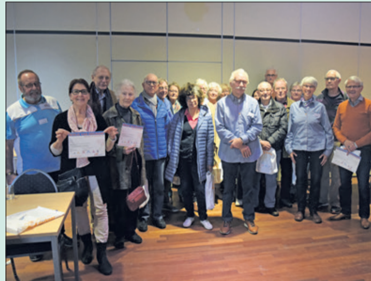
De eerste groep heeft de rijvaardigheidstest met glans doorstaan.

De bijscholing voor automobilisten 50+ werd dit najaar gehouden op maandag 23 oktober in het H.F. Witte Centrum in De Bilt. Ook nu was er zoveel belangstelling, dat er zowel 's ochtends als 's middags een volgeboekte sessie was. De volgende test is op 26 maart 2018 in Maartensdijk.