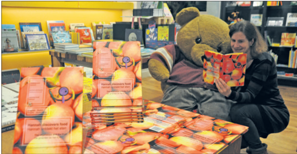
Hester de Geus bij Boekhandel Bouwman in de Bilt.

Hester de Geus heeft een aantal exemplaren gratis ter beschikking gesteld voor lezers van De Vierklank. Om in aanmerking te komen voor een exemplaar stuurt u een mailtje naar: info@vierklank.nl .