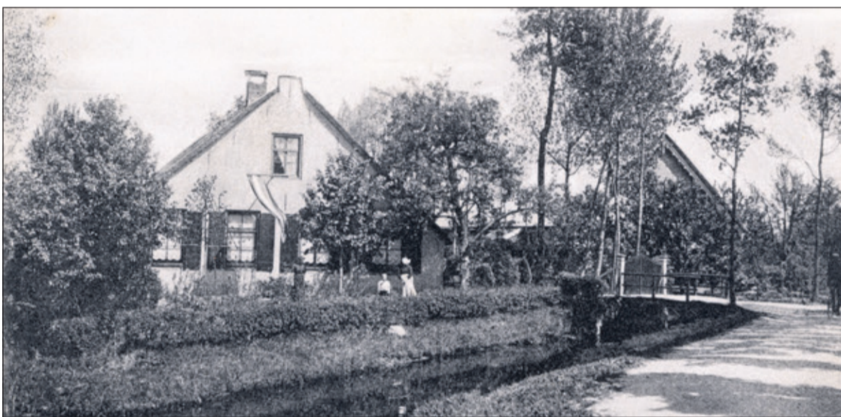
Dr. Wellferweg 27 verzendt de 'Groeten uit Achttienhoven'.

geschiedenis van De Bilt vormen: 'Deze gemeente is historisch gezien een willekeurige samenvoeging van kernen en gebieden die ieder hun eigen ontwikkeling en belang hadden. In dat verleden lagen de dorpen, die samen de geschiedenis van onze gemeente vormen, voor de inwoners te ver van elkaar om een gevoel van nauwe wederzijdse betrokkenheid te kunnen veronderstellen. Maartensdijk bijvoorbeeld lag volgens een plaatsbeschrijving uit