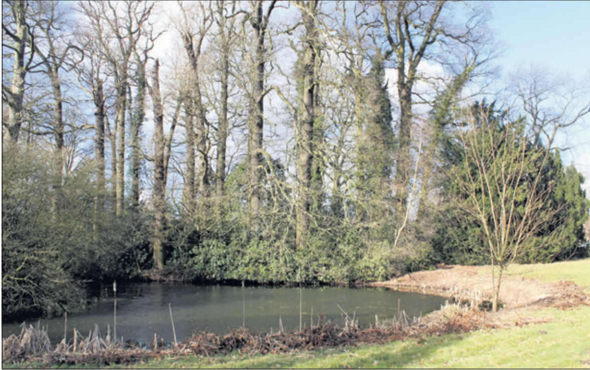
Op Sandwijck staan veel bijzondere boomsoorten, die goed aan hun silhouet zijn te herkennen.

Samen buiten aan de slag, dat kan op 4 november op de Natuurwerkdag. In 2017 organiseert LandschappenNL de Natuurwerkdag voor de 17de keer op bijna 500 locaties door heel Nederland. In De Bilt kan mee gewerkt worden op Sandwijck.