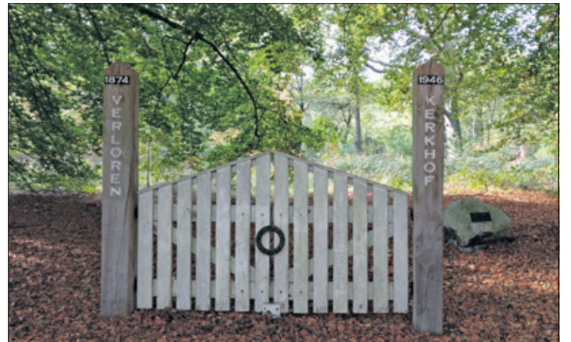
Het Verloren Kerkhof ligt aan de rand van Bilthoven, naast de parkeerplaats van Recreatieterrein De Leijen, aan de Eijckensteinselaan.