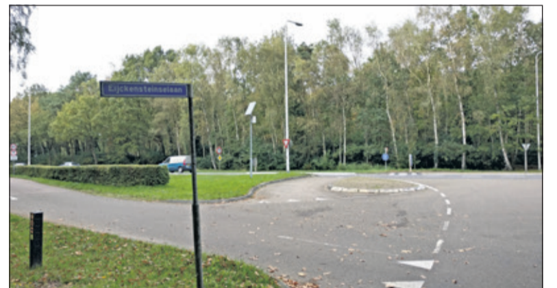
De Eijckensteinselaan is een zijweg van de Nieuwe Weteringseweg, de provinciale weg tussen Soest en Utrecht.

Samen aan de slag op de Natuurwerkdag. Geïnteresseerd om samen met burens, vrienden of familie buiten een dag aan de slag te gaan en zo bij te dragen aan jouw groene omgeving? Kijk dan op www.natuurwerkdag.nl voor meer informatie over locaties en activiteiten bij jou in de buurt en meld je aan. Zelf een werklocatie aanmelden is ook mogelijk.