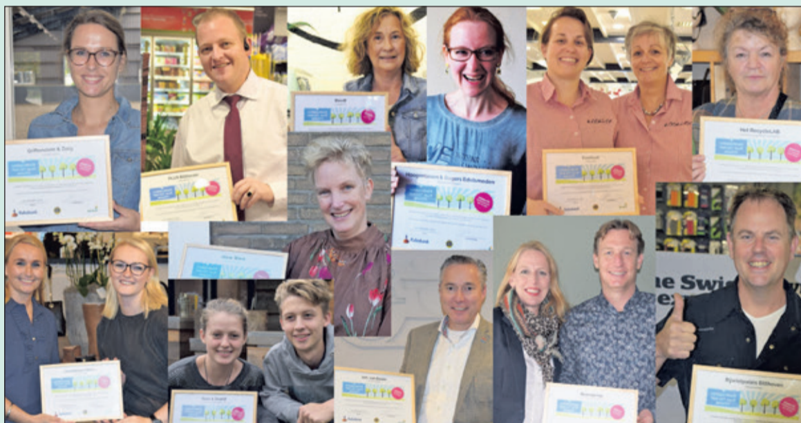
Alle 12 genomineerden in willekeurige volgorde.

Op 29 november 2017 vindt in de Mathildezaal van het gemeentehuis voor de 6de keer de uitreiking van de prijs De Biltse Ondernemer van het jaar plaats in vier categorieën. Dit twejaarlijkse evenement is een initiatief van de Lions Club De Bilt-Bilthoven en wordt georganiseerd samen met de gemeente De Bilt en Business Contact de Bilt (BCB).