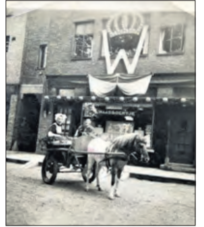
De foto met de ponywagen is waarschijnlijk van bij de bevrijding, gezien de versiering met de grote W. Het kan ook een 31e augustus zijn in 1948.