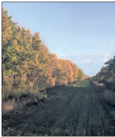
De oostzijde van het Prinsenlaantje, blik in de richting van Maartensdijk.

Mede op initiatie van de Stichting Behoud Prinsenlaantje en Ommelanden heeft het gebied rond 't Koningsbed en het gehele Prinsenlaantje, tot aan de bebouwde kom van Maartensdijk, de bestemming 'Natuur' gekregen.