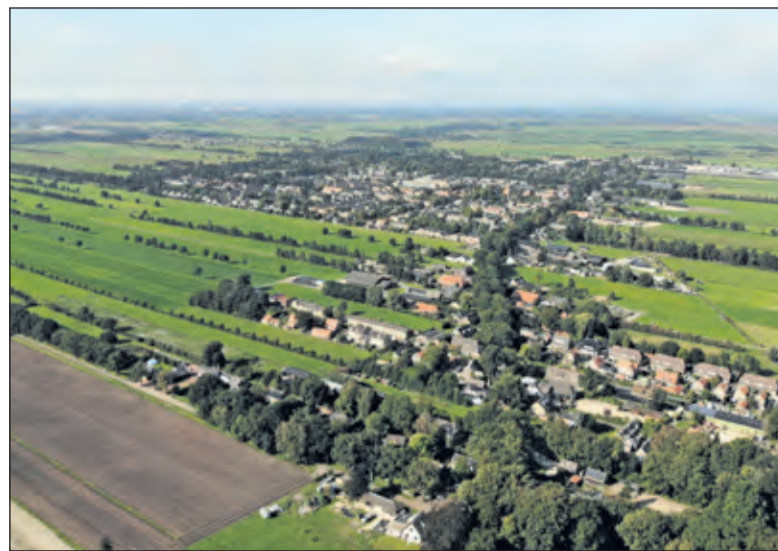
In het gedeelte tussen Bantamlaan en Julianalaan is het slagenlandschap goed te herkennen.

De Stichting Behoud Slagenlandschap Maartensdijk Oost: ‘De Provincie heeft een Ontwerp Omgevingsvisie en een Ontwerp (interim) Omgevingsverordening vastgesteld. Deze waren voor een ieder ter inzage en daarop kon iedereen reageren. De gemeente De Bilt heeft een zienswijze op deze stukken ingediend; in het stuk pleit de gemeente voor meer mogelijkheden om te bouwen buiten de rode contouren en de mogelijkheid van forse nieuwbouw rond Maartensdijk. Via onze advocaten hebben wij eveneens een zienswijze