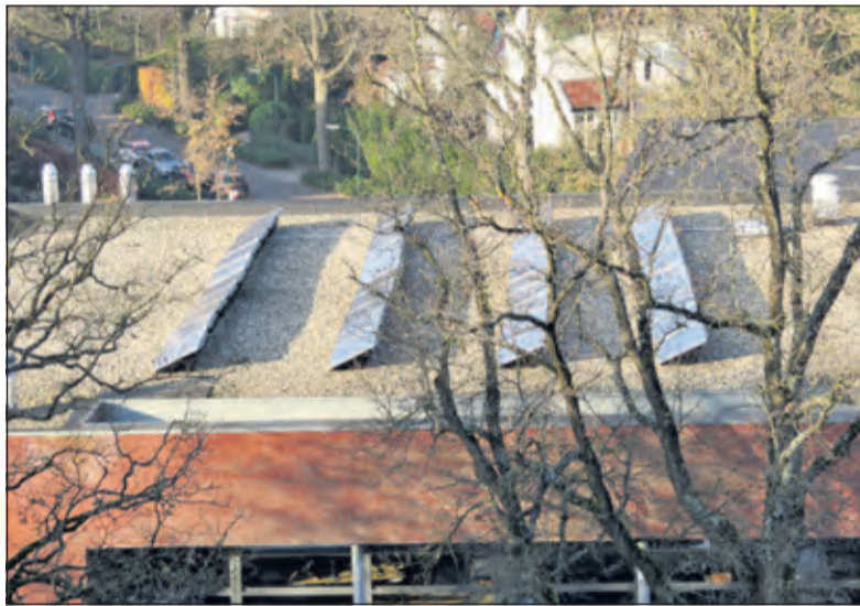
Van het gas af en veel meer zonnepanelen.

De burgemeester vindt het jammer dat er een politiek punt van wordt gemaakt terwijl het een veiligheidsaspect is. Hij ontraadde daarom de motie.