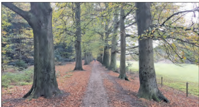
Een kathedraal van bomen in het Leyensebos.