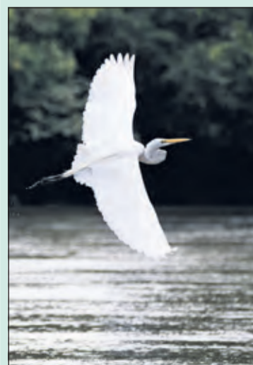
Sneeuwwitte gratie.

Zilverreiger vlucht Betovert in vol ornaat Sneeuwwitte gratie