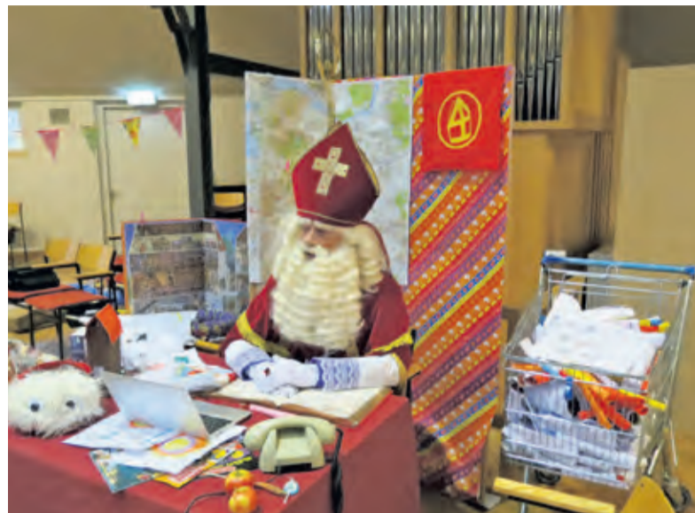
Sinterklaas houdt nauwkeurig in de gaten of alles ordelijk verloopt.