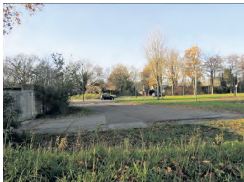
Zicht op de rotonde in de Biltse Rading waar de Asserweg op wordt aangesloten.