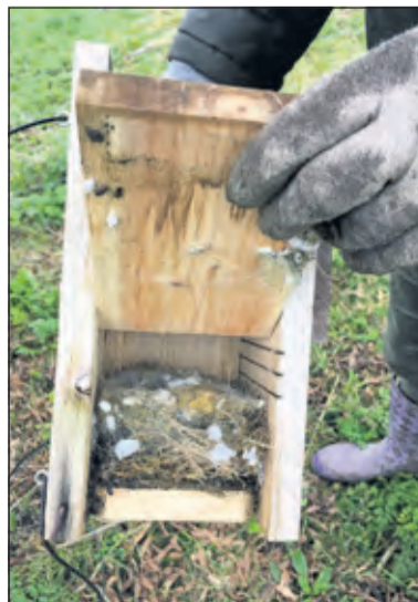
Het kastje wordt klaargemaakt voor de Lente.

Voor (eigen) vogelhuisjes in de tuin is het nu ook de tijd om deze schoon te maken: even met een borstel er doorheen en dan met lauw water naspoeien is genoeg: Klaar voor de lente. (Yvonne Mathot, Werkgroep Biodiversiteit Westbroek)