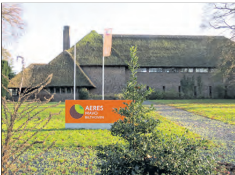
De school vanaf de Soestdijkseweg die per 1 augustus 2021 de deuren sluit.