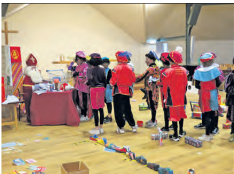
Pieten brengen de schoenen een voor een bij de Sint om ze te laten vullen.

Wanneer alle schoenen zijn gevuld worden ze in zakken weer teruggebracht naar de verschillende scholen. 'De pieten vergissen zich wel eens, het zijn ook zoveel schoenen, en dan kan het dus zijn dat een schoen die op de Bosbergschool thuishoort op een andere school terecht komt. Maar er zitten overal naamkaartjes aan waar de naam van de school opstaat dus komt het al-