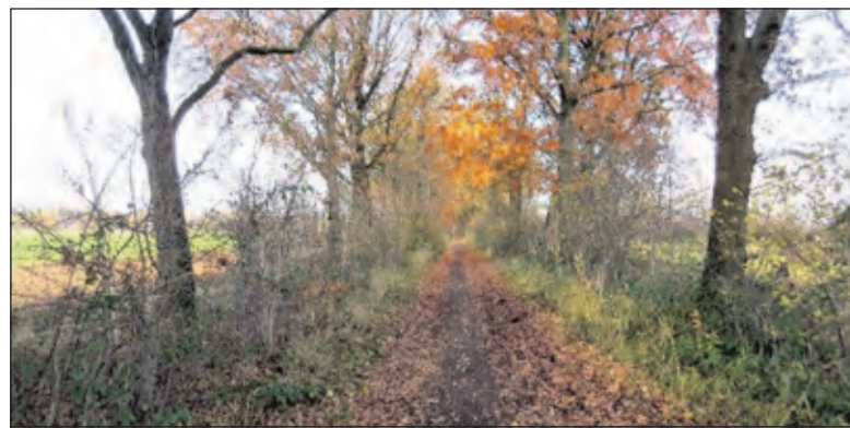
Prinsenlaantje in de herfst.

De merel was tot voor kort een veel voorkomende zangvogel in het aandachtsgebied van Stichting Behoud Prinsenlaantje en Ommelanden, maar door het uitbreken van het usutu-virus (merelziekte) zijn vele exemplaren gestorven en is het merelgezang niet meer te horen. De tuinfluiter zien en hoort