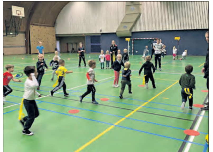
De jongste jeugdleden van de KangoeroeKlup doen enthousiast aan de trainingen mee.

Ook de selectie- en seniorteam trainen, maar voorbereiden op het wedstrijdseizoen blijft natuurlijk moeilijk nu er geen enkele vorm van wedstrijden mogelijk is. De regels voor senioren zijn (veel) strenger, waardoor dit op een veilige manier kan worden organiseren. 'Bepaalde aantallen, 1,5 meter, niet schreeuwen, geen wedstrijdvormen. Allemaal maatregelen waar wij ons aan houden en op toezien' aldus Pieter. 'Ondanks alle maatregelen merken wij toch dat er veel animo is om te sporten, er zijn bij onze Recreantenafdeling zelfs nieuwe leden bij gekomen. Sporten is en blijft gezond, zeker in deze tijd. Wij zijn blij dat wij een plek kunnen bieden om dit mogelijk te maken'.