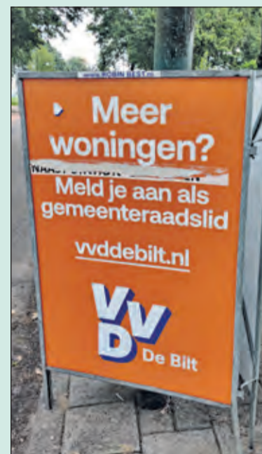
Onder 'Meer woningen?' begon het geplak en gekras en opnieuw geplak enz.