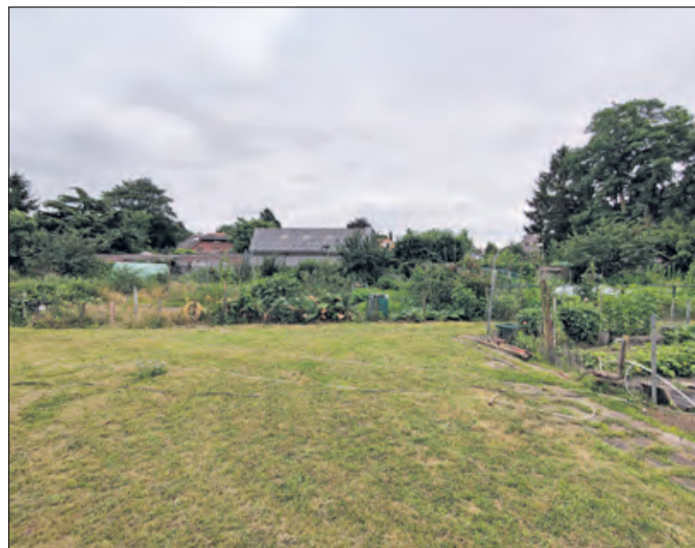
De volkstuinen worden voor de nieuwe plannen opgeofferd.

'Op dit moment moeten woningzoekenden in onze gemeente bijna