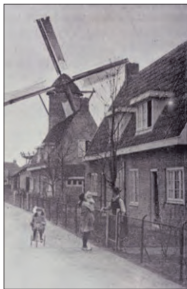
Een beeld van de Molen en weg in 1930. (archieffoto)