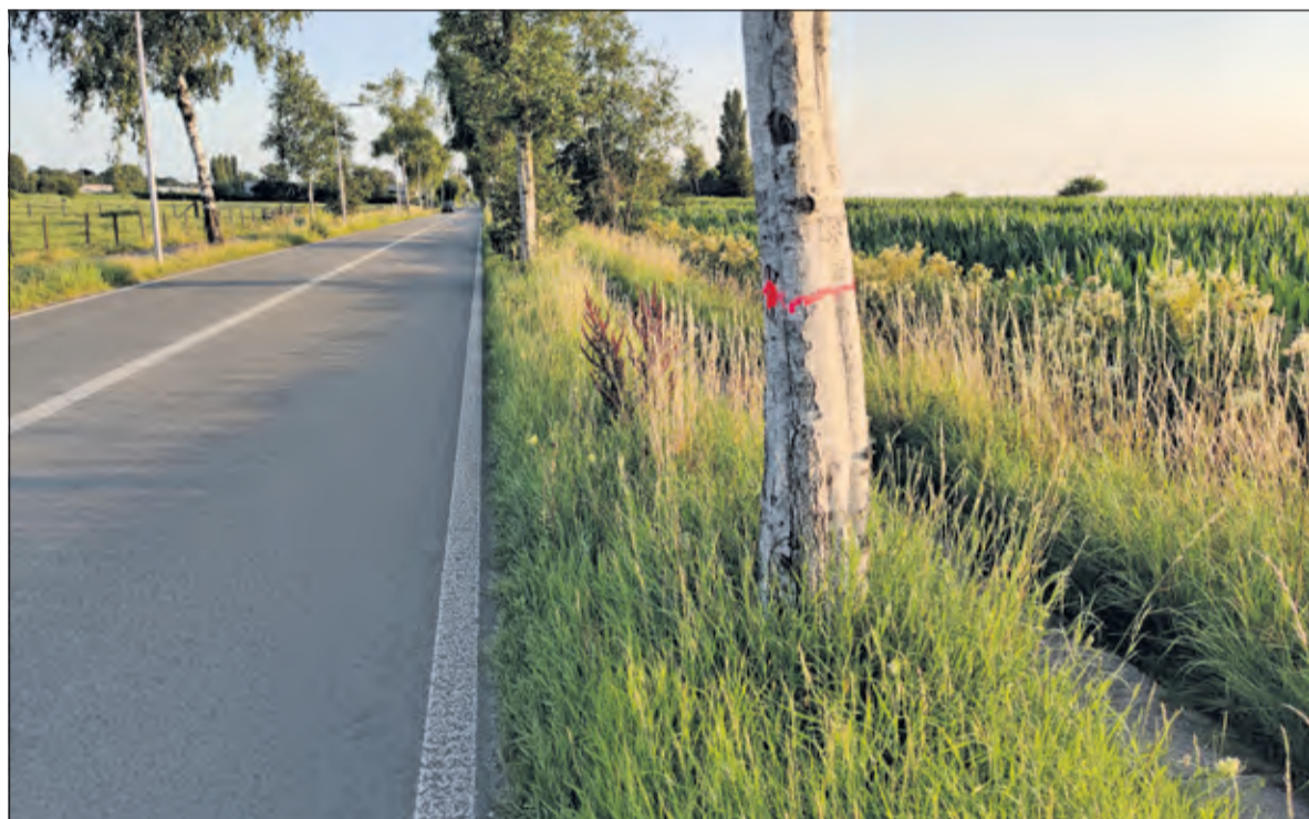
De te vellen bomen zijn roze gemerkt.

die Utrecht zich bezig gehouden met het opstellen van een bomenplan, samen met de werkgroep bomen N417 waarin bewoners uit de omgeving vertegenwoordigd zijn. Dit bomenplan moet enerzijds voorzien in de extra aanplant van berken op diverse lege locaties langs de weg en anderzijds in het zoveel als mogelijk behouden van de bestaande bomen, zolang ze geen gevaar vormen voor het verkeer. Recente aanrijdingen met