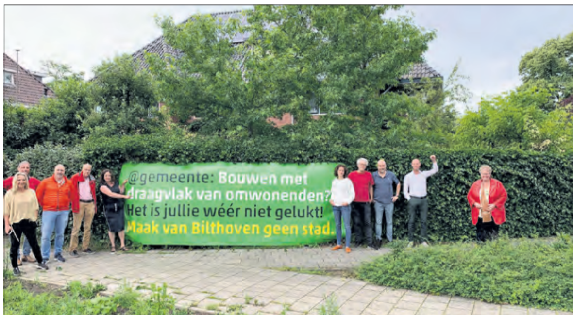
De tekst op het spandoek van de omwonenden gaat over (het ontbreken van) draagvlak.