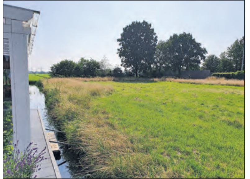
Het stukje grond verandert regelmatig van bestemming.

Helaas voor Schuurman bleef het daar niet bij. Tijden veranderen en de bestemming van het stuk grond naast zijn huis ook. 'Zonder overleg met aanwonenden moest het stuk grond nu opeens een natuurparkje worden', vertelt hij. 'Vanuit de gemeente hoorde ik niets over deze nieuwe bestemming. Het parkje grenst direct aan de erfaf-