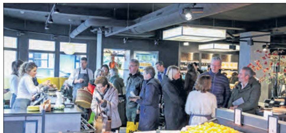
Al het lekkers resulteerde in rijen bij de kassa's.