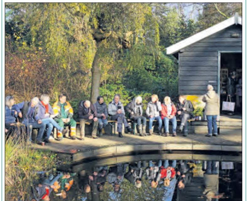
Vrijwilligers in het Van Boetzelaerpark houden pauze tijdens de laatste werkochtend van dit jaar. Zij genieten van een kopje koffie in de herfstzon. Tijdens het werk werden zij bijgestaan door een ambtenaar van de groenvoorziening van de gemeente.