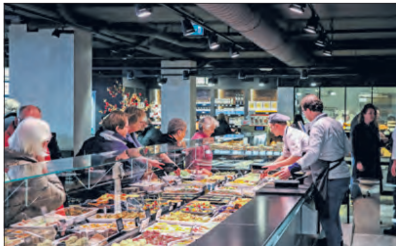
Klanten kijken hun ogen uit.

Bij Landwaart aan het Maartensplein te Maartensdijk kon op de laatste zaterdag in november al volop geproefd worden van het Kerst-keuze diner. Zaterdag 30 november werden alle kerstgerechten smakelijk gepresenteerd en was iedereen van 11.00 tot 15.00 uur van harte welkom om het lekkers te bekijken en te proeven. [HvdB]