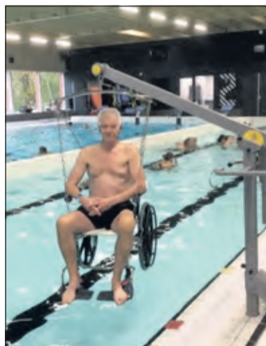
Derolstoel lift wordt gedemonstreerd. Linksboven aan de raamkant wordt op 5 december de nieuwe trap geplaatst.

We ondersteunen, adviseren en helpen iedereen op weg en je ziet gelukkig de tevredenheid toenemen. Natuurlijk zal er nog genoeg op ons afkomen en daar staan we open voor. Naar elke klacht en opmerking wordt serieus gekeken. Alle medewerkers van het zwembad doen hun stinkende best om het de individuele gebruikers en groepen zwemmers naar de zin te maken'.