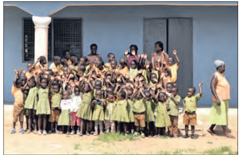
Kleuterschool Alata gereed.

plaats begin november 2019 en nu, 9 maanden later, staat er een schitterend solide kleutergebouw.