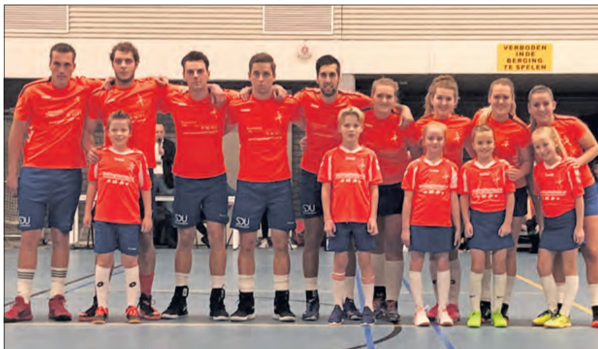
Thuisploeg DOS met het team van de week (DOS F2).

Aanstaande zaterdag speelt DOS weer thuis. De wedstrijd tegen De Meeuwen begint om 19.55 uur.