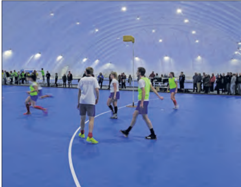
Drie zaalhokeyvelden is Hockey Dome Voordaan groot. Het tekort aan zaalruimte is nu opgelost.

Het resultaat van deze samenwerking is dat alle teams van hockeyvereniging Voordaan in deze hal kunnen trainen en hun zaalhokeywedstrijden kunnen spelen. Het tekort aan zaalruimte voor Voordaan is in één keer opgelost. De blaashal gedoopt Hockey Dome Voordaan, heeft een vloeroppervlak van 3572 m 2 en is drie zaalhokeyvelden groot. Na de wintermaanden wordt de hal weer afgebroken en opgeslagen. Nova maakt dan weer gebruik van de velden. Beide verenigingen hebben afgesproken, dat Voordaan de komende tien jaar het terrein huurt van Nova. In deze aankomende winterperiode blijft Nova voor zijn competitiewedstrijden en trainingen gebruik maken van het H.F. Witte Centrum en de Kees Boekhal.