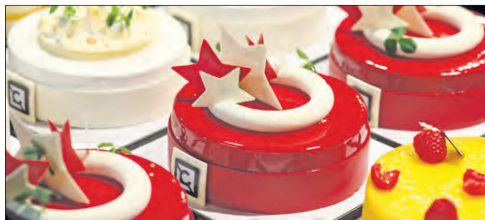
De keuze in kerstpatisserie is bijzonder uitnodigend.