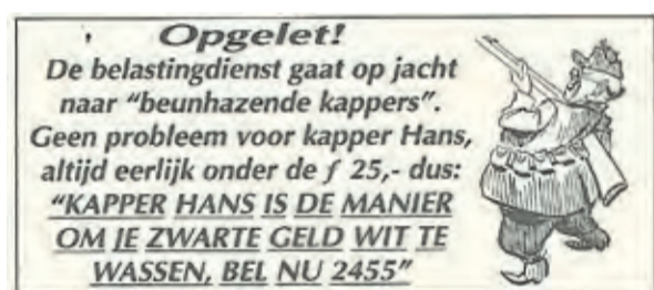
Veertien dagen later gaat de belastingdienst op jacht naar beunhazende kappers.