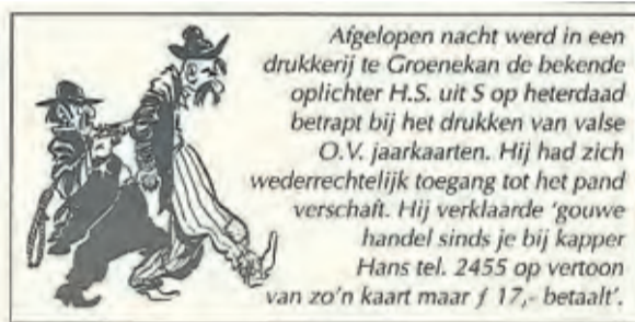
In De Vierklank van 8 februari 1995 noemt de dorpsbarbier zich een op heterdaad betrapte oplichter.