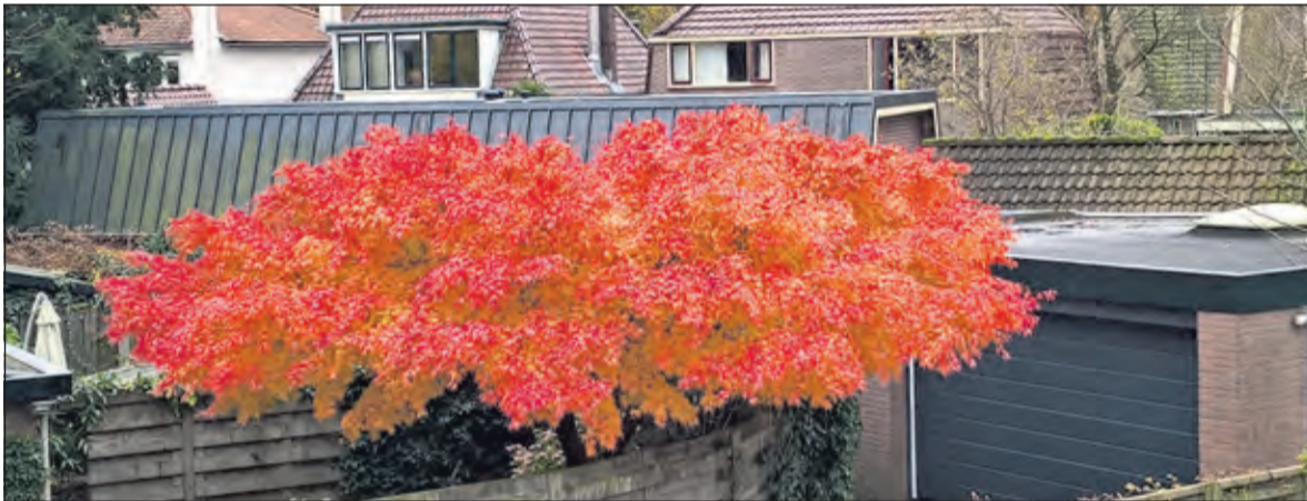
In het kader van herfstfoto's merkte Jaap van Eijk (De Bilt) op, dat deze er volgens hem er ook wel bij past.