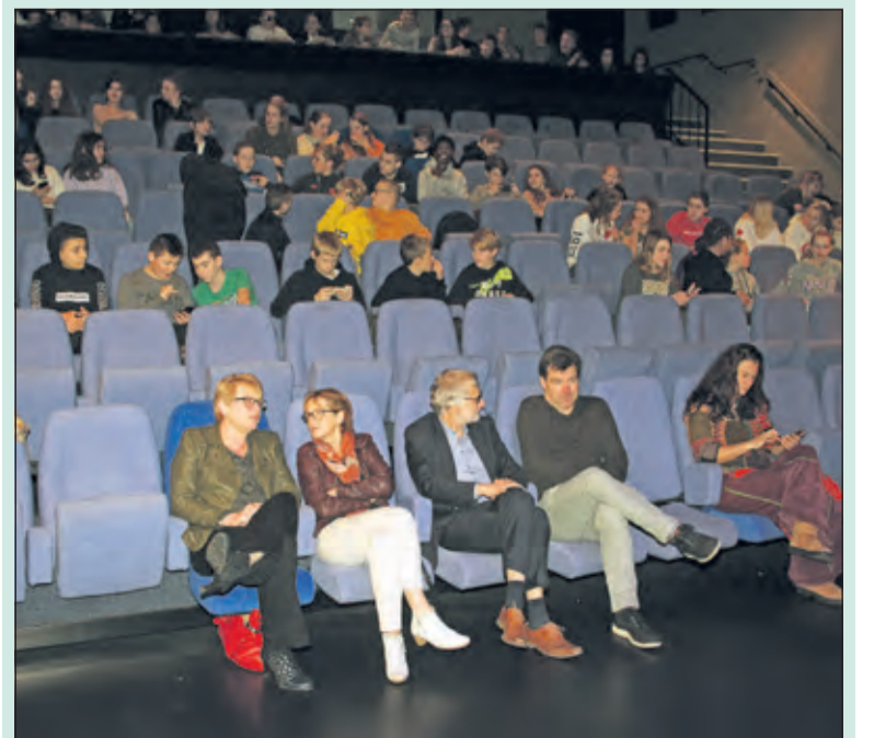
In afwachting van de presentatie in Het Lichtruim in Bilthoven.