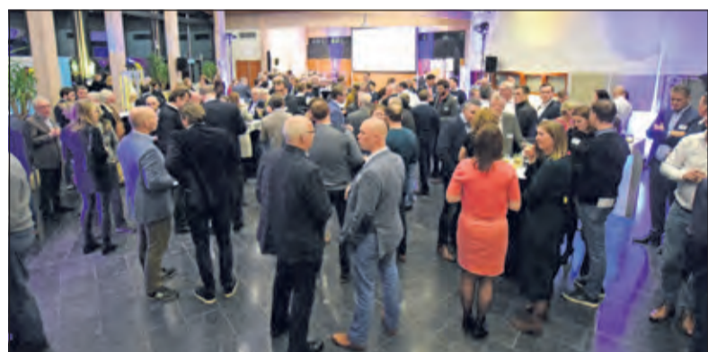
De verkiezing voor de Biltse ondernemer vond woensdag 27 november plaats in het gemeentehuis.

de campagnes voor hun klanten efficiënt en succesvol.