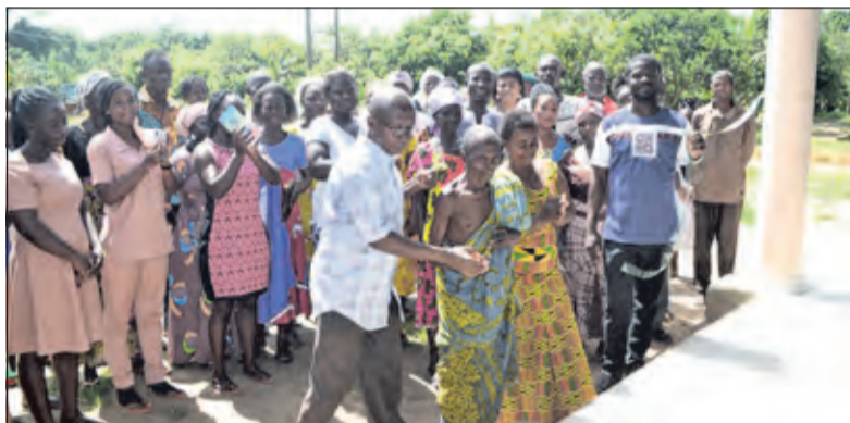
Op 18 november was de officiële opening van de kleuterschool waarbij het hele dorp aanwezig was. De chieft knipt het lint door.

Fase twee bestond uit het metselen van de behuizing en het plaatsen van kozijnen. In de derde fase is het dak gerealiseerd en een betonnen vloer gestort. De laatste fase betreft het stuc- en schilderwerk, het afhangen van de deuren etc. De afronding van het gehele project vond