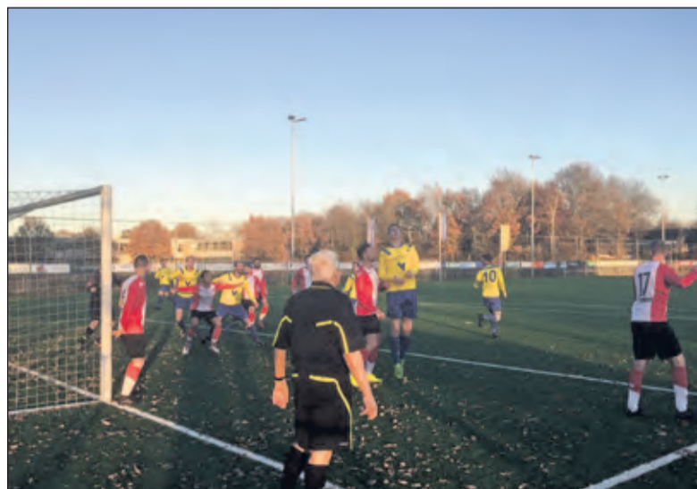
Een beeld van de wedstrijd die de Maartensdijkers uiteindelijk gemakkelijk wonnen.

Na de rust een controlerend spelend SVM dat op de counter loerde. De sterk spelende Nick Engel maakte zijn 2e doelpunt en kopte de 4-1 binnen. HMS was verbaal de meerdere van SVM, maar voetballend zeker niet. Rodney Klijn tekende voor