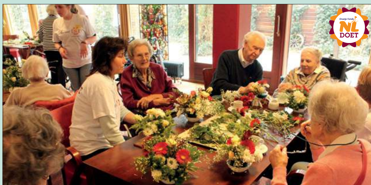
Elf leden van Dames Lions Bilthoven, tien leden van Makro Laagraven en vier persoonlijk aangemelde vrijwilligers waren jl. zaterdag in het kader van NL Doet in De Schutsmantel te Bilthoven uiterst behulpzaam bij het maken van bloemstukjes. De Makro Laagraven-medewerkers hadden ook nog een grote taart meegenomen, zodat het bloemschikken met koffie of thee en gebak nog prettiger werd.