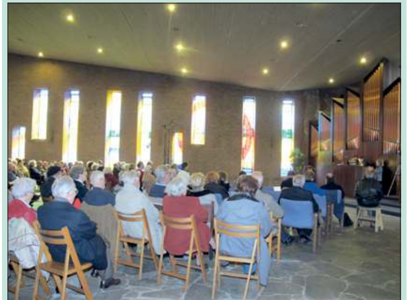
Voor veel mensen was het behalve een afscheid van een markante kerk ook een laatste kans om te horen hoe mooi de akoestiek is voor orgelconcerten. Gelukkig krijgt het binnenwerk van het orgel een nieuwe plek in de Grote Kerk in Oss.