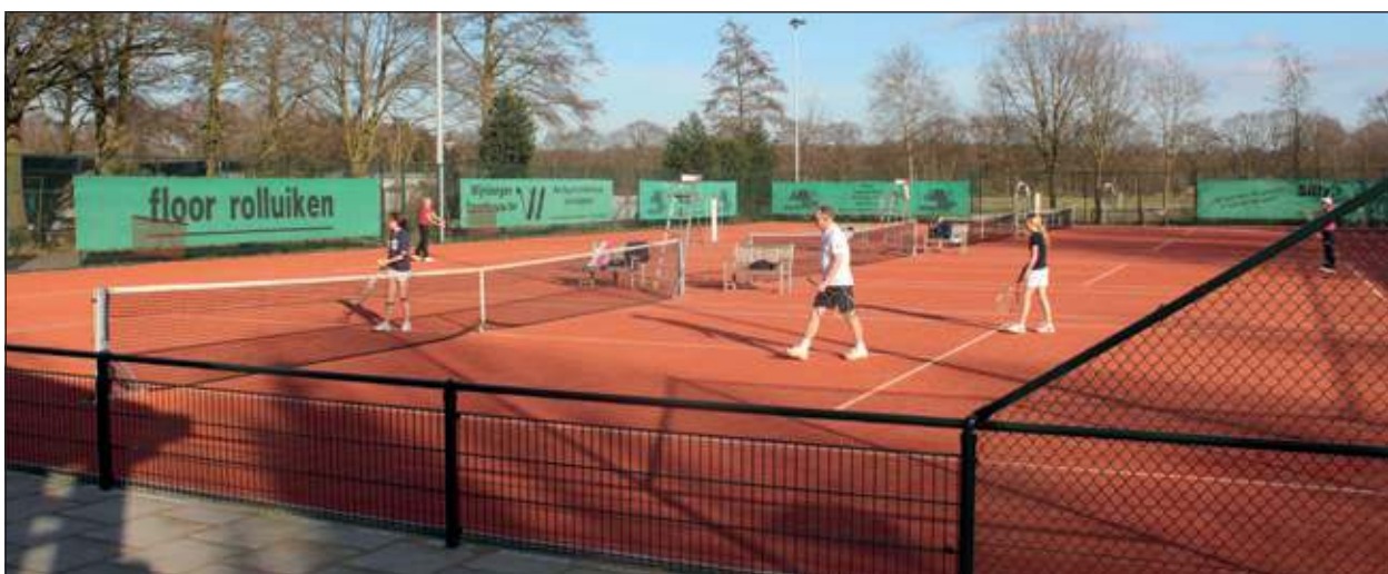
Het tennispark heeft vier smashcourt banen die het hele jaar bespeelbaar zijn.

Het tennispark is de laatste jaren volledig opgeknapt. De club heeft beschikking over vier smashcourt banen die het hele jaar bespeelbaar zijn. Voor alle niveaus en leeftijdsgroepen (50+, senioren, gezinnen en jeugd) worden tennisactiviteiten georganiseerd door en met vrijwilligers. Geïnteresseerden kunnen in april een maand lang vrijblijvend tennissen om zo te ervaren wat de vereniging te bieden heeft. Er is geen wachtlijst. Voor meer informatie: www.tvholland-scherading.nl