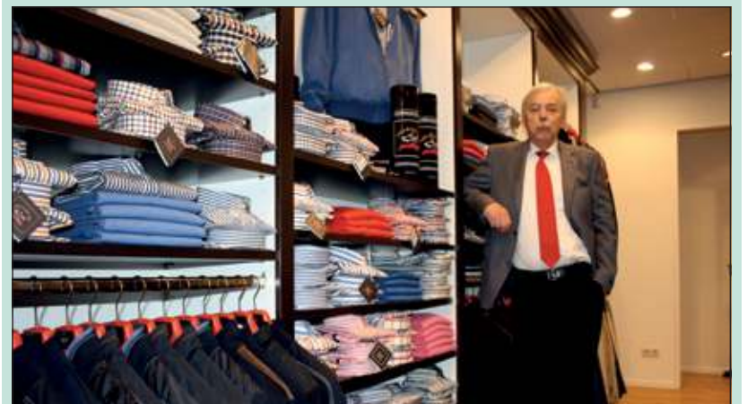
Op 29, 30, of 31 maart bent u van harte welkom op de Hessenweg 194-B voor een hapje en een drankje en om de service zélf te ervaren.

'Goede wijn behoeft geen krans is een gezegde.' Maar Hehenkamp levert nog meer service. Want zelfs de vermaakkosten zijn gratis. En ook 'kleding op zicht' meenemen om thuis in alle rust te passen en met de partner te overleggen is geen enkel probleem.