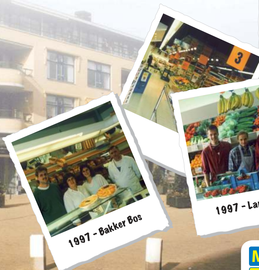
1997 - Bakker Bos