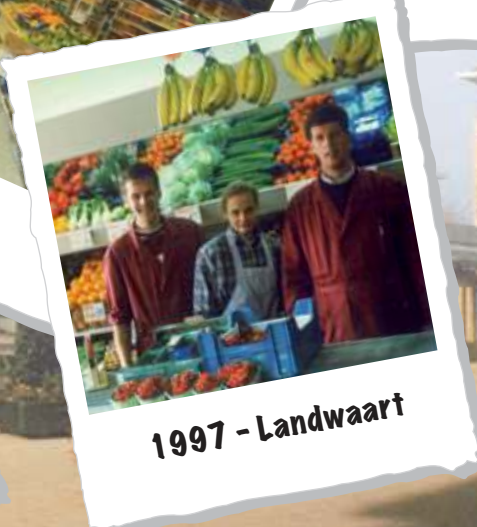
1997 - Landwaart

M aartensdijkse M iddenstand V ereniging