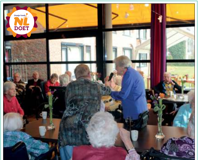
Vrijdag 16 maart jl. waren medewerkers van Bouwbedrijf de Jong in het kader van NL Doet naar woon- en zorgcentrum Weltevreden in De Bilt gekomen om het buitenmeubilair zomer klaar te maken. Dit was o.a. als compensatie voor de overlast, die de bewoners hadden ondervonden bij de verbouwing van het restaurant. Tijdens de thee- c.q. koffiepauze genoten medewerkers en bewoners ook van de geweldig lekkere taart, die het Bouwbedrijf ook had meegebracht. Eén van de bewoners bracht in dichtvorm namens iedereen de dank over en kreeg terecht de handen op elkaar voor deze vrijwilligersactie. [Henk van de Bunt]