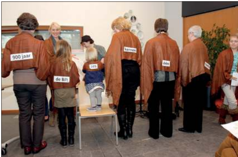
De Stichting 900 jaar De Bilt had als speciale actie veel Mathildes in de gemeente uitgenodigd om naar de uitreiking te komen. Zij zongen het jubileumlied.