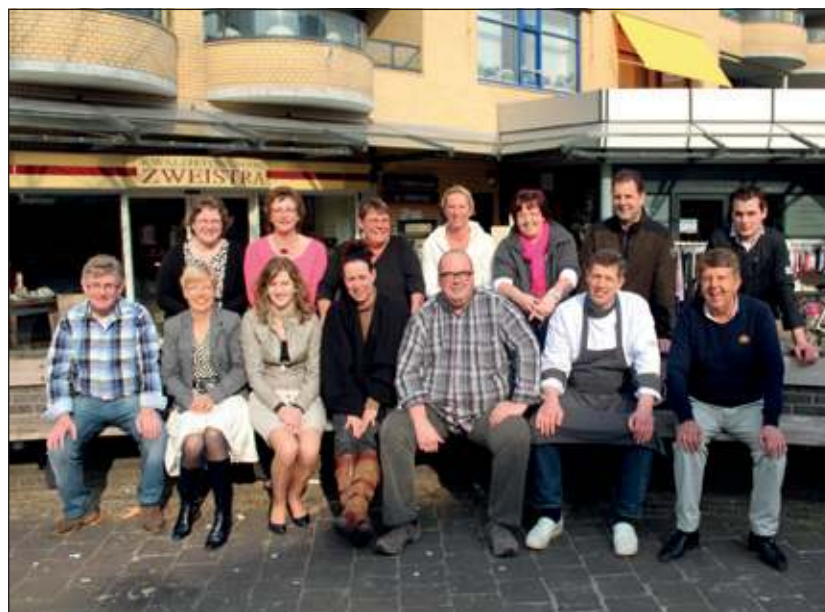
Leden van de winkeliersvereniging Maartensdijk op het Maertensplein.

Veel ondernemers zijn het erover eens: de Middenstandsvereniging doet goed werk. Toch zijn niet alle on-