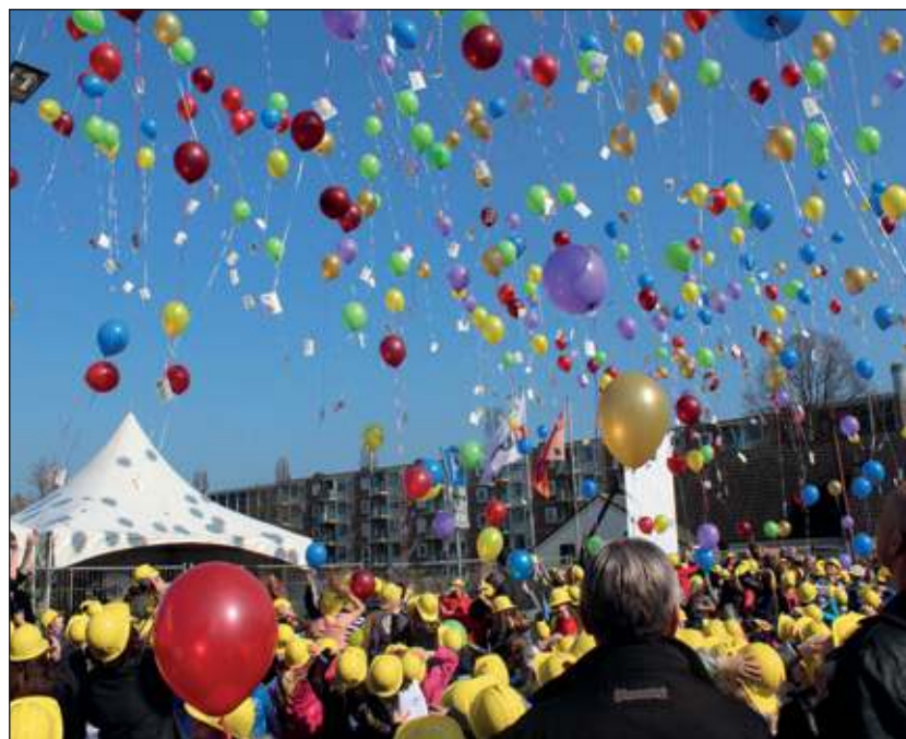
Voor de kinderen van de Jan Lighartschool, Wereldwijs en de Steenuiltjes was er een heuse ballonnenwedstrijd aan verbonden.

Daarnaast worden nog 19 huurwoningen en een gemeenschappelijke ruimte bovenop het CEC gerealiseerd. SSW is met Groepswonen van Ouderen De Bilt in gesprek om van de appartementen een woongroep te maken. Het CEC zal naar verwachting in oktober 2013 haar deuren openen voor de gebruikers. [HvdB]