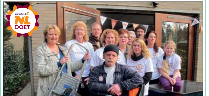
Net als vorig jaar gaat het vrijwilligersteam van De Wiltzangk er flink tegenaan met opknappwerkzaamheden en tuinonderhoud.