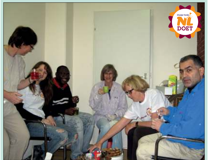
Tijdens NL Doet op 16 maart jl. wilde Stichting Steunpunt Vluchtelingen De Bilt (SpVDB) haar kantoorruimtes aan de Kometenlaan opnieuw (laten) witten door vrijwilligers. Het kantoor is rond 2005 geschilderd, dus het kon wel een kwast gebruiken. A-Quadrat schonk verf en materialen en met deze acht vrijwilligers, incl. enige cliënten, werd de klus meer dan voortvarend geklaard. De voorbereidingen (alles van de muren halen, gaten vullen de dag van tevoren enz) waren ook al door 'eigen' vrijwilligers gedaan. [Henk van de Bunt]