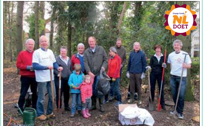
Gelukkig werkte het weer 's ochtends mee, zodat de vrijwilligers geen regenjas nodig hadden tijdens hun werkzaamheden aan de groenstrook langs het spoor in Vogelzang.