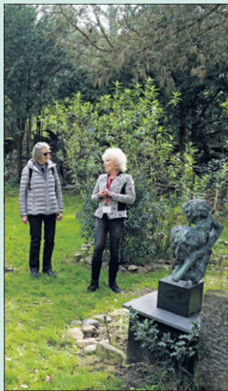
Rondleiding door het beeldenlabyrint.

Op Paaszondag- en maandag waren er rondleidingen in het beeldenlabyrint van kunstenaar Jits Bakker. Ook was er in het atelier 'de Kooi' een documentaire te zien over het zijn leven. Er waren 2 experts die de bezoekers door het beeldenlabyrint leidden en op een deskundige en enthousiaste manier de bezoekers vertelden over het ontstaan van de beelden. Opvallend was dat Jits bij het scheppen van veel van zijn kunstwerken geïnspireerd werd door verhalen uit de Griekse mythologie. (Frans Poot)