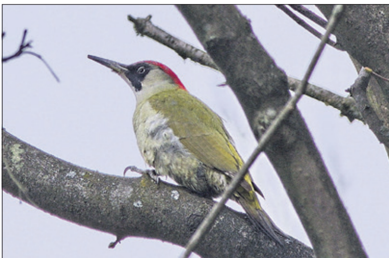
Een groene specht.

Vogelaars komen uit heel het land waaronder Amsterdam, Haarlem, de Betuwe. In de lentetijd laten de spechten zich allemaal goed horen door hun baltsroep of het gehak in bomen om een nest uit te hollen. (Eugène Jansen)