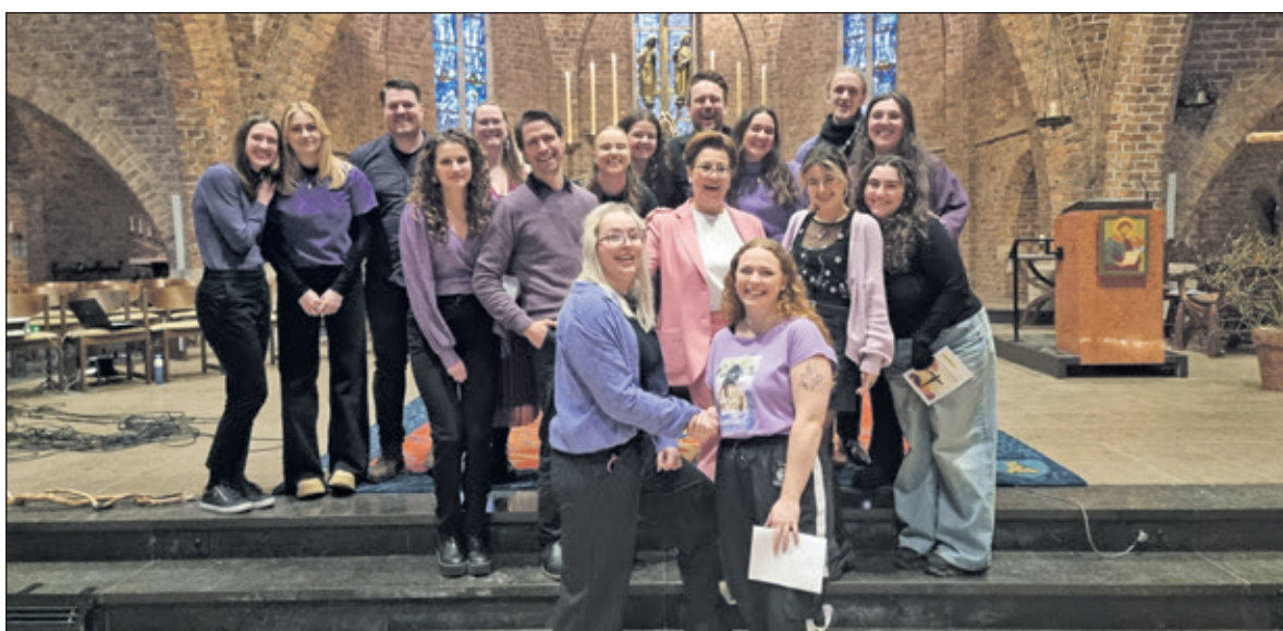
Twintig jongeren zingen hun eigentijdse The Passion op 7 april in de Sint Maartenskerk.