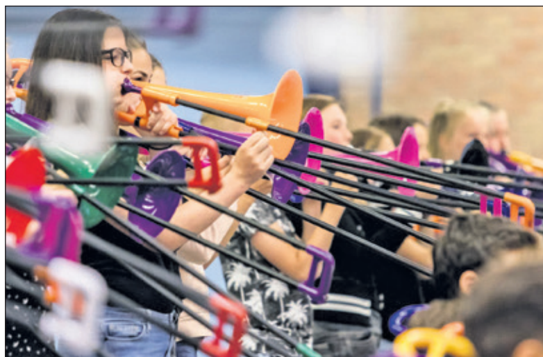
Met een p-Bone kan je heel snel muziek maken.

Alle activiteiten vinden plaats in verenigingsgebouw De Harmonie, Jasmijnstraat 6B, De Bilt en zijn gratis. Wel vooraf aanmelden via opleidingen@biltseharmonie.nl onder vermelding van je naam, leeftijd en de activiteit(en) waaraan je wilt deelnemen. Voor het Opleidingsconcert is dit niet nodig. Voor meer informatie zie www.biltseharmonie.nl . (Nynke Brouwer)