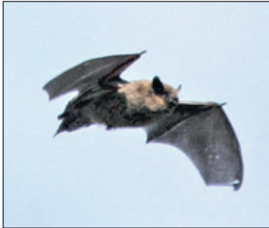
De dwergvleermuis vangt per nacht wel 1000 muggen.

Vleermuizen hebben het steeds moeilijker om een geschikte verblijfplek te vinden. Om vleermuizen in deze gemeente beter te beschermen, biedt de gemeente gratis vleermuiskasten aan; gezocht wordt naar inwoners die een