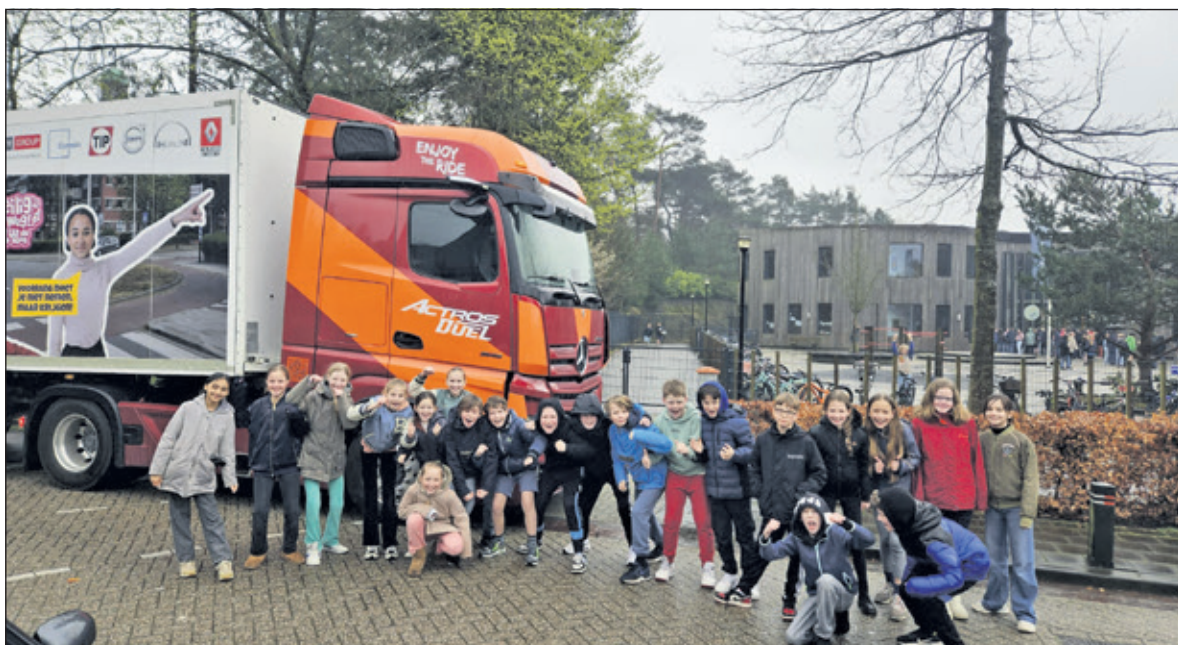
Leerlingen van de Theresiaschool bij hun lesvrachtwagen.