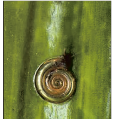
Aanwezigheid van platte schijfhoren was een van de argumenten in het bezwaar tegen het zonneveld.