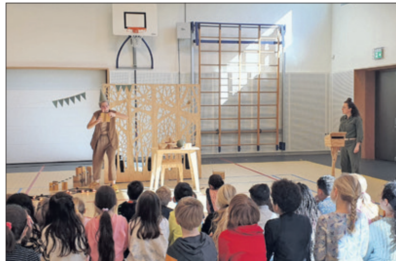
Behoorlijk Boos is een vrolijke jeugdtheatervoorstelling over boos zijn voor de groepen 3 en 4.

Er is ook een bezoek aan het Festival Tweetakt in fort Ruigenhoek, waar allemaal kunstwerken staan. Behoorlijk Boos is een grappige voorstelling van Oortwolk voor de groepen 3 en 4. Daarin doet Spitsmuis erg zijn best om Eekhoorn