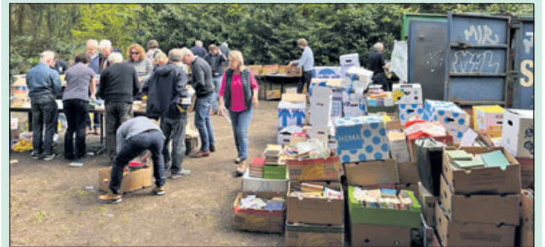
Het achter terrein van restaurant het Oude Tolhuys waar op zaterdagen boeken kunnen worden afgeleverd.

In dit lustrumjaar worden met de opbrengst van de boekenbeurs twee goede doelen ondersteund. Een deel van het geld gaat naar de stichting 'Durf te dromen'. Deze stichting ondersteunt kinderen met huiswerkbegeleiding om het voor hen mogelijk te maken dat zij hun talenten en hun sociaal-emotionele ontwikkeling verder te kunnen uitbouwen. Tevens wordt 'De Geheime Schrijfschool' gesteund. Hierbij worden leerlingen van de Openbare Basisscholen in Overvecht door middel van workshops gestimuleerd hun creativiteit zo goed mogelijk te gebruiken in hun schrijfproces. Beide projecten hebben dringend behoefte aan geld om daarmee deze nieuwe leerprojecten voor kinderen in Overvecht te kunnen opstarten. Met behulp van het geld dat door de boekenbeurs wordt opgehaald willen de Lions-clubs graag een extra stimulans aan dit leer- en schrijfproces geven. Doorgaans wordt er zo'n ruim tienduizend euro met de boekenbeurs voor het Goede Doel opgehaald. Er wordt gehoopt dat ook dit jaar dit bedrag weer ruim zal worden gehaald wat natuurlijk vooral afhangt van het feit of er genoeg boeken van goede kwaliteit binnenkomen. De prijs van de boeken wordt bepaald aan de hand van het gewicht.