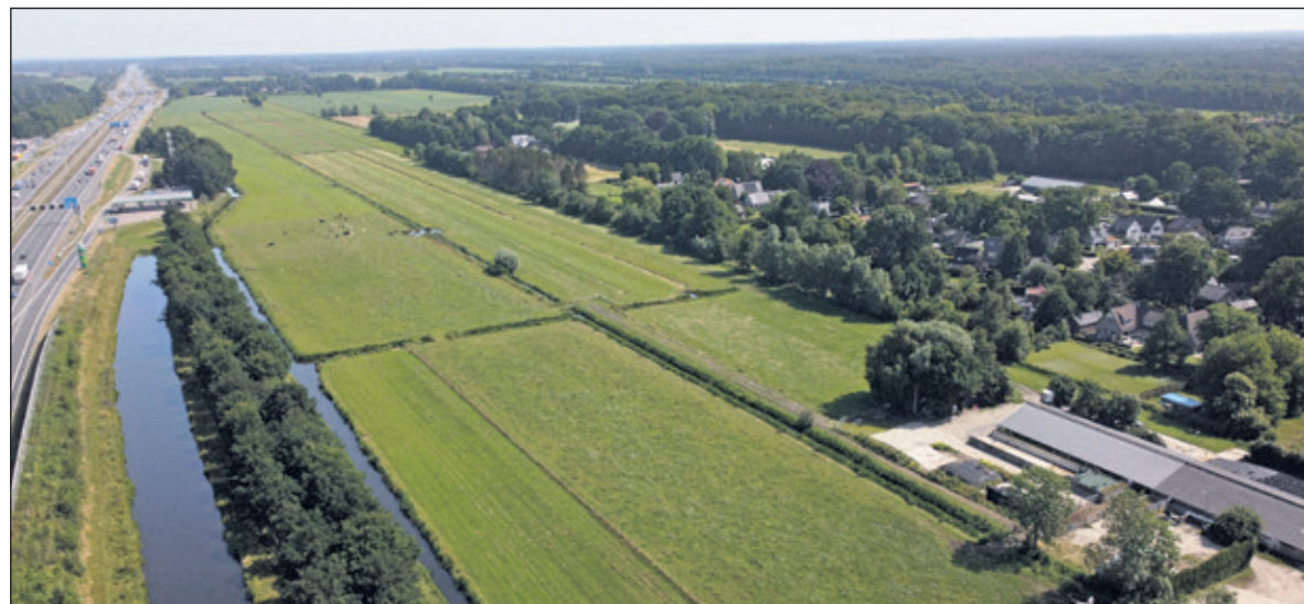
De rechtbank Midden-Nederland heeft het beroep tegen de door het college van B en W verleende omgevingsvergunning voor een zonnepark in Groenekan ongegrond verklaard.