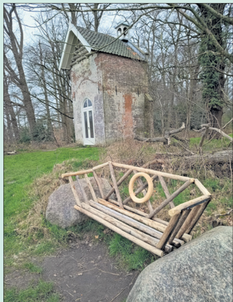
Het enige bankje op landgoed Sandwijk is weer vernieuwd en geschikt om uit te rusten en van de mooie natuur te genieten. (Gijs van de Berg).

uw afscheid regelt u niet alleen voor uzelf