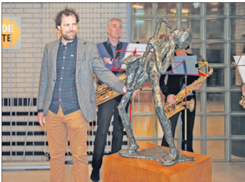
Voor Tibo is het kunstwerk meer dan alleen een herinnering aan zijn vader.

Voor Tibo - hij bespeelt zelf ook de saxofoon - is het kunstwerk meer dan alleen een herinnering aan zijn vader: 'Het lijkt net of je naar je eigen jeugd kijkt toen ik nog optrad met mijn band, onder andere in het toenmalige café De Griffel in De Bilt. Ik stond vaak solo's te spelen, regelmatig haalde ik dan uit en dan was dat in de houding van dit beeld. Het is daarom voor mij persoonlijk ook een dierbare herinnering aan mijn jeugd en het zorgt voor een warm onthaal in het gemeentehuis. Een mooi aandenken aan een gedenkwaardige expositie', zo besluit Tibo.