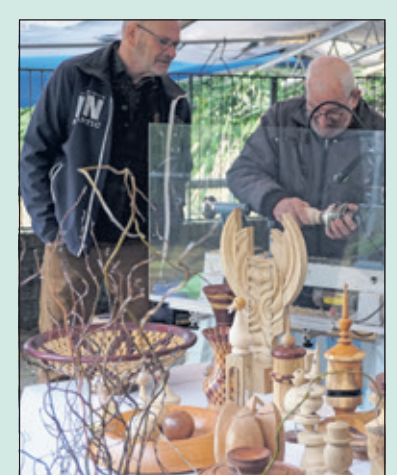
Houtbewerking is een kunst apart.

Maandag 2de paasdag was er in de centrale ruimte van WVT (Talinglaan 10 te Bilthoven) een (Paas-)Kunstmarkt. Direct na de aanvangstijd stroomden de bezoekers toe en bewonderden de vele kunstwerken die op lange tafels uitgesteld lagen. De kunstenaars kwamen vooral uit onze gemeente, maar ook uit de regio. In de buitenruimte was er ook een houtlijper, om hout te bewerken. (Frans Poot)