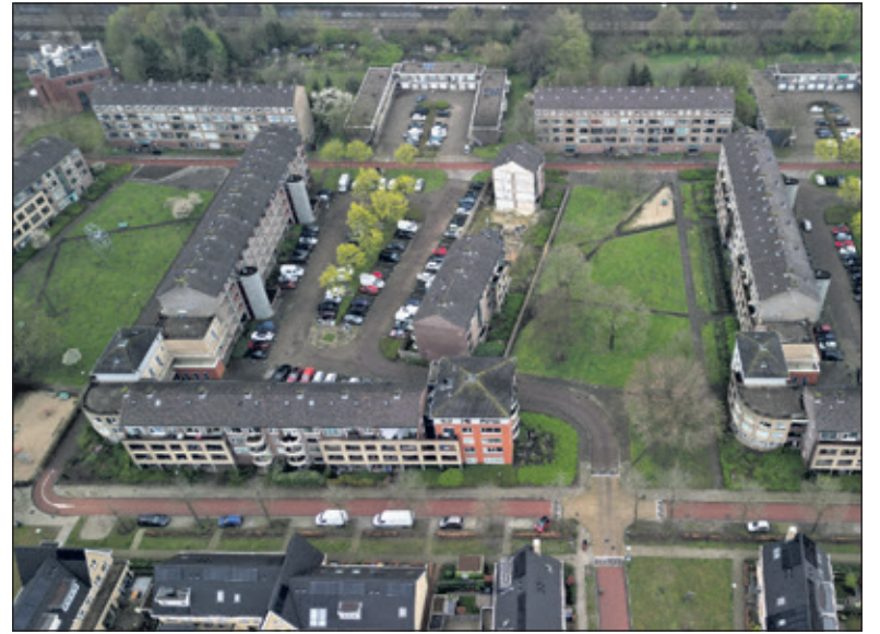
Herontwikkeling van het gebied rond de ontplofte flat aan de Weegschaal komt in zicht.

Peter Flierman (CDA) wilde meer weten over de zoektocht naar een hoogspanningsstation (HSS) door o.a. gemeente De Bilt. Zijn vragen worden door wethouder Krischan Hagedoorn beantwoord: 'De impact van een HSS is vooral ruimtelijk. Met name het gedeelte van TenneT is omvangrijk. Wel kan, afhankelijk van de locatie, de impact van een HSS sterk verminderd worden door een goede landschappelijke inpassing. Het college vindt een HSS op de zoeklocatie nabij Westbroek ronduit onwenselijk, omdat de kwaliteit van het landschap in onaantvaardbare mate zou worden geschaad, terwijl een behoorlijke landschappelijke inpassing daar door de openheid van het landschap