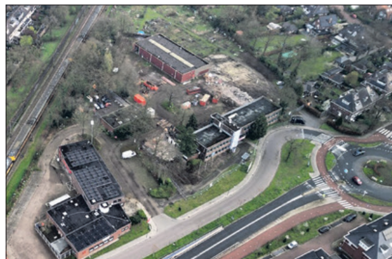
De sloopwerkzaamheden zijn begonnen.

Nadat eind vorig jaar de creatieve broedplaats Buro Lou in het voormalig politiebureau moest stoppen is met gezamenlijke inzet van onder meer de gemeente De Bilt en Woningbouwvereniging Woongroen, een nieuw onderkomen gevonden aan de Molenkamp 44 in De Bilt. De Clou is circulair gebouwd met