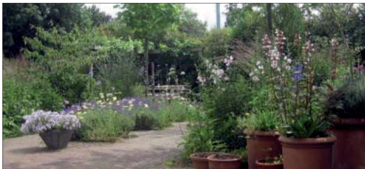
Een zomerse aanblik van een door Pieter de Koning ontworpen tuin.

Belangstelling? Kijk op de site www.koningtuinen.nl of bel 0346 - 282140 voor meer informatie of een inschrijfformulier.