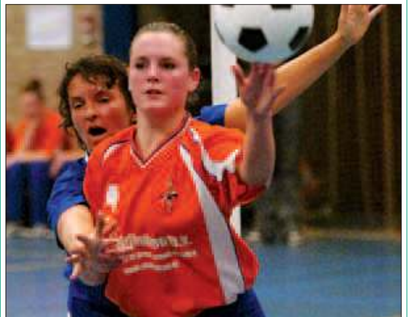
DOS moest zijn meerdere erkennen in koploper De Vinken. Het duel tegen de ploeg uit Vinkeveen werd met 13-28 verloren.

DOS is nu een week vrij en speelt op 26 februari een inhaalwedstrijd tegen VZOD, dat DOS nu voorbijgegaan is op de ranglijst. Vanwege ruimtegebrek in sporthal De Vierstee, speelt DOS deze thuiswedstrijd in De Bilt. Het aanvangstijdstip is 15.10 uur.