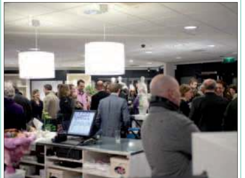
Na de officiële opening was er volop gelegenheid om de zaak en de nieuwe collectie te bekijken. Ook vrijdag kwamen veel Maartensdijker de zaak bekijken; van de paskamers werd al goed gebruik gemaakt.