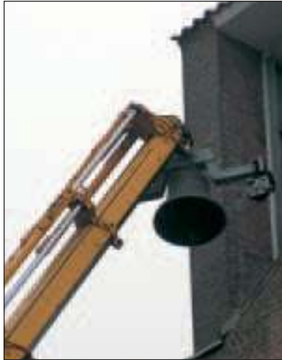
De eerste klok wordt neergelaten.

Met behulp van een kraan en een hoogwerker bleek het achteraf een vrij eenvoudige klus te zijn. Technici van de klokkengieterij demonteerden het ophangmechanisme van de klokken, die daarna één voor één door de kraan op de grond werden gezet. Voor ze echter op de vrachtwagen werden geplaatst werd eerst de klepel