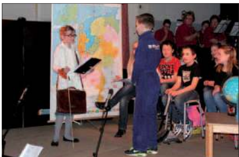
Scene uit 'Stop! de musical tegen zinloos geweld'. Op de achtergrond de muzikanten van Vriendenkring.