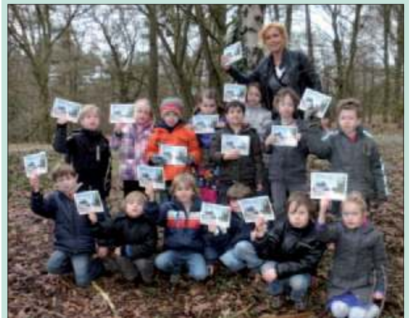
De leerlingen van de Van Everdingschool uit Bilthoven kijken dagelijks uit op de Biltse Duinen en willen dit prachtige natuurgebied graag zo houden. Daarom doen ze mee aan de actie: Red de Biltse Duinen! Voor elke euro die ze met het Utrechts Landschap inzamelen, leggen Provincie Utrecht, gemeente de Bilt en stichting 'Mens en zijn Natuur' elk een euro bij! ( www.everdingschool.nl ) (Mirte van den Berg)