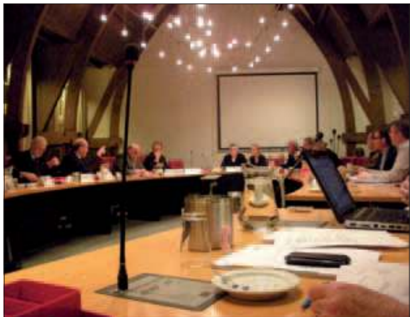
De commissie Burger en Bestuur.

van MENS zou wellicht het gemis van een nulmeting enigszins kunnen compenseren. Over die nulmeting is in het verleden inderdaad wel gesproken maar zo'n onderzoek is door het college nooit toegezegd. Mocht het SEV-onderzoek niet bruikbaar zijn dan, zo zegde de wethouder toe, zal de gemeente zelf zo'n onderzoek laten uitvoeren. Hij zegde toe de verhouding overhead t.o.v. handen aan het bed van project MENS uit te laten zoeken. De wethouder vindt de suggestie van de Ouderenraad om samenwerking in het project te