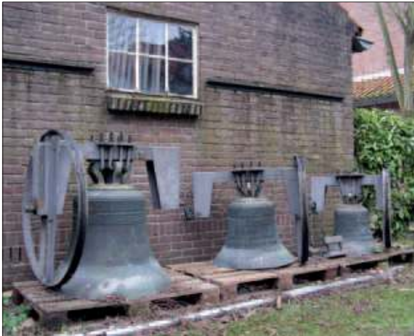
De klokken uit de Laurenskerk op het erf achter de Michaëlkerk.