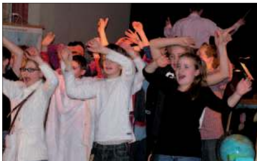
Vol overgave werd er gezongen.