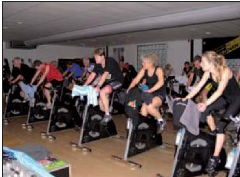
De docenten van het Delta-team toonden dat ze gemakkelijk in een dag tien keer de Alpe d'Huez op en af kunnen.