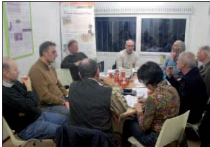
De klankbordgroep vergadert.

Deze hele week worden in de provincie Utrecht activiteiten georganiseerd voor de landelijke actie Hart voor Natuur. Kijk op www.hartvoornatuur.nl voor meer informatie.