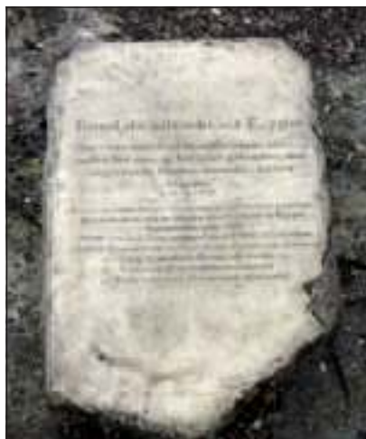
Deze steen met inscriptie ligt bij het kruidenvak. Exodus 12: 8 'Rooster het vlees en eet het nog diezelfde nacht, met ongedesemd brood en bittere kruiden'.

Ook niet leden zijn van harte welkom bij de lezing door Hortulanus Gerard van Buiten. Een hortulanus is belast met het technisch beheer van