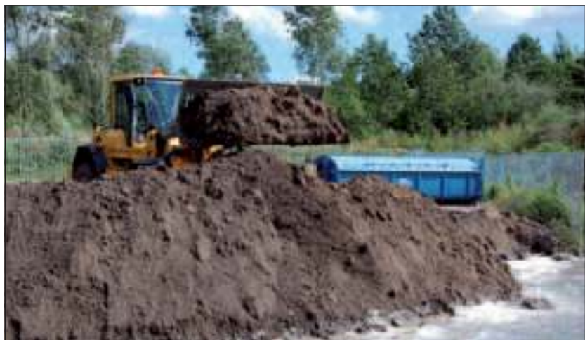
Inmiddels is circa 150.000 m 3 grond en waterbodem in de plas gebracht.

Inmiddels is circa 150.000 m 3 grond en waterbodem in de plas gebracht. In de diepe plas wordt eerst met natte waterbodem, via een vultrechter, de bodem verhoogd. Daarna wordt met grond een stevige afdeklaag gerealiseerd. Het voornemen is om medio maart op het tijdelijke werkterrein bij de plas te starten met de tijdelijke opslag van grond, die herbruikbaar is. Voor de daadwerkelijke toepassing van deze grond is nog een extra partijkeuring noodzakelijk. Stichting Het Utrechts Landschap heeft met DvdK strikte afspraken gemaakt