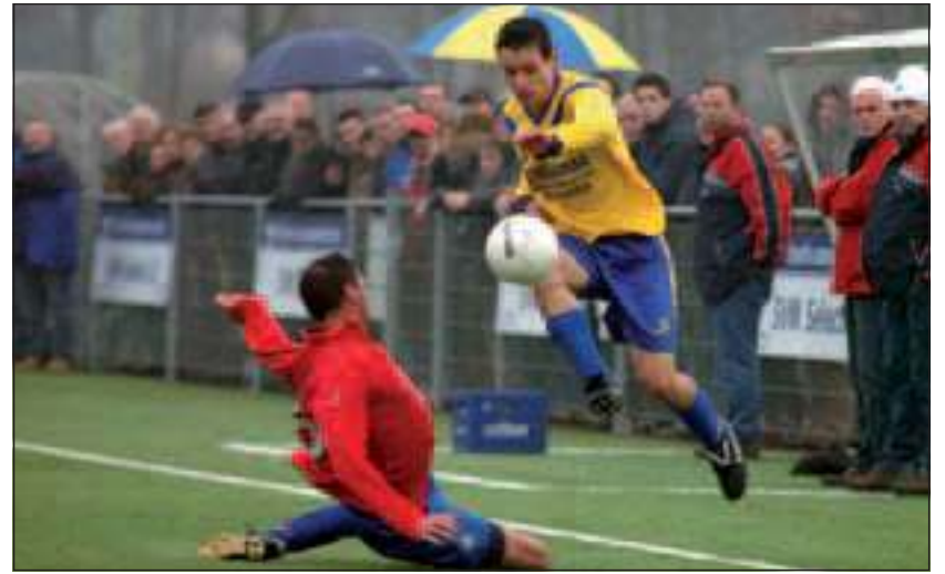
SVM heeft goede zaken gedaan door in eigen huis met 1-0 te winnen van hekkensluiter DOSC.

De tweede helft was eigenlijk net als het weer: erg druilerig. Twee ploegen