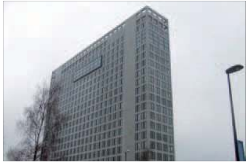
GroenLinks was tegen de aankoop van het Fortis-gebouw voor een nieuw provinciehuis.

Jeugdzorg bij de gemeente veronderstelt dat een gemeente over de nodige kennis beschikt en een netwerk heeft om kinderen goed te plaatsen. Dat vind ik niet efficiënt en daar ben ik geen voorstander van. De provincie doet dit nog maar een jaar of vijf. De controle op de maatregelen was heel intensief. Als je dat in gemeenten gaat organiseren, leidt dat in veel gevallen tot een regionale aanpak en is er niemand meer die het controleert. Sommige zaken mag je best bij het middenbestuur laten liggen. Ik vind de jeugdzorg daar één van. Groot-schalige decentralisatie van taken heeft impact op de bestuurskracht van gemeenten. Vaak wordt genoemd dat gemeenten dan minstens 50.000 inwoners moeten hebben. D66 is daar bijvoorbeeld een voorstander van. Dat leidt tot een herschikking van gemeenten die zijn weerga niet kent. Voor GroenLinks is het duidelijk. Je moet voorzichtig zijn met decentraliseren naar gemeenten die niet opgewassen zijn tegen hun taak.'