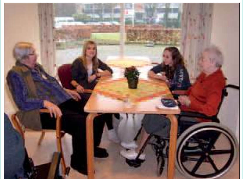
Beide stagiaires vonden het erg gezellig om hier een kijkje te nemen hoe het werken in een verzorgingshuis er aan toe gaat.