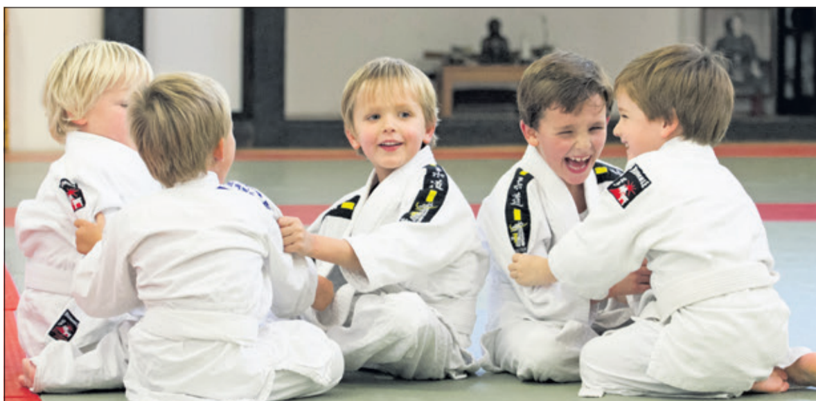
Plezier en zelfvertrouwen zijn cruciale succesfactoren in de sport.

Het Jeugdsportfonds wil dat alle kinderen kunnen meedoen aan sport. Daarom wordt waar mogelijk steeds meer samengewerkt met andere partijen, zoals het Jeugdcultuurfonds, Leergeld, Stichting Jarige Job en Fonds Kinderhulp. Op 13 juni jl. is door deze vijf partijen het platform 'Kansen voor alle kinderen' gelanceerd. Op de website www.kansenvoorallekinderen.nl is te zien welke mogelijkheden er zijn voor kinderen en jongeren in armoede. Kijk voor meer informatie op www.jeugdsportfonds.nl/utrecht of bel met medewerkers van het Jeugdsportfonds Utrecht via 06 20074161.