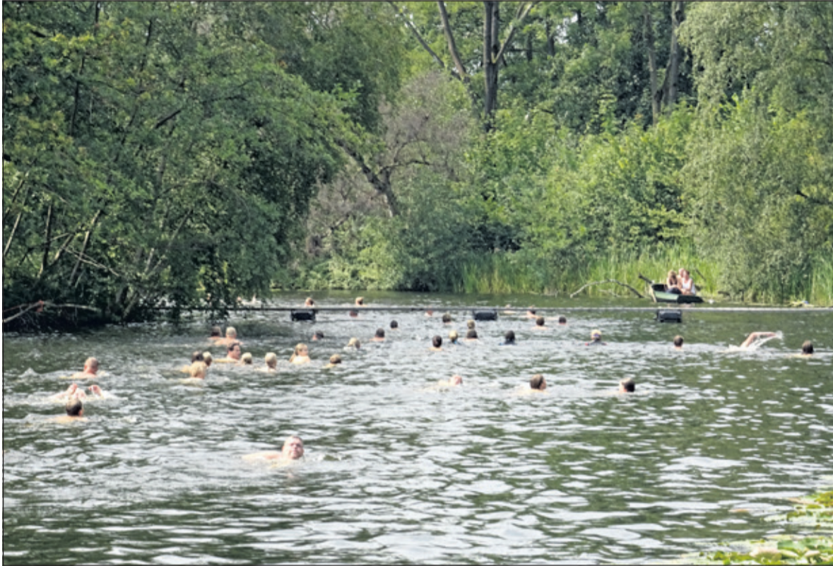
Circa 30 zwemmers naderen de eerste bocht in de ronde om fort Ruigenhoek.

De uitstekende waterkwaliteit van zwembad De Kikker en de fortgracht rond Fort Ruigenhoek in Groenekan maakte het weer mogelijk de kilometertocht rond het fort te organiseren. Het weer, de watertemperatuur van 21 graden en 120 enthousiaste deelnemers maakte deze 35ste editie van de kilometertocht op zaterdag 26 augustus op voorhand al een geslaagd evenement.