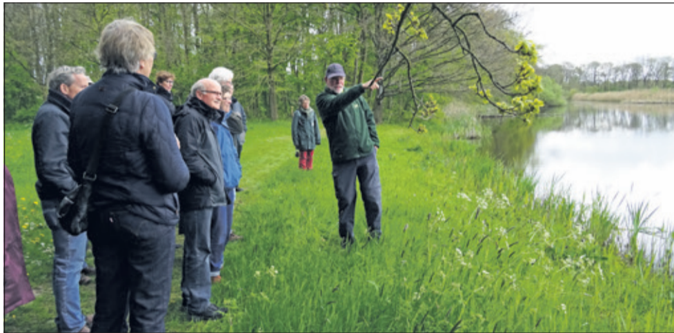
Gidsen van het Utrechts Landschap vertellen graag over de boeiende geschiedenis van het gebied.

Om 11.30 en om 13.30 uur vertrekt er een excursie met het thema 'De rol van bomen in mythen en volksgeloof'. Om 12.30 en om 14.30 uur zijn er excursies over de geschiedenis van het landgoed en de bijzondere natuur. De excursies zijn gratis en duren ongeveer een uur. Vooraf inschrijven voor de excursies is wenselijk, want het aantal plekken is beperkt. Inschrijven kan via www.utrechtslandschap.nl . Landgoed Oostbroek ligt aan de Bunnikseweg 45a in De Bilt (vlakbij De Uithof). Geadviseerd wordt met de fiets te komen. Parkeren met de auto is op 9 september elders geregeld.