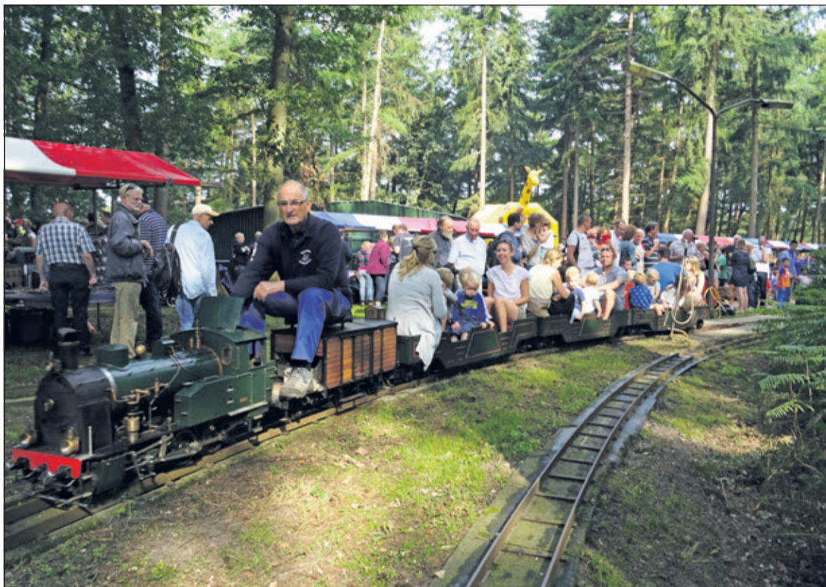
Afgeladen vertrekt de trein voor een ronde over het terrein. Vaders en moeder genieten evenzeer als de kinderen.

De Stoomgroep Hollandsche Rading presenteerde zich in een mooie kraam met allerlei kleinere in aanbouw zijnde modellen om te laten zien waar je mee kunt beginnen wanneer je lid wordt van de vereniging. Elke woensdag zijn de leden op het terrein met hun hobby bezig. Op de site www.radingspoor.nl kunnen geïnteresseerden meer over de vereniging lezen en foto's bekijken.