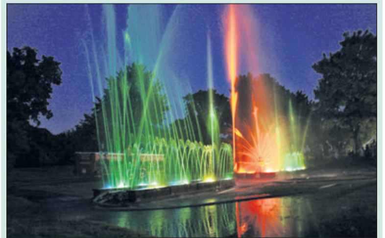
Ledlampen kleuren het water rood, blauw, groen en oranje.

Het jubileum wordt voor de Biltse bevolking gevierd met een spectaculaire show op 9 september bij de grote vijver in het van Boetzelaerpark in De Bilt om 21.30 uur van het waterorgel van de vrijwillige brandweer Coesfeld-Lette in samenwerking met de brandweer De Bilt. Uit een 30 meter breed waterorgel sproeit water via 170 mondstukken in diverse afmetingen tot wel 40 meter hoog. De verschillende fonteinen en watermuren worden handmatig bediend via meerdere spuitstukken en kleppen. Tijdens het gehele schouwspel klinkt muziek. De show duurt een half uur.