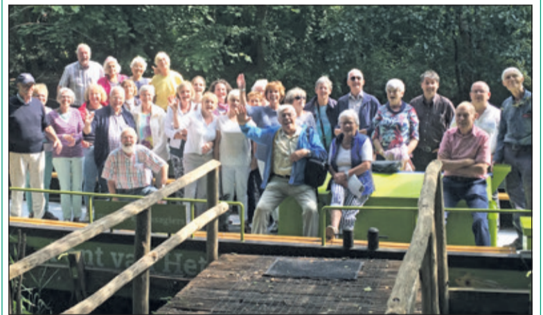
De donderdagochtend badmintongroep maakt ook uitjes zoals laatst met de boot van het Utrechts Landschap op de Kromme Rijn met voorafgaand een picknick.