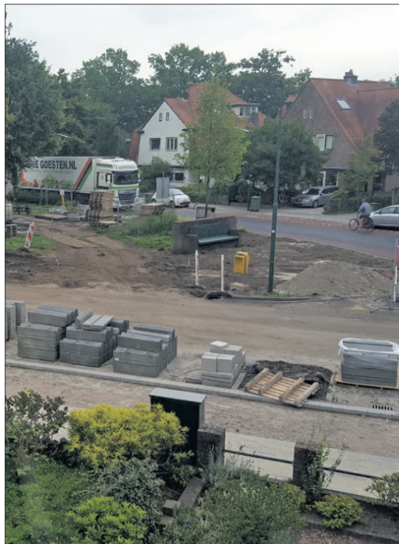
De dr. Lettebank is op zijn nieuwe plaats gezet.