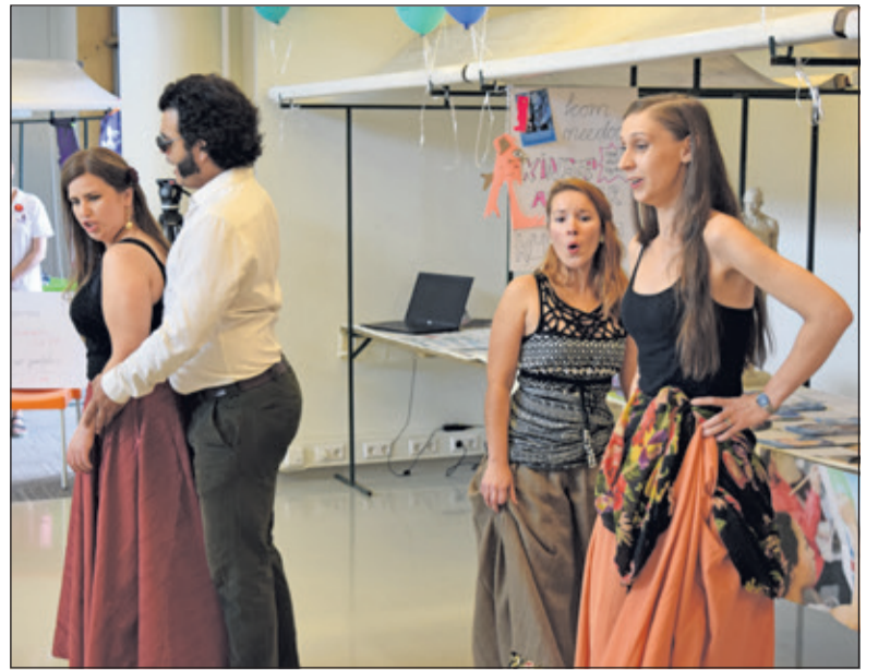
Voorstelling van Carmen in Het Lichtruim.