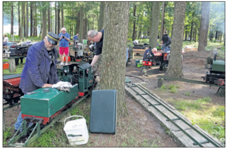
Op het rangeerterrein wordt hard gewerkt om de modellen aan het rijden te krijgen of te houden.

De hoge baan is vooral een attractie voor de kinderen. Wel 10 modellen reden er hun rondjes met meestal twee kinderen als passagier. Op de lage baan reden de grotere modellen die veel passagiers konden meenemen. De stoomtreintjes worden onder het rijden bijgevuld met kleine kooltjes. Een stop is nodig voor het innemen van water. Op de tafelbaan rijden de kleinste modellen rond waar alleen maar naar gekeken mag worden. Op het rangeerdeel van het complex wordt de hele