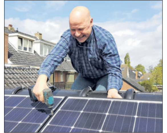
Zonnepanelen monteren in Groenekan.