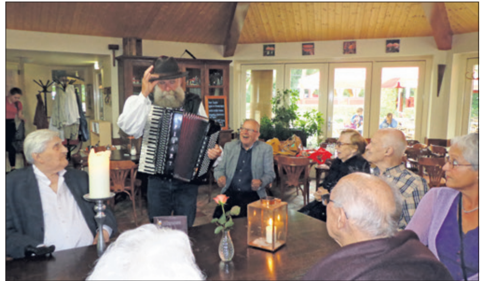
Dikke pret met de troubadour in De Paddenstoel.

Op maandag 21 en dinsdag 22 augustus jl. gingen gasten van 'Beth Shamar' uit Groenekan met de medewerkers twee dagen uit. De reden was tweeledig: een zomeruitje zoals elk jaar, maar in dit geval ook een goede oplossing om de dag elders door te brengen omdat het eigen onderkomen achter de Boskapel in Groenekan een grote verbouwing heeft ondergaan waarbij alle zalen en gangen van het Dagcentrum nieuwe (brandwerende) plafonds kregen.