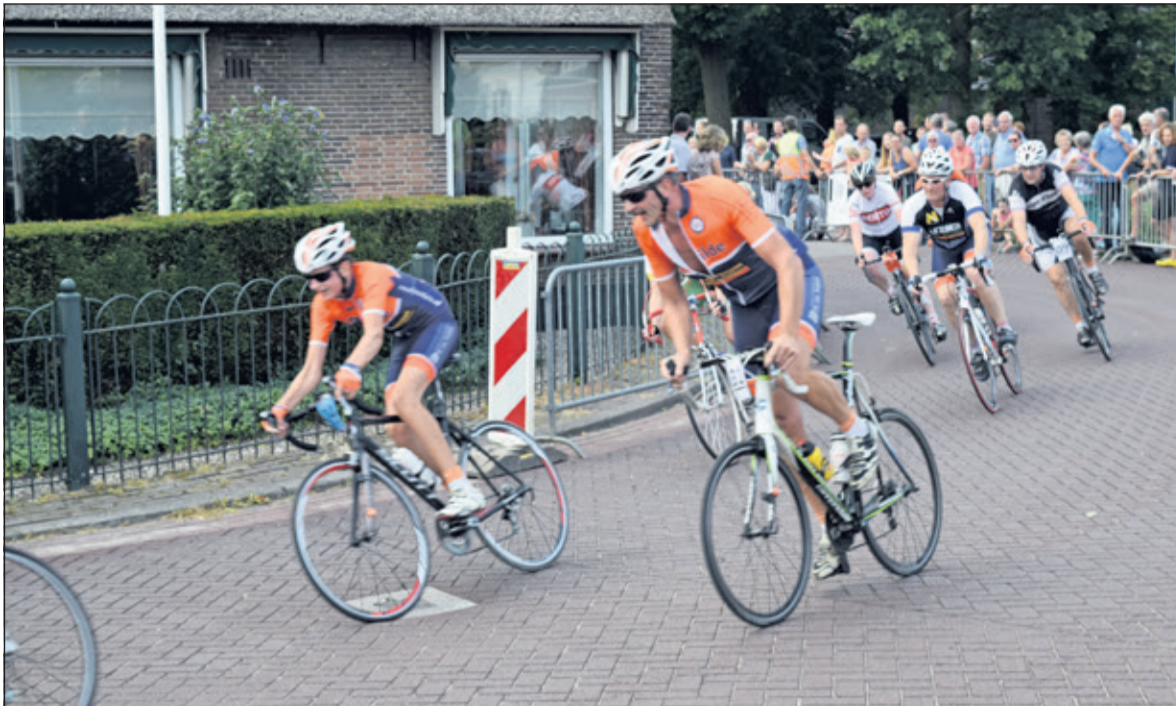
Er worden hoge snelheden gehaald.

Zaterdag 26 augustus klonk voor de achtste keer het startschot voor de Wielerronde van Westbroek. Weer zo'n dag met met een gouden randje. Lekker weer om te fietsen, geen wind, geen regen en veel belangstelling, vanuit de verre omtrek. De opbrengst van dit hele spektakel ging, zoals vanouds, weer naar 'Spieren voor Spieren'.