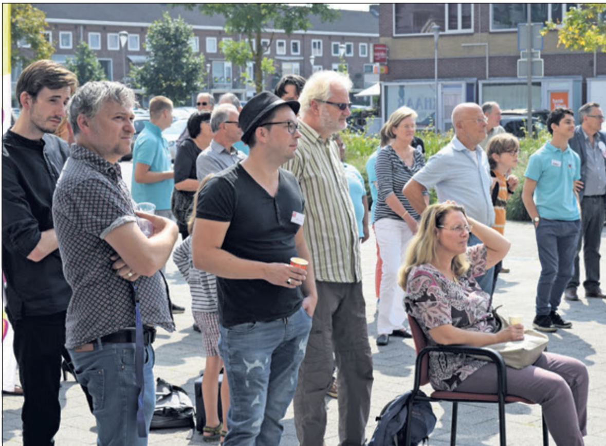
Veel belangstelling voor de Open Dag.

reserveringen, betalingen en kaartcontrole, www.theaterhetlichtruim.nl . Tijdens het Open Huis deden ook alle medegebruikers van de gebouwen mee: Bibliotheek Idea Bilthoven, Reinaerde, Wereldwijs, Kinderopvang De Bilt, De Schaapskooi, Bibliotheek Idea Zeist en vele anderen. Voor meer informatie over het programma van het Kunstenhuis: https://kunstenhuis.nl