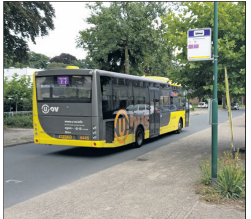
Volgens de dienstregeling één minuut later verlaat lijn 77 de Leijen alweer via de Rembrandtlaan.

'Uit analyse blijkt dat lijn 78 in de avonduren en op zondag gemiddeld door net meer dan één reiziger per rit wordt gebruikt. Het opheffen