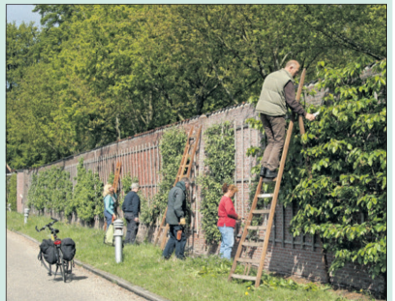
Vrijwilligers leren snoeien op de leermuur.