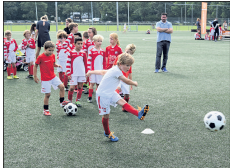
Veel vertier voor de mini's.

van de club. Afhankelijk van de leeftijdsgroep waren de volgende (15) spellen beschikbaar: een Voetbalspringkussen, Quick Speed, Snelheidsmeter, Smartgoals, Mstation, Pannakooi, Voetbalbowling, Gatengoal, Dartvoetbal, Voetbalflipper, Voetvolleybal, Voetbalsjoelen en een Omhaalsimulator. Daarnaast werden nog een panna- en een free-style clinic gegeven.