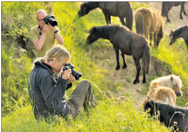
Tijdens de workshop leer je de mooiste natuurfoto's maken. De actie loopt van 21 augustus t/m 10 september 2017.

U oefent met fototechniek, leert kijken en maakt kennis met diverse disciplines in de natuurfotografie. De workshop wordt aangeboden door Utrechts Landschap in samenwerking met Buiten-Beeld, de beeldbank voor natuurfotografie. Er is plek voor maximaal 12 deelnemers. Laat uw gegevens achter op www.utrechtslandschap.nl en maak kans op deze prachtige prijs!