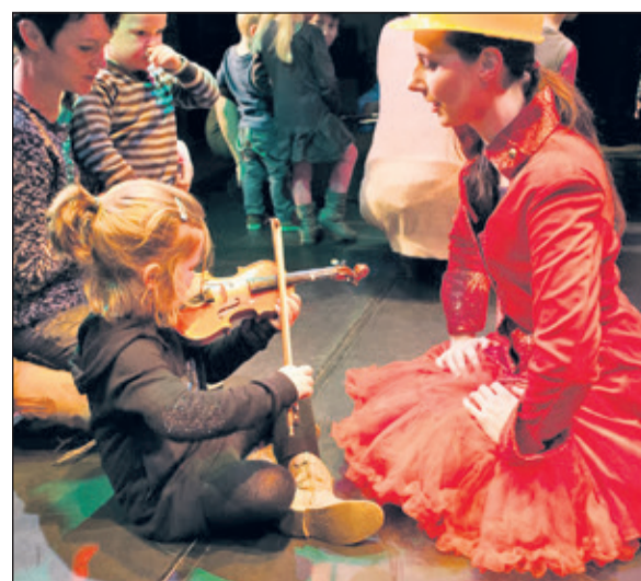
De kinderen worden uitgenodigd om dicht bij de muzikanten en de instrumenten te komen.

'De ontdekking van Oostbroek' op zaterdag 9 september kan via utrechtslandschap.nl . Parkeren is elders geregeld: Op zaterdag 9 september kan er met de auto niet geparkeerd worden op landgoed Oostbroek, meer informatie hierover vindt u op de website.