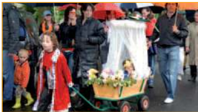
Koninginnedag op 30 april zal in Hollandsche Rading wederom uitlopen op een strijd tussen het noordelijk (Cowboys) en zuidelijk (Indianen) deel van het Dorp. Aan de 3 origineelste deelnemers van de optocht wordt een prijs uitgereikt.