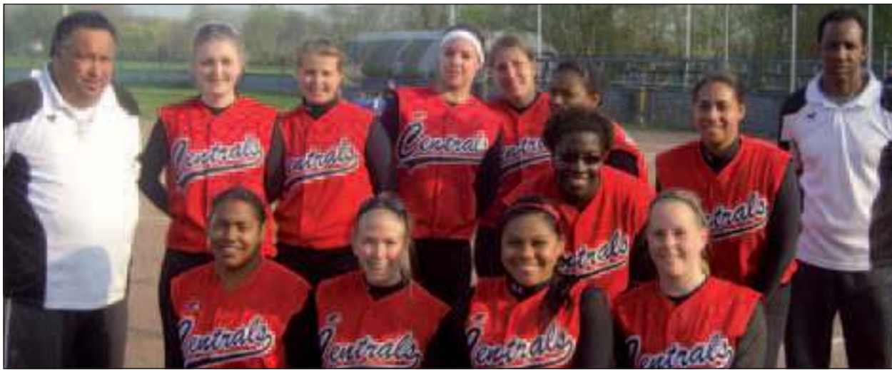
Het kersverse Centrals Dames 1 team met hun coaches.