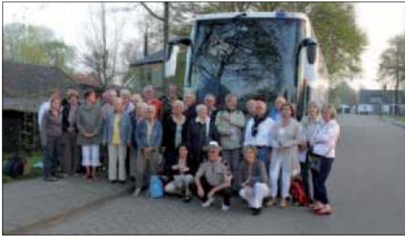
Afgelopen donderdag reisde het gezelschap 's ochtends vroeg af.

Heel even stond AZM in het middelpunt van de wereld, vertegenwoordigd door de Nederlandse en Australische ambassadeur en de Praagse bisschop.