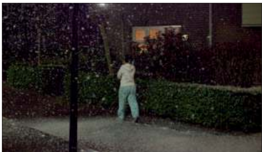
Tijdens de reconstructie werd de Nassauhof in een winterse setting omgetoverd.

gebeuren, en in een reeks reclamespotjes. Hij heeft thuis veel opnames die hij kan laten zien. Toch blijft de vriendelijke man gewoon in dag- en nachtdiensten werken bij de drukkerij van De Telegraaf.