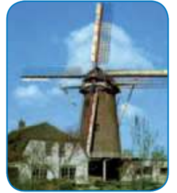
Molen De Geesina in volle glorie. Een prachtige aanwinst voor Groenekan.

Restaureren is één ding maar het draaiend houden van een molen is een essentiële volgende stap. Voor het onderhoud van een molen is ruwweg 10.000 euro per jaar nodig. Deels is dat via een onderhoudssubsidiepot van de het rijk te verkrijgen maar op die pot wordt al veel getrokken en het dekt nooit meer dan 50% van de benodigde gelden. Het is dus zaak als Groenekanse gemeenschap aanvullende middelen te verzamelen. In de Dorpsraad is gesuggereerd een Stichting Vrienden van De Geesina op te zetten waar donaties van particulieren en bedrijven worden ingezameld voor het beheer van de molen. Ook zou er een vrijwilligersclub rond De Geesina moeten worden opgezet die bijvoorbeeld een winkeltje met zelfgemalen producten e.d. gaat runnen. Belangstellende vrijwilligers en potentiële donoren kunnen zich alvast melden bij de secretaris van de Dorpsraad Groenekan, Nicolien Curière: nicoliencuriere@casema.nl .