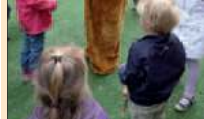
De Paashaas genoot van alle belangstelling.

Zaterdag 16 april was het een bonte verzameling van kinderen en ouders bij Kinderdagverblijf De Bosuiltjes. De leden van de oudercommissie organiseerden ook dit jaar weer het Paaseieren zoeken. Terwijl de Paashaas rond huppelde in de mooie Bostuin zocht klein en groot naar de kleurige eitjes. Natuurlijk was er ook koffie en thee voor de ouders en sap voor de kinderen. Sonja had gelukkig hulp van een paar creatieve peuters, want de kinderen stonden in de rij om geschminkt te worden. Er werden mooie tekeningen gekleurd, waarvan ter plaatse een placemat gemaakt kon worden. Kinderdagverblijf De Bosuiltjes is één van de vestigingen van Kinderopvang De Bilt en gelegen op het terrein van Berg en Bosch.