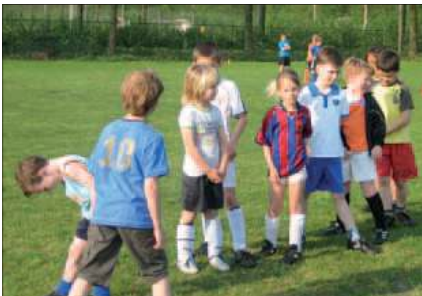
Afgelopen zaterdag hield SVM intern een Paastournooi met de allerjongsten. Op de velden speelden de kabouters en de F-jes in gemengde samenstelling lekker met de bal. Doeltje trappen, hindernisjes nemen en nog veel meer door jongetjes en meisjes, terwijl de vele ouders met plezier de verrichtingen bekeken.

Donderdag 28 april spelen de groepen 3, 4 en 5 en vrijdag 29 april spelen de groepen 6, 7 en 8. Er wordt met gemengde teams gespeeld die door de schoolleiding zijn samengesteld. Op beide dagen is de start om 13.00 uur.