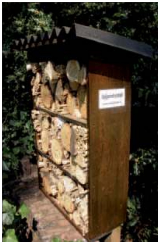
Het bijenhotel van de actiegroep De Bij en Wij

Dat klinkt indrukwekkender dan het in de praktijk meestal is. Zet warm - en koud stromend water en een boxspringmatras uit uw hoofd want vaak blijkt een eenvoudige basisvoorziening in de vorm van een verzameling gaatjes in een blok hout of een bundel rietjes