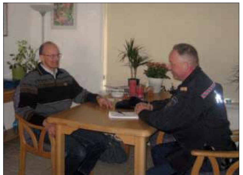
Het verhoor van de verdachte door de wijkagent.

Bij aankomst zien we hoe de sneeuwmachine het huis onderspuit terwijl de leden van het team buiten en binnen geconcentreerd de scènes overleggen. In de woonkamer zitten twee acteurs, de wijkagent en de verdachte, tegenover elkaar aan tafel voor verhoor. We mogen de plot niet verklappen dus praten we nog even na met Gerrit Floor die vertelt dat dit de tweede keer is dat opnamen voor Peter R. de Vries bij hem thuis worden gemaakt. Toen had hij een hoofdrol als arts. Nu kijkt hij toe. Gerrit begon 15 jaar geleden als figurant en acteur via castingbureaus. Hij staat bij 5 bureaus