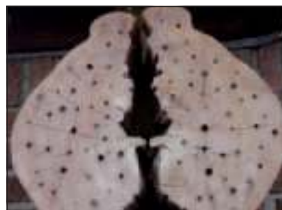
Een eenvoudige Bed and Breakfast voor uw eigen tuin.

De actiegroep De Bij en Wij ( www.debijenwij.nl ) heeft kortgeleden een flink bijenhotel ingericht bij de brug naar de Kastanjelaan in Groenekan. Een megagroot bijenhotel kan men verder vinden in de botanische tuinen van de Universiteit van Utrecht op de Uithof. Gelukkig kan men in particuliere tuinen prima volstaan met een eenvoudig soort Bed and Breakfast-voorziening. Zie voor meer informatie over belang, werking en constructie van bijenhôtels en B&B-voorzieningen verder de website www.bijenhôtels.nl .