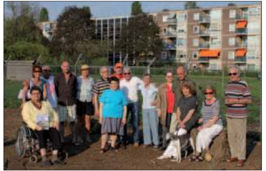
Bewoners van de Grote- en de Kleine Beer, alsmede van de Planetenbaan op het gedeelte, waar volgens de bewoners een ware kaalslag heeft plaatsgevonden. In ieder geval kijkt iedereen nu op 'niets' meer uit.

Daarnaast kunnen belangstellenden veel informatie en nieuws vinden op www.melkwegdebilt.nl en ontvangen omwonenden een aantal keer per jaar een nieuwsbrief. Met ingang