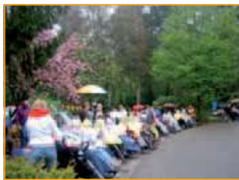
Bewoners van verpleeghuis Sint Elisabeth hopen dit jaar op beter weer zodat ze volop van de optocht kunnen genieten.

Voor het gebruik maken van de kinderspelen kunt u voor €2,50 een activiteitenkaart (voor 10 spelletjes) kopen. Bij inlevering van deze (volle) kaart krijgt ieder kind een ijsje en een gratis grabbel in de grabbelton voor een leuk cadeautje!