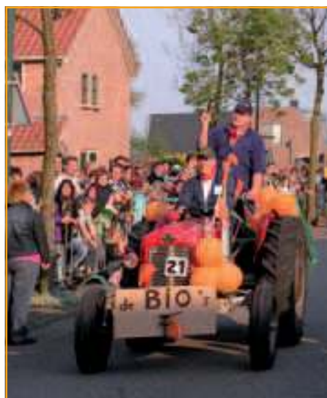
In Westbroek beginnen de festiviteiten zoals gebruikelijk op donderdag met ringrijden.