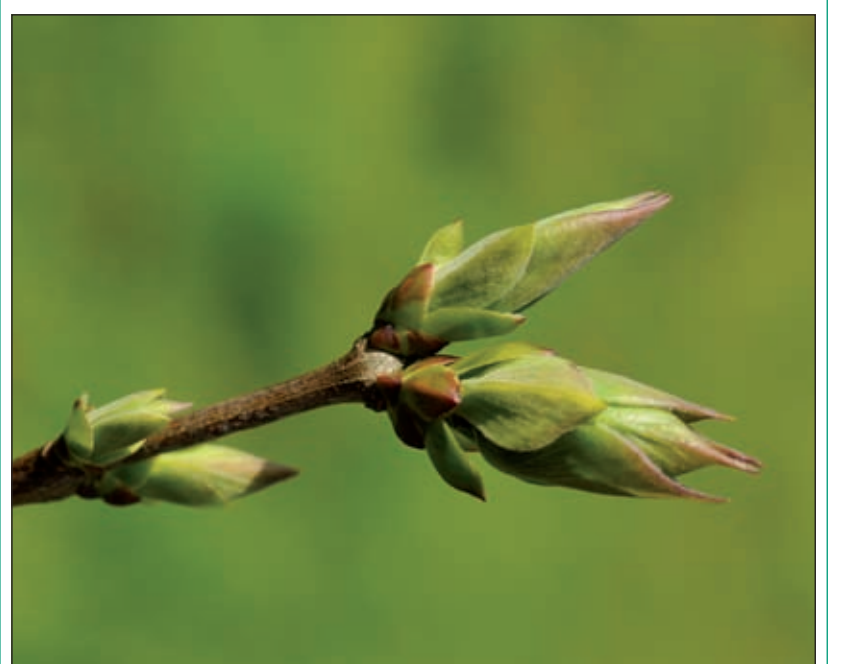
Een siring loopt weer uit, de natuur ontwaakt.

telde Matla dat de leden van het koor als vrijetijdsbesteding zingen hebben en dat ze met deze uitvoering van de Johannes Passion anderen willen laten zien hoe zij genieten van hun hobby. Daarin zijn ze geslaagd: zowel de leden van het koor als het publiek konden met een heel goed gevoel naar huis.