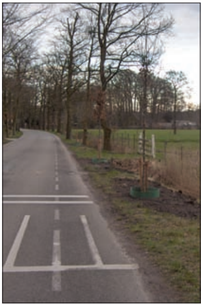
Om het laan/straatbeeld van de Dorpsweg in Maartensdijk gecontinueerd te houden is ook hier tot herplant overgegaan.

Het boombeheerplan vertaalt het vastgestelde beleid naar concrete uitvoeringsmaatregelen, zoals onder meer de frequentie van boomcontrole en snoei, welke snoeimaatregelen wanneer worden uitgevoerd, hoe met overlast wordt omgegaan en wanneer tot herplant wordt overgegaan. Het plan is gericht op een duurzaam en pragmatisch beheer van het gemeentelijke bomenbestand, waardoor het boombeheerplan een praktische en bruikbare leidraad voor de uitvoering van het boombeheer is.