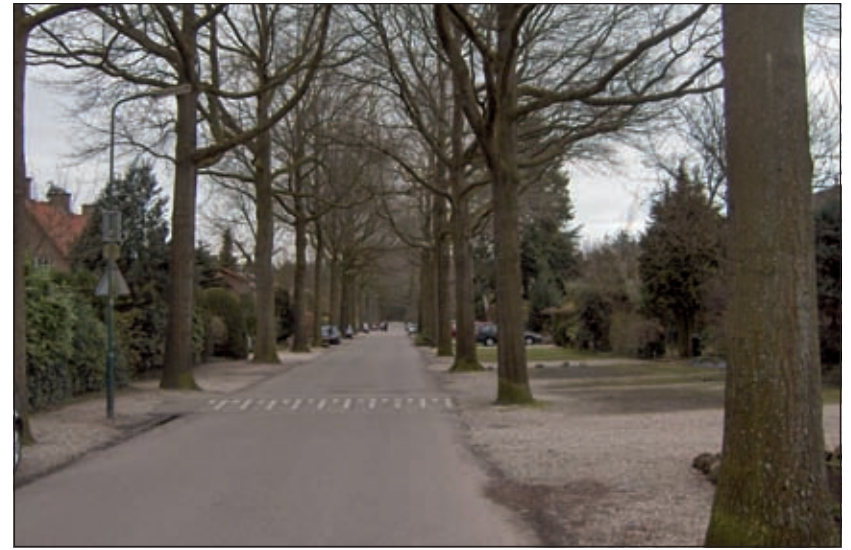
De bomenrijen aan beide zijden van de Denenlaan in Hollandsche Rading maken deel uit van de 8 bomen in De Bilt, die geplant moeten zijn in de periode 9 - 10

Wat opvalt, is dat 28% van de bomen ouder is dan 50 jaar. Dit bevestigt het beeld dat de gemeente De Bilt relatief veel oude bomen heeft, met een hoge gemiddelde leeftijd. Daarnaast valt het hoge percentage van bomen in de leeftijd 20-30 jaar op. In het plan wordt zeer gedetailleerd ingegaan op plantjaren, diameter-, hoogte- en standplaatsverdeling. Wat betreft de