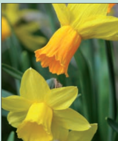
De narcissen bloeien volop.

Voor het aanvragen van een uittreksel uit het bevolkingsregister en voor meldingen die verband houden met de gemeentelijke basisadministratie geldt als voorwaarde dat iemand inwoner van de gemeente De Bilt is.