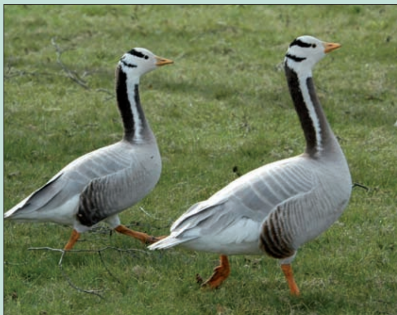
De ganzen langs de Kon. Wilhelminaweg in Groenekan lijken zich op te maken voor een vrolijke lente.

Het begint er nu echt op te lijken. Na ons werk kunnen we weer genieten van de namiddag zon. We gaan met zijn allen op weg naar de zomer, het is echt lente. Hier en elders in de krant treft een impressie aan. [AvZ]