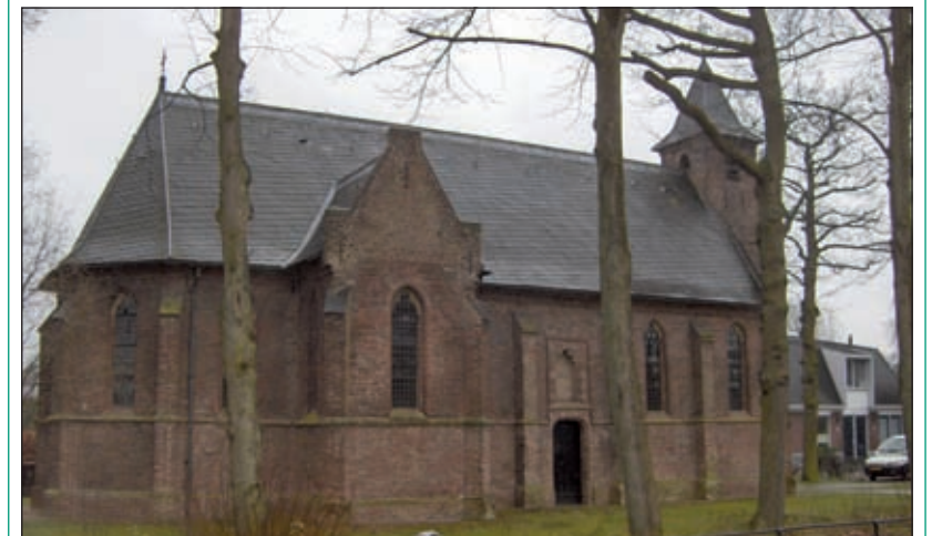
Het monumentale kerkje uit 1451 vormt het hart van de gelijknamige woonkern, fort Blauwkapel.

Blauwkapel heeft een interessante geschiedenis. Op verzoek is de kerk te bezichtigen of wordt tegen een kleine vergoeding een presentatie verzorgd over de historie van kerk en woonkern Blauwkapel. Zie voor verdere info: www.onderwegkerkblauwkapel.nl of e-mail: bcvanhoeflaken@hotmail.com [HvdB].