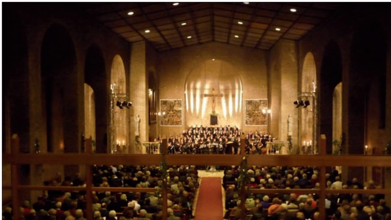
Het Algemeen Zangkoor Maartensdijk verzorgde vrijdag 27 maart in een nagenoeg volle H. Michaëlkerk in De Bilt een sfeervolle Johannes Passion.

De resultaten van de enquête binnenkort in een volgende Vierklank worden gepubliceerd.