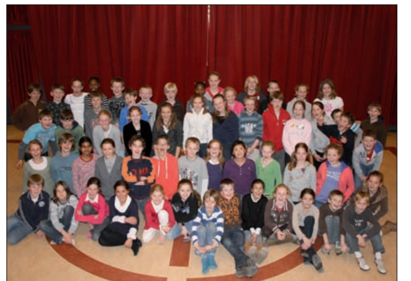
De groepen 7 van de Julianaschool uit Bilthoven vertegenwoordigen de gemeente De Bilt in het project School Voices.

Op woensdag 22 april a.s. vertegenwoordigen de groepen 7 van de Julianaschool uit Bilthoven de gemeente De Bilt op het podium van Vredenburg Leidsche Rijn in het project School Voices. De Julianaschool is naast de Maartensdijkse Martin Luther Kingschool een van de deelnemende scholen in het scholensamenwerkingsverband Delta in De Bilt. Totaal 900 leerlingen strijden binnen de provincie Utrecht in dit Festival Europa Cantat, dat vooruitloopt op het grootste internationale zangfestival deze zomer in Utrecht, waarvoor al ruim 2500 (jonge) zangers over de gehele wereld zich als deelnemer hebben aangemeld. [HvdB]