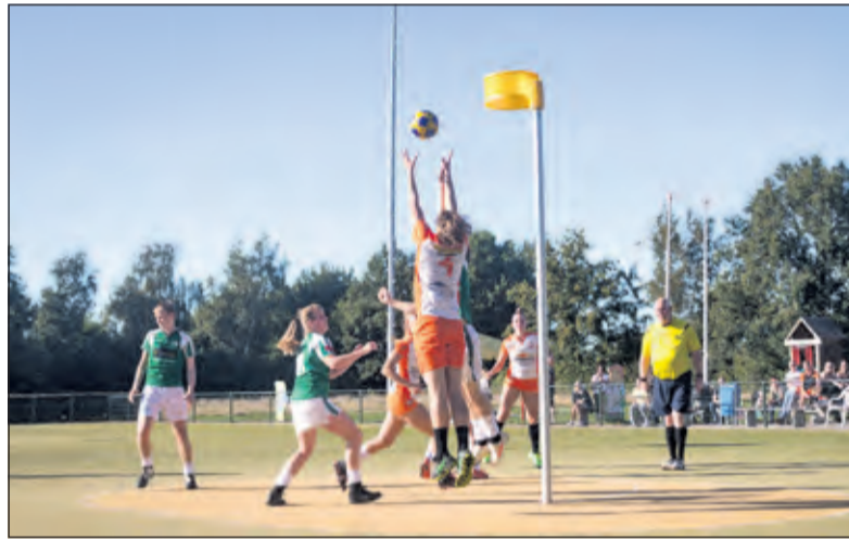
TZ houdt verdedigend de druk hoog op ASVD.

moeten korfballen. Er zit kwaliteit in de ploeg, die door samen hard te werken eruit komt. Aanstaaende zaterdag komt DOS (Westbroek) om 16.00 uur naar Maartensdijk afgeleid. (Reinier Enschedé)