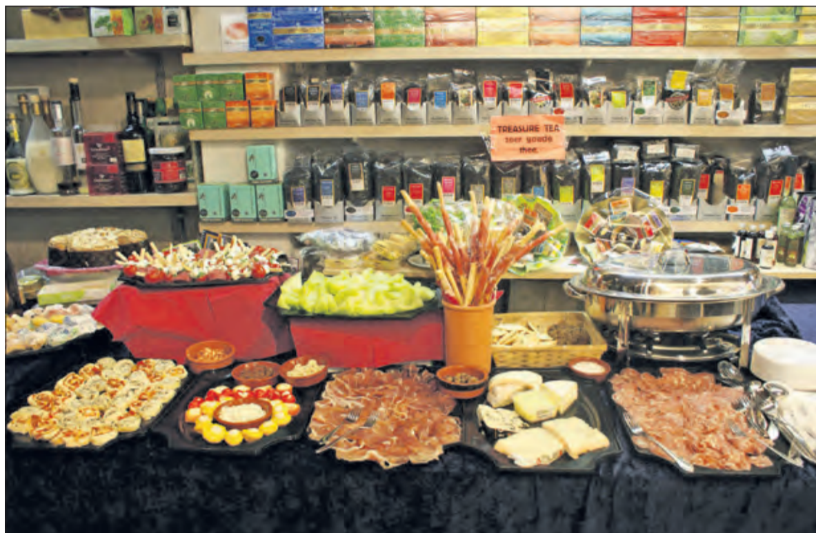
Bij Ploeger valt er allerlei heerlijks te proeven.

Tijdens Proef de Smaak van De Bilt wordt het onder de luifel van Ploeger Delicatessen aan de Hessenweg ongetwijfeld heel gezellig.