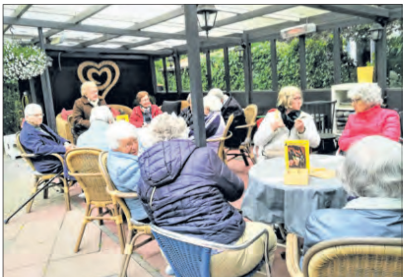
De vrouwen van nu op bezoek bij de Bilthovense Midgetgolfbaan.