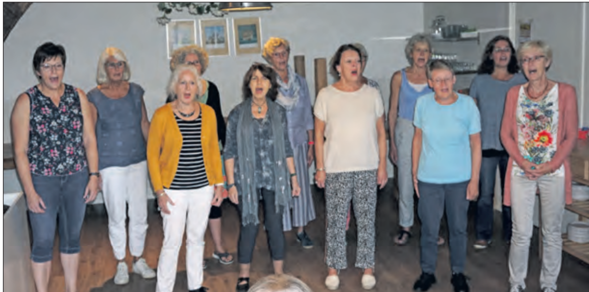
‘Ludi Cantare’ betekent ‘zingen met speelse ondertoon’ oftewel ‘lekker zingen’.

Op 15 december sluit vrouwenkoor Ludi Cantare haar jubileumjaar af met een winterconcert in de Centrumkerk aan de Julianalaan te Bilthoven. Meer informatie op www.ludicantare.nl en op de Facebookpagina. Ook zin om lekker te zingen? Ga dan gerust eens kijken. Ludi Cantare repeteert op woensdagavonden in Het Lichtruim. Contact loopt via voorzitter@ludicantare.nl . (Ellemieke de Wolf)