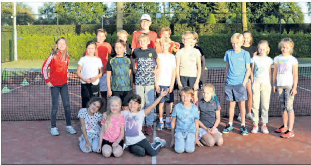
Jeugdspelers uit 8 tennisverenigingen vinden elkaar op de velden van Tautenburg.