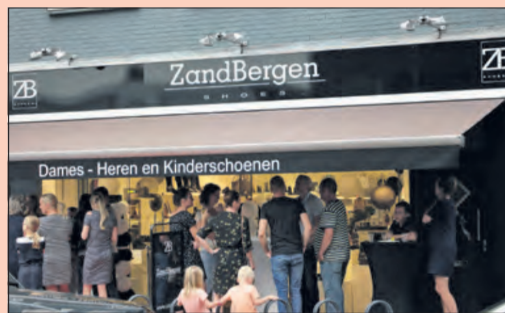
Grote drukte bij de opening van Zandbergen 2 jaar geleden.

Zandbergen speelt ludiek in op het thema. Zaterdag 5 oktober zijn er hapjes en drankjes in de winkel te vinden en voor de snoepiefhebbers zijn er naast de gebruikelijke snoeptomaatjes en stukjes komkommer eetbare schoenveters te vinden. Voor de klanten is er bij vertrek een toepasselijk aardigheidje.