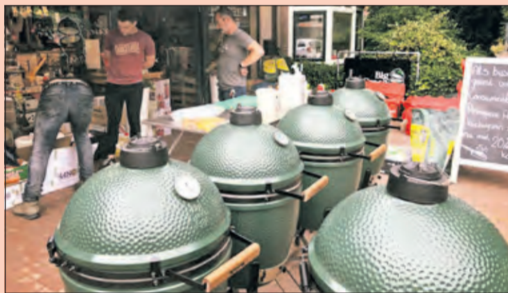
Kooklust heeft een uitgebreid assortiment Green Egg's.

Er staat in ieder geval een demonstratie met de Green Egg op het programma, de gebruiksgemakken van de slowjuicer krijgen aandacht. Verder kan je kennis maken met de slowcooker, het veilige alternatief voor het ouderwetse petroleumstelletje of römertopf. 's Ochtends de ingrediënten erin en 's avonds heb je een heerlijke maaltijd die gedurende de dag heerlijk gegaard is. Uiteraard zijn er ook volop receptideeën te vinden bij Kooklust. De hele dag door zijn er lekkere hapjes en drankjes te proeven en is er aandacht voor zoete bakproducten en vers gezette thee. Kortom een inspiratiebron voor keukenprinsen en prinsessen en iedereen die van lekker eten houdt.