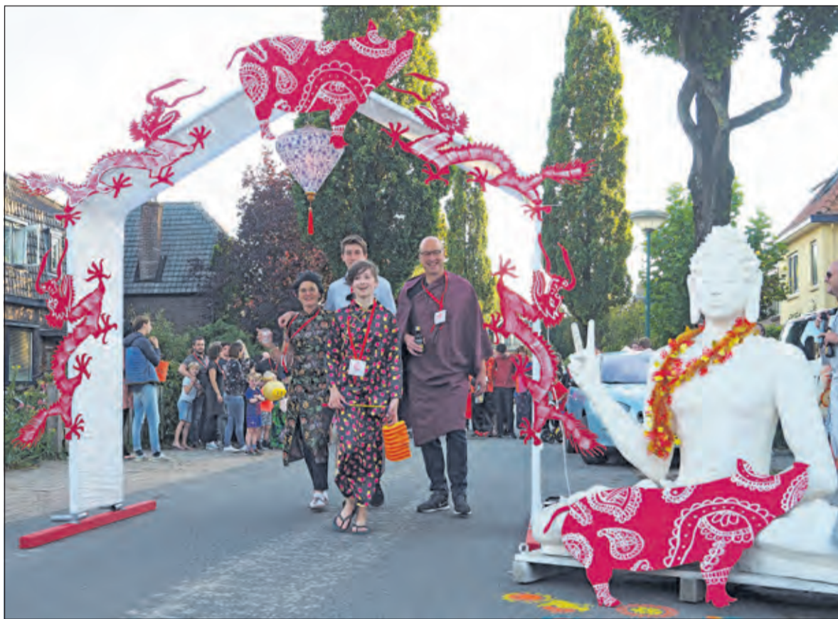
Toepasselijke kleding bij de entree van het feest.