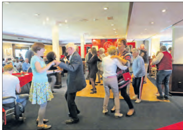
De dansvloer is steeds goed gevuld.