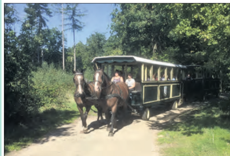
Zonnebloemgasten trekken met de paardentram door het Leersumse Veld.