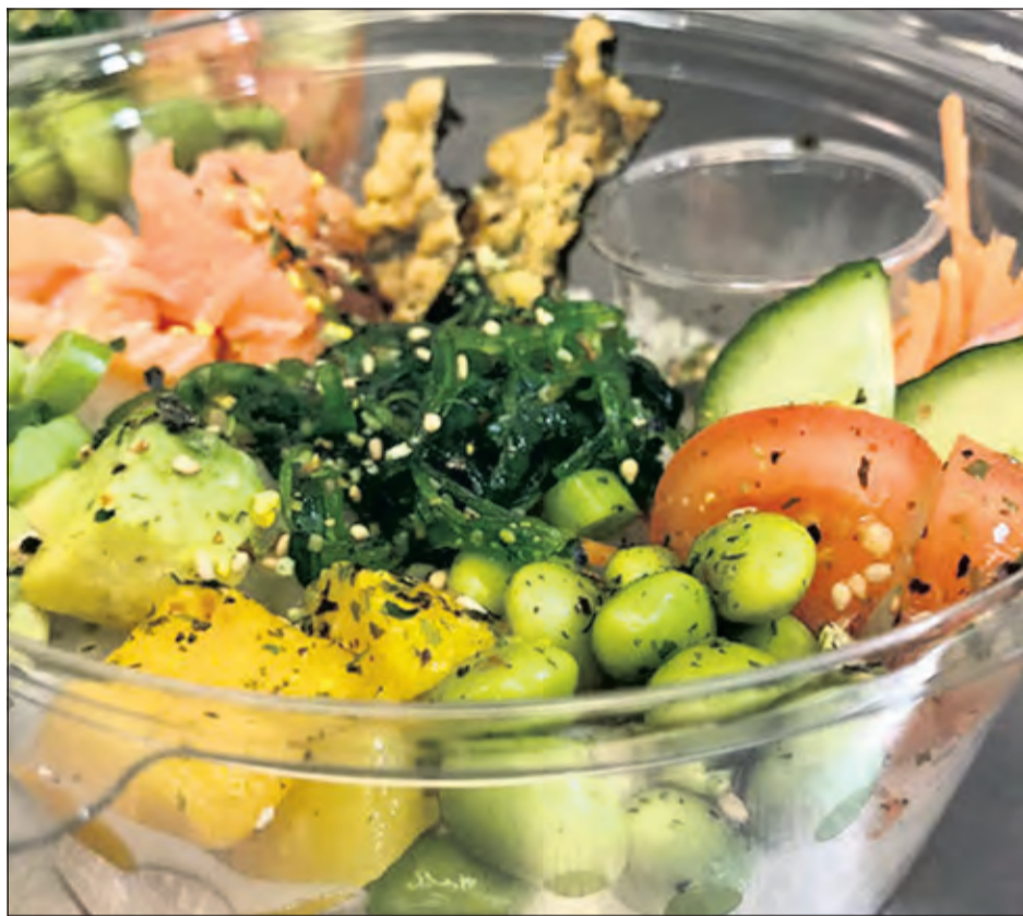
De Poké bowl met rijst, groente en tonijn of zalm is een van de toppers uit de winkel.