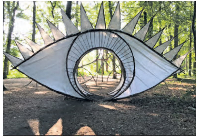
Vuurool met het oog op 2020.

Parkeren op Dagrecreatieterrein Drakenstein, Werkruimte Stulpsewaan 1 Lage Vuursche, info@vuurool.nl tel. 06 23053585.