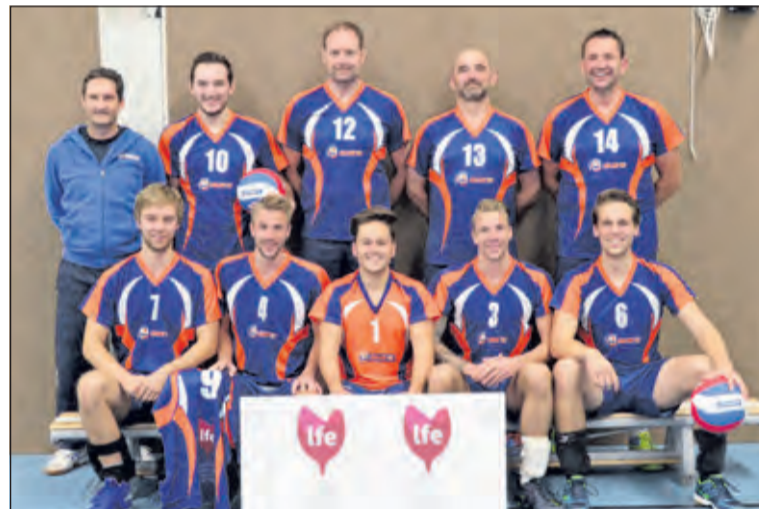
Wijngruothandel LFE in Maartensdijk heeft zich voor vier jaar verbonden als shirtsponsor van het 1e herenteam van volleybalvereniging Salvo '67 uit Maartensdijk. Het team poseert trots in de nieuwe shirts.