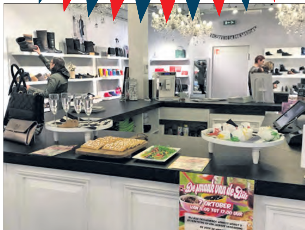
Winkeliers op de Hessenweg-Looydijk pakken weer lekker uit op zaterdag 5 oktober.