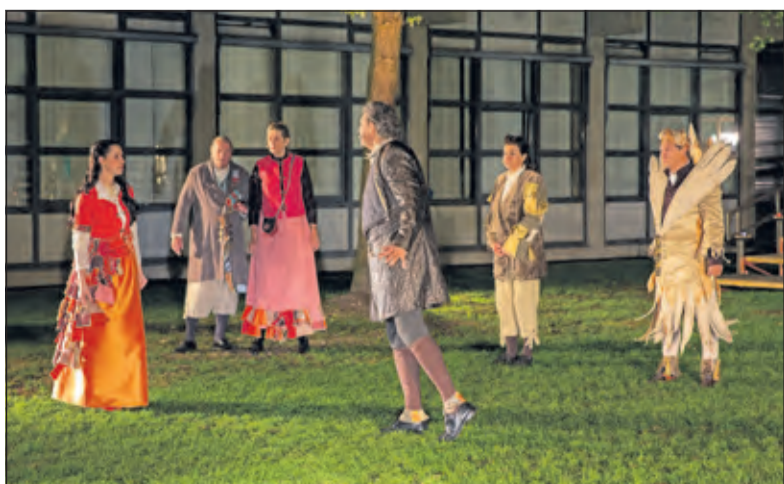
Succesvolle voorstelling van 'Mariecken uit Nijmegen' op (Utrecht Science Park Bilthoven (USPB).

Een metafoer misschien voor deze excellente voorstelling: massaliteit leidt tot verwijdering van het origineel, tot het onthechten van de mens van zijn diepste gevoelens, en uiteindelijk tot de ondergang van onze beschaving. Want, zo vervolgt Prediker: 'in veel wijsheid is veel verdriet'. Een mogelijke uitweg biedt ons misschien de apostel Paulus, waar hij zegt: 'Ons resten geloof, hoop en liefde, deze drie, maar de grootste daarvan is de liefde'. (Peter Schlamilch)