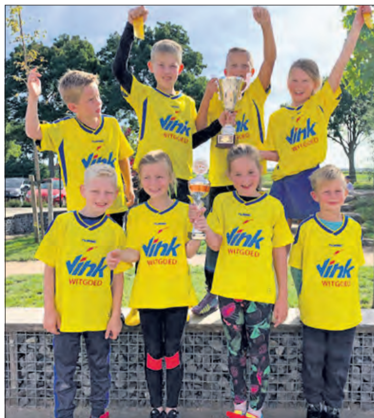
De winnaar van de wisselbeker voor groepen 5 en 6 is 't Kompas (Westbroek) geworden. (zie foto). De wisselbeker voor groep 7 en 8 is ook overververd door 't Kompas.

Korfbalclub Tweemaal Zes in Maartensdijk organiseerde het Jumbo Jelle Farenhorst Schoolkorfbaltoernooi: een jaarlijks terugkerend evenement dat al vrijwel vanaf de oprichting van de vereniging (1968) op de kalender staat. Het volledige programma is onder schooltijd zodat alle kinderen in plaats van een lesdag een heerlijke dag sporten hebben.