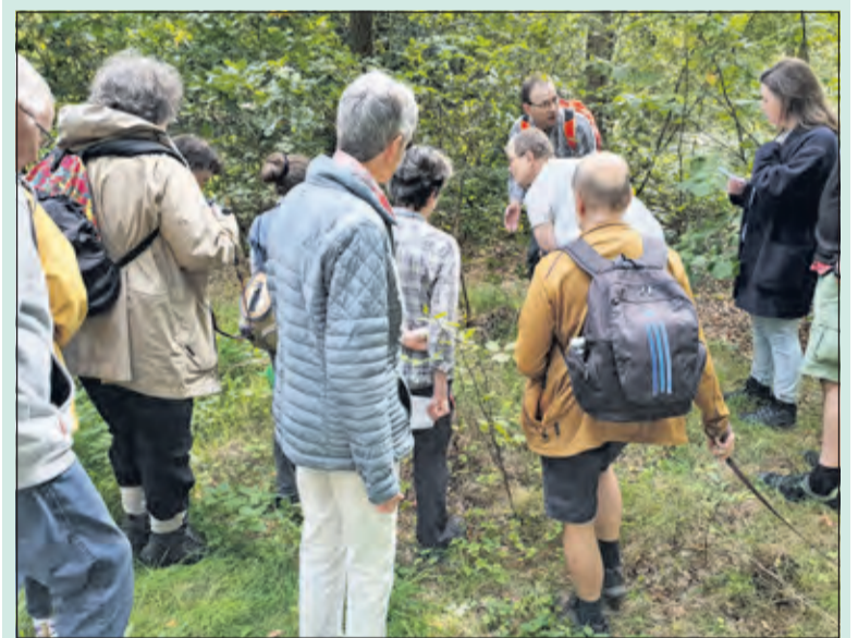
De vele belangstellenden wordt verteld over het ontstaan en de functie van paddenstoelen en hoe de verschillende soorten te herkennen.

Paddenstoelen zijn er het hele jaar door, maar de piek ligt toch duidelijk in de herfst. Wanneer en in welke aantallen ze precies boven de grond komen, hangt af van temperatuur en vochtigheid. Vorig jaar was het voor de paddenstoelen door de droge zomer een slecht jaar. Deze zomer was ook warm, maar gelukkig wel natter. Het IVN De Bilt verzorgde een paddenstoelenwandeling op zondag 22 september in het Ridderoordse Bos. [WE]