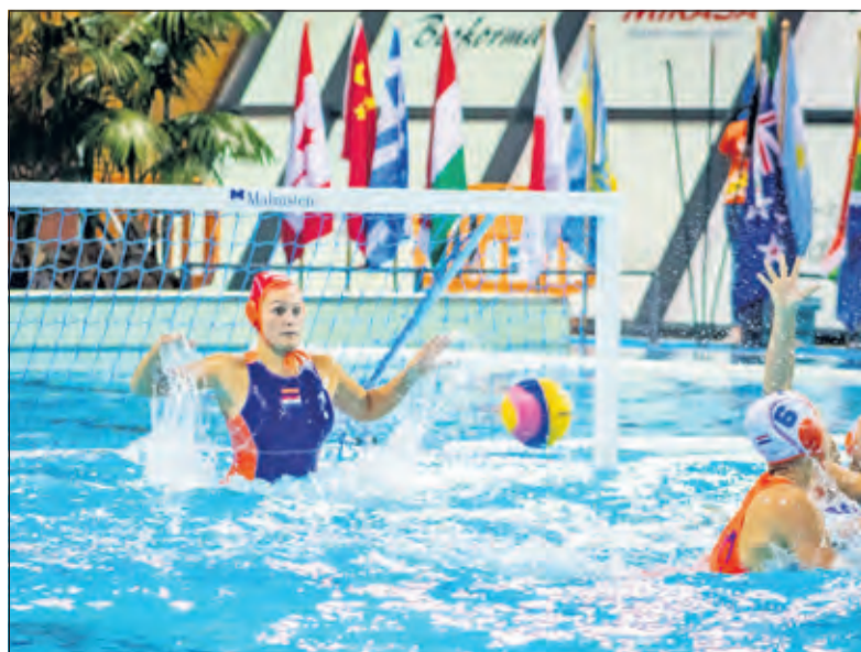
De doelvrouw heeft het zwaar in de finale tegen Rusland.

te komen. Met toch een prachtige zilveren plak tot gevolg.