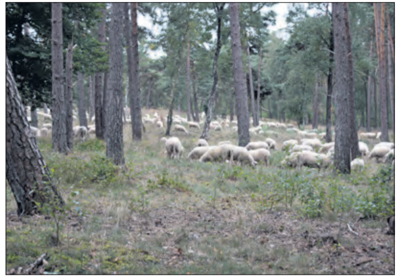
Midden vorige week graasde voor het eerst sinds 80 jaar weer een schaapskudde op de Heijntjeskamp.

Vanaf het vroege voorjaar gaat de kudde schapen, samen met herder en honden, op pad en begrazen zij natuurgebieden van het Utrechts Landschap. Sinds 2012 grazen zij in gebieden aan de zuidkant van de